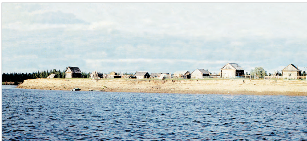
Рис. 289. Возможно, ПРЭО 1984 г. (манси). Селение. Место съёмки не определено. ОРКП. Ф. 26. Оп. 10. Д. 7. № 42: цветной малоформатный слайд (кадр 10) 675

№ 43. [Заброшенные деревянные дома] . 2 фотовида: 2 цветных малоформатных слайда (№ 5–6, 8; рис. 290, 291).