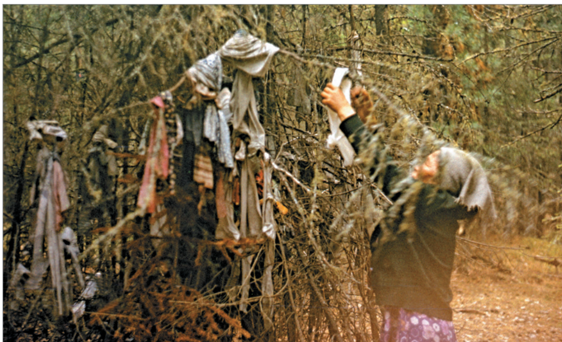
Рис. 243. ПРЭО 1984 г. (манси). Культовое место Эква-Пурлахтын-ма у с. Ясунт. Женщина привязывает арсын к ветке дерева. ОРКП. Ф. 26. Оп. 10. Д. 7. № 33: цветной малоформатный слайд (кадр 13–14)