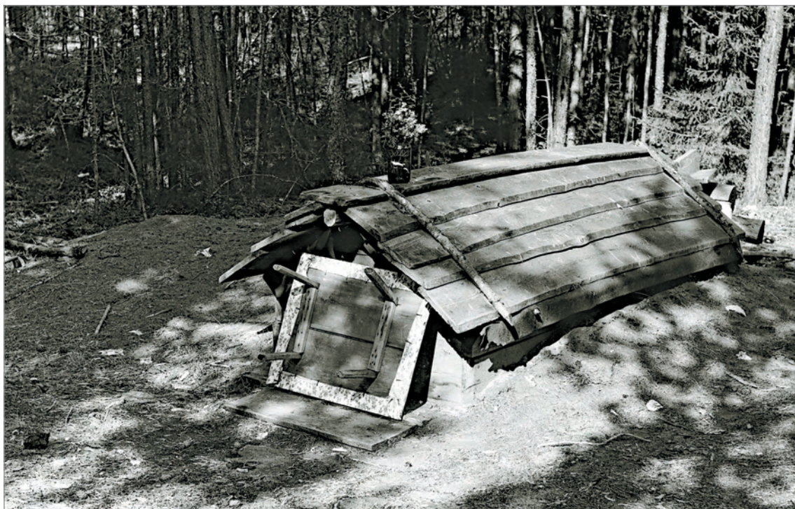
Рис. 233. ПРЭО 1984 г. (манси). Кладбище с. Ясунт. Фотосъёмка А.М. Сагалаева. ОРКП. Ф. 26. Оп. 10. Д. 7. № 32: чёрно-белый малоформатный негатив (кадр 17–18)