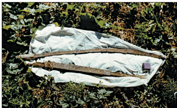
Рис. 272. ПРЭО 1984 г. (манси). Культовое место Ворсик-ойка . Атрибуты из амбарчика: железная сабля с рукоятью из оленьего рога (вверху) и деревянно-жестяные ножны с остатками деревянного ритуального меча. ОРКП. Ф. 26. Оп. 10. Д. 7. № 35: цветной малоформатный слайд (кадр 43–44)