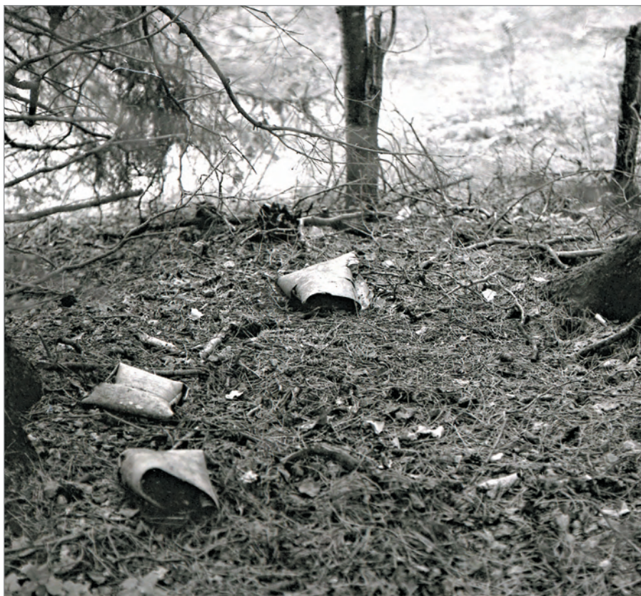
Рис. 244. ПРЭО 1984 г. (манси). Предположительно, культовое место Эква-Пурлахтын-ма у с. Ясунт. Берестяные коробки на земле. ОРКП. Ф. 26. Оп. 10. Д. 7. № 33: чёрно-белый среднеформатный негатив