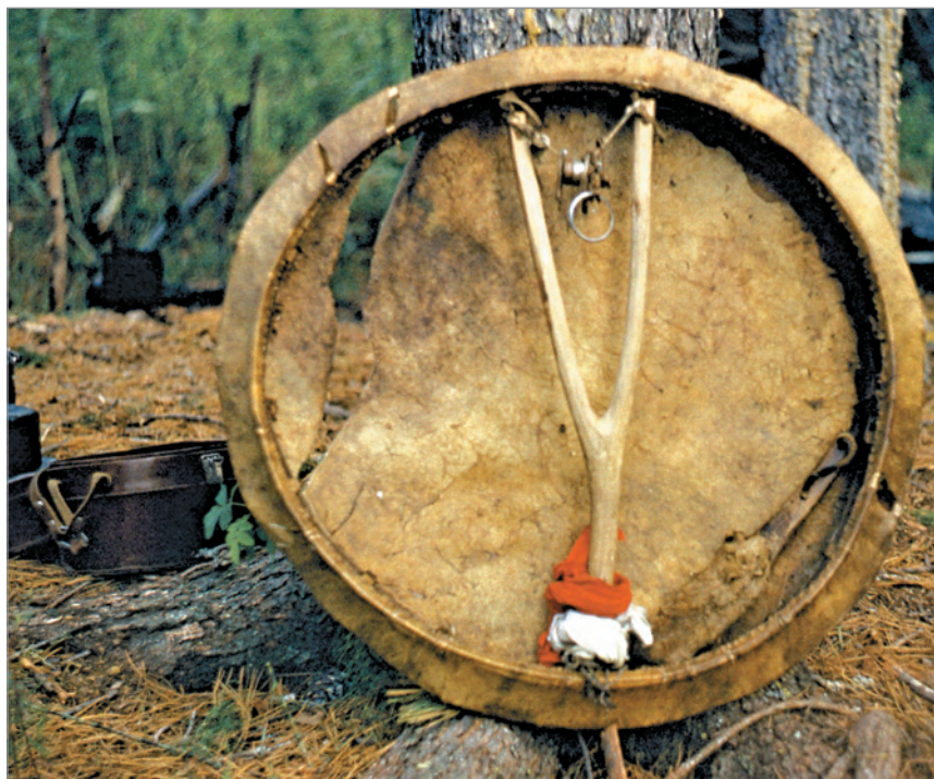
Рис. 279. ПРЭО 1984 г. (манси). Культовое место Ворсик-ойка . Атрибут из амбарчика: тот же бубен (без личин на рукояти) с колотушкой. Фотосъёмка А.М. Сагалаева. ОРКП. Ф. 26. Оп. 10. Д. 7. № 35: цветной малоформатный слайд (кадр 69–70)