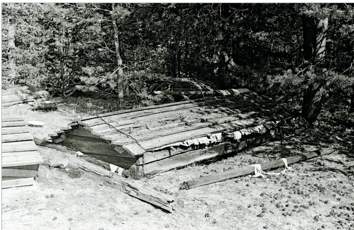
Рис. 234. ПРЭО 1984 г. (манси). Кладбище с. Ясунт. ОРКП. Ф. 26. Оп. 10. Д. 7. № 32: чёрно-белый малоформатный негатив (кадр 23–24)