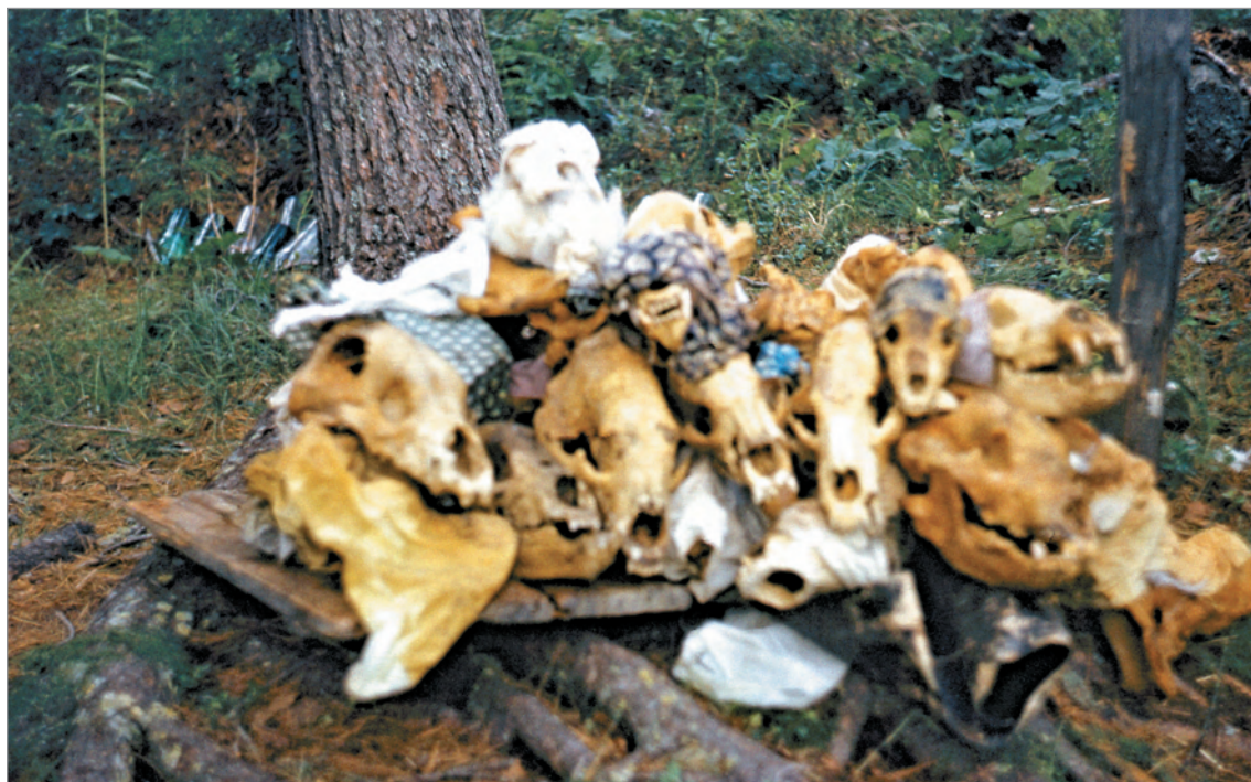
Рис. 280. ПРЭО 1984 г. (манси). Культовое место Ворсик-ойка . Атрибуты из амбарчика: межвежьи черепа. ОРКП. Ф. 26. Оп. 10. Д. 7. № 35: цветной малоформатный слайд (кадр 73–74)