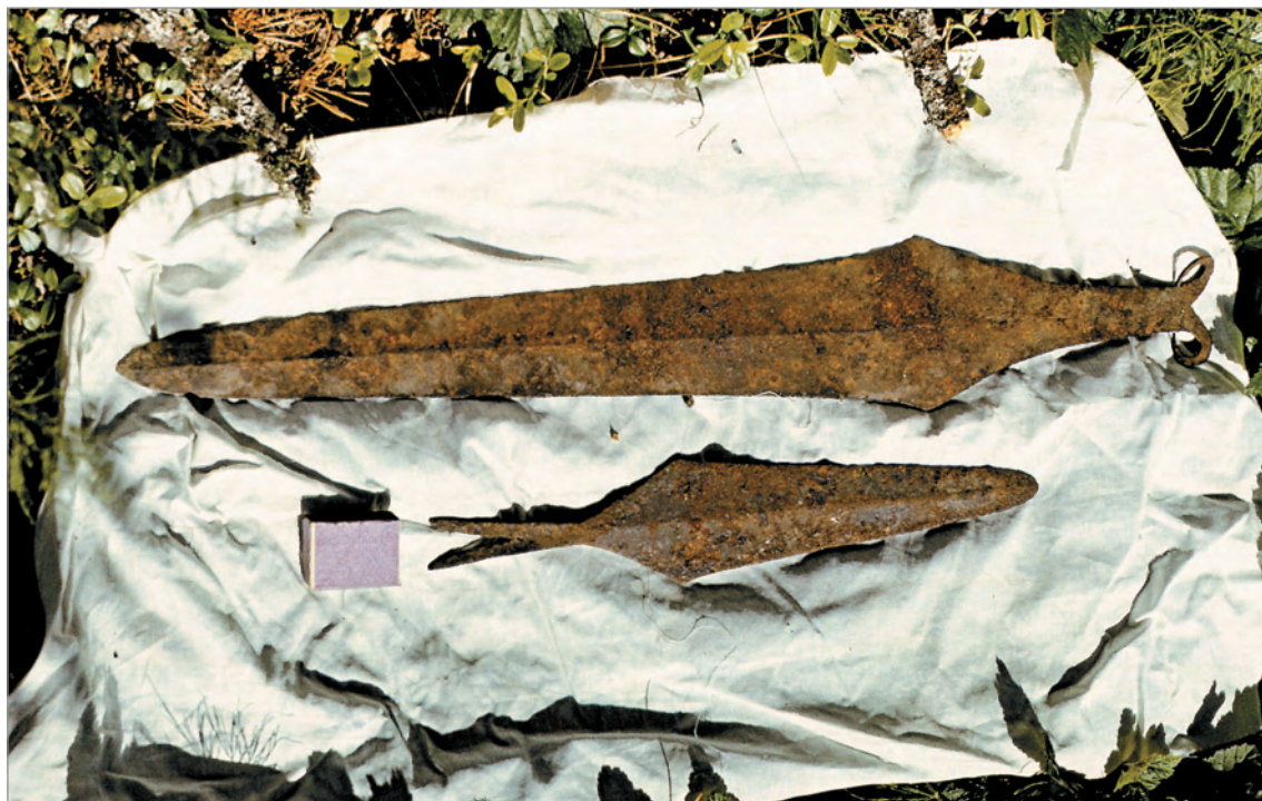
Рис. 271. ПРЭО 1984 г. (манси). Культовое место Ворсик-ойка . Атрибуты из амбарчика: железные меч (вверху) и пальма (?). ОРКП. Ф. 26. Оп. 10. Д. 7. № 35: цветной малоформатный слайд (кадр 41–42)