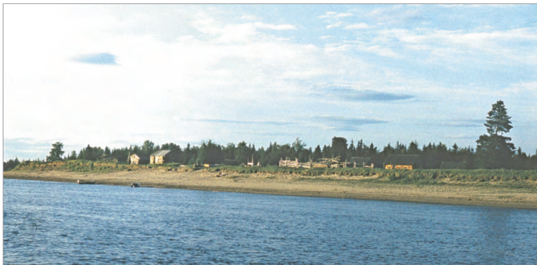
Рис. 287. ПРЭО 1984 г. (манси). Селение. Место съёмки не определено. ОРКП. Ф. 26. Оп. 10. Д. 7. № 42: цветной малоформатный слайд (кадр 31–32)

№ 42. [Селения манси] . 4 фотовида: 4 цветных малоформатных слайда (вероятно, № 10 и точно № 29–32, 49–50). Фотовиды: речной пейзаж; селения; жилая усадьба на берегу реки (рис. 287–289). Смежное расположение на плёнке слайдов № 29–32, 49–50 перед съёмкой посещения святилищ Куль-отыр-ойка (см. документ № 34, кадры № 33–38) и Ворсик-ойка (см. документ № 35, кадры № 51–52 и др.) не исключает, что сфотографировано с. Ясунт.