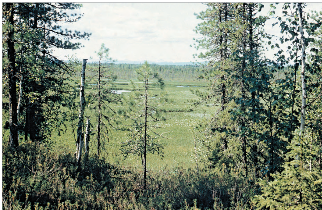
Рис. 259. ПРЭО 1984 г. (манси). Пейзаж на пути к культовому месту Ворсик-ойка 673 (р. Хулга). ОРКП. Ф. 26. Оп. 10. Д. 7. № 35: цветной малоформатный слайд (кадр 51–52)

№ 35. [ Культовое место Ворсик-ойка ]. 39 фотовидов: 33 цветных малоформатных слайда (22 кадра от одной плёнки – № 15–16, 19–34, 37–38, 41–44, 47–62, 69–70, 73–74 и 11 кадров от других плёнок – № 51–54, 56–71, 70–71); 5 среднеформатных слайдов (два – неудовлетворительного качества); 1 чёрно-белая фотография размером 15 x 20 см, неидентичная слайдам. Фотовиды: священный амбарчик и его содержимое; медвежьи черепа из амбарчика; информатор-проводник И.П. Тихонов (идентифицирован по фильму) у амбарчика; фигура Ворсик-ойки 670 с накладкой из куса серебристой металлической фольги и без неё; железные меч с роговидным окончанием рукояти; пальма (?); железная сабля с костяной рукоятью; обитые жёстью деревянные ножны с остатками деревянного меча; стрелы с древками; железный наконечник стрелы; деревянные модели трёх луков; шаманский бубен (без личин на рукояти) 671 с колотушкой; дорога к святилищу и привал путников – И.П. Тихонов и его родственник (?) – мальчик, А.А. Алексеев, И.Н. Гемуев, А.М. Сагалаев, А. Слапиньш; за обедом – проводник и два мальчика; информатор с фетишами; и др. (рис. 259–281). На бумажных рамках шести малоформатных слайдов Сагалаев оставил помету: «ПРЭО-84. Ворсик-ойка». Это святилище бывшего селения Мань-я находится в бассейне р. Хулга: на левом берегу её правого притока р. Мань-я, в 8 км выше устья последней 672 .