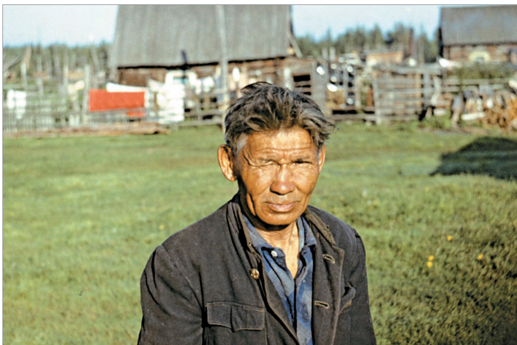
Рис. 292. ПРЭО 1984 г. (манси). Местный житель на фоне усадьбы в неидентифицированном населённом пункте. ОРКП. Ф. 26. Оп. 10. Д. 7. № 45: цветной малоформатный слайд (кдр 75–76)