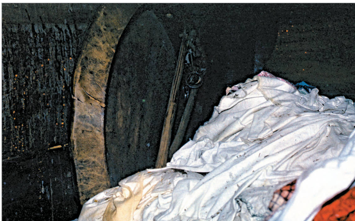
Рис. 266. ПРЭО 1984 г. (манси). Культовое место Ворсик-ойка . Внутренний вид амбарчика: ворох отрезков ткани – приклады. ОРКП. Ф. 26. Оп. 10. Д. 7. № 35: цветной малоформатный слайд (кадр 25–26)