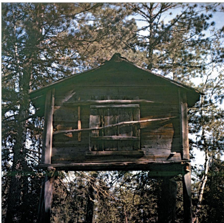
Рис. 263. ПРЭО 1984 г. (манси). Культовое место Ворсик-ойка . Священный амбарчик. ОРКП. Ф. 26. Оп. 10. Д. 7. № 35: цветной среднеформатный слайд