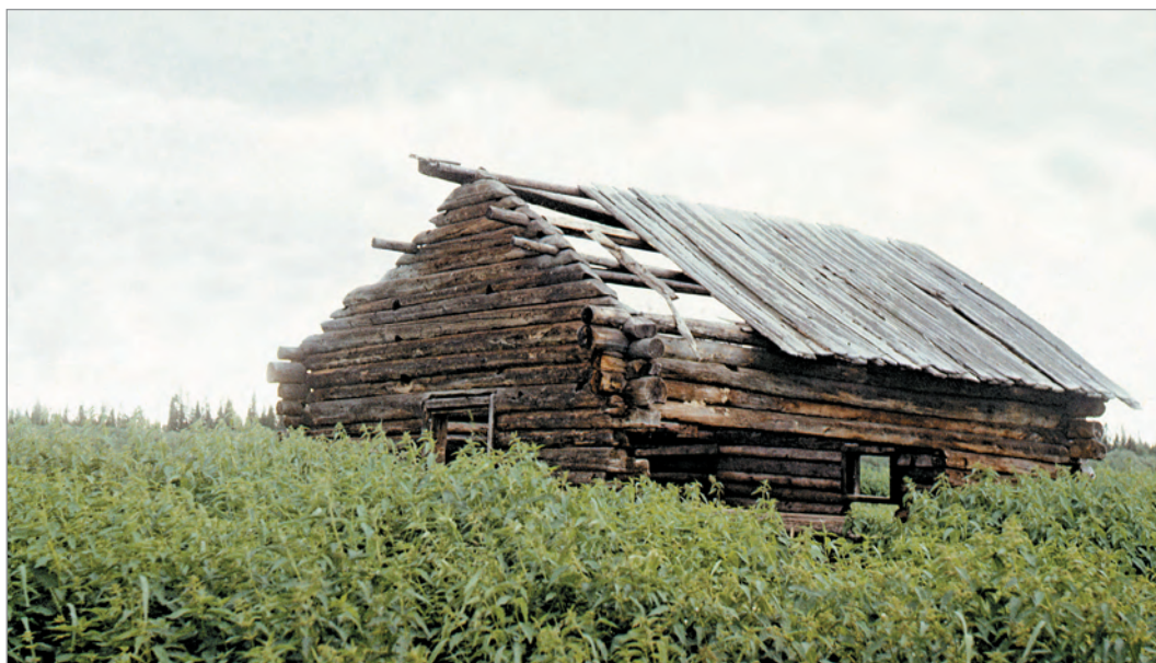
Рис. 290. ПРЭО 1984 г. (манси). Заброшенный дом. Место съёмки не определено. ОРКП. Ф. 26. Оп. 10. Д. 7. № 43: цветной малоформатный слайд (кадр 5–6)

№ 43. [Заброшенные деревянные дома] . 2 фотовида: 2 цветных малоформатных слайда (№ 5–6, 8; рис. 290, 291).