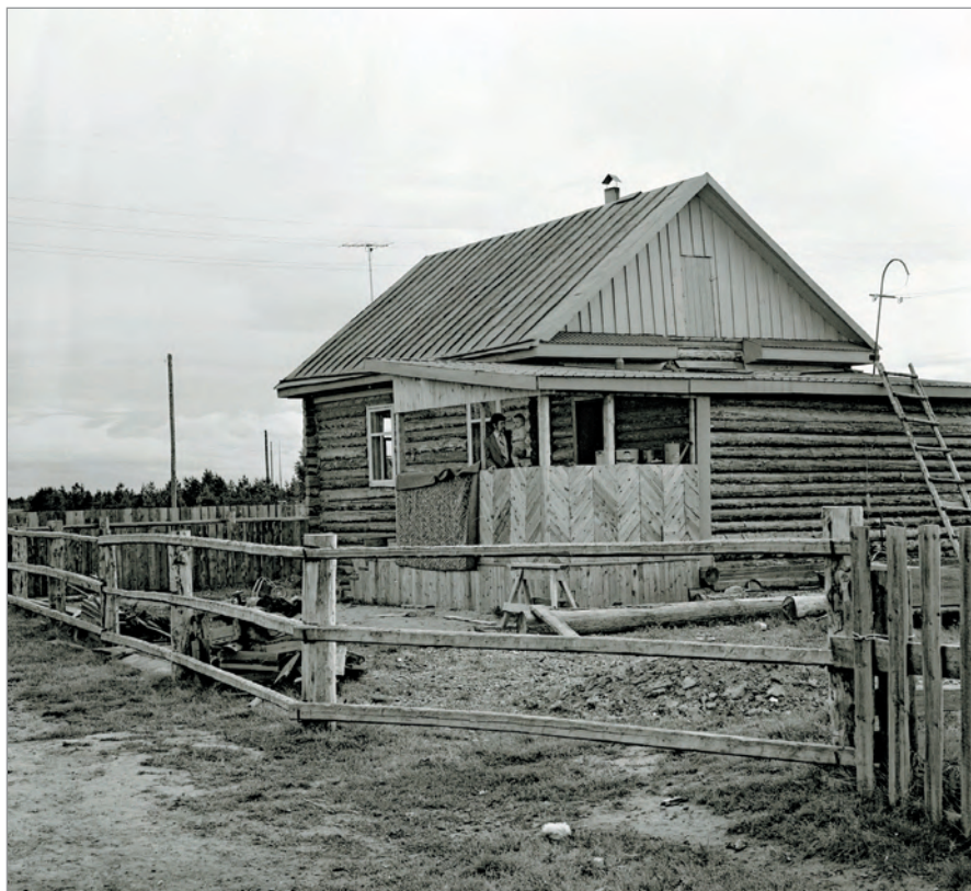
Рис. 293. ПРЭО 1984 г. (манси). Усадьба в неидентифицированном населённом пункте. ОРКП. Ф. 26. Оп. 10. Д. 7. № 45: чёрно-белый среднеформатный негатив