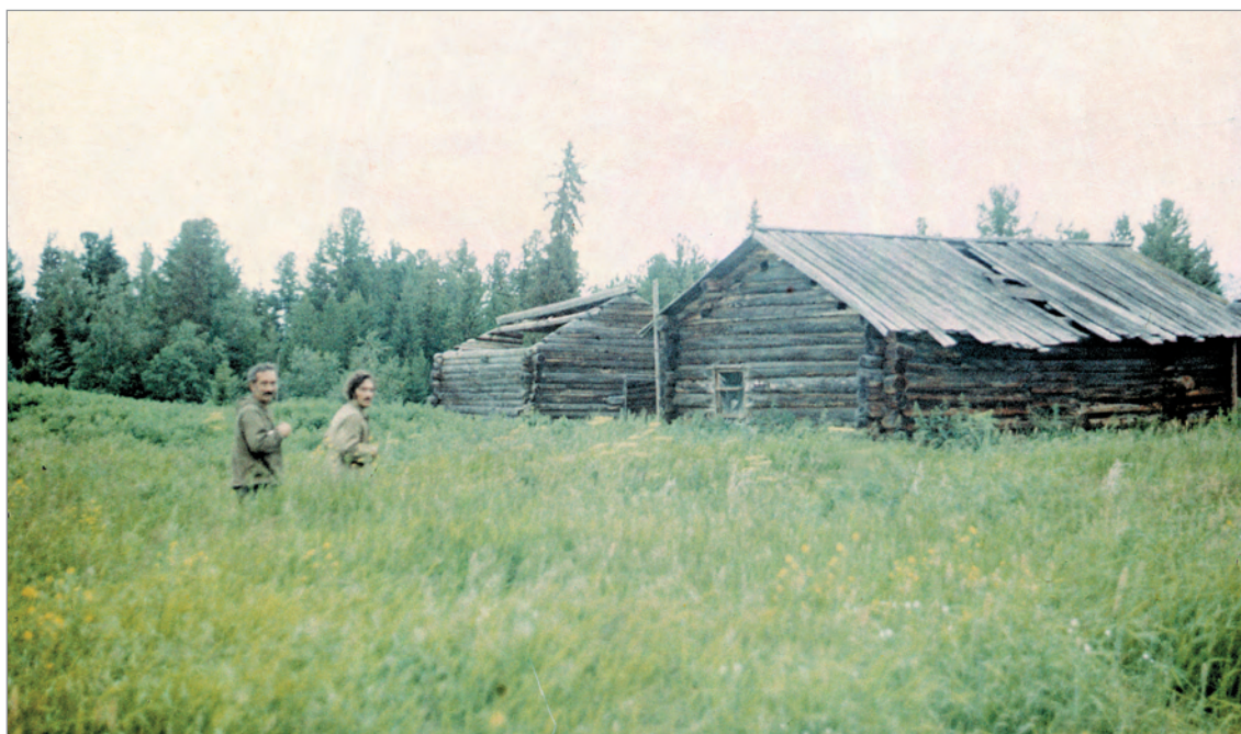
Рис. 291. ПРЭО 1984 г. (манси). Зброшенныя дома, И.Н. Гемуев (слева) и А.М. Сагалаев. Место съёмки не определено. ОРКП. Ф. 26. Оп. 10. Д. 7. № 43: цветной малоформатный слайд (кадр 8)

№ 44. [Табун лошадей] . 2 фотовида: 2 цветных малоформатных слайда (№ 41–44). Возможно, съёмка на р. Ляпин 676 .