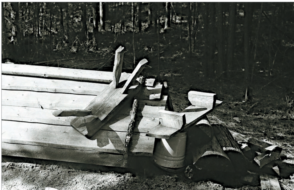
Рис. 232. ПРЭО 1984 г. (манси). Кладбище с. Ясунт. ОРКП. Ф. 26. Оп. 10. Д. 7. № 32: чёрно-белый малоформатный негатив (кадр 11–12)