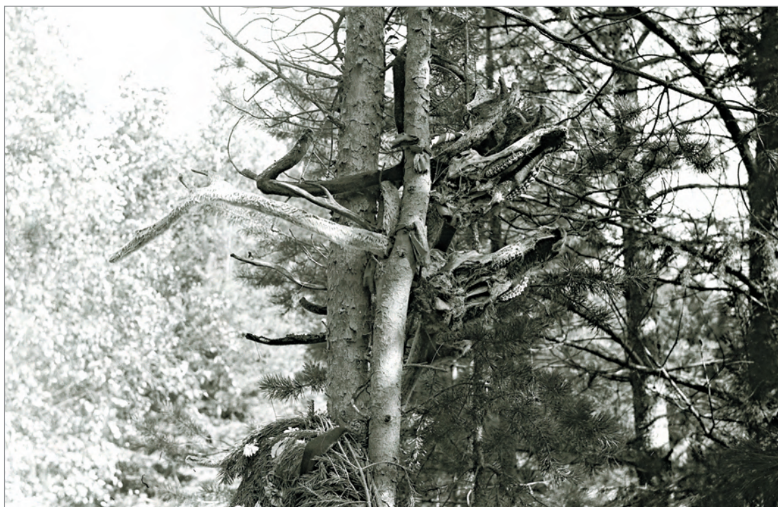
Рис. 238. ПРЭО 1984 г. (манси). Кладбище с. Ясунт. Черепа и рога животных на деревьях. Фотосъёмка А.М. Сагалаева. ОРКП. Ф. 26. Оп. 10. Д. 7. № 32: чёрно-белый малоформатный негатив (кадр 43–44)