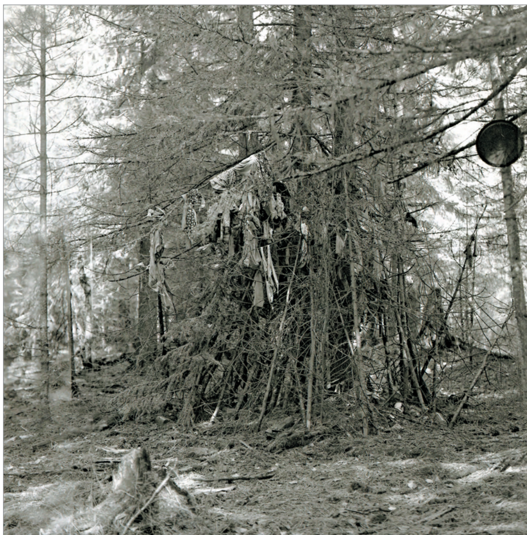
Рис. 240. ПРЭО 1984 г. (манси). Культовое место Эква-Пурлахтын-ма у с. Ясунт (р. Хулга). Фотосъёмка А.М. Сагалаева. ОРКП. Ф. 26. Оп. 10. Д. 7. № 33: чёрно-белый среднеформатный негатив

№ 33. [Культовое место Эква-Пурлахтын-ма у с. Ясунт] . 10 фотовидов: 4 чёрно-белых среднеформатных негативных кадра; 2 цветных малоформатных слайда (№ 10–11, 13–14); 4 цветных среднеформатных слайда; 1 чёрно-белая фотография (идентична негативу) размером 18 x 23,7 см. Фотовиды: дерево с прикладами; женщина, привязывающая к нему тряпочку; костёр и женщина у костра (рис. 240–246). На обороте фотографии, идентичной негативу (рис. 240), – надпись рукой А.М. Сагалаева: «Ёлочки с прикладами». К этой съёмке предположительно отнесены три кадра с изображениями берестяных коробов на земле и на дереве (рис. 244–246), так как на плёнке они смежны с фотовидом явно Эква-Пурлахтын-ма у с. Ясунт. Местонахождение святилища, на которое этнографов в 1984 г. привели местные женщины-мансийки, находится в 400–450 м от с. Ясунт 667 .