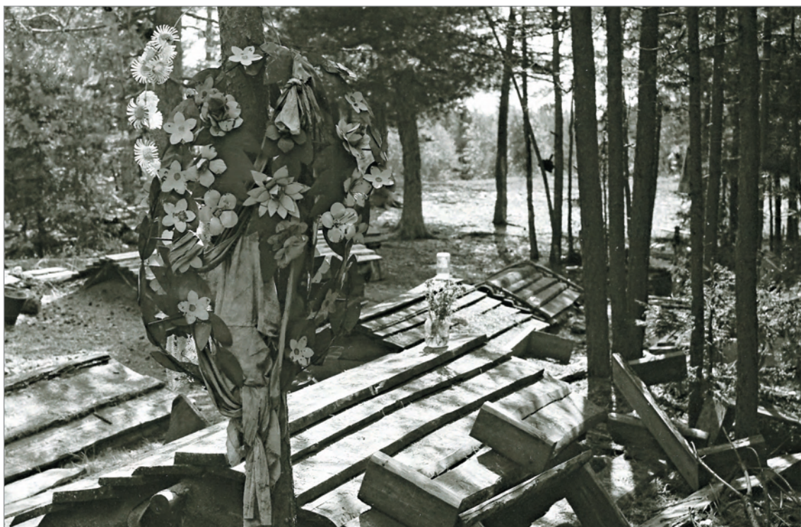
Рис. 236. ПРЭО 1984 г. (манси). Кладбище с. Ясунт. Венок на дереве (?), цветы в стеклянной банке на надмогильном сооружении. ОРКП. Ф. 26. Оп. 10. Д. 7. № 32: чёрно-белый малоформатный негатив (кадр 9–10)