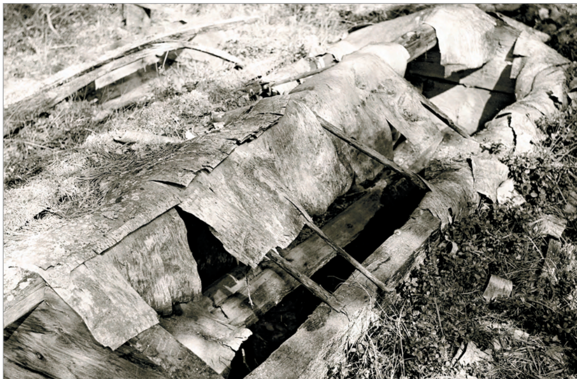
Рис. 235. ПРЭО 1984 г. (манси). Кладбище с. Ясунт. ОРКП. Ф. 26. Оп. 10. Д. 7. № 32: чёрно-белый малоформатный негатив (кадр 29–30)