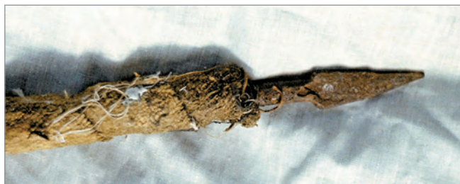
Рис. 276. ПРЭО 1984 г. (манси). Культовое место Ворсик-ойка . Атрибут из амбарчика: стрела с железным наконечником. Фотосъёмка А.М. Сагалаева. ОРКП. Ф. 26. Оп. 10. Д. 7. № 35: цветной малоформатный слайд (кадр 59–60)