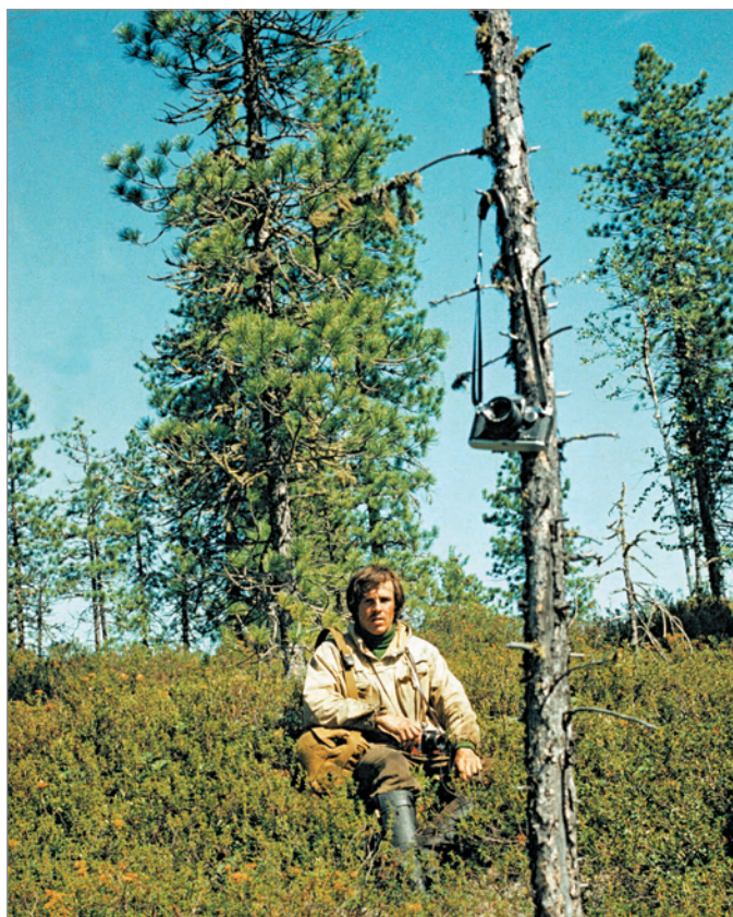
Рис. 261. ПРЭО 1984 г. (манси). Отдых на пути к культовому месту Ворсик-ойка : А.А. Алексеев. ОРКП. Ф. 26. Оп. 10. Д. 7. № 35: цветной малоформатный слайд (кадр 58–59)