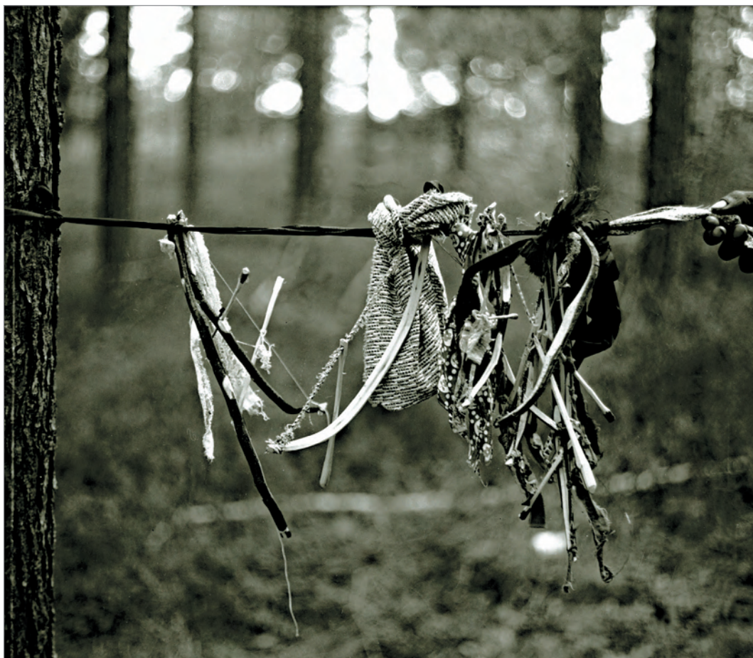
Рис. 255. ПРЭО 1984 г. (манси). Культовое место Куль-отыр-ойка . Вынесенные из амбарчика модели луков – приношения при рождении сыновей. Фотосъёмка А.М. Сагалаева. ОРКП. Ф. 26. Оп. 10. Д. 7. № 34: чёрно-белый среднеформатный негатив