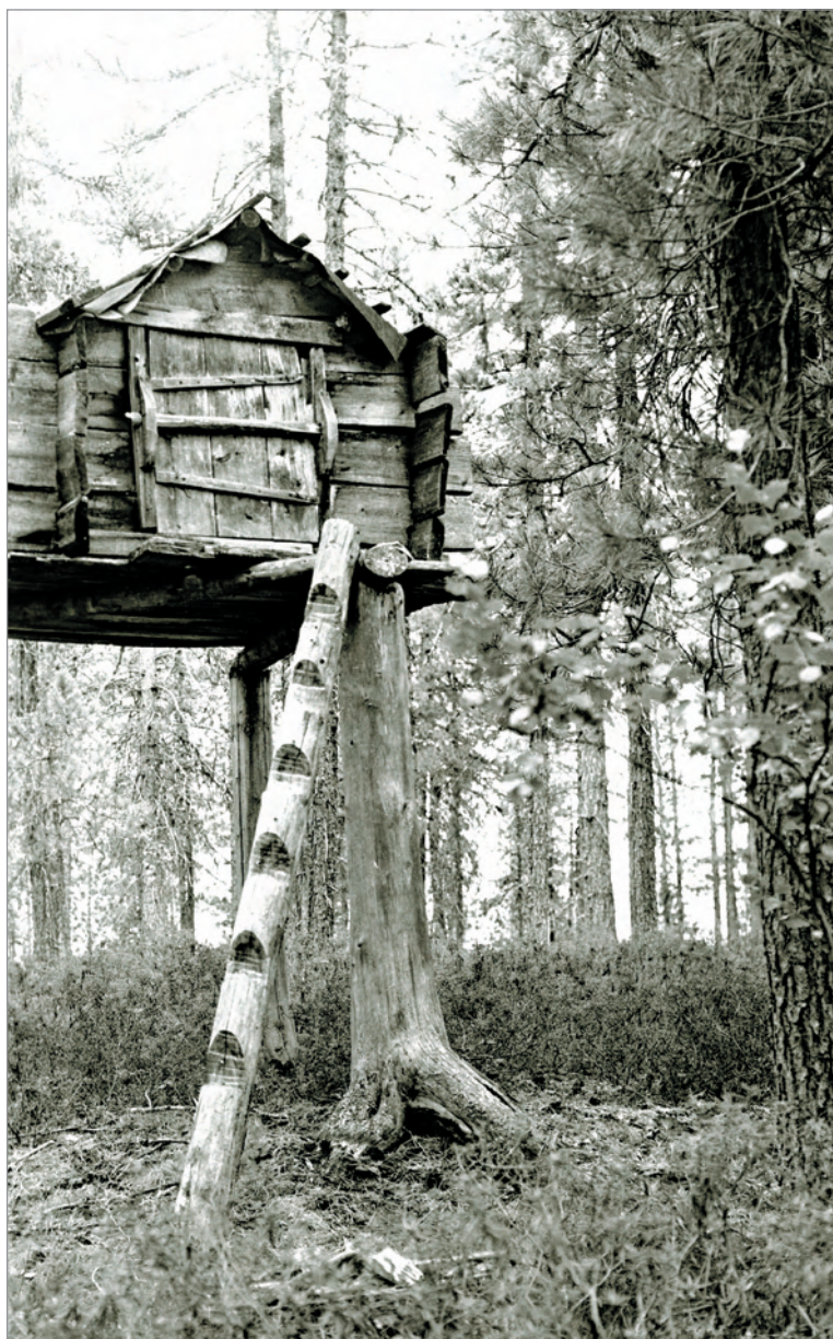
Рис. 248. ПРЭО 1984 г. (манси). Культовое место Куль-отыр-ойка . Священный амбарчик (на трёх опорах-комлях). ОРКП. Ф. 26. Оп. 10. Д. 7. № 34: чёрно-белый среднеформатный негатив