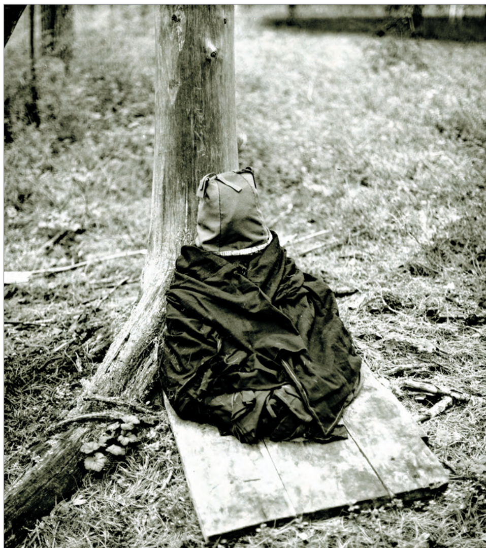
Рис. 252. ПРЭО 1984 г. (манси). Культовое место Куль-отыр-ойка . Изображение Куль-отыра в самой верхней шапке: из полос синей и красной ткани 669 . ОРКП. Ф. 26. Оп. 10. Д. 7. № 34: чёрно-белый среднеформатный негатив