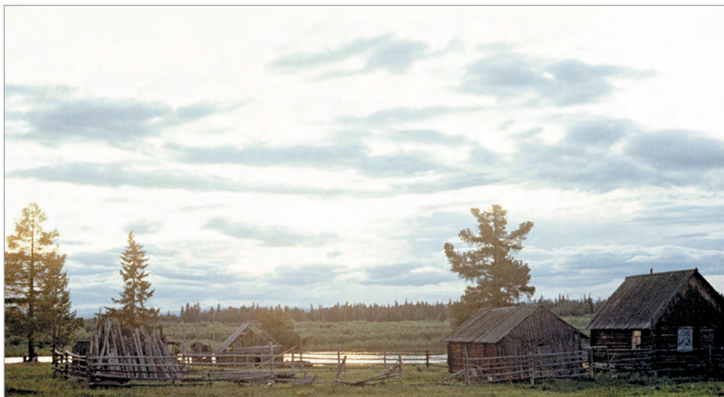
Рис. 288. ПРЭО 1984 г. (манси). Селение. Место съёмки не определено. ОРКП. Ф. 26. Оп. 10. Д. 7. № 42: цветной малоформатный слайд (кадр 49–50)