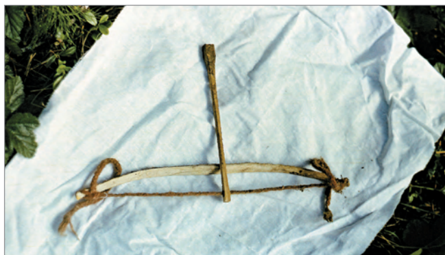
Рис. 274. ПРЭО 1984 г. (манси). Культовое место Ворсик-ойка . Атрибут из амбарчика: ритуальная модель деревянного лука со стрелой. ОРКП. Ф. 26. Оп. 10. Д. 7. № 35: цветной малоформатный слайд (кадр 55–56)