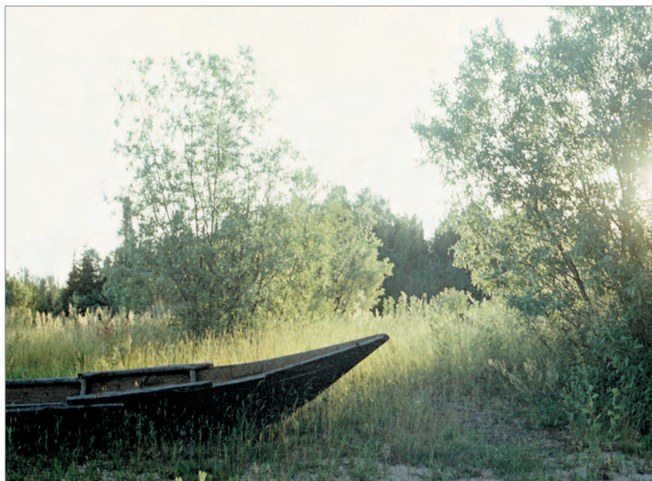
Рис. 286. ПРЭО 1984 г. (манси). Лодка. Место съёмки не определено. ОРКП. Ф. 26. Оп. 10. Д. 7. № 40: цветной малоформатный слайд (кадр 11–12)

№ 40. [Лодка манси] . 6 фотовидов: 6 цветных малоформатных негативных кадров (№ 11–22). Фотовид: стоящая на суше (в пойме) деревянная дощатая лодка (атрибутирована на основе содержания кинофильма) (рис. 286). Место съёмки не определено.