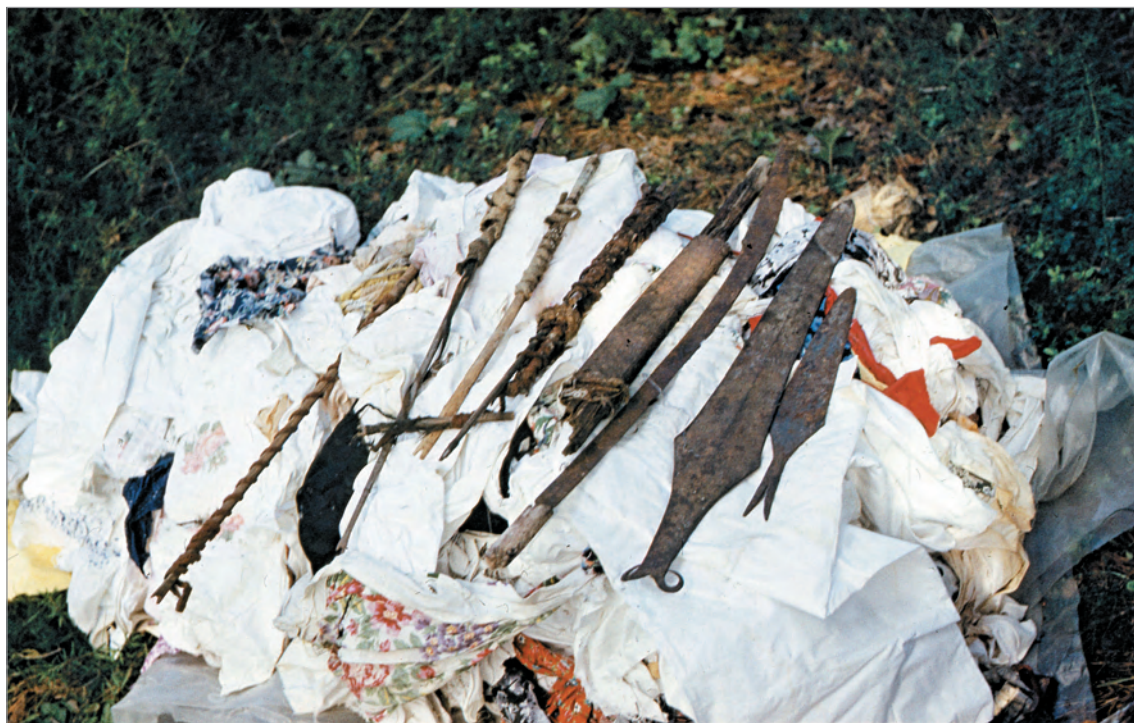
Рис. 270. ПРЭО 1984 г. (манси). Культовое место Ворсик-ойка . Атрибуты из амбарчика: оружие. ОРКП. Ф. 26. Оп. 10. Д. 7. № 35: цветной малоформатный слайд (кадр 66–67)