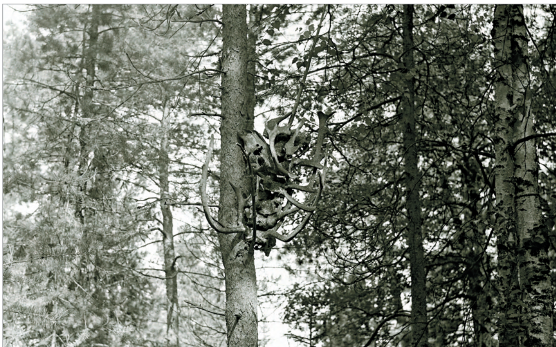
Рис. 237. ПРЭО 1984 г. (манси). Кладбище с. Ясунт. Черепа и рога животных на деревьях. Фотосъёмка А.М. Сагалаева. ОРКП. Ф. 26. Оп. 10. Д. 7. № 32: чёрно-белый малоформатный негатив (кадр 27–28)