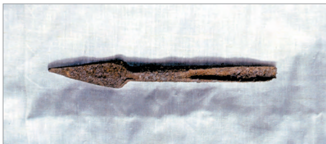
Рис. 277. ПРЭО 1984 г. (манси). Культовое место Ворсик-ойка . Атрибут из амбарчика: железный наконечник стрелы. ОРКП. Ф. 26. Оп. 10. Д. 7. № 35: цветной малоформатный слайд (кадр 61–62)