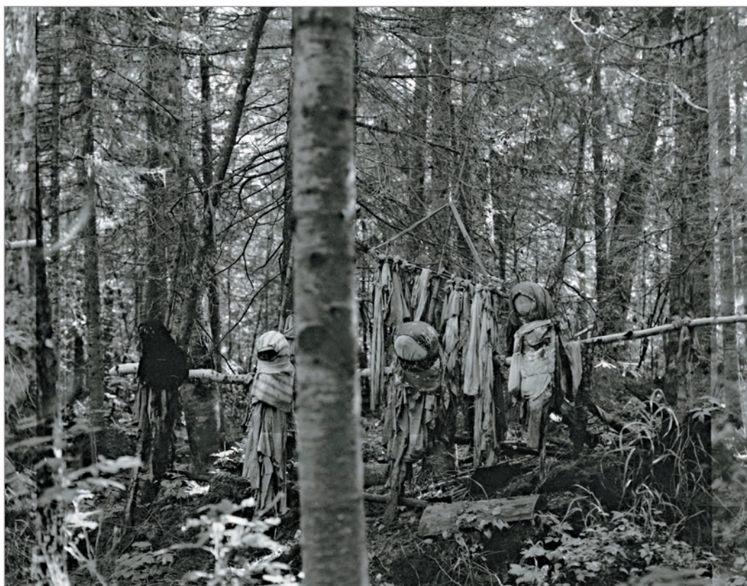
Рис. 282. ПРЭО 1984 г. (манси). Культовое место. Не идентифицировано. ОРКП. Ф. 26. Оп. 10. Д. 7. № 36: чёрно-белый среднеформатный негатив

№ 36. [Культовое место с тряпичными антропоморфными изображениями] . 2 фотовида: 2 чёрно-белых среднеформатных негативных кадра; 1 чёрно-белая фотография размером 16 x 23,7 см (идентична негативу). Фотовид: 3 тряпичные антропоморфные фигуры (прикреплены к жерди), над ними – полоски ткани, привязанные к веткам хвойного дерева (рис. 282). Месторасположение объекта съёмки не идентифицировано, но это явно не Эква-Пурлахтын-ма у с. Хурумпауль.