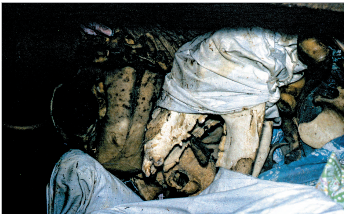
Рис. 267. ПРЭО 1984 г. (манси). Культовое место Ворсик-ойка . Внутренний вид амбарчика, в центре – череп медведя, перевязанный тканью. ОРКП. Ф. 26. Оп. 10. Д. 7. № 35: цветной малоформатный слайд (кадр 27–28)