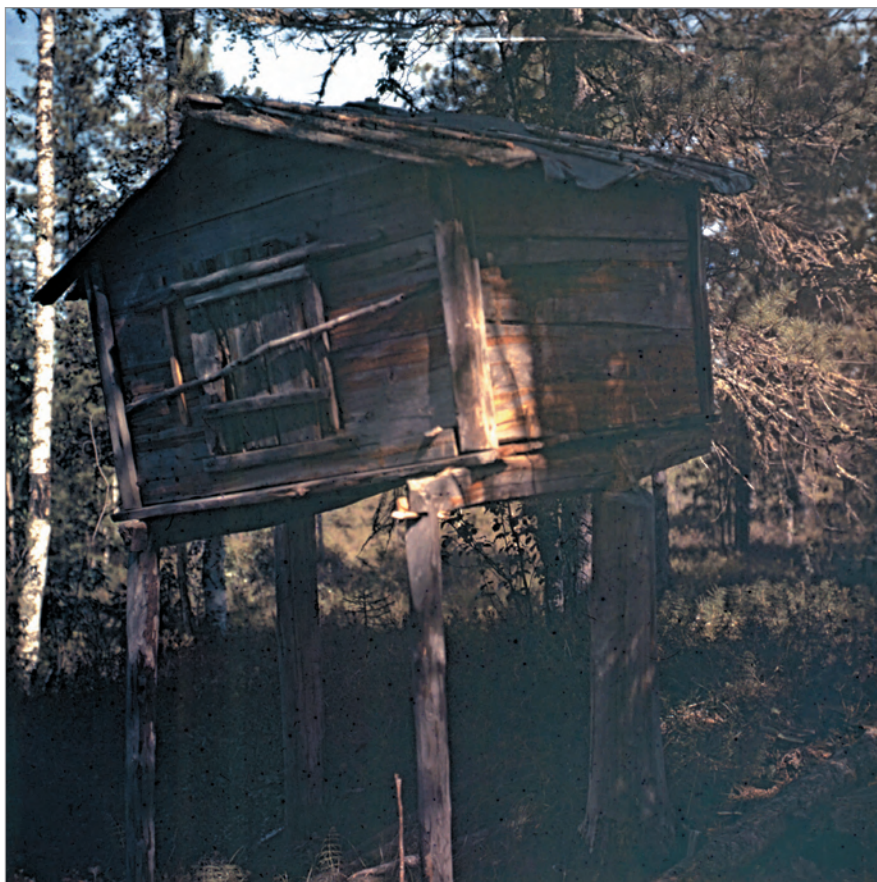
Рис. 262. ПРЭО 1984 г. (манси). Культовое место Ворсик-ойка . Священный амбарчик. ОРКП. Ф. 26. Оп. 10. Д. 7. № 35: цветной среднеформатный слайд