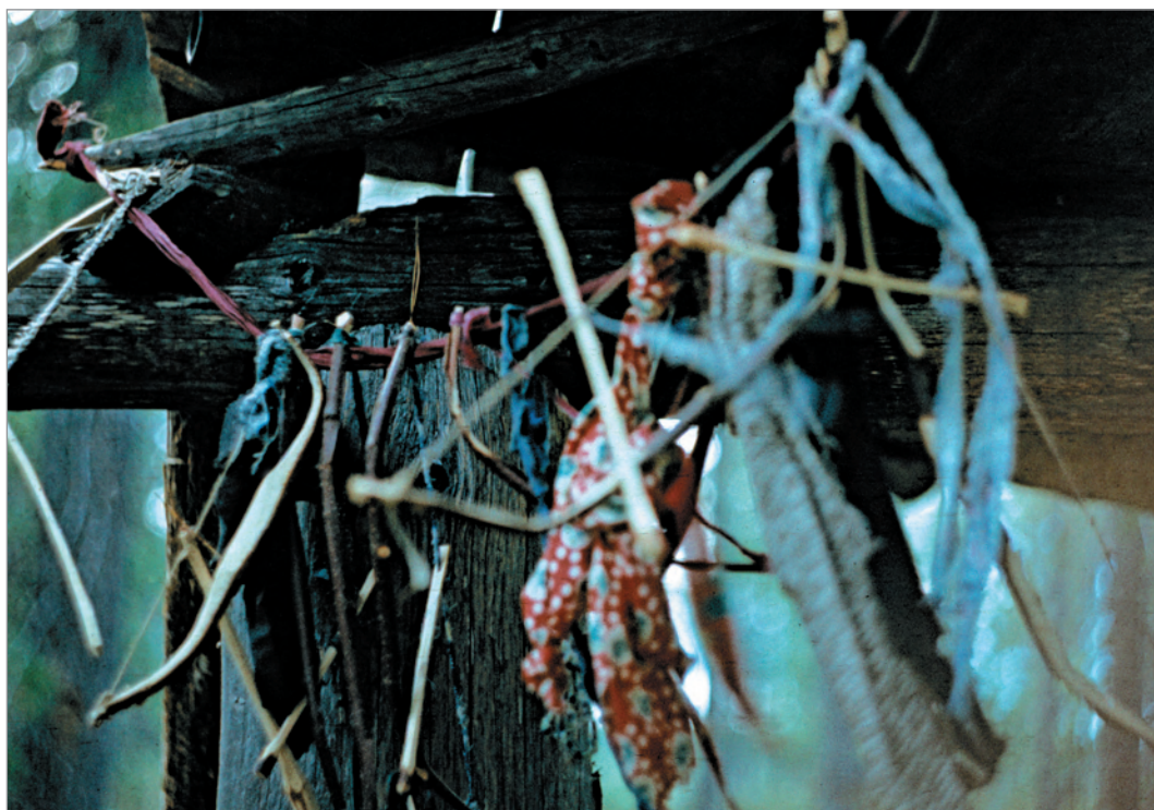
Рис. 256. ПРЭО 1984 г. (манси). Культовое место Куль-отыр-ойка . Вынесенные из амбарчика модели луков – приношения при рождении сыновей. Фотосъёмка А.М. Сагалаева. ОРКП. Ф. 26. Оп. 10. Д. 7. № 34: цветной малоформатный слайд (кадр 69–70)