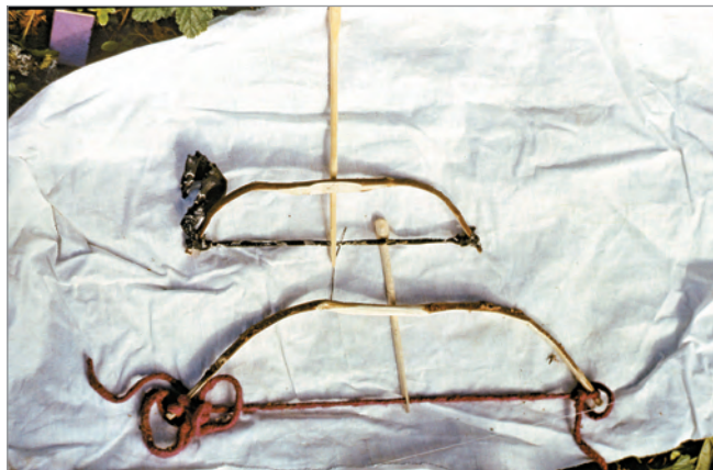
Рис. 275. ПРЭО 1984 г. (манси). Культовое место Ворсик-ойка . Атрибуты из амбарчика: ритуальные модели деревянных луков со стрелой. ОРКП. Ф. 26. Оп. 10. Д. 7. № 35: цветной малоформатный слайд (кадр 57–58)