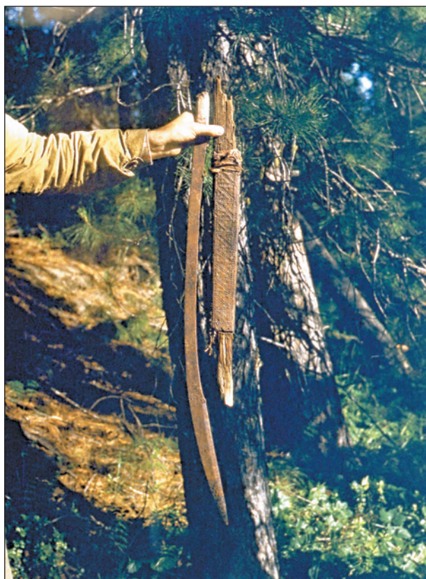
Рис. 273. ПРЭО 1984 г. (манси). Культовое место Ворсик-ойка . Железная сабля с рукоятью из оленьего рога (слева) и деревянно-жестяные ножны с остатками деревянного ритуального меча. ОРКП. Ф. 26. Оп. 10. Д. 7. № 35: цветной малоформатный слайд (кадр 51–52)