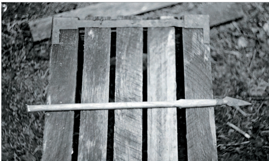
Рис. 285. ПРЭО 1984 г. (манси). Металлический наконечник с деревянным черенком. Место съёмки не определено. ОРКП. Ф. 26. Оп. 10. Д. 7. № 39: чёрно-белый малоформатный негатив (кадр 59–60)

№ 39. [Металлический наконечник с деревянным черенком] . 1 фотовид: 1 чёрно-белый малоформатный негативный кадр (№ 59–60). Фотовид (фиксация без масштаба): с обломанным черенком, отображён, возможно, нож (рис. 285). Судя по взаиморасположению кадров на плёнке, съёмка проходила, не исключено, в с. Ломбовож или с. Хурумпауль.