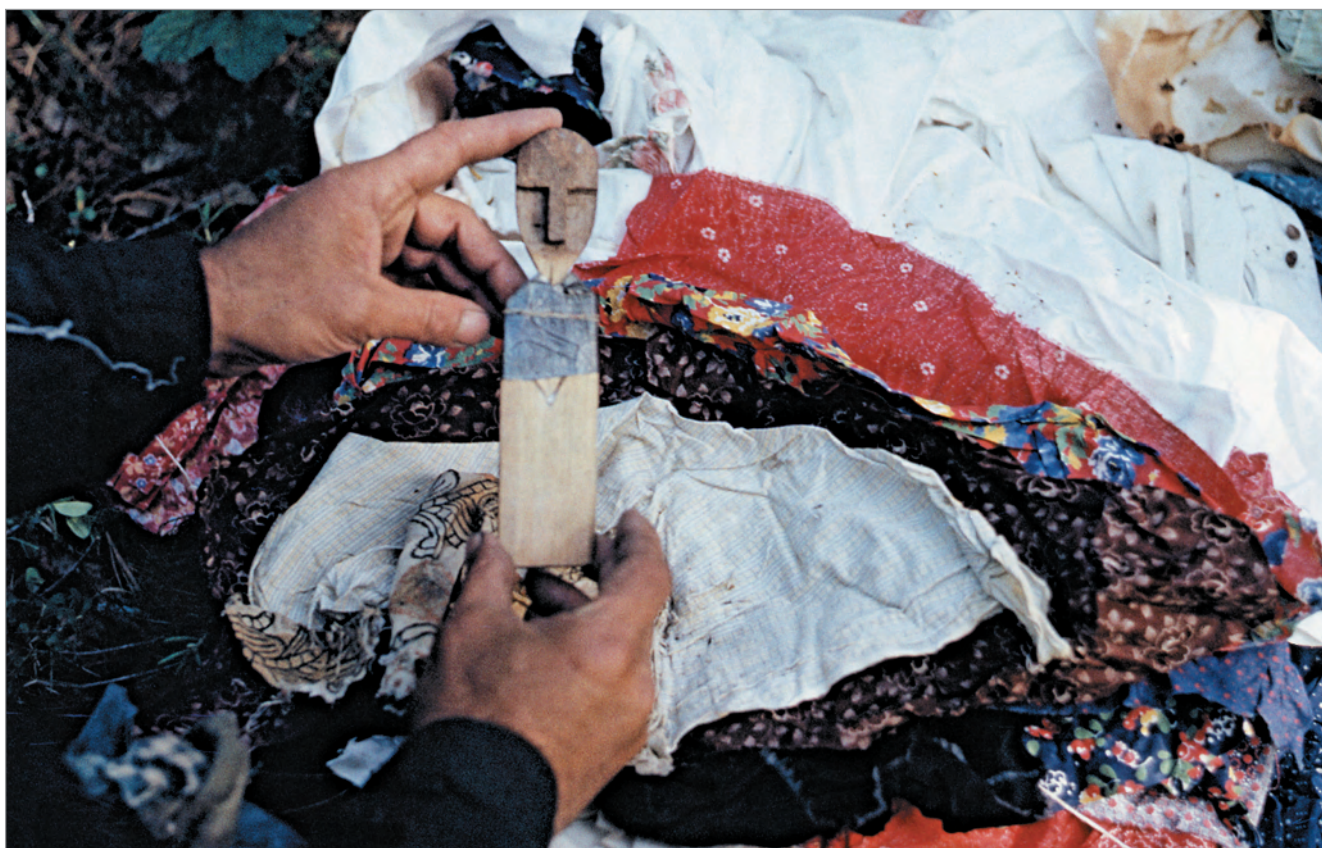
Рис. 268. ПРЭО 1984 г. (манси). Культное место Ворсик-ойка . В руках И.Н. Гемуева атрибут из амбарчика: деревянное антропоморфное изображение Ворсик-ойка , вынутое из свёртка тканей. ОРКП. Ф. 26. Оп. 10. Д. 7. № 35: цветной малоформатный слайд (кадр 70–71)