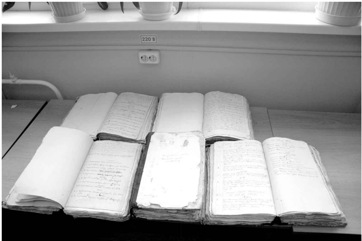
Так выглядят метрические книги