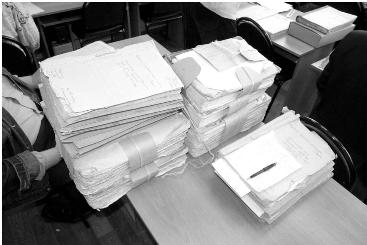
Так выглядят метрические книги