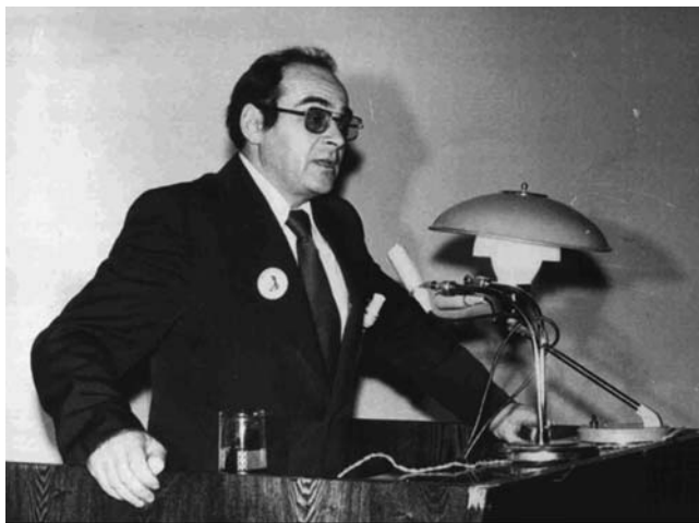
Доклад на Каргинских чтениях. Дзержинск, 1978 г.