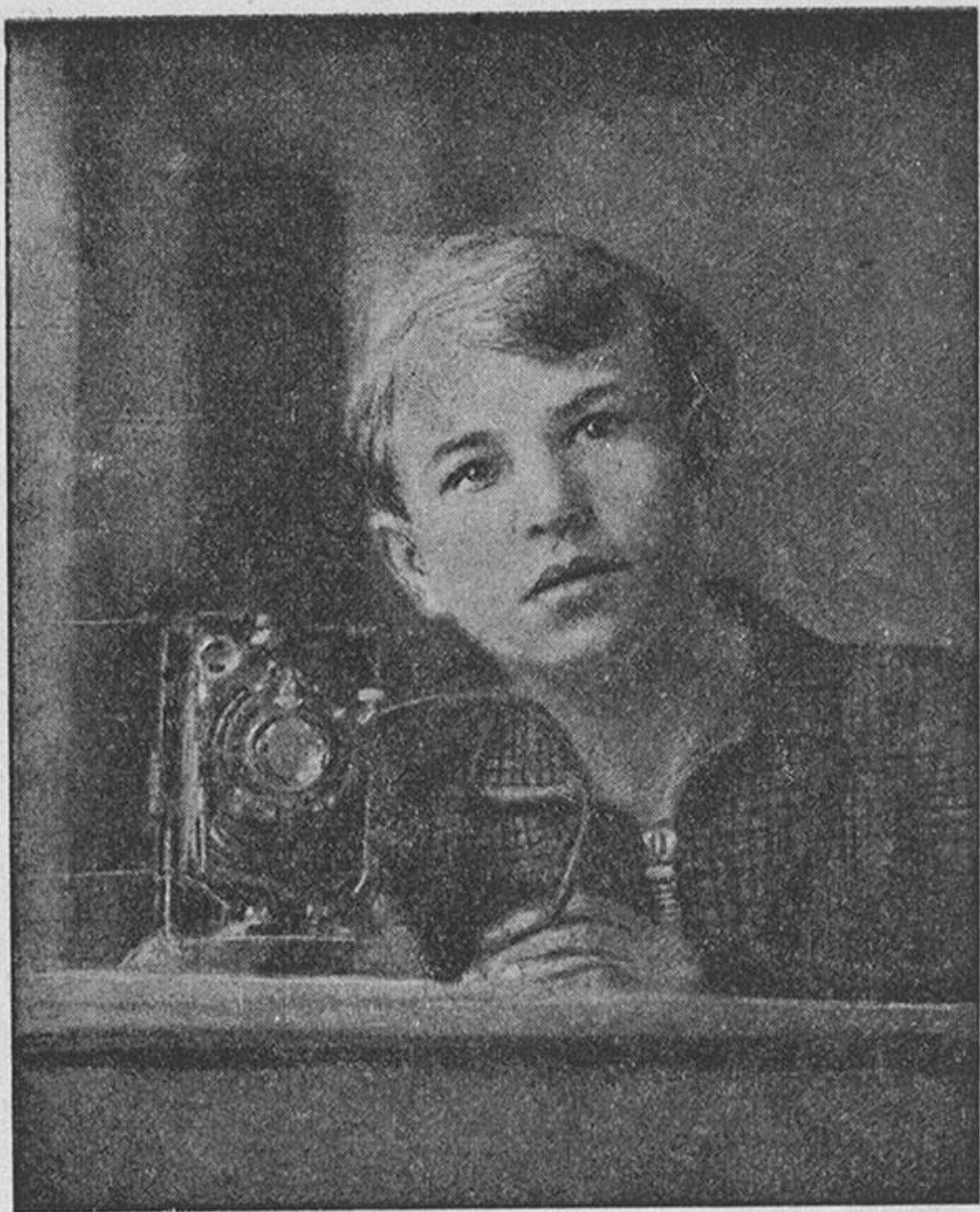
У любимого фотоаппарата.