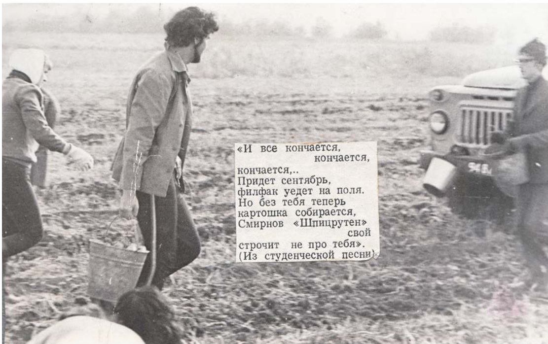
На погрузке картошки в поле. Сельхозотряд филфака ВГУ. с. Нижняя Катуховка Новоусманского района. 1983