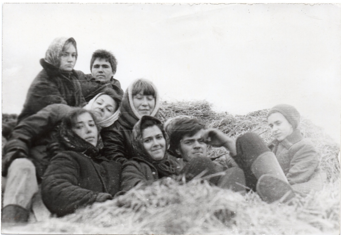
Если повезет - отдохнем на стогу