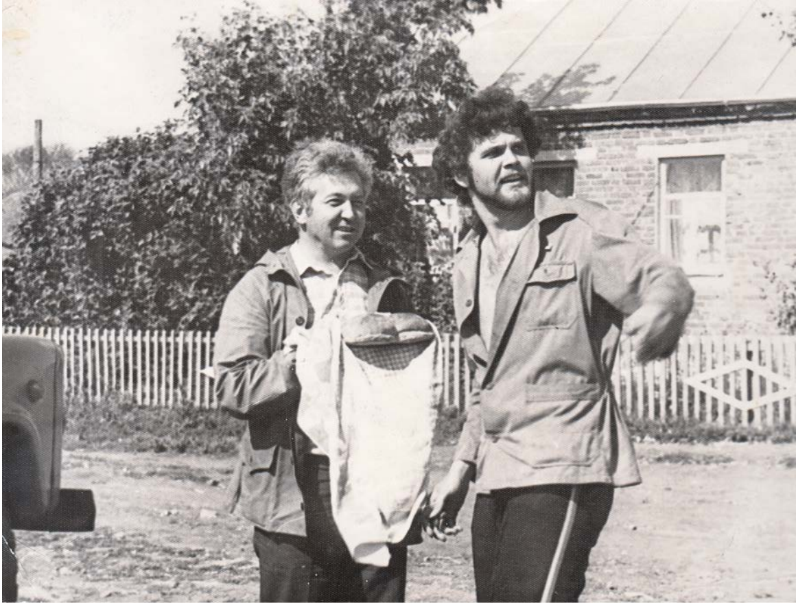
Сельхозотряд филфака ВГУ. "Бригада прорыва" хлебом-солью встречает сельхозотряд. с. Нижняя Катуховка Новоусманского района. 1983

Вот так мы выглядели в молодости – это документ нашей судьбы. Поэтому, мы все выглядели супер!