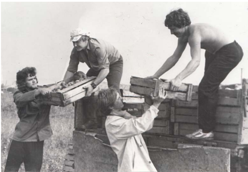
Сельхозотряд филфака ВГУ. Бригада грузчиков. Совхоз Тимирязевский Новоусманского района. 1982