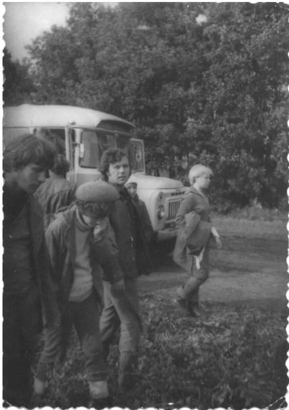
Это мы приехали на поле.