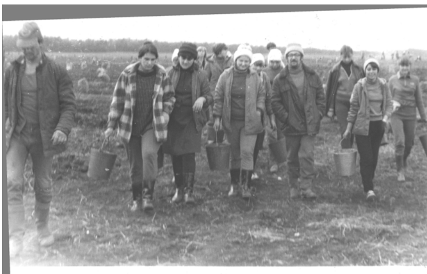
Идем с поля