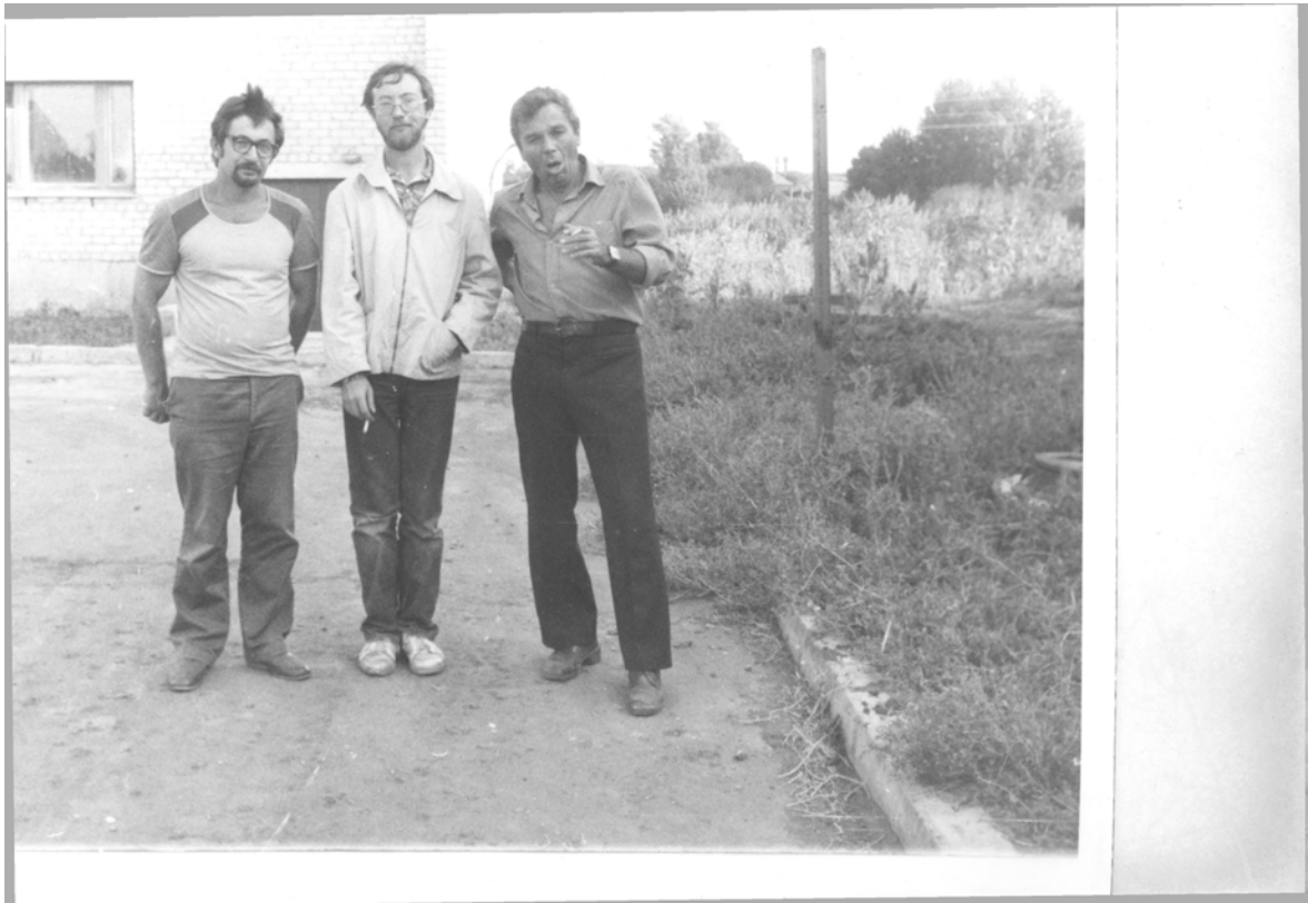
Преподавательская «фракция» отряда (Горенские выселки 1983)