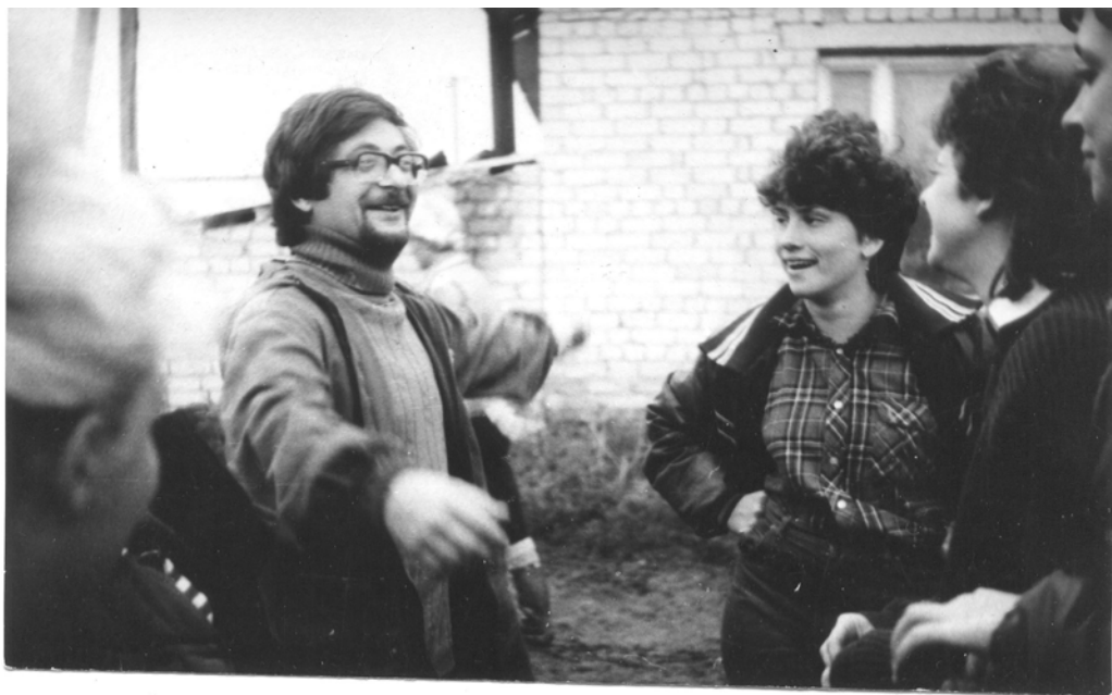
Главное - веселый дух