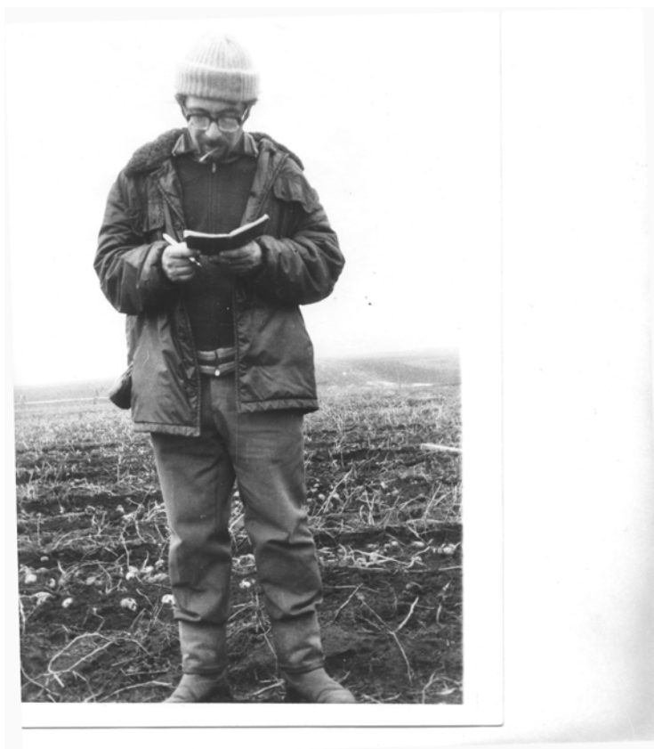
Должен же быть какой-то порядок...