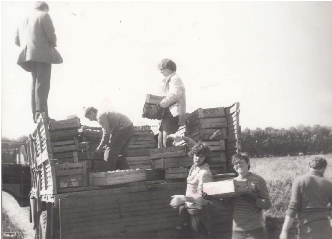
Сельхозотряд филфака ВГУ. Бригада грузчиков. Совхоз Тимирязевский Новоусманского района. 1982