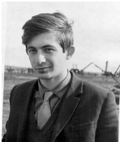
3 курс, 1967 г., со студенческой агитбригадой ВГУ на поле в Ольховатском районе – выступление перед тружениками села.

Помню, на поле составили два грузовика, откинули борта – получилась сцена, на ней пели и танцевали, играли сценки. А полеводы в перерыве, окружив машины, смотрели и от души хлопали.