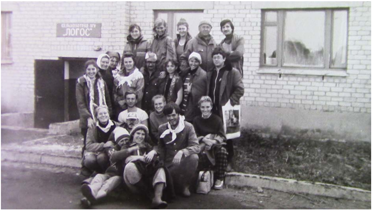
Горенские выселки, 1983