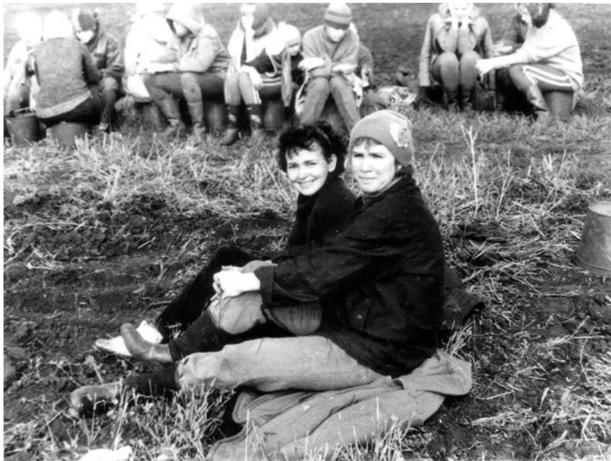
А мы и не устали!