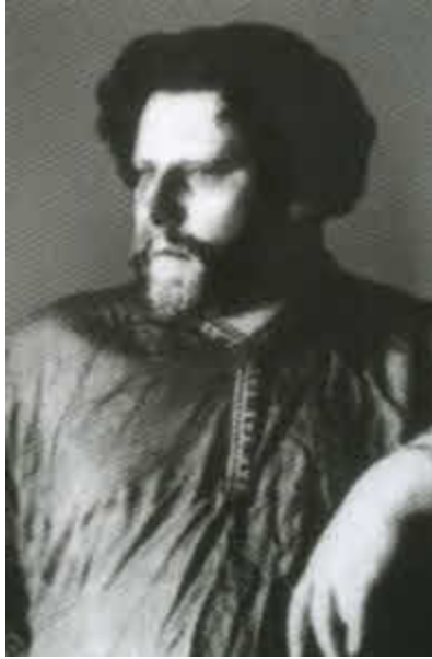
Максимилиан Волошин в своей мастерской.