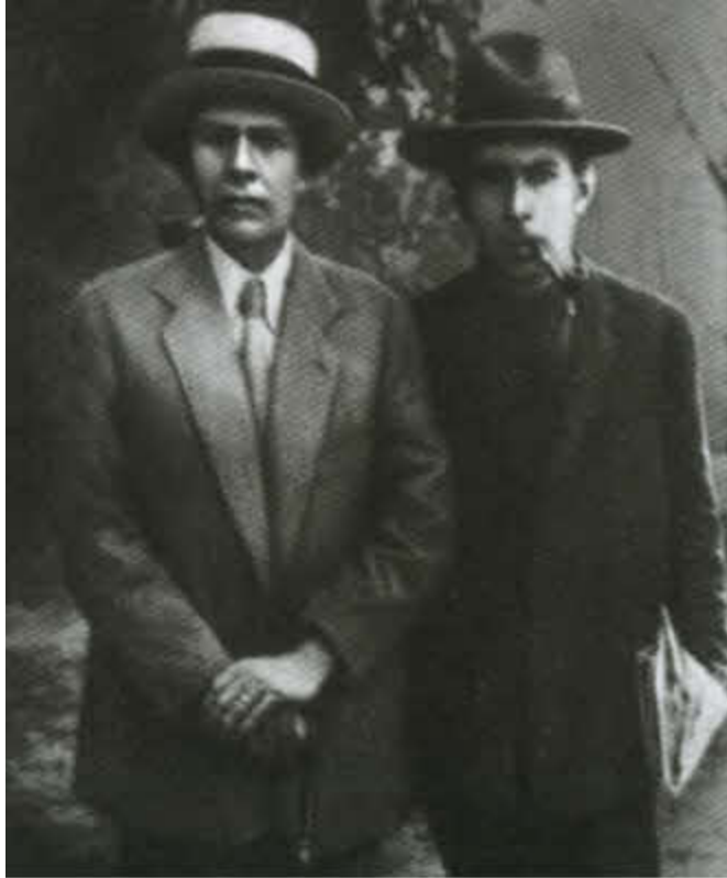
Алексей Толстой и Илья Эренбург. Москва, 1918 г.

«Ты знаешь, Илья, кто ты? Тухлый дьявол! От тебя любой бандит убежит...»