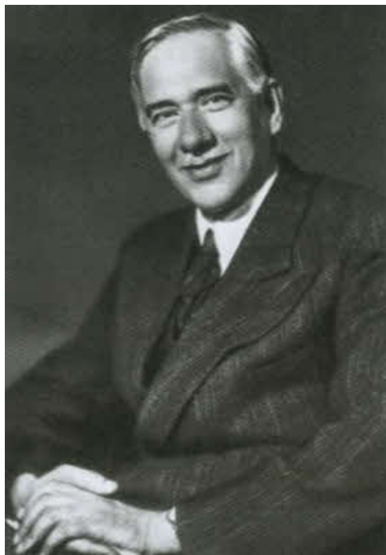
Корней Иванович Чуковский.

«Он всегда был равнодушен ко мне — хотя мы и знакомы с ним 30 лет».