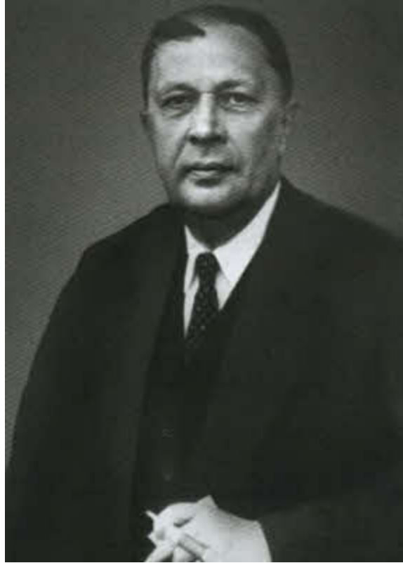
А. Н. Толстой в Праге. 1935 г.