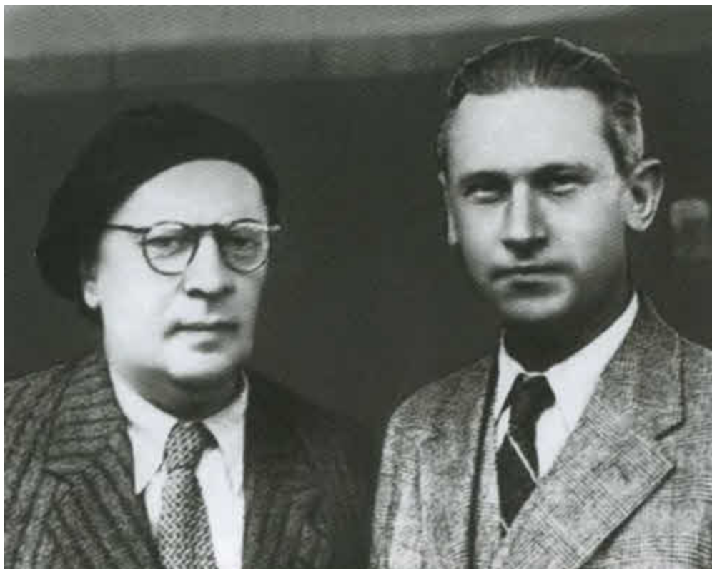
А. Н. Толстой и А. А. Фадеев. 1937 г.