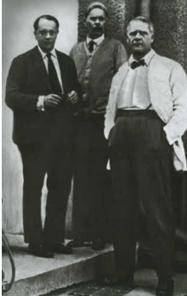
С Горьким и Шаляпиным в Сорренто. 1932 г.