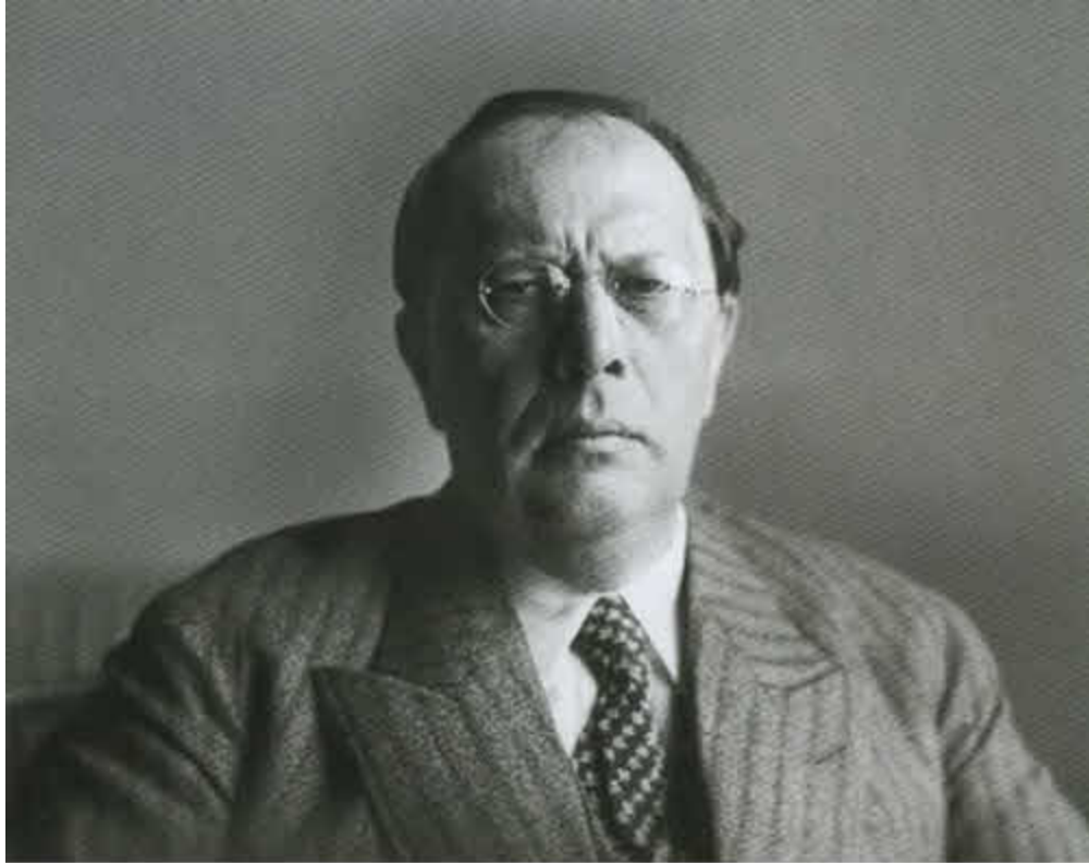
А. Н. Толстой. 1935 г.

«Художник неотделим от человека. Если я большой художник, значит — большой человек».