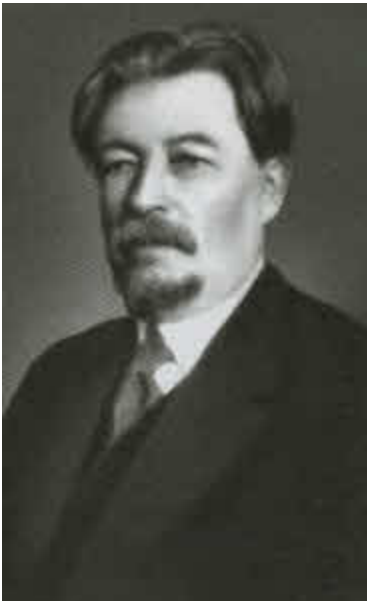
В. Я. Шишков.