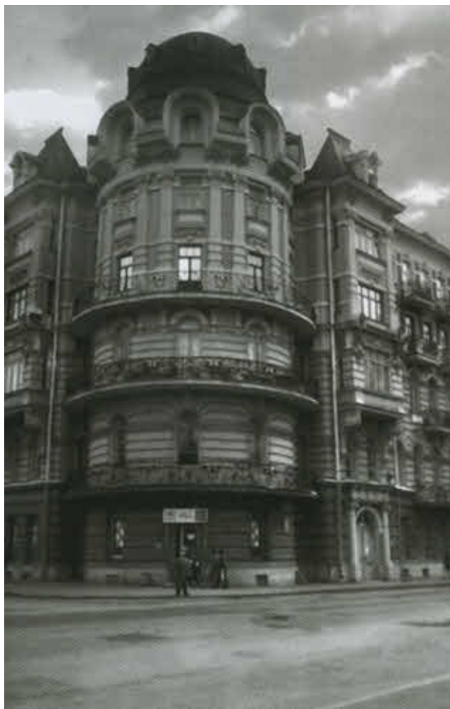
«Башня» Вячеслава Иванова.