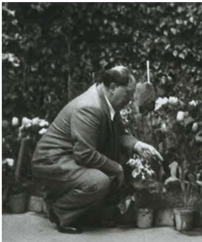
А. Н. Толстой в Сорренто. 1932 г.