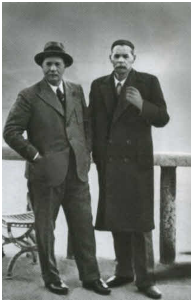
С Горьким в Сорренто. 1932 г.