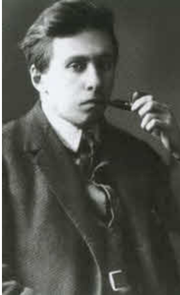
Илья Эренбург. 1920-е гг.