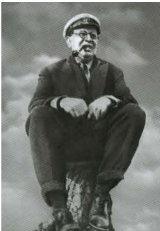
А. Н. Толстой. Победитель.

В экспедиции по подъему ледокола «Садко» ЭПРОНом. 1933 г.