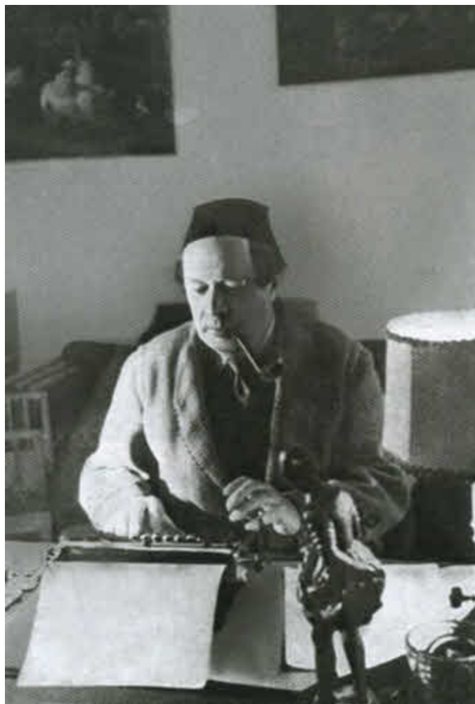
А. Н. Толстой за работой в своем кабинете.