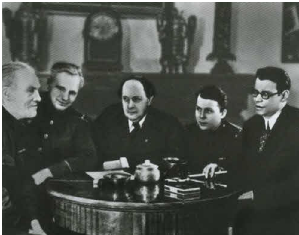
Н. Тихонов, С. Щипачев, А. Твардовский, М. Исаковский в гостях А. Толстого (в центре).