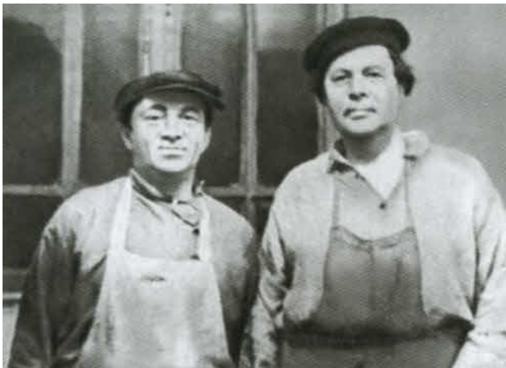
Алексей Толстой и Соломон Михоэлс.