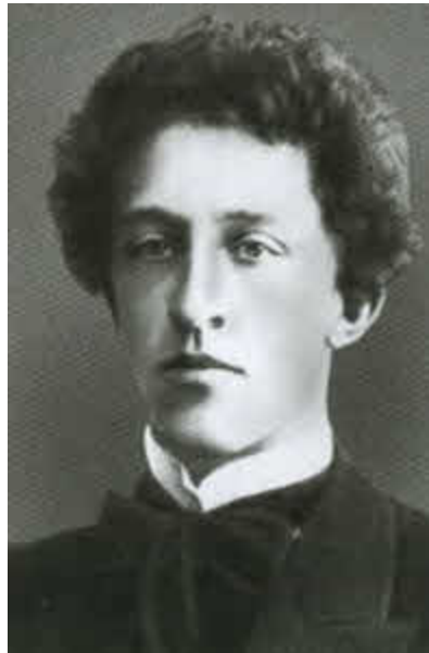
Александр Блок. Бессонов из «Хождения по мукам».