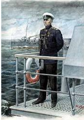
А. В. Колчак - картина