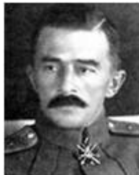
Колчаковские генералы: М.К. Дитерихс