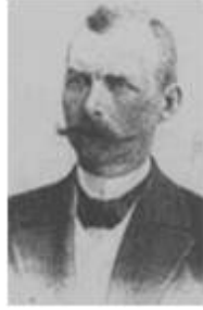
Барон Э.В. Толль