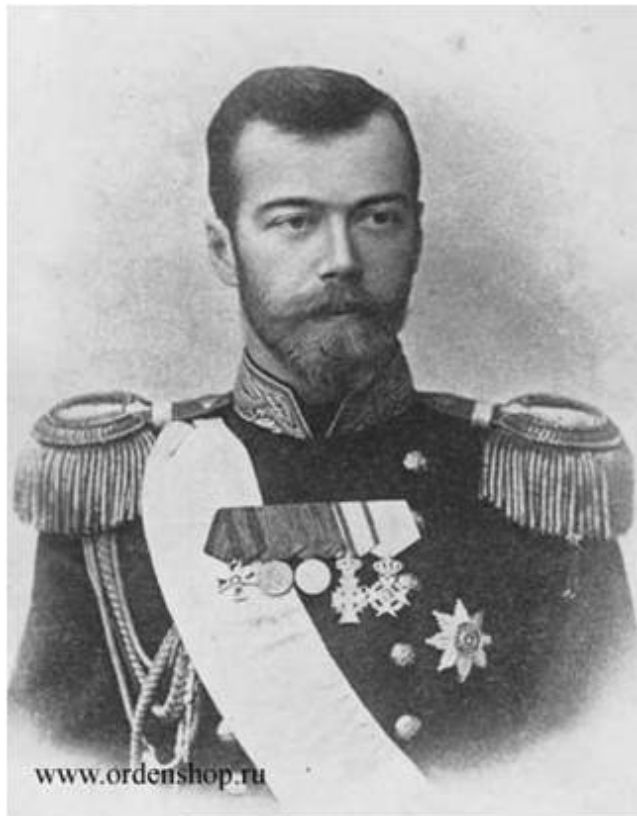
Последний русский император Николай Второй