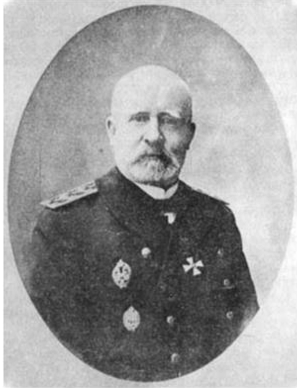
Учителя и соратники: Адмирал Н.О. Эссен