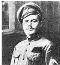
Колчаковские генералы: А.Н. Пепеляев