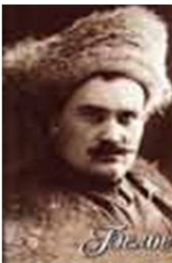
Колчаковские генералы: Атаман Г.М. Семенов