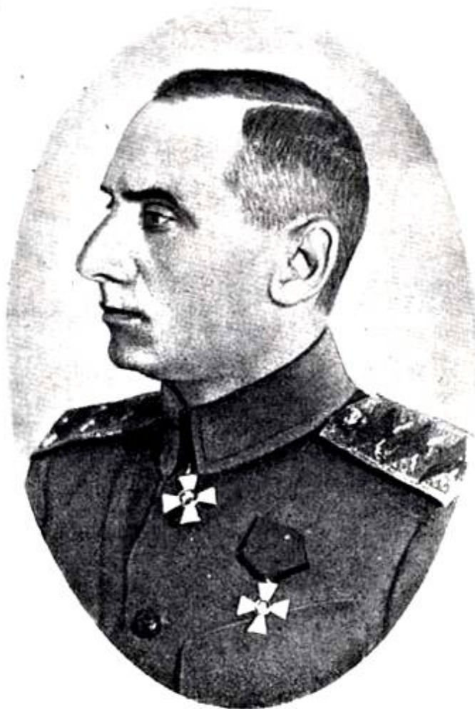
А. В. Колчак