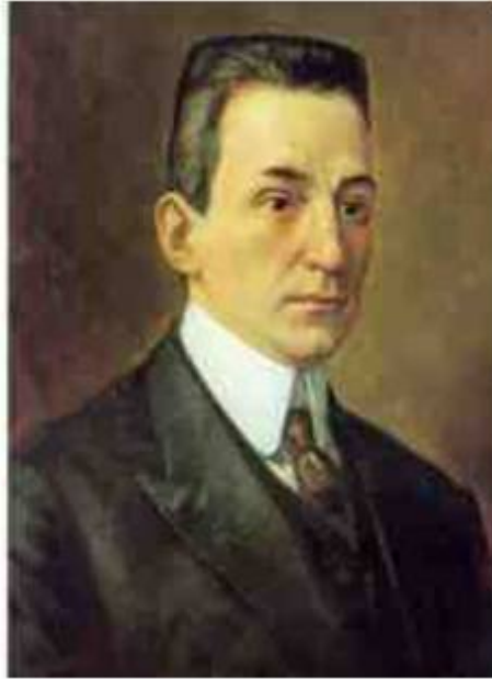
Глава Временного правительства А.Ф. Керенский