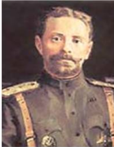
Колчаковские генералы: В.О. Каппель