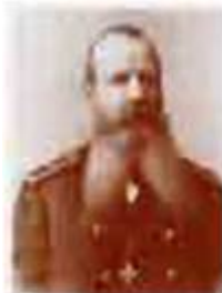
Учителя и соратники: Адмирал С.О. Макаров