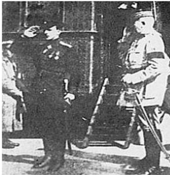
Союзники: Генерал Р. Гайда (слева) и представитель Франции генерал М. Жанен