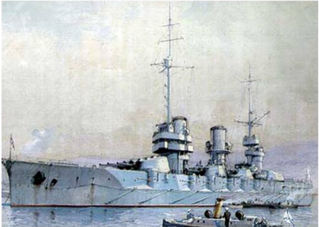
Флагманский корабль Черноморского флота линкор Императрица Мария (1916 год)