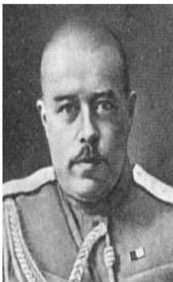
Колчаковские генералы: Атаман А.И. Дутов