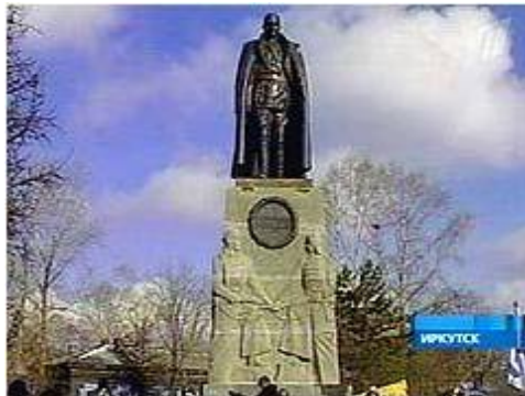
... и в бронзе