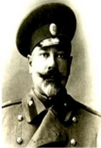
Главнокомандующий Вооруженными силами Юга России генерал А.И. Деникин