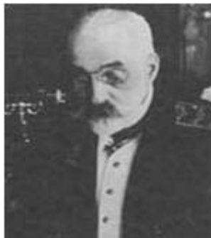
Учителя и соратники: Адмирал И.К. Григорович