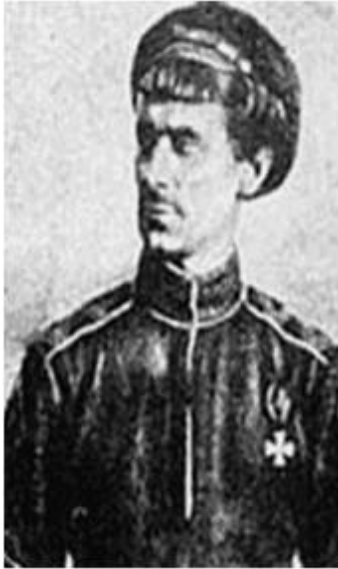
Колчаковские генералы: Атаман Б.В. Анненков