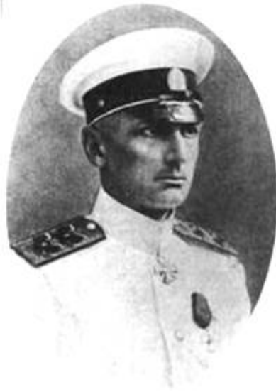
А. В. Колчак - в жизни