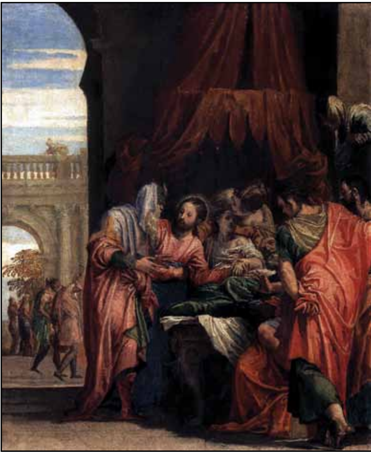
Воскрешение дочери Иаира. Около 1546

XVI век – яркий период в истории итальянского искусства. Завершилась эпоха Возрождения, на смену ей пришли новые идеи и эстетические идеалы. Это время принято именовать кризисом. Однако говорить об упадке, деградации, по крайней мере в итальянском искусстве, было бы неправильно. Скорее речь может идти о смене целей, идей и до определенной степени стилистических приемов у художников. Безусловно, перелом не мог произойти просто так – ему предшествовала драматическая интеллектуальная борьба поколений.