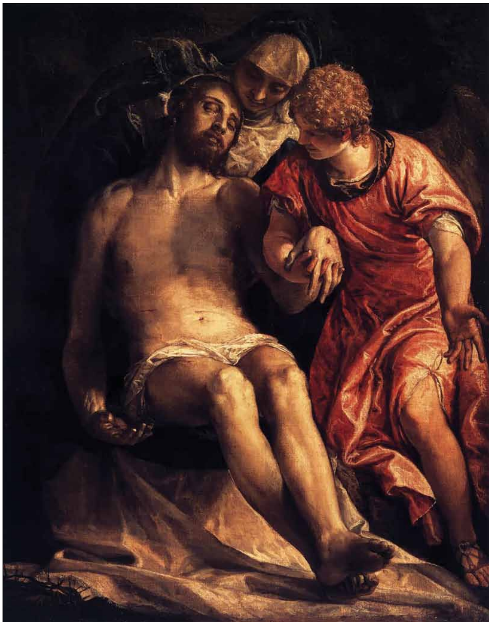
Оплакивание Христа. 1576–1582