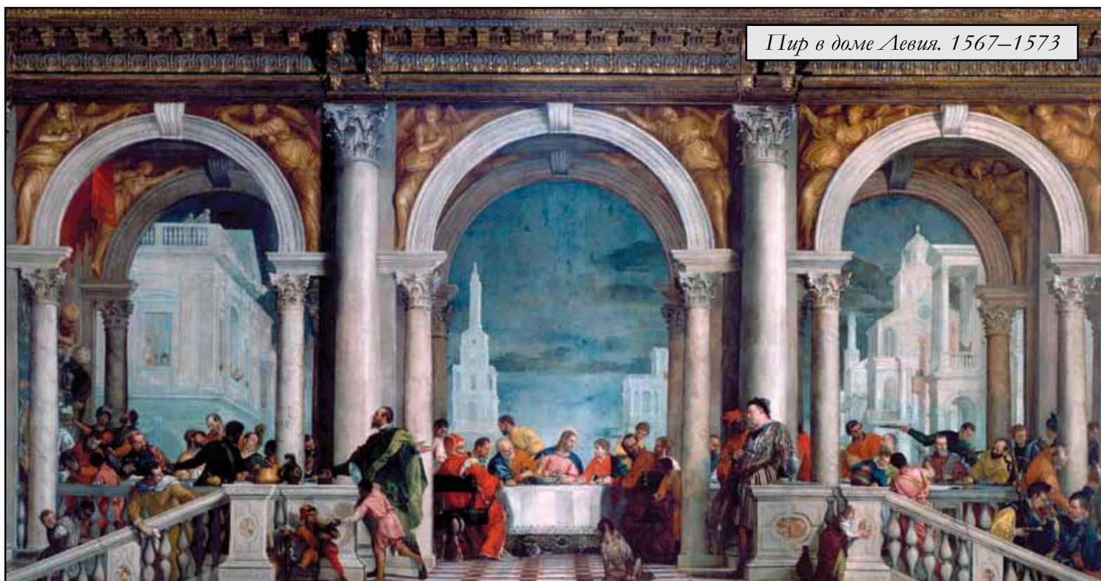
Пир в доме Левия. 1567–1573