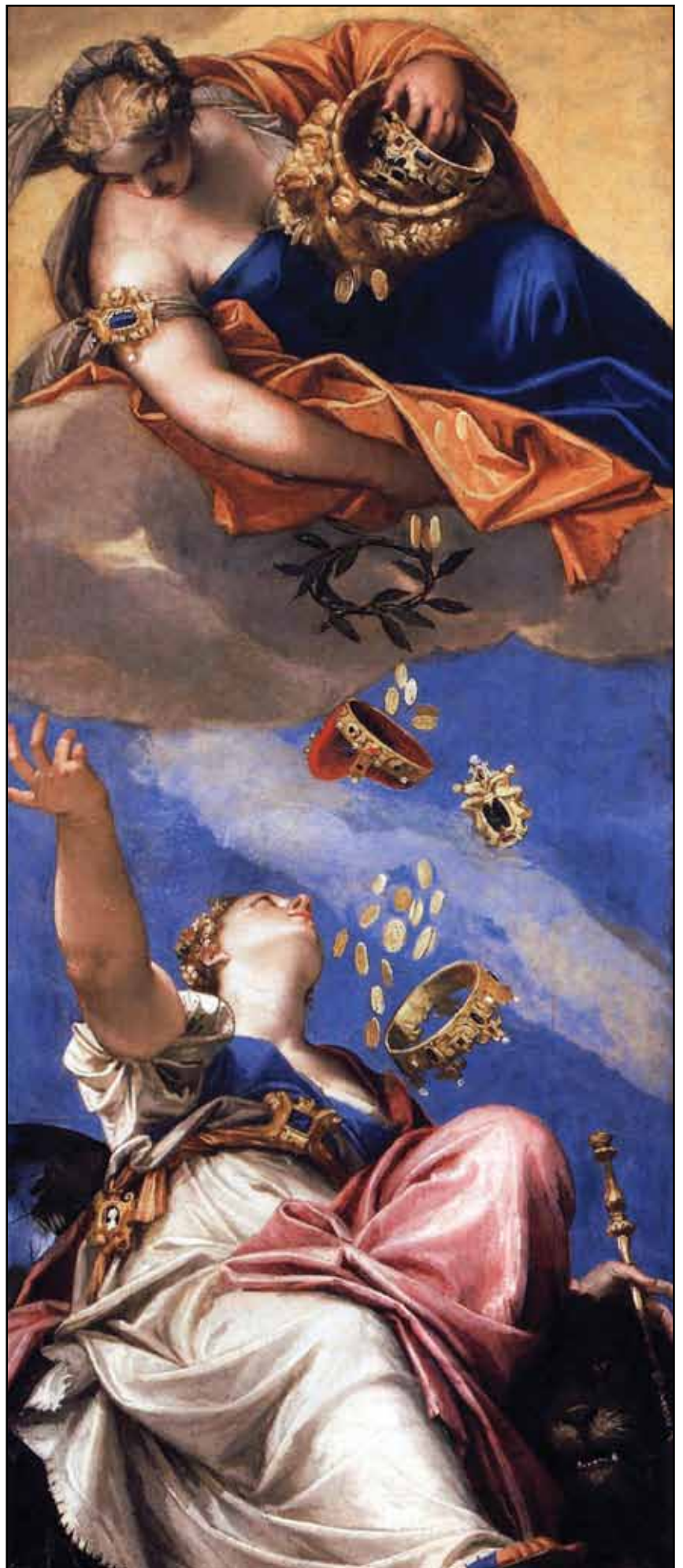
Юнона, осыпаящая дарами Венецию. 1553–1555

Важное место в убранстве храма отведено сюжетам, связанным со святым Себастьяном, но есть много картин и на другие темы.