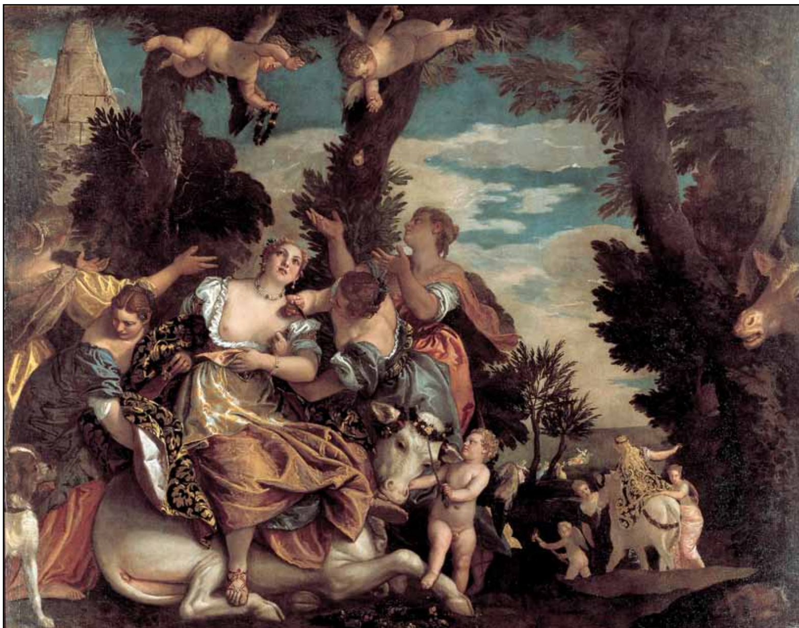
Похищение Европы. 1580

К мифу о Венере и Адонисе Веронезе обращался не раз. Его картины на эту тему находятся в Аутсбурге, Сигэтле, Стокгольме и Вене. Мадридское полотно «Венера и Адонис» (1580, Музей Прадо, Мадрид) было задумано как парное к произведению «Кефал и Прокрида» (Музей изящных искусств, Страсбург): оба основаны на рассказе Овидия из X книги его «Метаморфоз». И обе истории повествуют о трагической гибели одного из влюбленных. Верный своему маньеристическому стилю, Веронезе придал позам персонажей, особенно Адониса, весьма прихотливый ракурс.