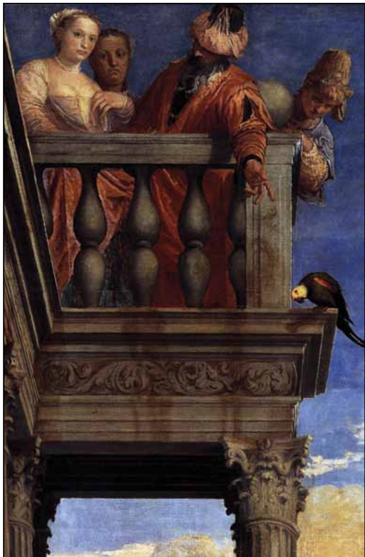
Пир в доме Симона-фарисея. Фрагмент