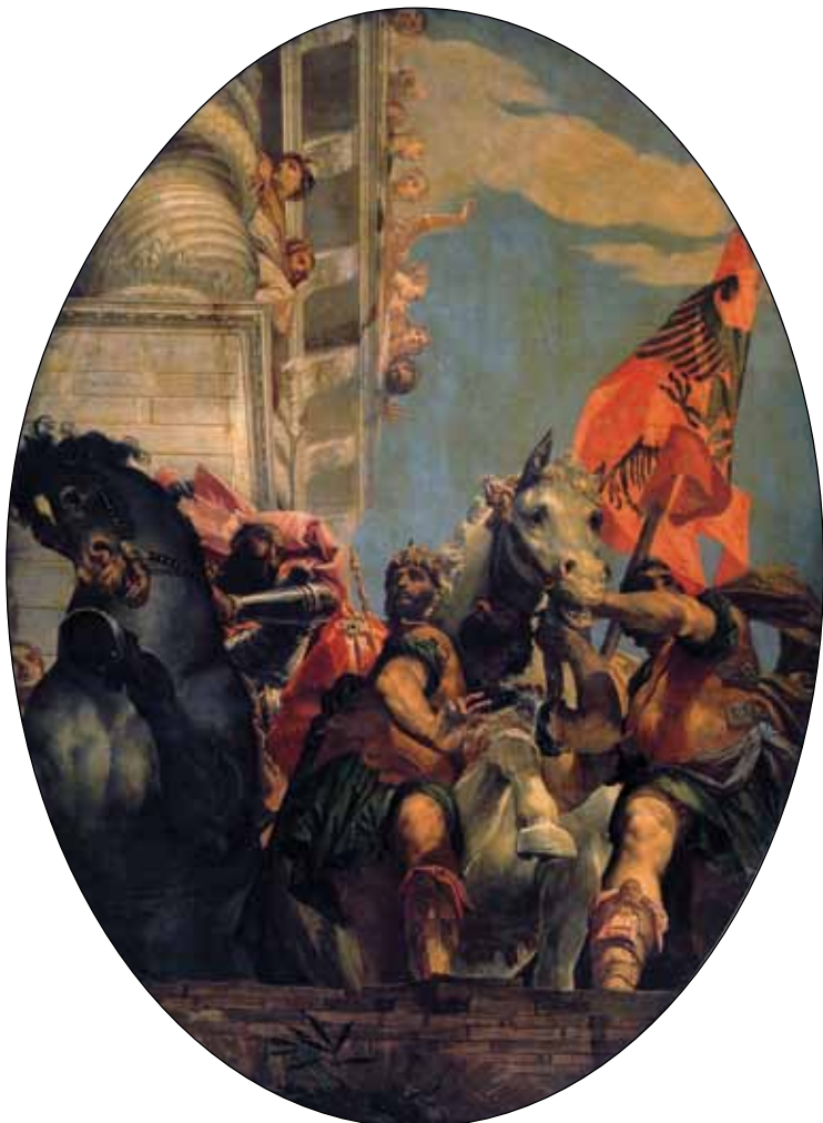
Триумф Мардохея. 1556

серкса. Книга Есфири состоит из пяти частей, и «Возведение Есфири в сан царицы» – рассказ второй из них: «И полюбил царь Есфирь более всех жен, и она приобрела его благоволение и благорасположение более всех девиц; он возложил царский венец на голову ее и сделал ее царицею на место Астинь» (Есф 2:17).