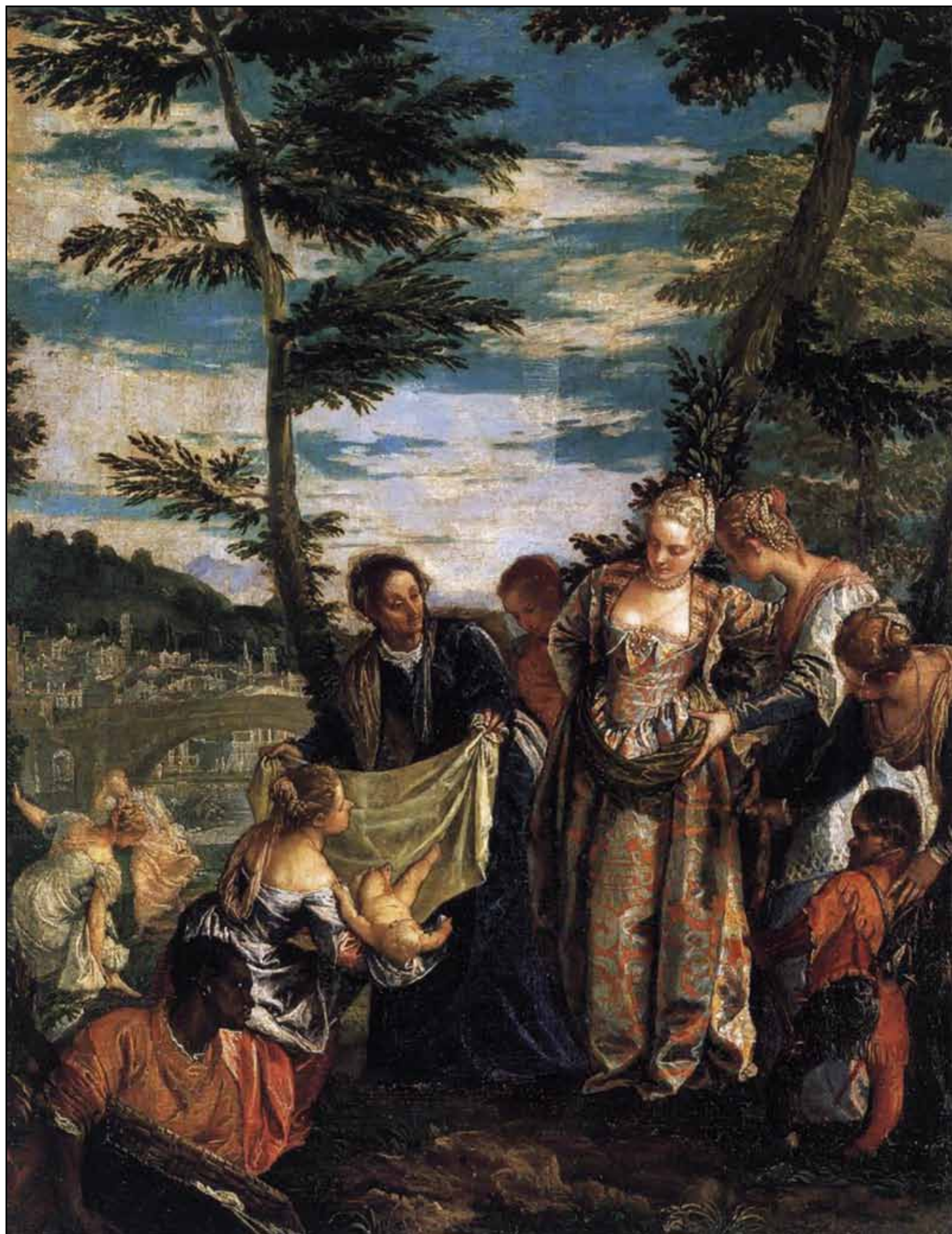
Нахождение Моисея. Около 1582