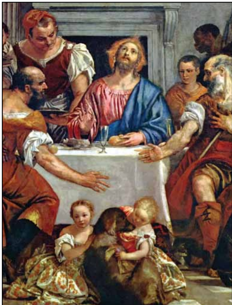
Христос в Эммаусе. Вторая треть XVI века