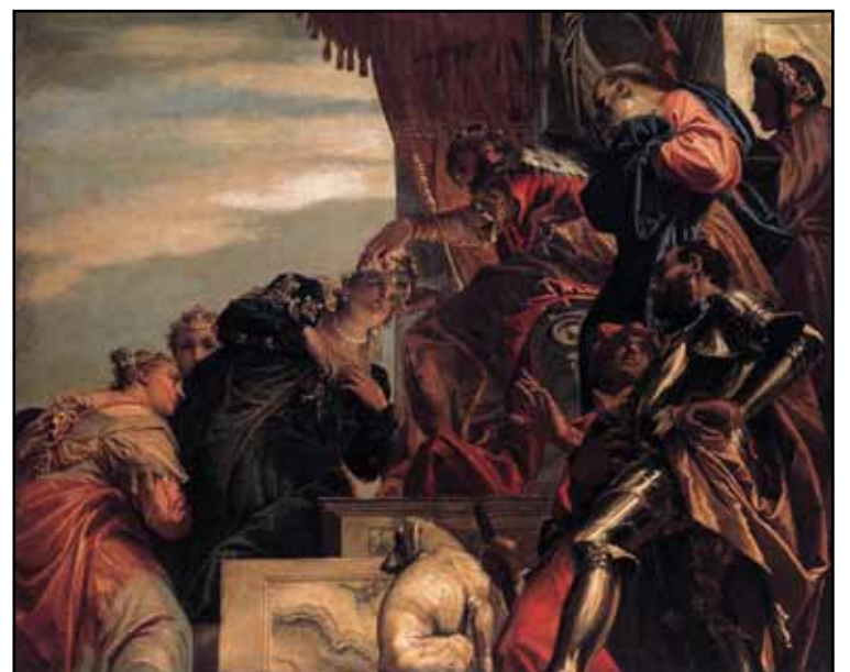
Коронавание Есфири. 1556

Еще одна картина из того же цикла – «Триумф Мардохея» (1556, церковь Сан-Себастьяно, Венеция).