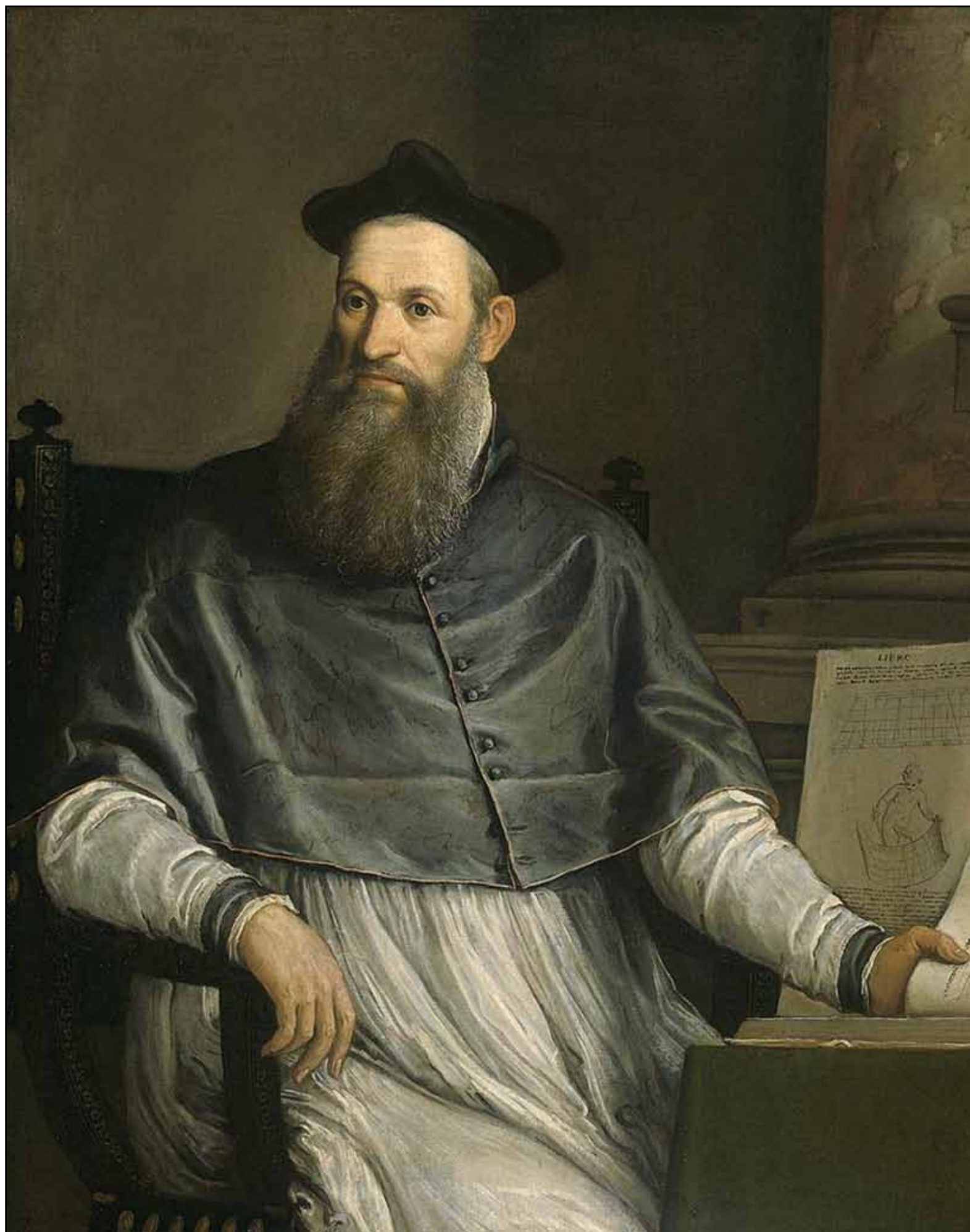
Портрет Даниеле Барбаро. 1561–1565