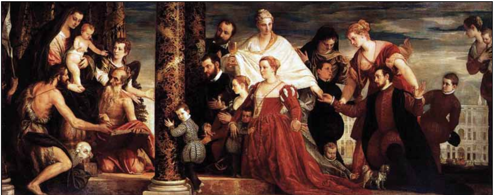
Мадонна семьи Куччина. 1570

авторов, комментатор Витрувия. Вилла стала триумфом сотрудничества трех выдающихся мастеров: архитектора (Палладио), живописца (Веронезе) и скульптора (Витториа).