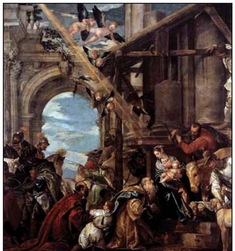
Поклонение волхвов. 1573

Фоном в работе служит фасад палаццо Куччина, (дворец сохранился до наших дней). Вся композиция в целом торжественна и пышна. Очарователен мальчик, нежно и чуть устало прильнувший к колонне из цветного мрамора. Но в выражении лица самого