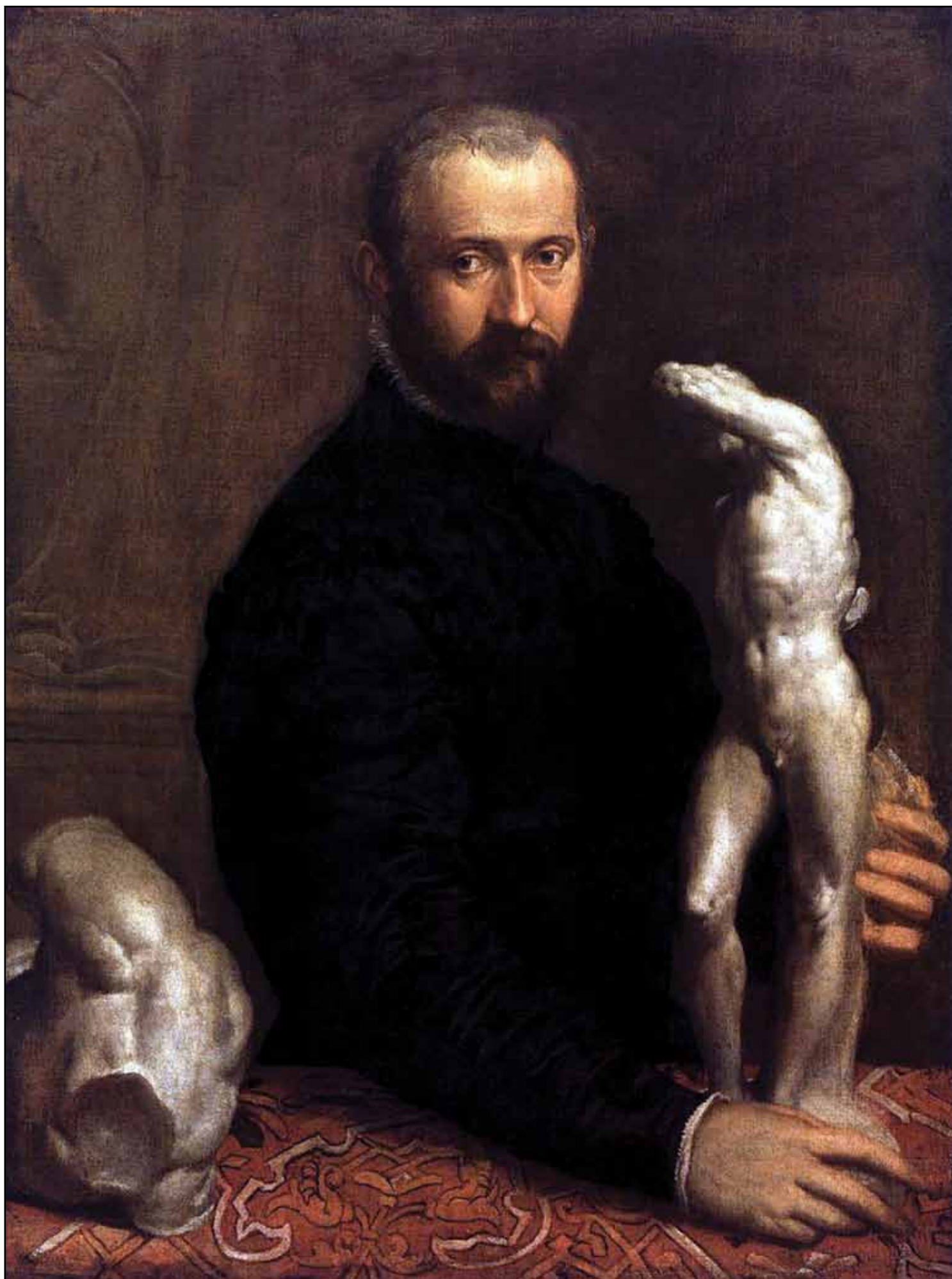
Портрет Алессандро Витториа. Около 1575