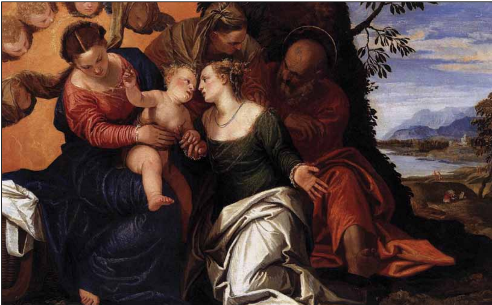
Мистическое обручение святой Екатерины. До 1550

знаменитый биограф итальянских художников, одним из наставников Паоло называет также веронца Джованни Карото.