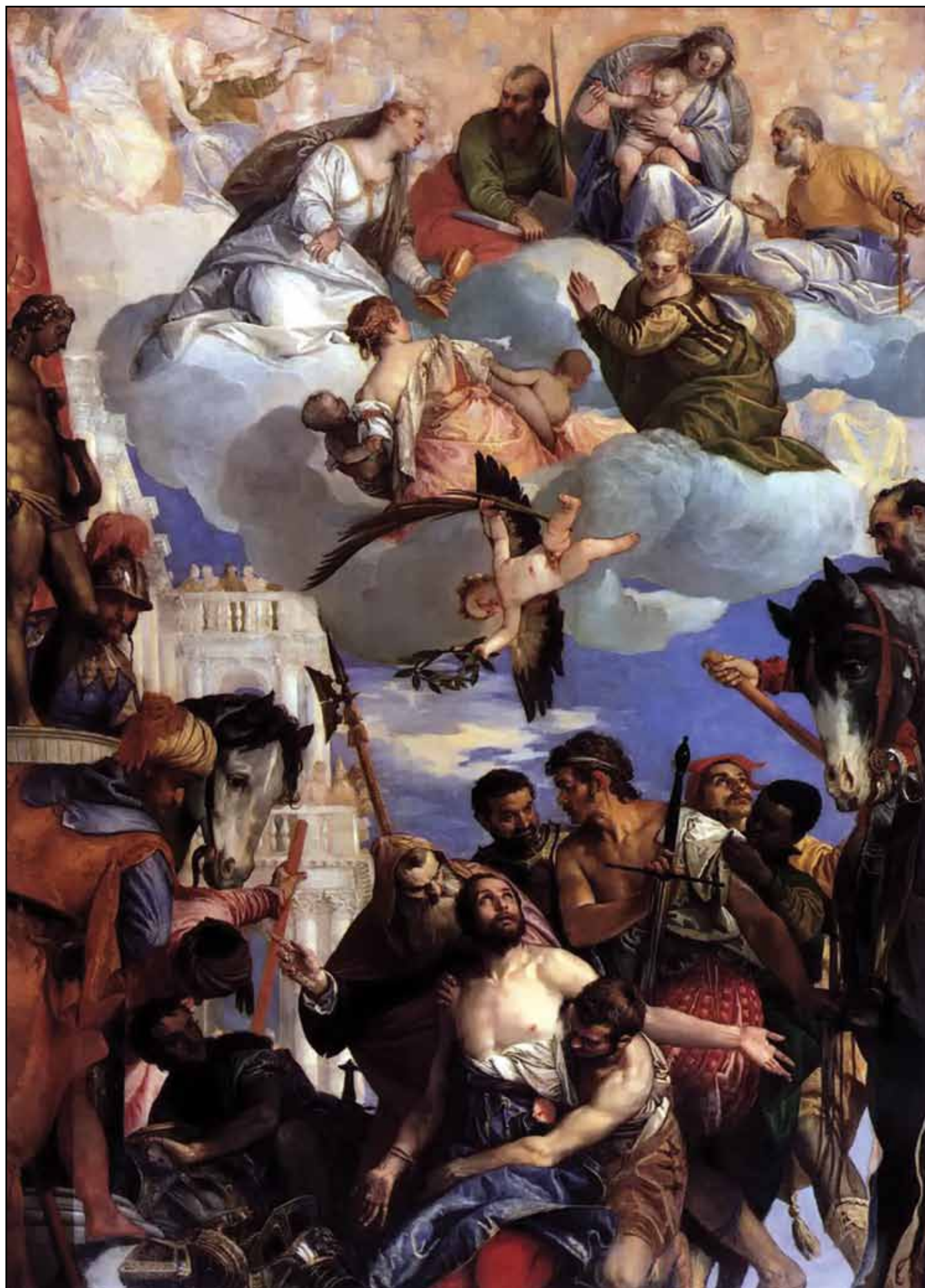
Мученичество святого Георгия. 1564