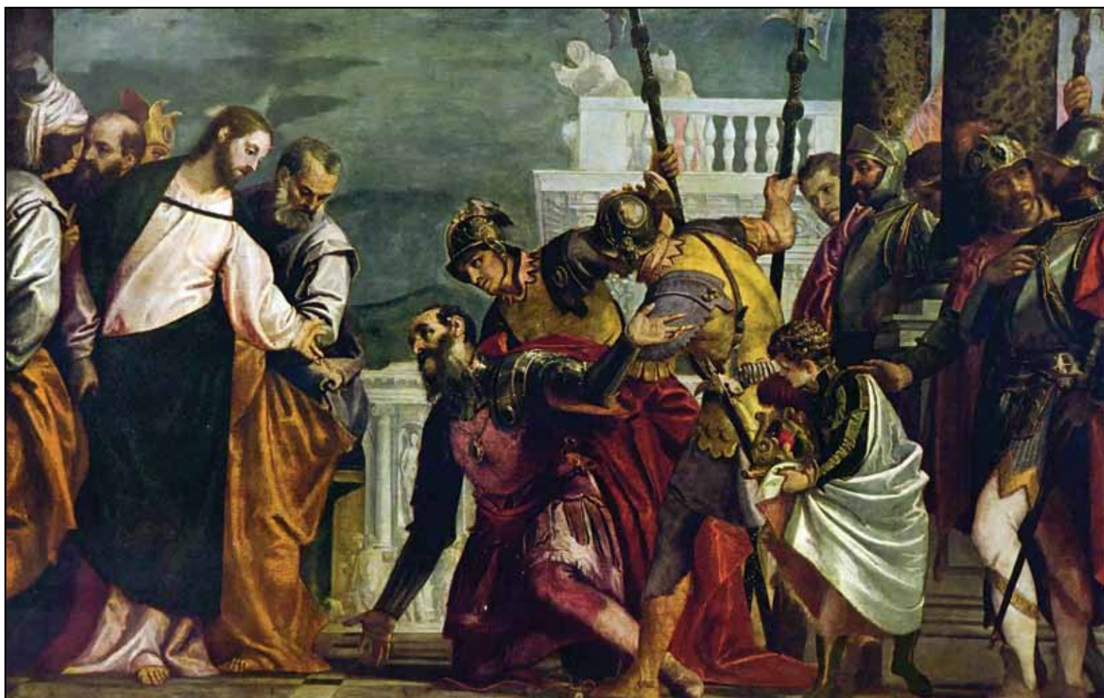
Христос и сотник из Капернаума. Вторая треть XVI века