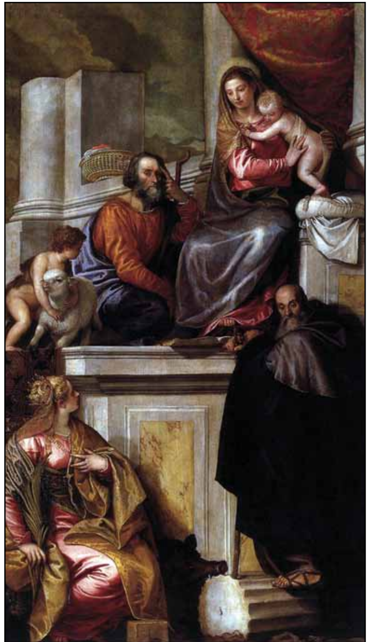
Пала Джустиниани. До 1553

Около 1553 Веронезе уже находился в Венеции, причем будучи известным художником. Дж. Вазари,