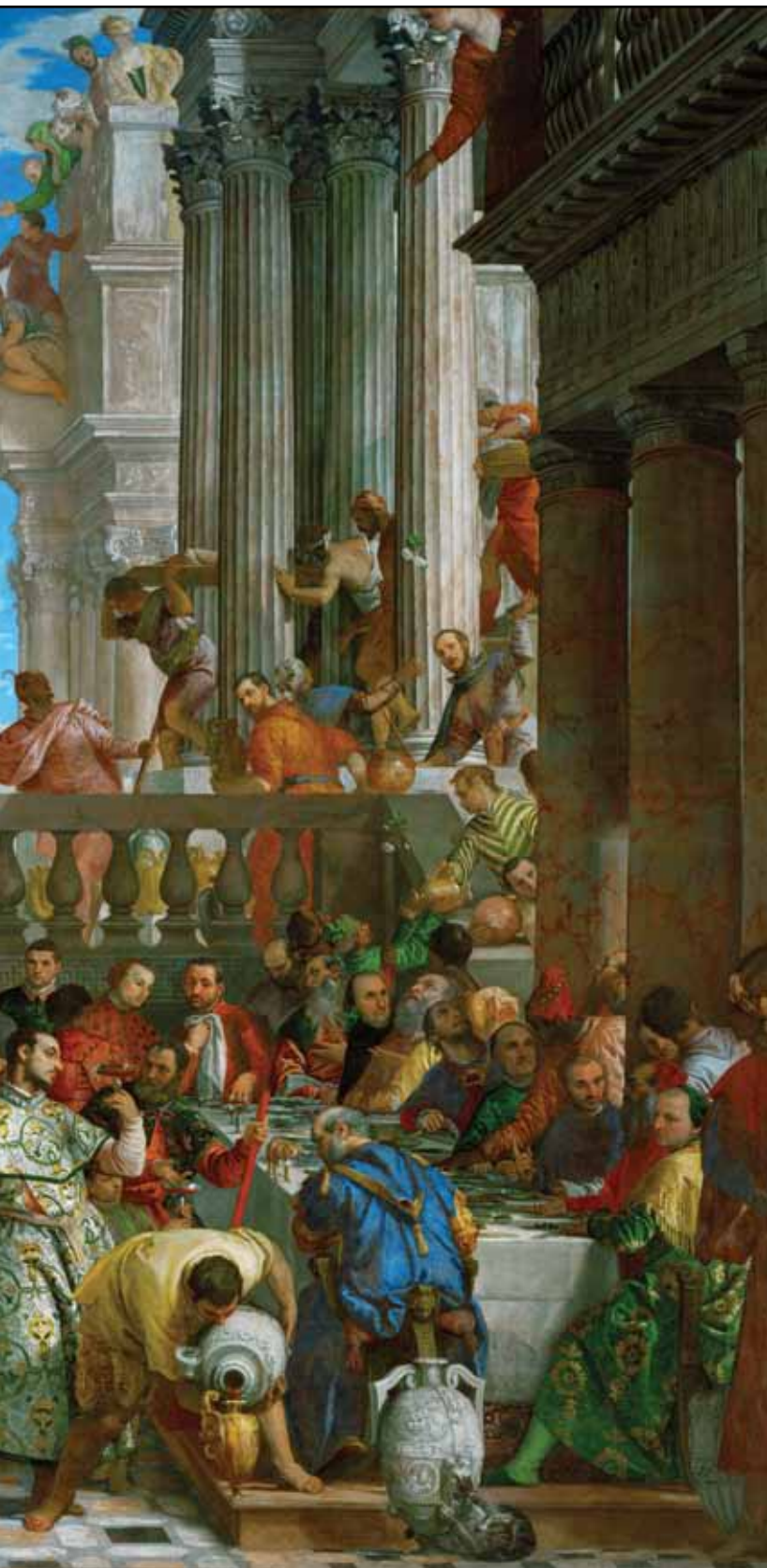
Брак в Кане. 1562–1563

трапезной монастыря работа висела 235 лет, пока Наполеон, захватив Италию, не переправил ее в Париж, где теперь она хранится в Лувре. Очень большое по размерам полотно (666x990; одно из самых больших в собрании Лувра 10 ) для транспортировки на корабле было разрезано пополам и уже в Париже вновь сшито. В посленаполеоновскую эпоху переговоры о реституции не привели к возвращению шедевра на родину; в