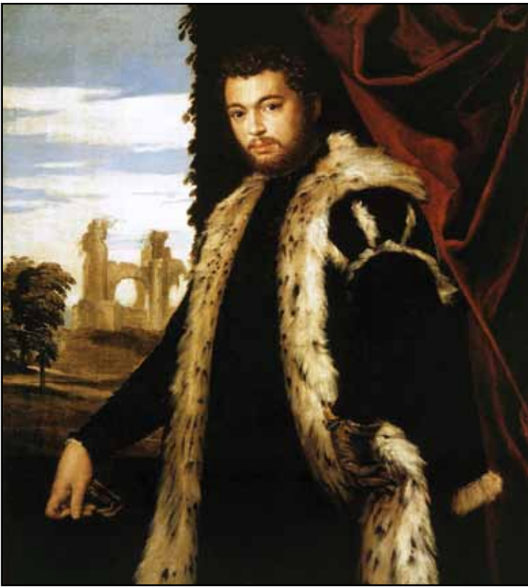
Портрет молодого человека в шубе из меха рыси. Около 1551–1553

композиции) – с портретами кисти Тинторетто 1540-х. Кто был моделью для художника – не установлено. В собрании Пальфи, откуда полотно поступило в будапештский Музей изобразительных искусств, оно значилось как портрет мужчины из семьи Мочениго. Веронезе изобразил, по-видимому, того же самого молодого мужчину, которого запечатлел Тинторетто в облике библейского царя Давида на картине, хранящейся в одном английском частном собрании. Роскошная шуба из рысего меха со всей очевидностью свидетельствует об аристократизме этого дворянина. Архитектурные руины на заднем плане заставляют задуматься о работах нидерландского гравера и издателя гравюр Иеронима Кока (известного в Италии): его творения наполнены символическим значением. Руины на полотне Веронезе, как и у Кока, напоминают зрителю о былом величии Рима.