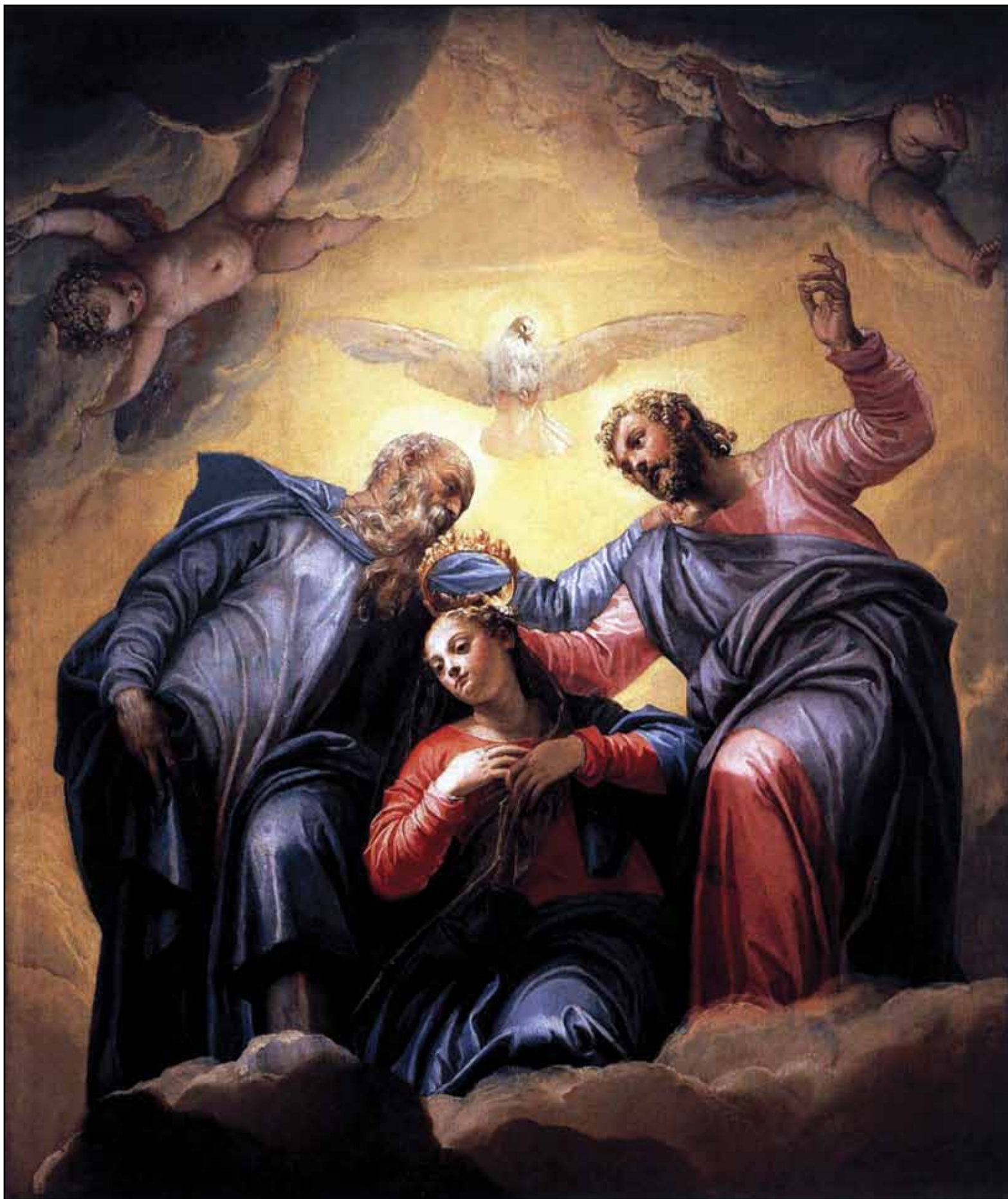
Коронавание Девы Марии. 1555

На потолке сакристии расположена работа «Коронавание Девы Марии» (1555, церковь Сан-Себастьяно, Венеция). Произведение обрамлено изо-