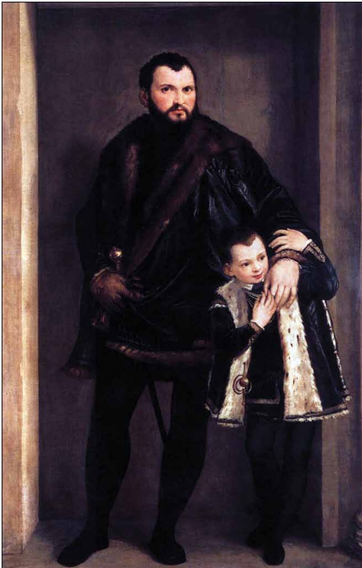
Портрет графа Джузеппе да Порто с сыном Адриано. 1551–1555