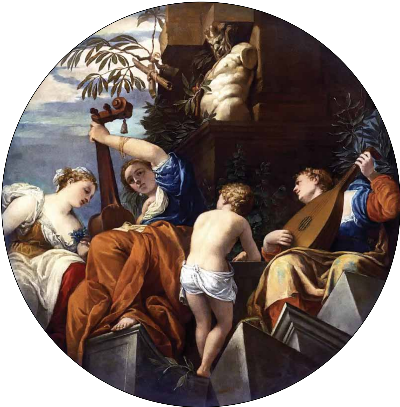
Аллегория музыки. 1556–1557

Она иллюстрирует победу Мардохея над заговорщиком Аманом, «вторым по царю». Впечатляет артистичность движений сильных и красивых человеческих фигур, великолепные ракурсы вздыбленных коней. Радуют глаз сила и легкость звонких цветовых сочетаний, например сопоставление белого и вороного коней. Мардохей изображен в центре, между двух коней, с атрибутами царской власти. Интересно, что сам Артаксеркс представлен очень скромно: он вместе с Есфирью наблюдает за происходящим с балкона своего дворца, и его фигура кажется совсем незначительной