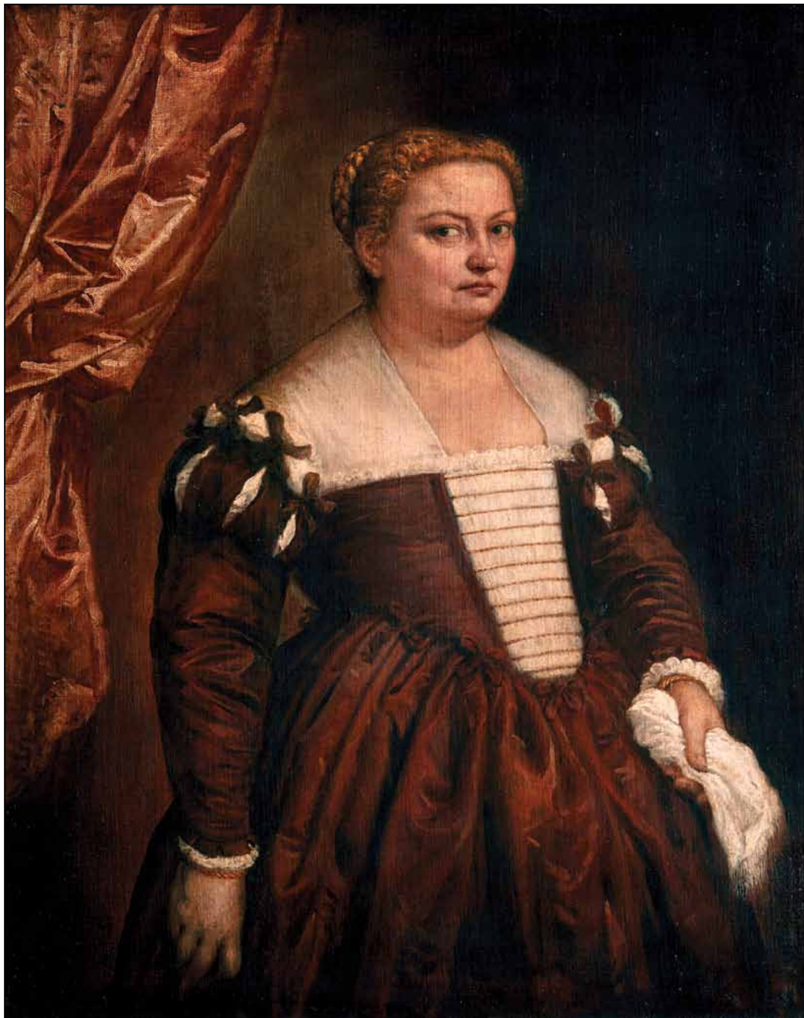
Портрет венецианки. 1560-е