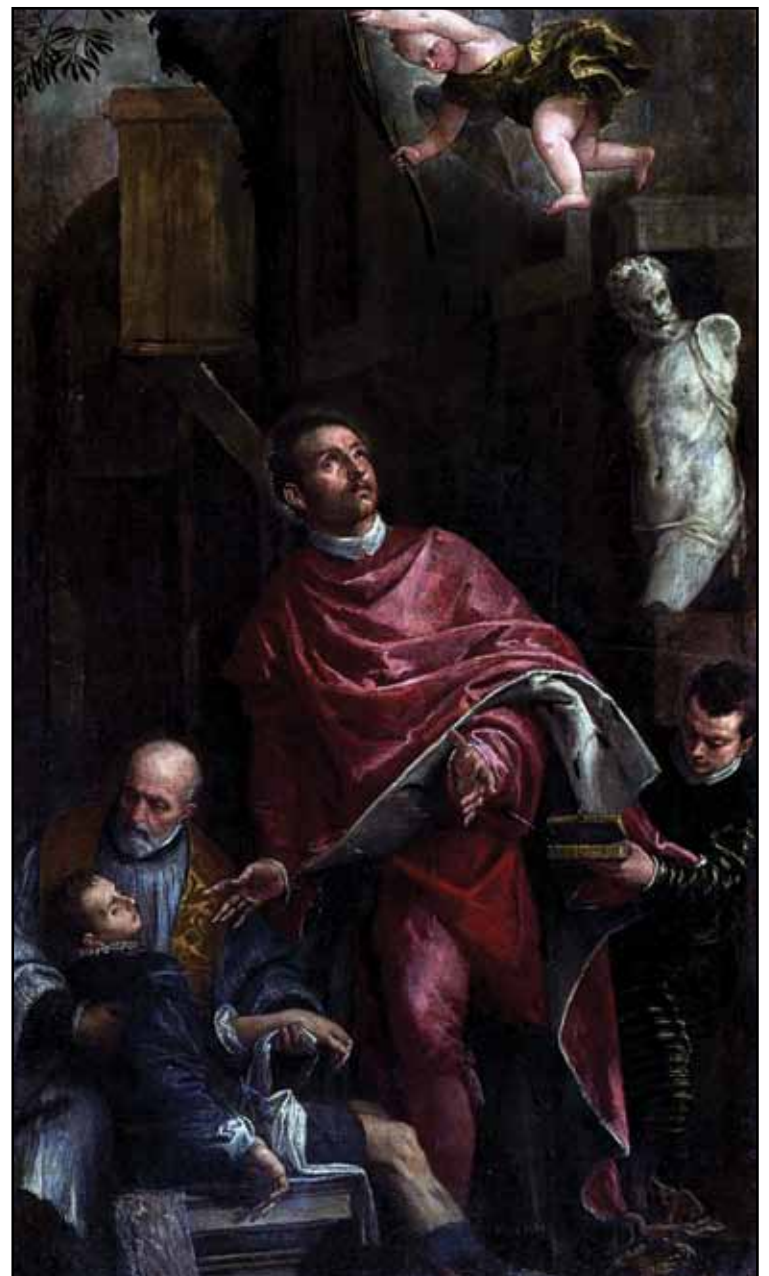
Пантелеймон, исцеляющий мальчика. 1587–1588