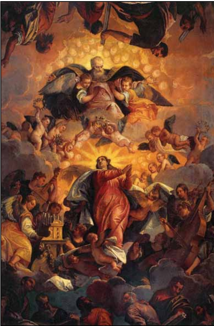
Вознесение Девы Марии. 1585–1587

Интересно, что костюмы всех персонажей выглядят анахронизмом. Здесь нет и намека на персидские одежды членов семьи Дария, наоборот – на женских роскошных нарядах венецианских патрицианок времен Веронезе (восточный колорит отражают лишь тюрбаны на персонажах заднего плана). Что же касается воинов, то их одеяния – это сочетание коротких платьев, которые носили в античности, с облачением средневековых рыцарей.