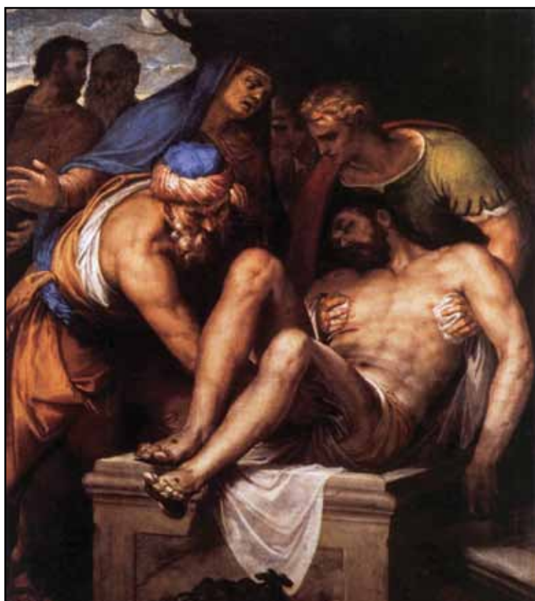
Положение во гроб. Около 1550

ловека в шубе из меха рыси» (Музей изобразительных искусств, Будапешт). В стиле произведения усматривают сходство, с одной стороны, с работами ломбардского живописца Моретто да Брешиа, с другой (в структуре