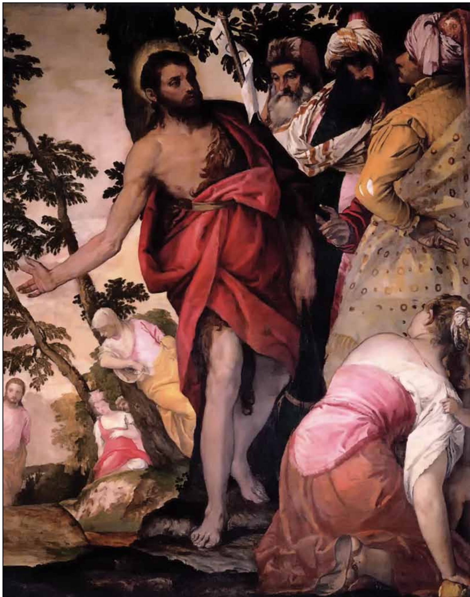
Проповедь Иоанна Крестителя. Около 1562