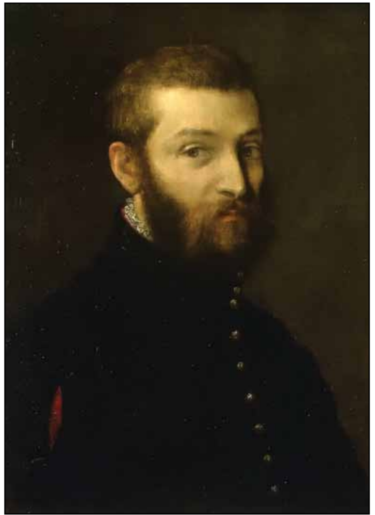
Автопортрет. Между 1558 и 1563

На протяжении 1560-х живописец был активно занят украшением загородных владений венецианских аристократов. Вилла Мазер – триумф сотрудничества художника с архитектором Андреа Палладио. Программа росписей была составлена, судя по всему, Даниелем Бербаро. Основной идеей было связать жизнь обитателей виллы с определенными понятиями и категориями – временем, историей, верой, милосердием, супружеской любовью, земледелием. Этим темам посвящены отдельные залы. Кроме того, центральную часть свода в каждом зале украшают мифологические и аллегорические композиции. Здесь мастерство Ве-