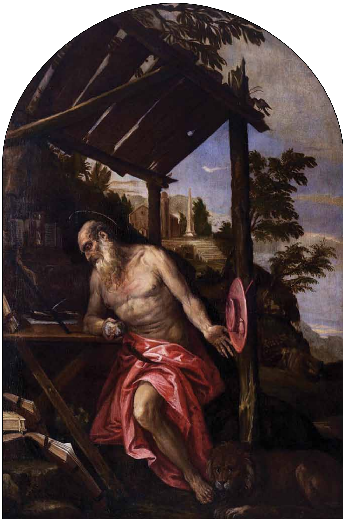
Святой Иероним. Около 1580