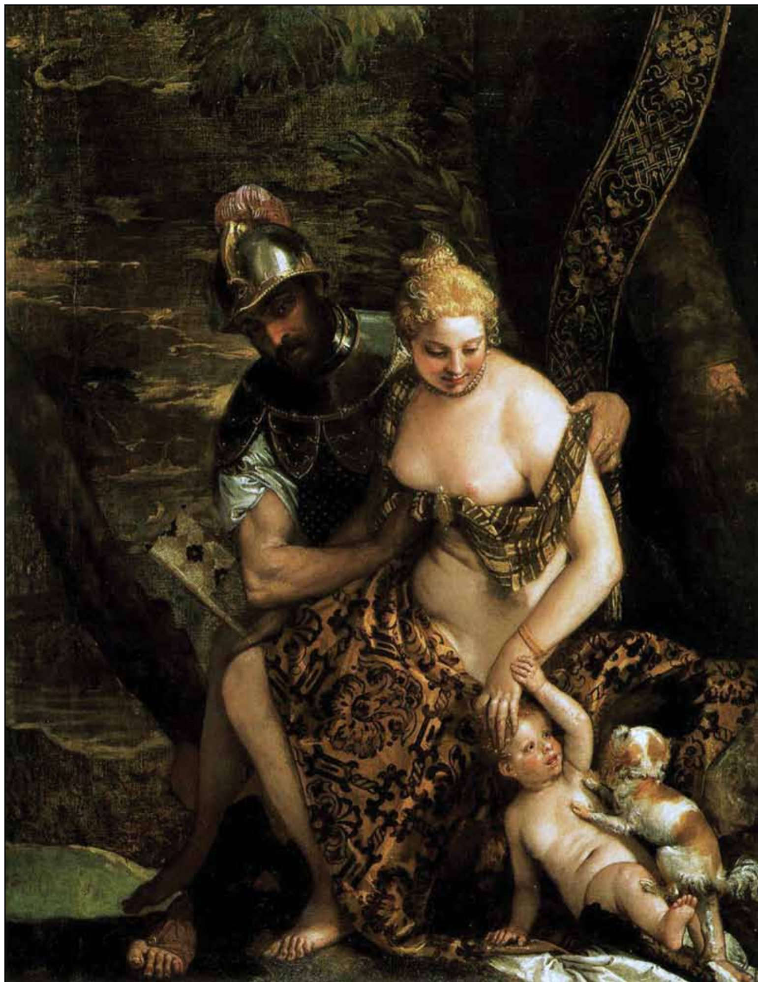
Марс и Венера. Фрагмент. 1570-е