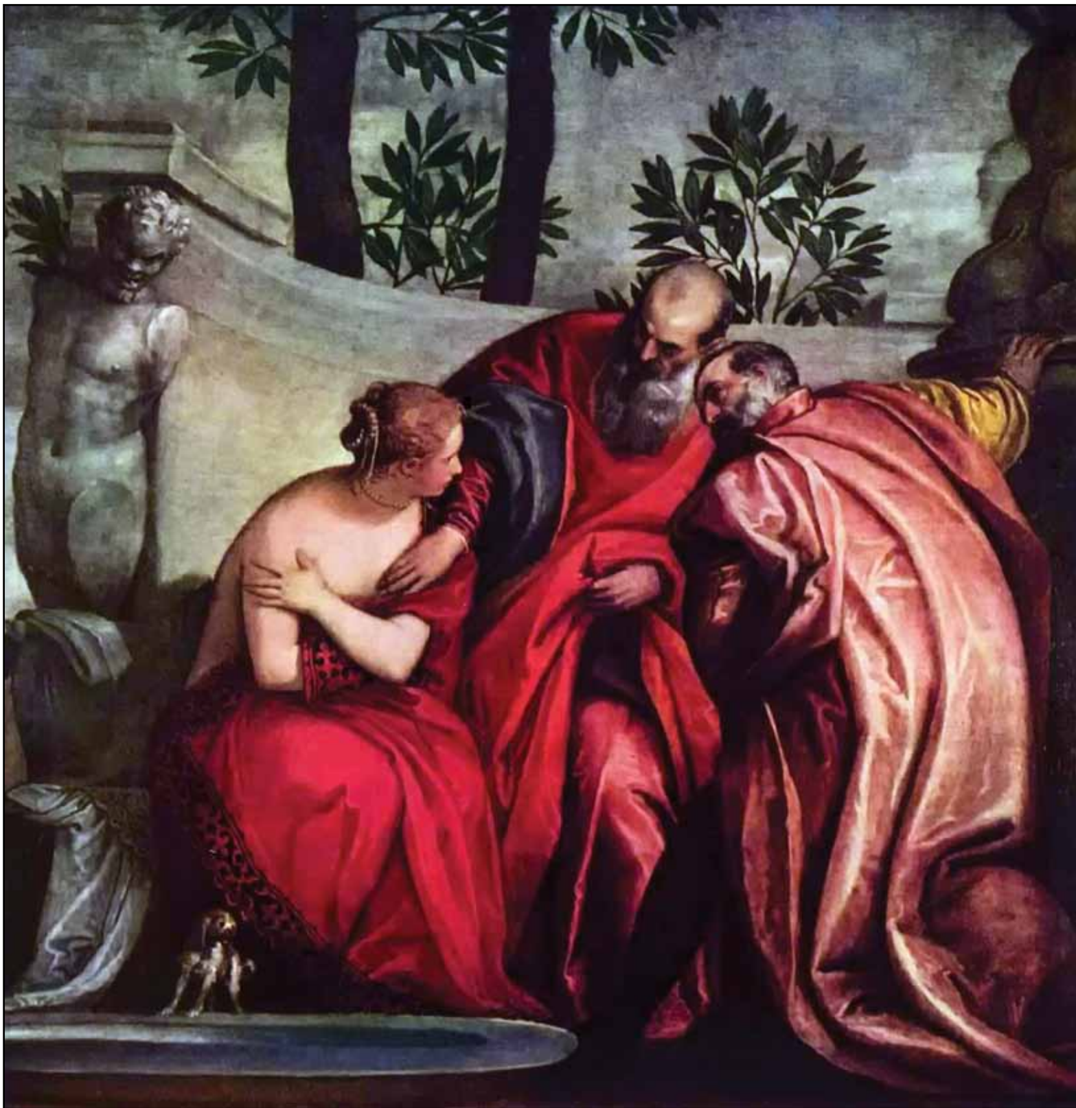
Купание Сусанны. Вторая треть XVI века

много фигур. В.: <...> Вы считаете уместным изображать на Тайной вечере Господа шутов, пьяниц, карликов и подобные вульгарности? О: Нет, Ваше преосвященство. В.: Тогда почему вы так сделали? О.: Потому что полагал, что эти люди находятся вне комнаты, в которой происходила Тайная вечеря» 15 .