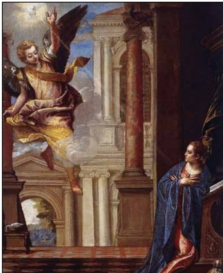
Благовещение. Фрагмент. Около 1560