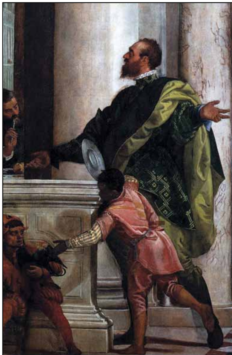
Пир в доме Левия. Фрагмент