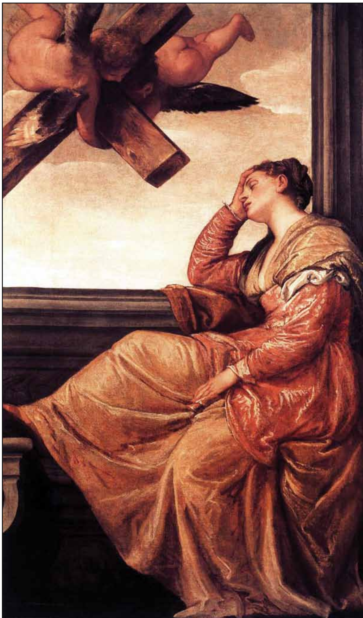
Видение святой Елены. 1575–1578