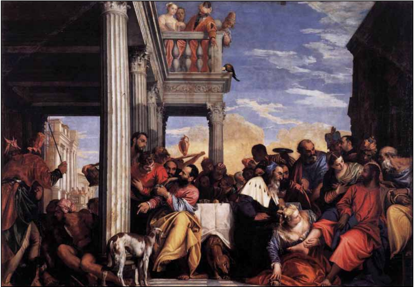
Пир в доме Симона-фарисея. Около 1565