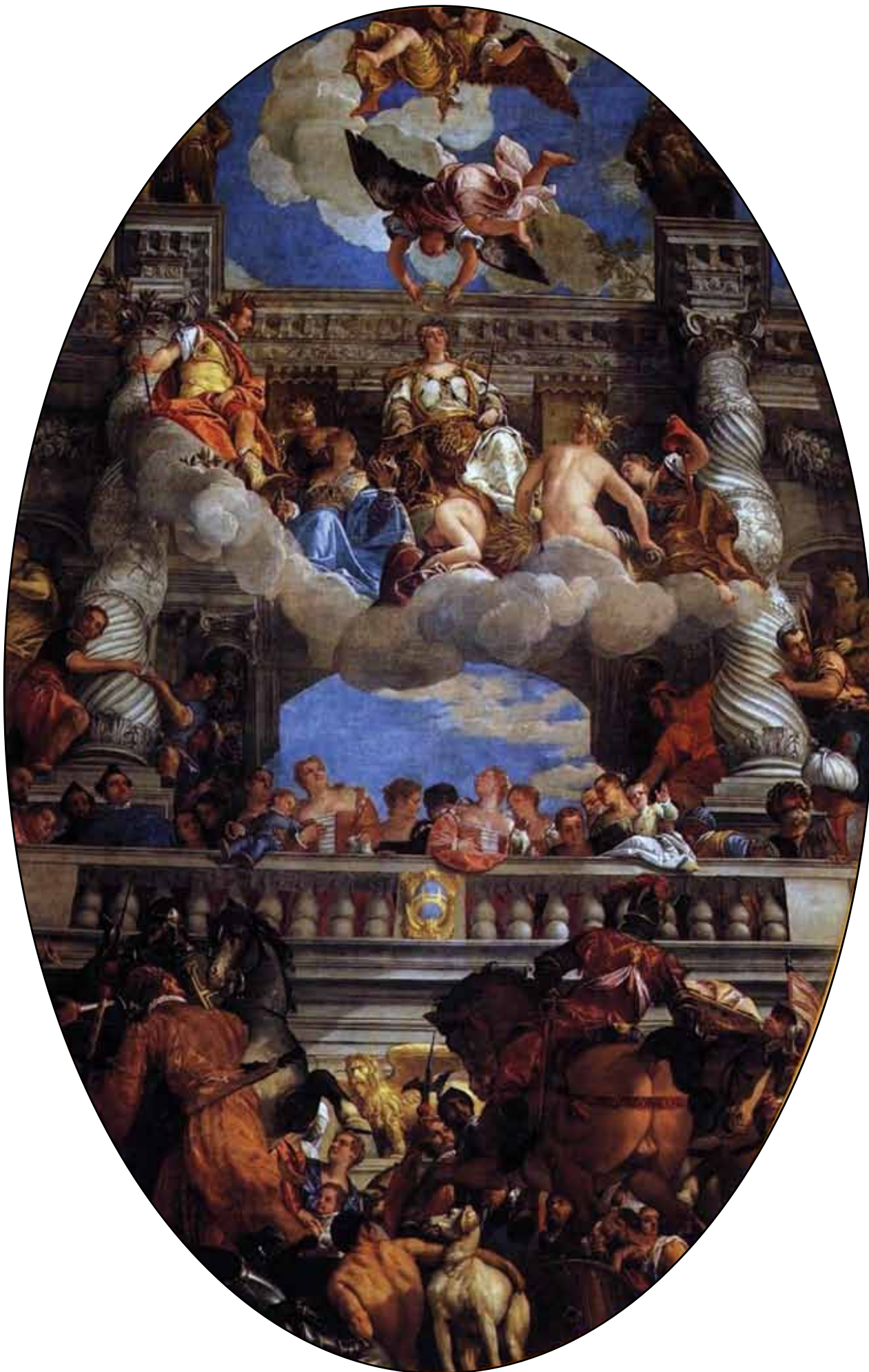
Триумф Венеции. 1579–1582