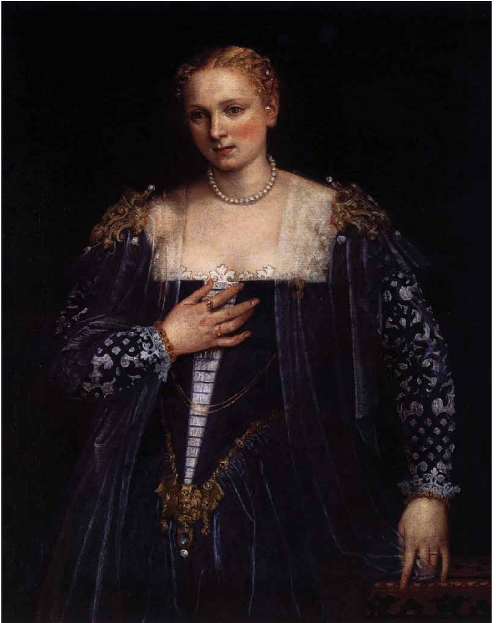
Белла Нани. 1560-е