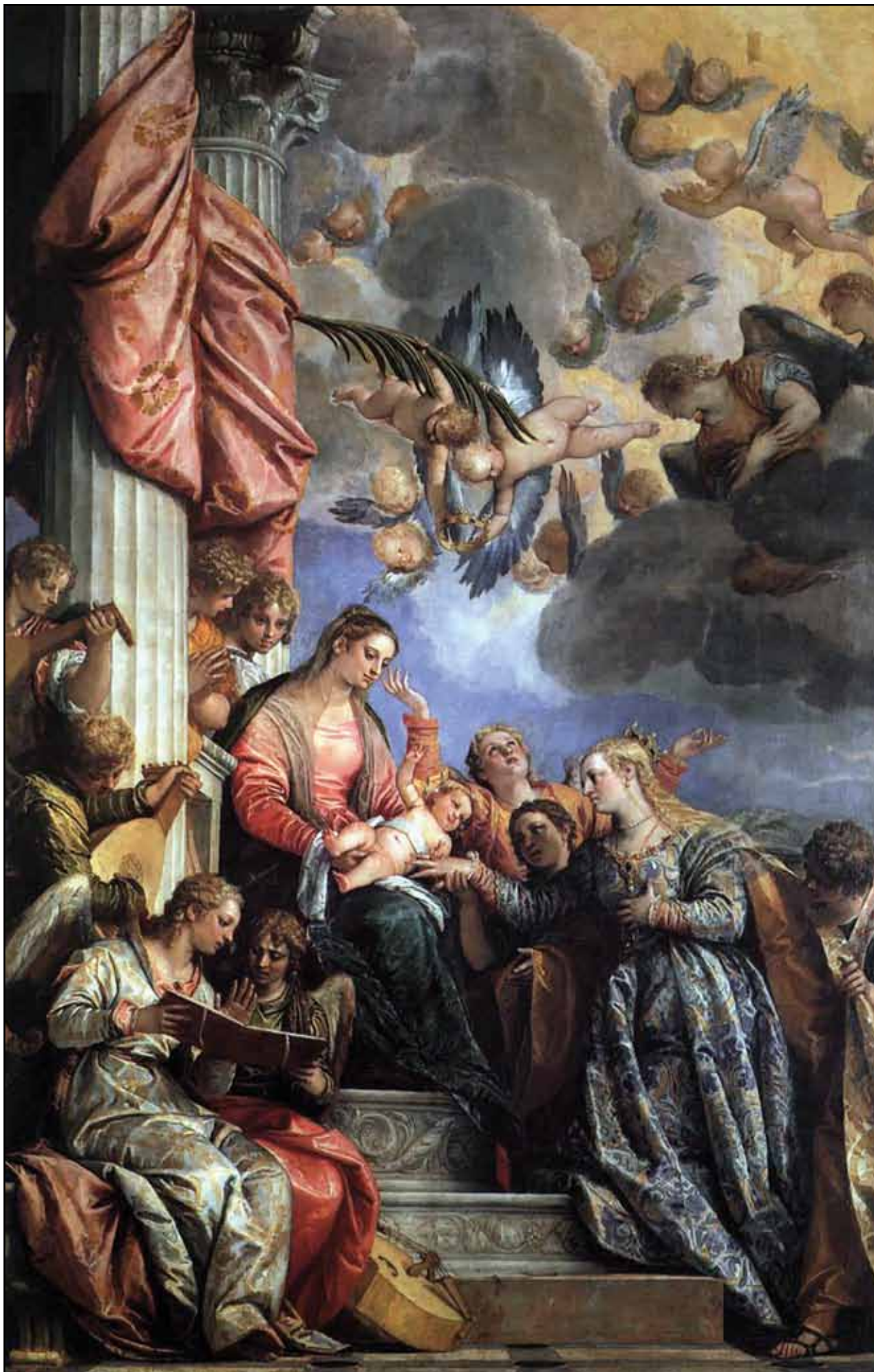
Мистическое обручение святой Екатерины. Около 1575