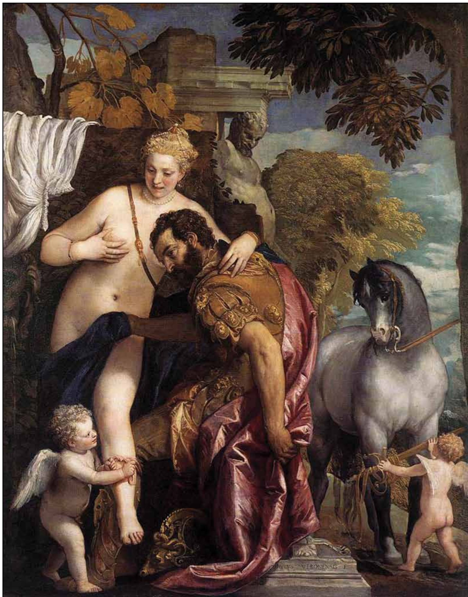
Марс и Венера. Около 1570