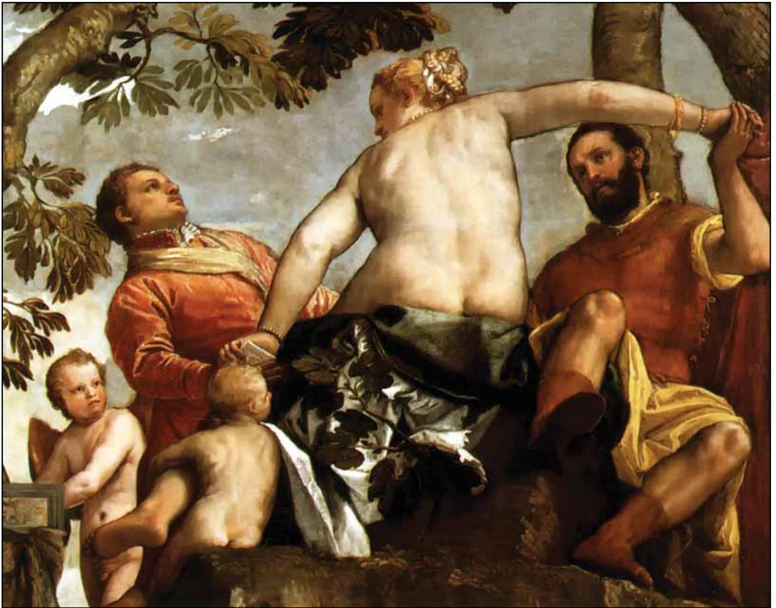
Измена. Фрагмент. Около 1565

Куччина мастер передает чувство некоей горечи и скрытой тревоги.