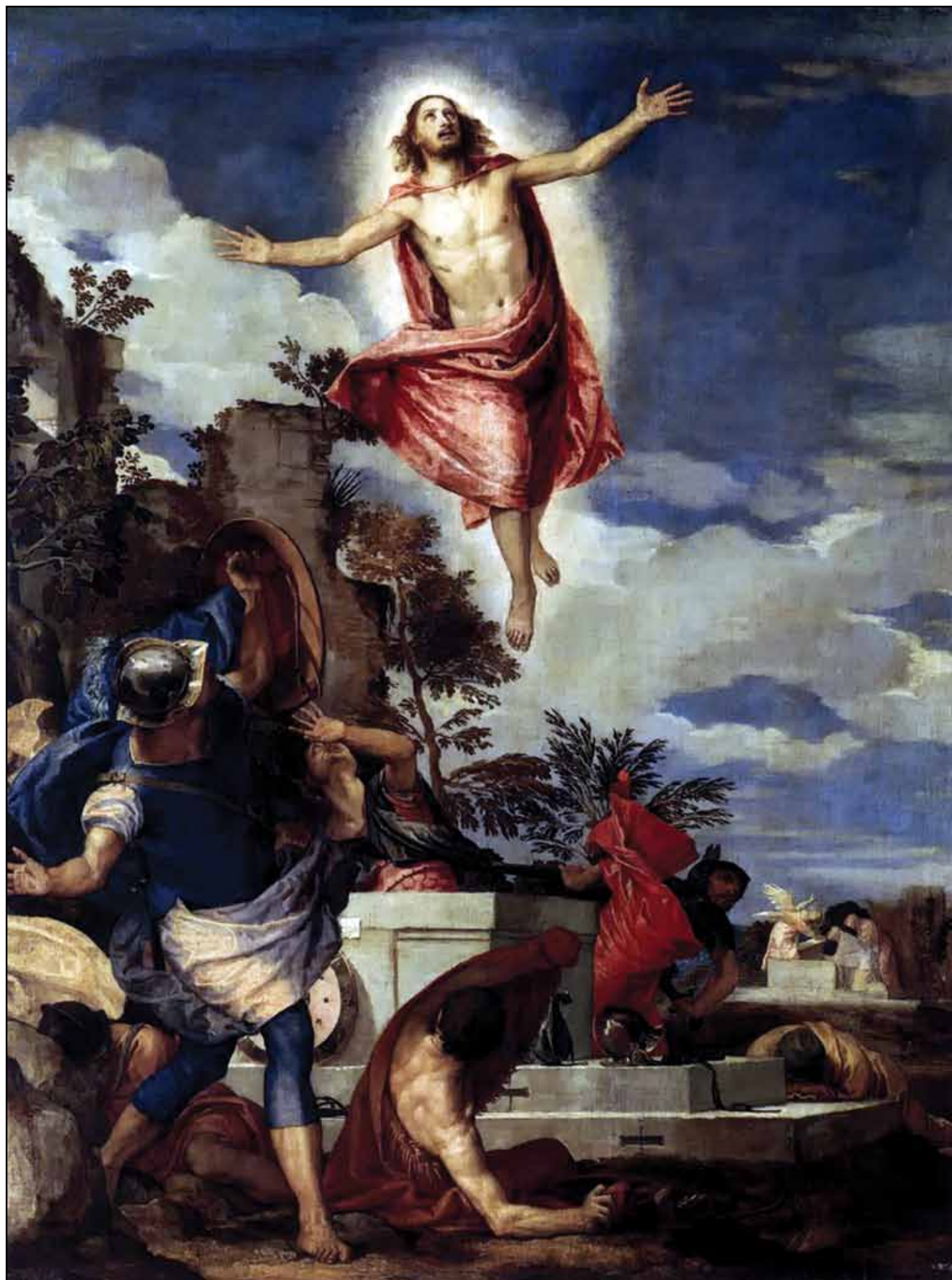
Воскресение Господне. 1570–1575