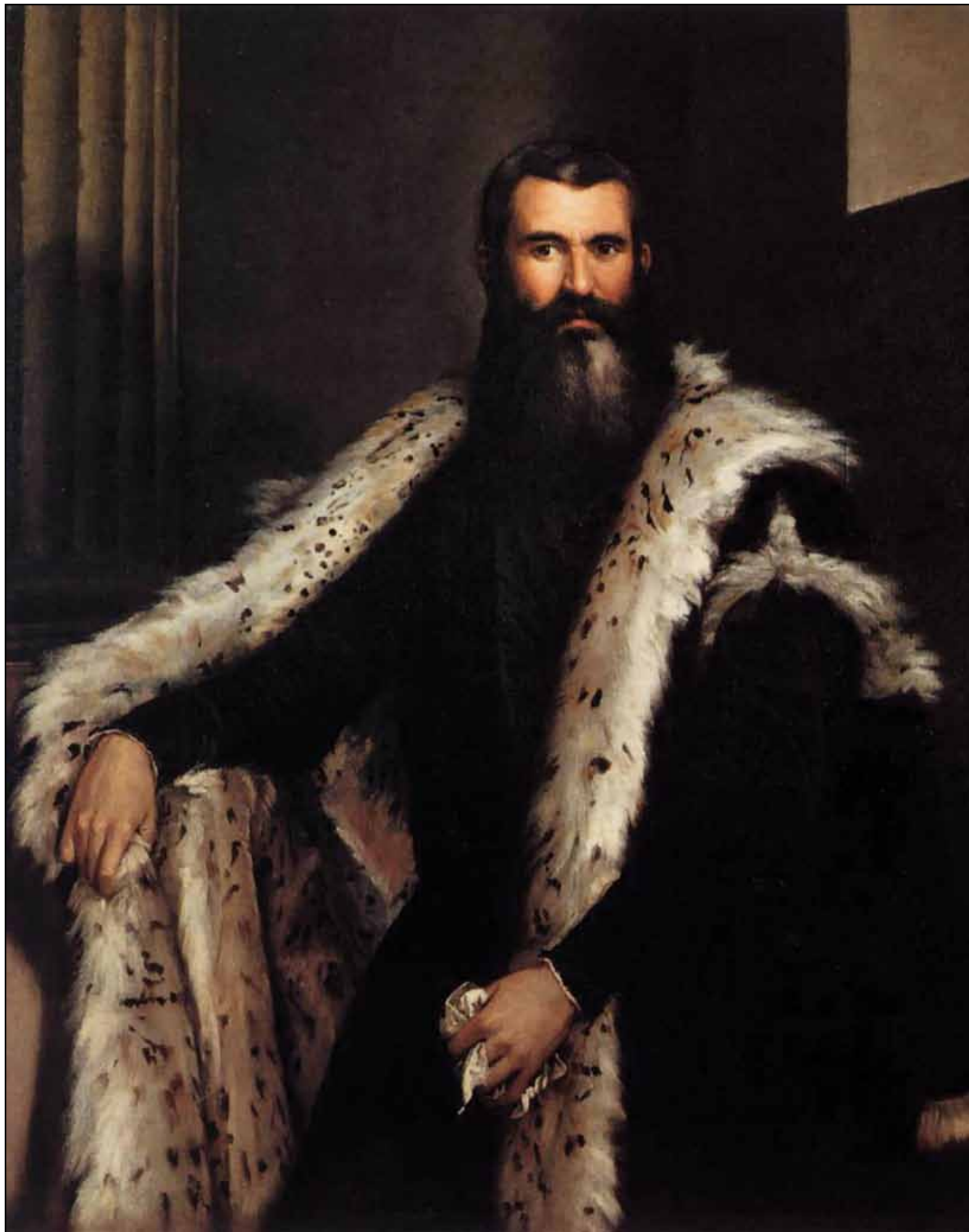
Портрет Даниеле Барбаро. 1562–1570