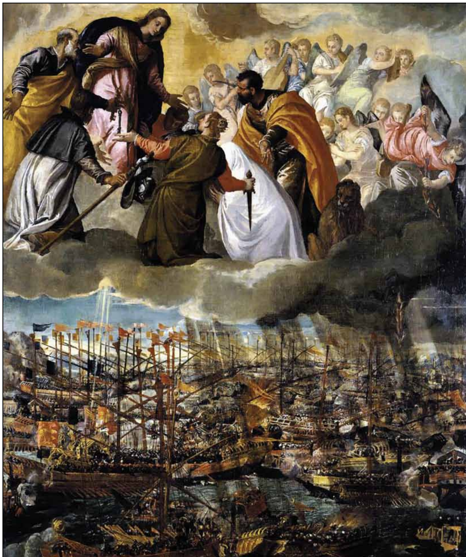
Творение на злобу дня

В еронезе принадлежит серия работ, прославляющих Священную лигу и победу над турками в битве при Лепанто 7 октября 1571. Предполагается, что по-