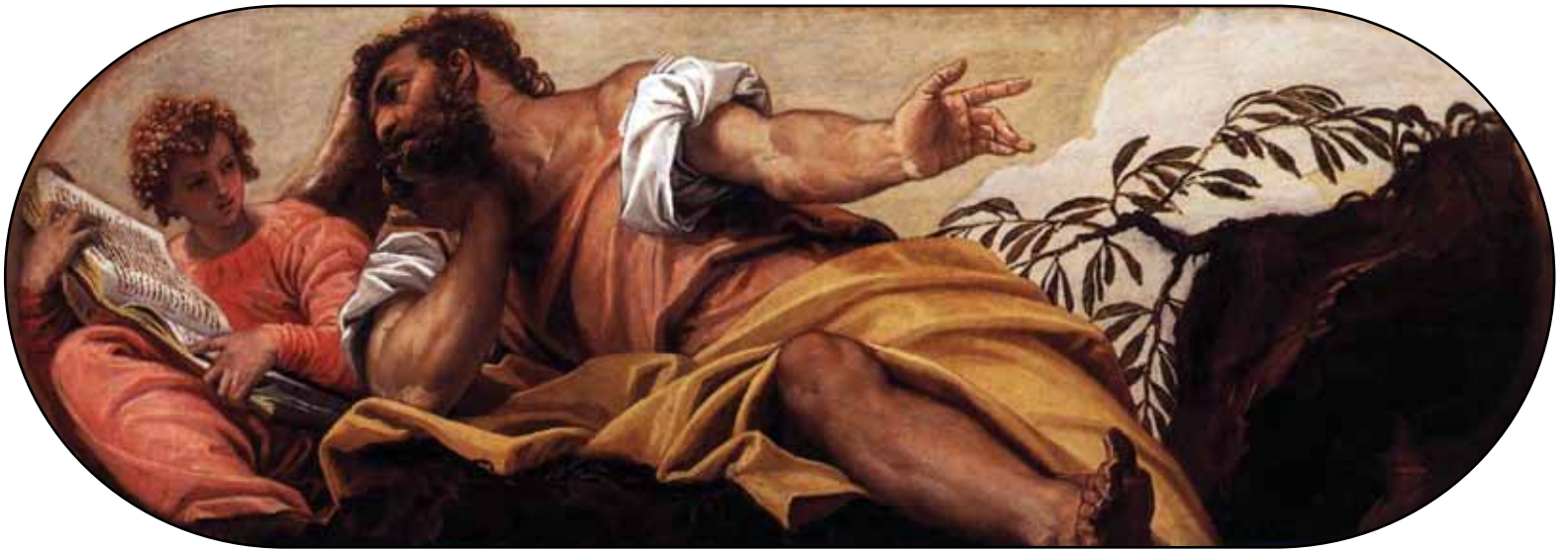
Евангелист Матфей. 1555

В алтарной части церкви – цикл «История Есфири» – один из лучших кисти молодого Веронезе.