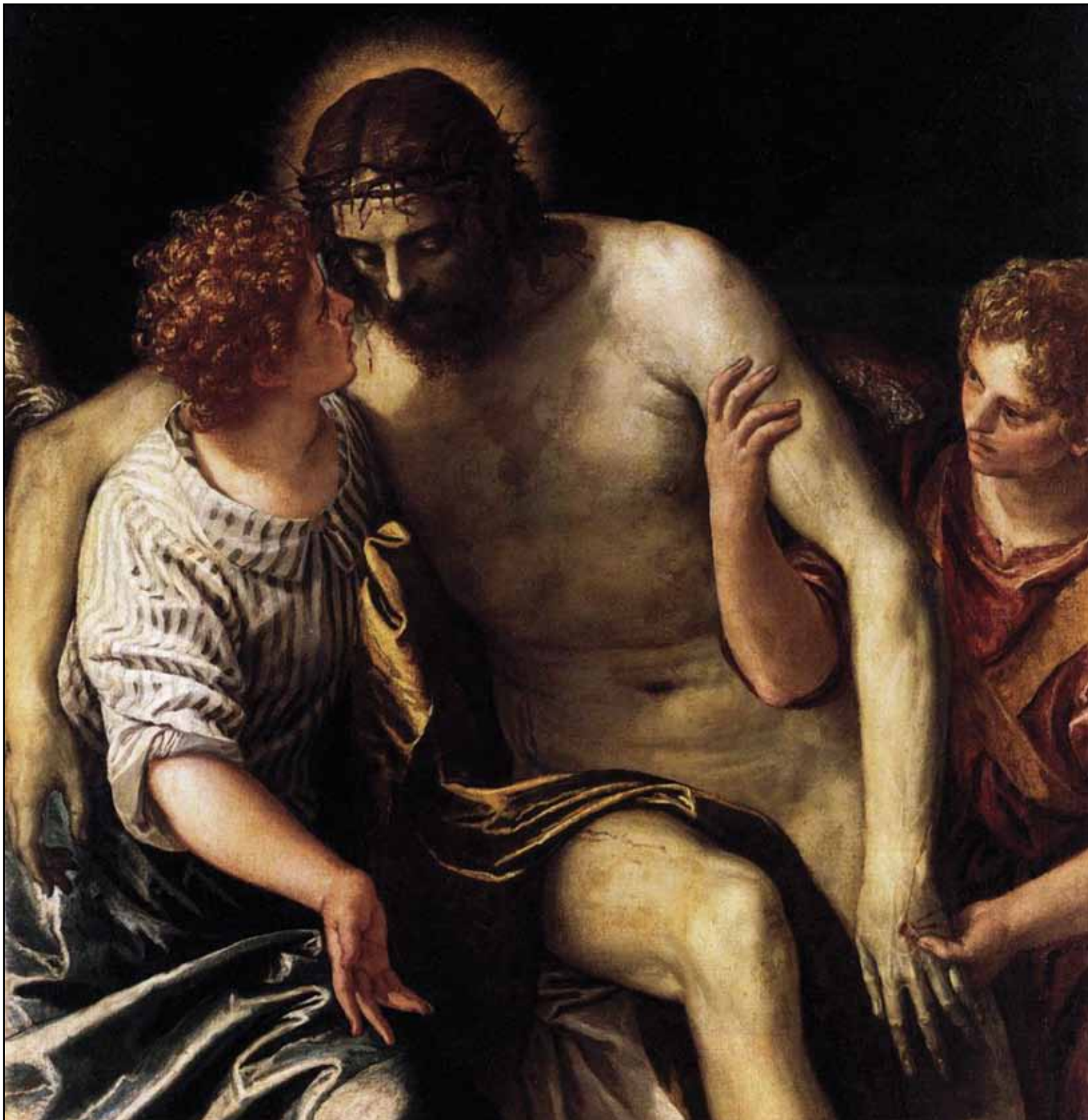
Мертвый Христос, поддерживаемый двумя ангелами. Около 1587–1589

последующие поколения художников. Одно из явных доказательств – картина на тот же сюжет кисти Гаспара Дизиани (около 1740, частное собрание), написанная полтора столетия спустя, но имеющая ясно читаемые «цитаты» из работы веронца.