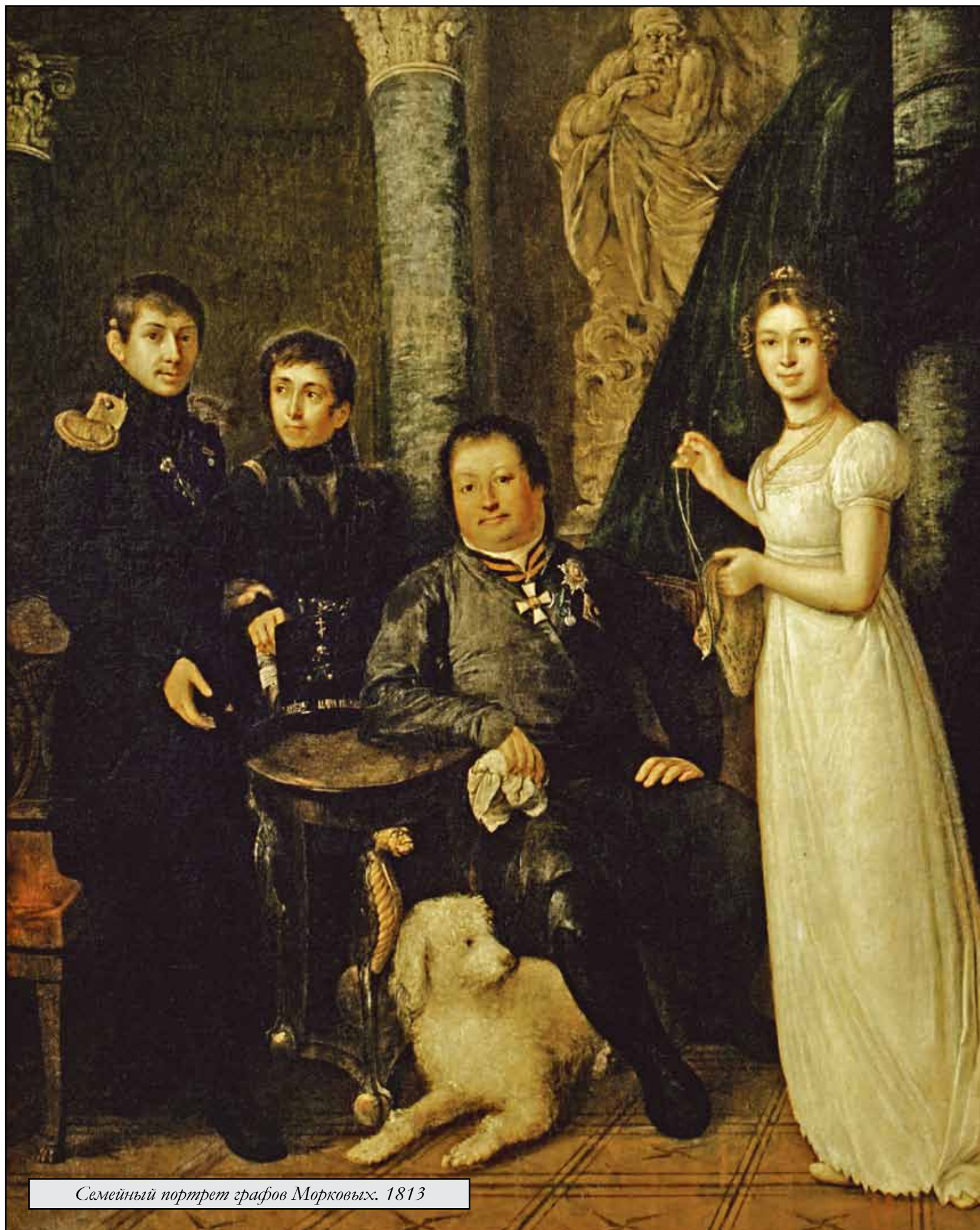
Семейный портрет графов Морковых. 1813