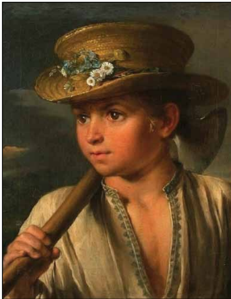
Мальчик с топориком. 1810

В то время по уставу Академии на казенное обучение принимались только мужчины, имевшие официальную свободу, а крепостные могли быть лишь вольнослушателями, да еще и за плату. И хотя к таким студентам отношение педагогов было небрежным, за те шесть лет, что Тропинин провел в оригинальном, гипсовом, натурном и живописном классах, он многого достиг. Азы художественного ремесла будущий портретист постигал в мастерской своего педагога, знаменитого живописца – профессора Степана Семеновича Щукина (1758–1828). За ученические рисунки Василий получал золотые и серебряные медали, одаренному юноше симпатизировали некоторые преподаватели Академии и старались поддерживать его. Из-за этого у Тропинина среди соучеников появились завистники, но зато он подружился с будущим известным гравером Егором Осиповичем Скотниковым (около 1780–1843) и художником Орестом Адамовичем Кипренским (1782–1836). Последний считался в Академии очень образованным юношей, имеющим во всем смелость суждений. Его свободолобивые и гордые мысли сильно повлияли на скромного Тропинина и вскоре заставили молодого художника по-иному взглянуть на самого себя.