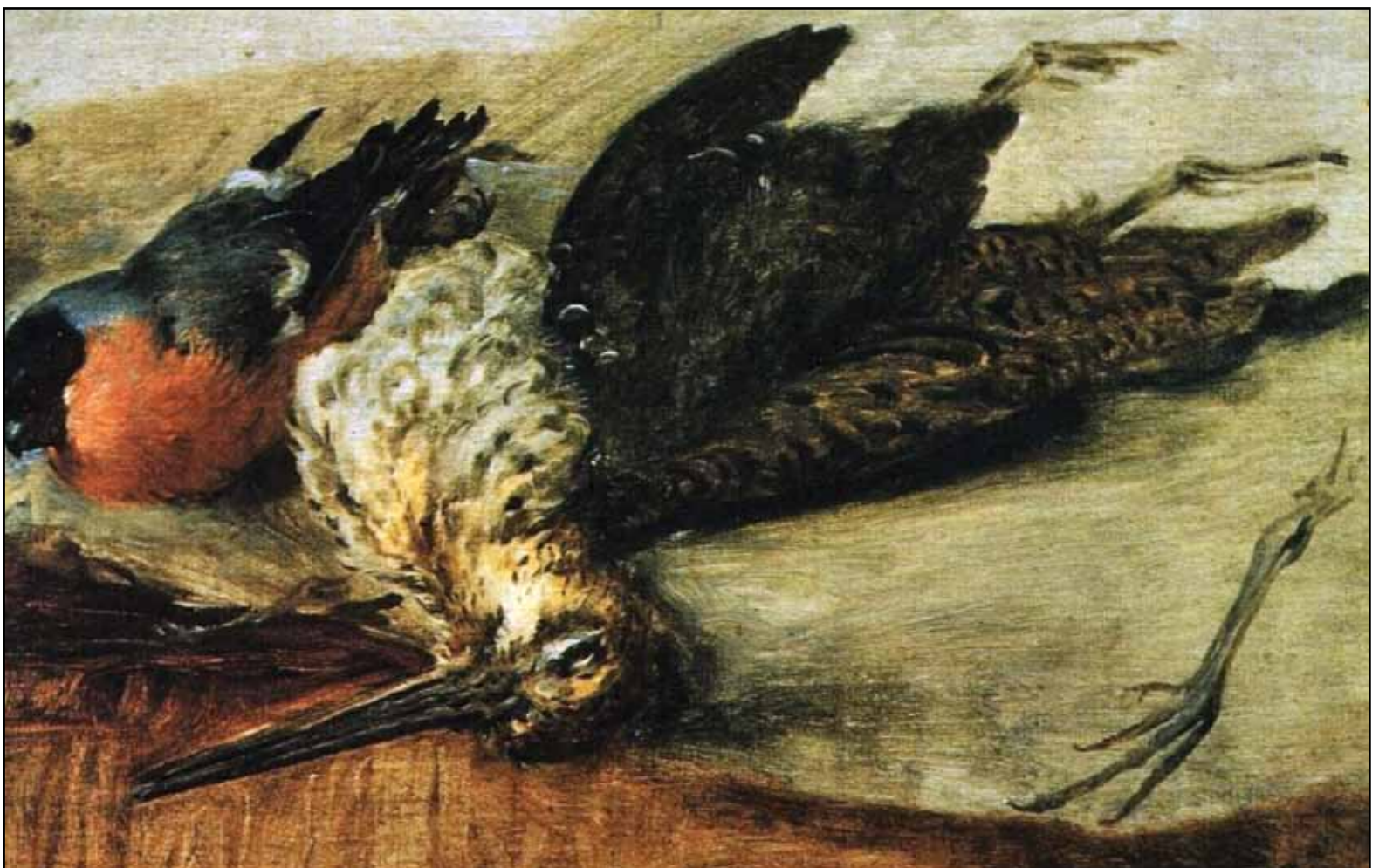
Дупель и снегирь. Этюд. 1820-е