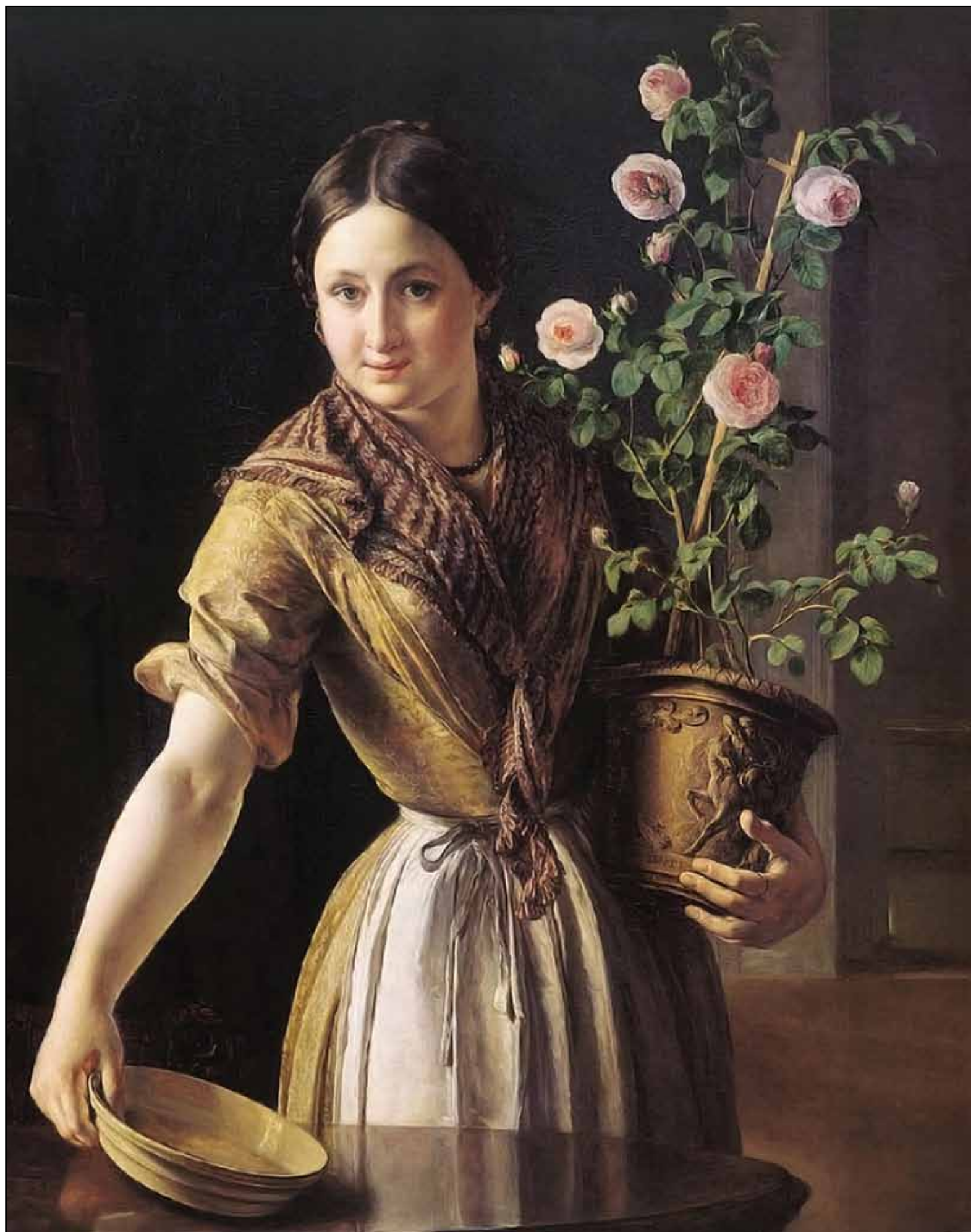
Девушка с горшком роз. 1850