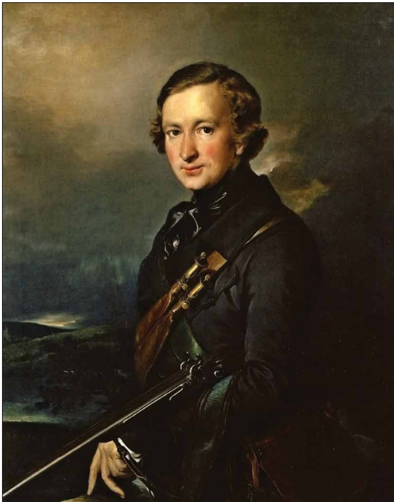
Портрет Ю. Ф. Самарина в охотничьем костюме. 1846