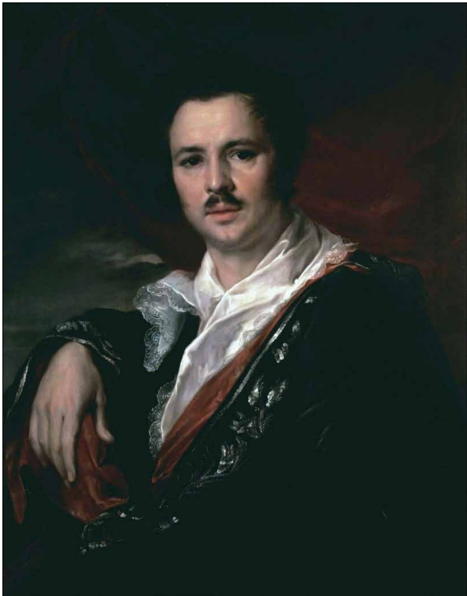
Портрет Н. А. Майкова. 1821