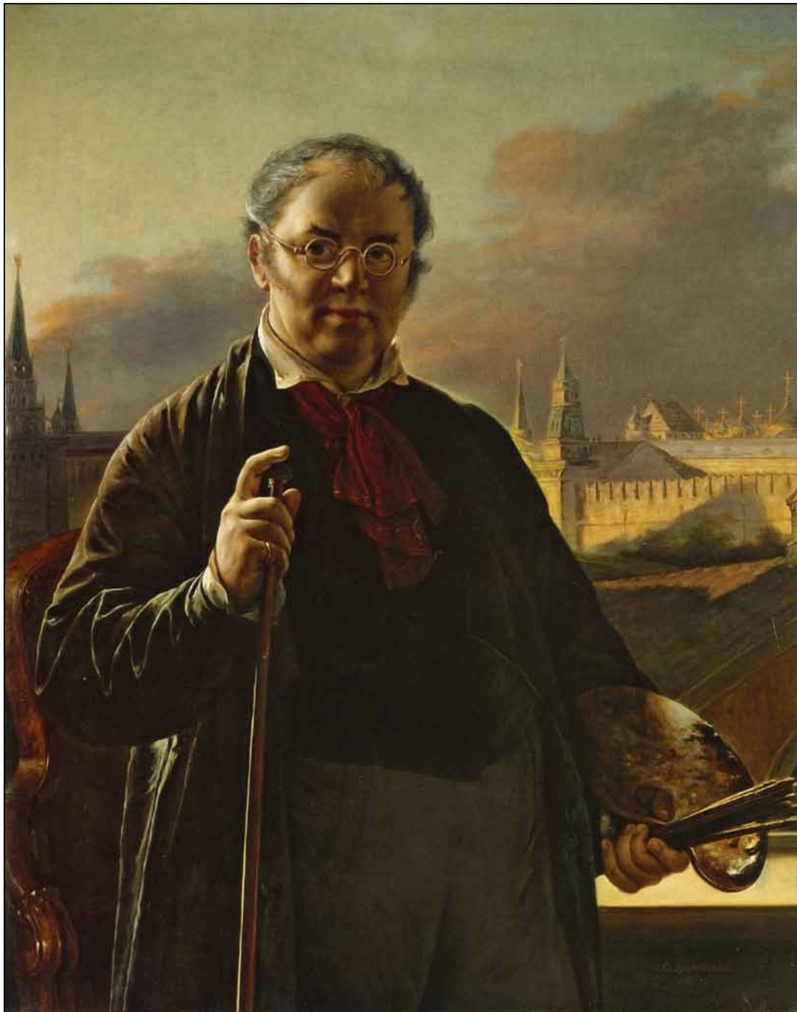
Автопортрет на фоне окна, с видом на Кремль. 1846