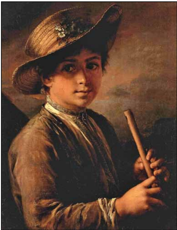
Мальчик с жалежкой. 1810-е

кузена отправить Тропинина учиться в Академию художеств и в конце концов добился разрешения, пообещав родственнику, что возместит все издержки, связанные с учебой, если из юноши не выйдет толк.