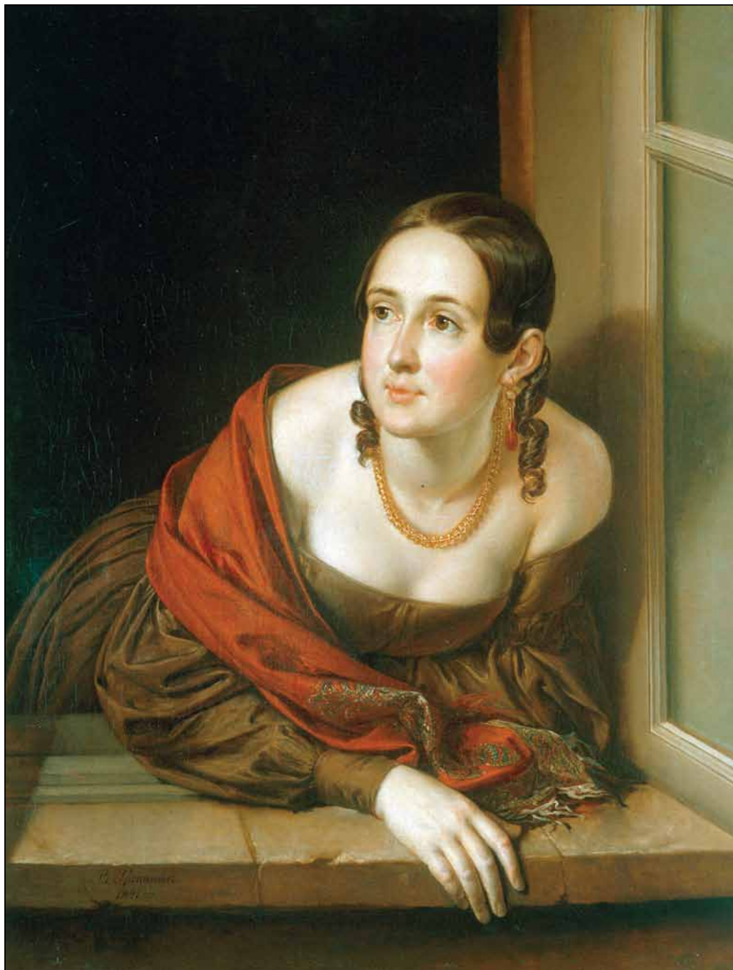
Женщина в окне (Казначейша). 1841