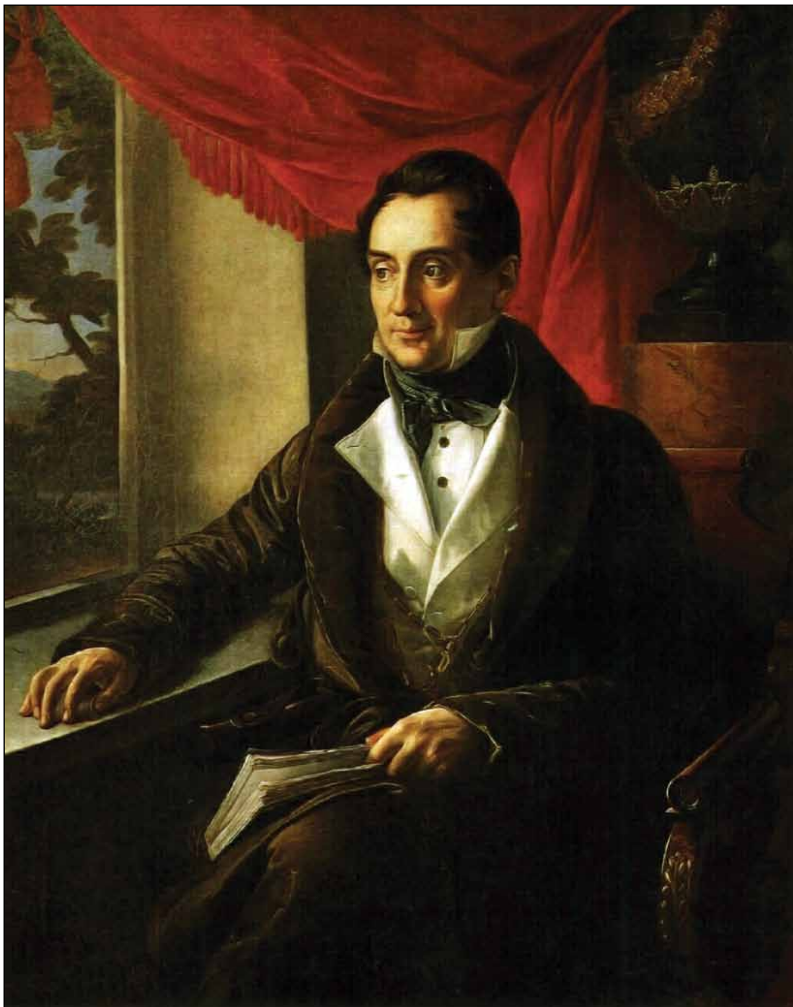
Портрет П. Н. Зубова. Около 1839