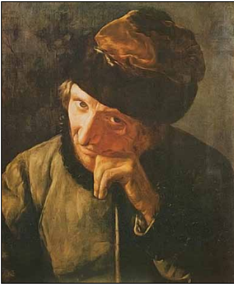
Старик ямщик, опирающийся на кнутовище. Этюд. 1820-е

Очень многие просвещенные и благородные люди, узнавая о том, что живописец Тропинин – крепостной человек, бывали крайне этим возмущены. Однажды граф Морков, принимавший у себя иностранцев,