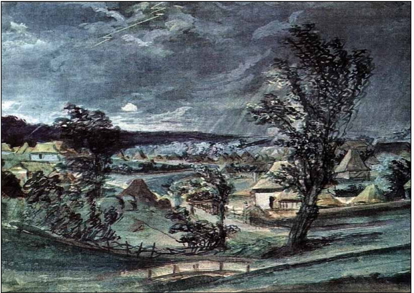
Украинская деревня. Гроза. 1810-е

Влияние творчества Василия Тропинина на все последующее русское изобразительное искусство чрезвычайно велико. Будучи современником золотого века отечественной культуры, он стал его неотъемлемой частью и еще при жизни снискал славу лучшего портретиста Москвы. Выходец из крепостных крестьян, недоучившийся студент Петербургской Академии художеств, Тропинин являет собой пример истинно талантливого человека, который благодаря собственной целеустремленности и твердости духа сумел состояться как многогранная творческая и, прежде всего, свободная личность, оставившая для потомков бесценные произведения искусства.