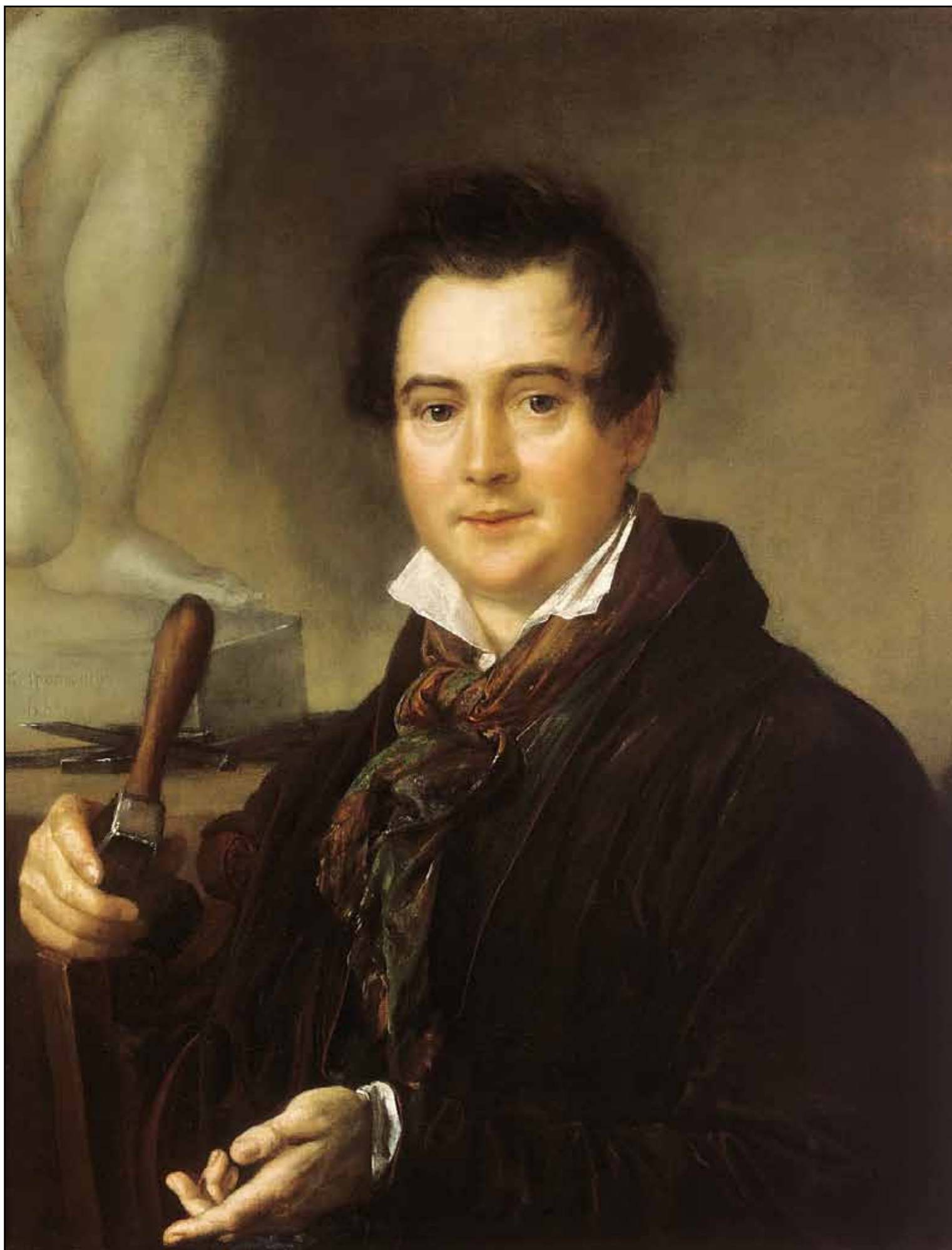
Портрет скульптора И. П. Витали. 1833