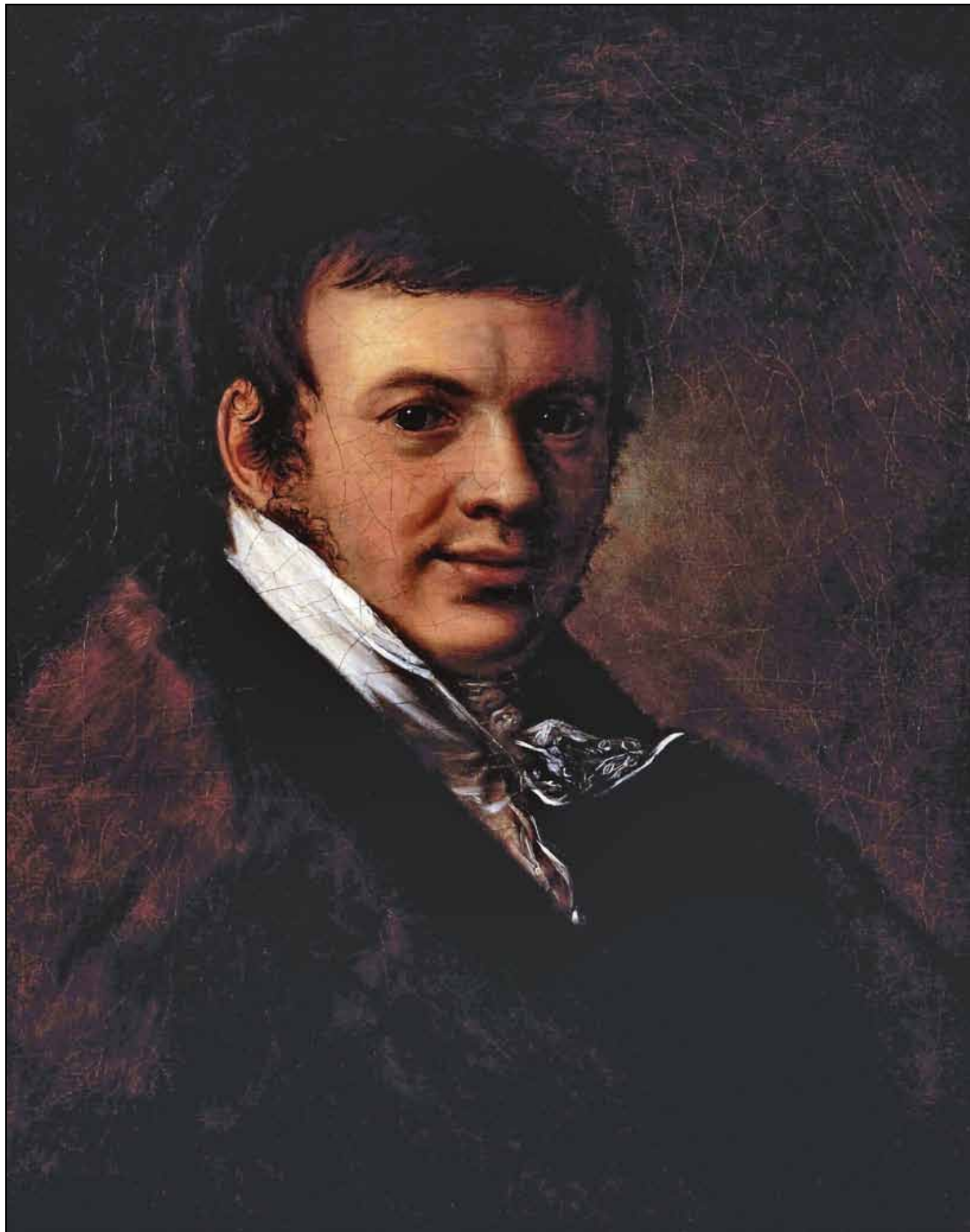
Портрет В. С. Жукова. 1820-е