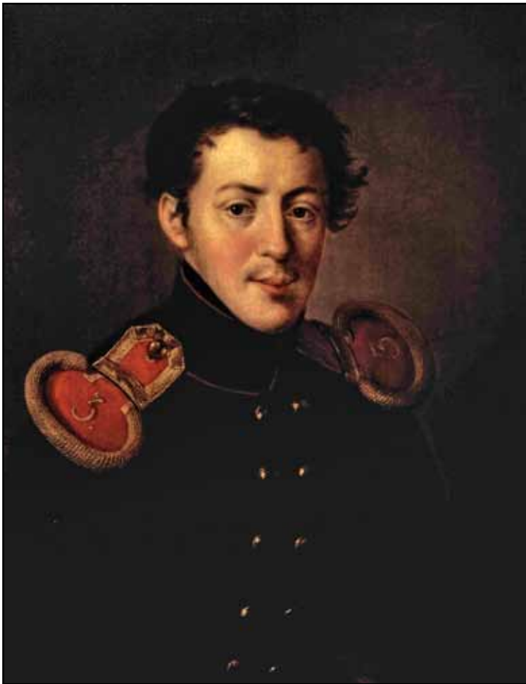
Портрет штабс-капитана II. В. Альмова. 1819

являвшаяся членом семьи Морковых: рано овдовевший граф для воспитания своих детей нанял гувернантку Боцигети, и ее дочь воспитывалась вместе с ними. Все герои полотна разбиты на пары и между собой выглядят разобщенными; между тем в произведении переданы гордый дух русского ампира и романтическая торжественность.