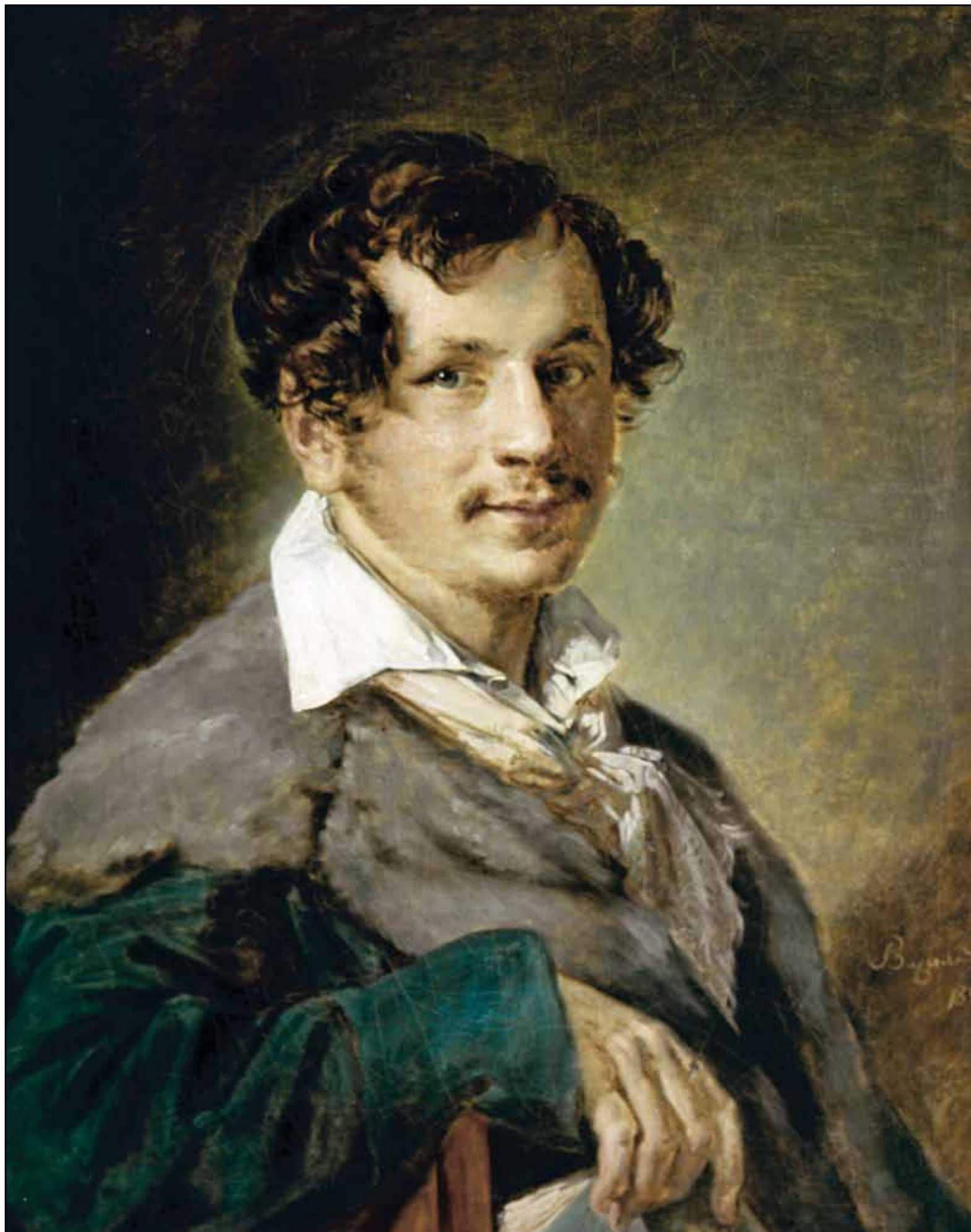
Портрет Булакова. 1823