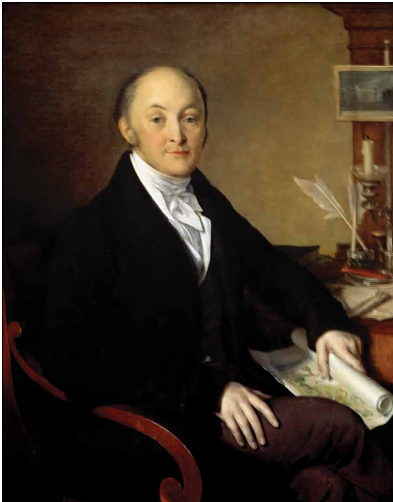
Портрет М. М. Сперанского. 1839