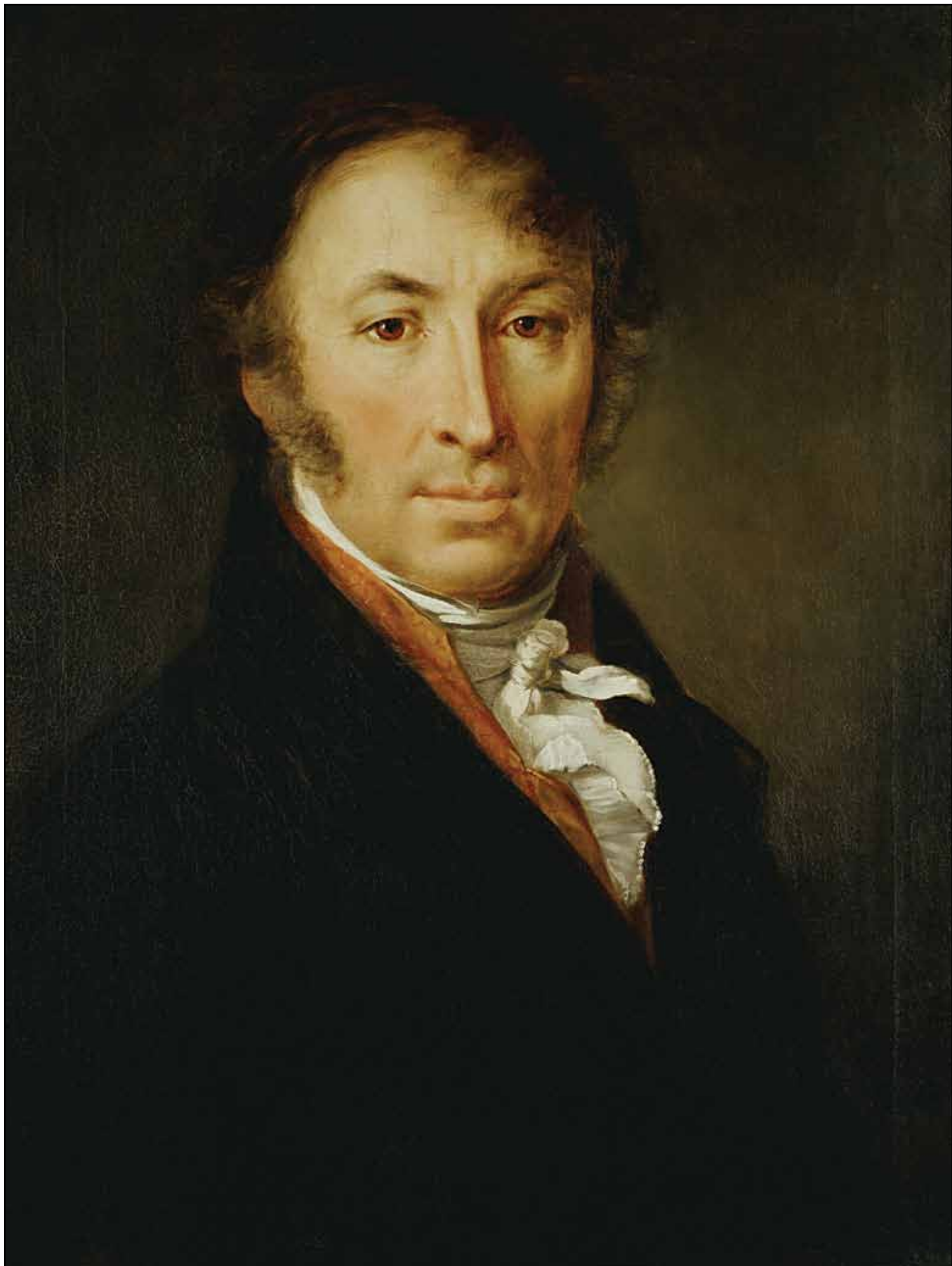
Портрет Н. М. Карамзина. 1818