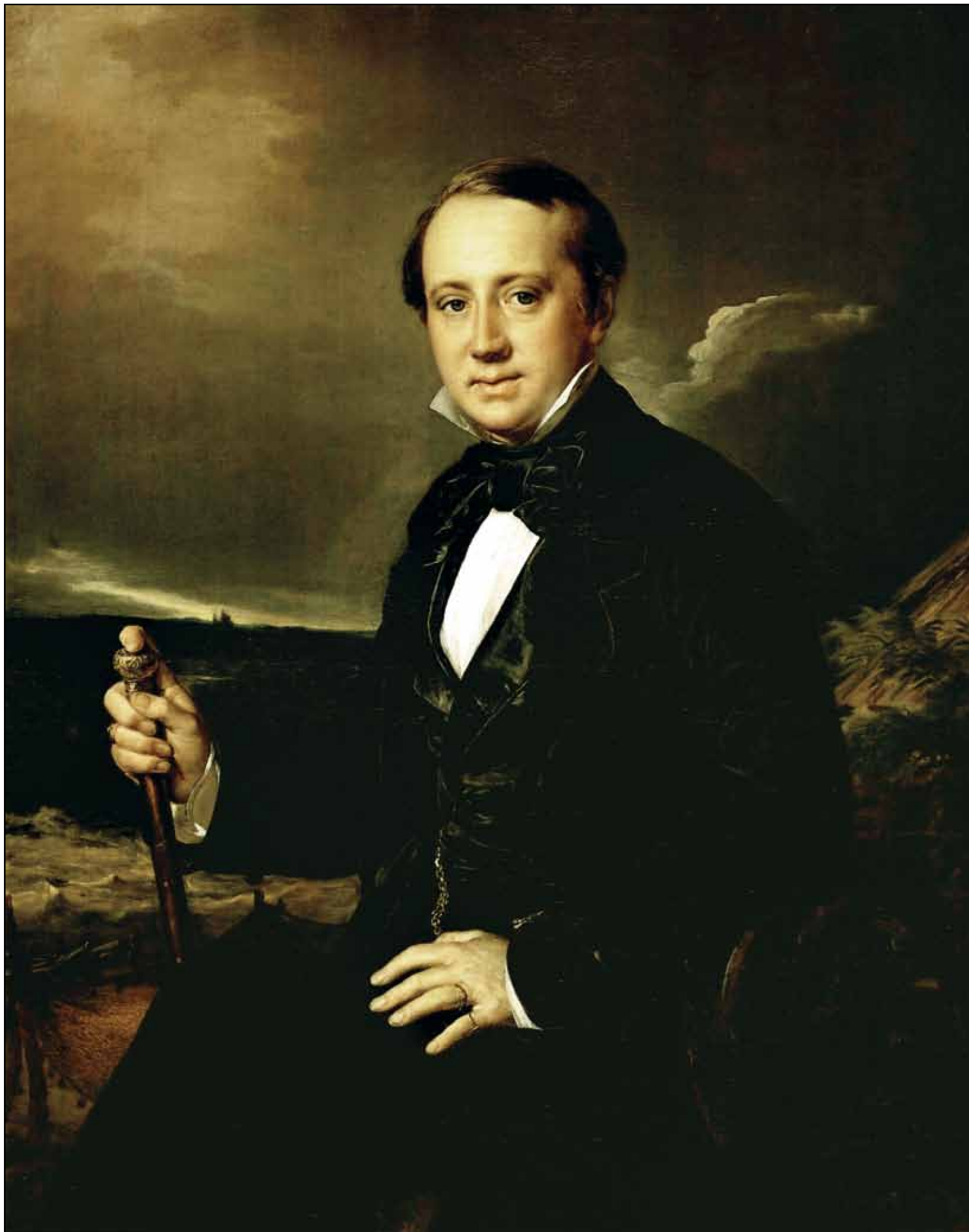
Портрет А. А. Сапожникова. 1852