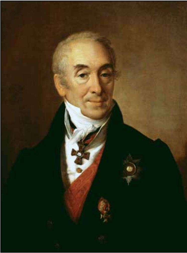
Портрет С. С. Кушникова. 1828

гения. Пушкин представлен в халате с расстегнутым воротом белой рубашки и небрежно повязанным галстуком-шарфом. Величавая осанка, поворот головы и задумчивый взгляд придают образу романтичность и монументальность.