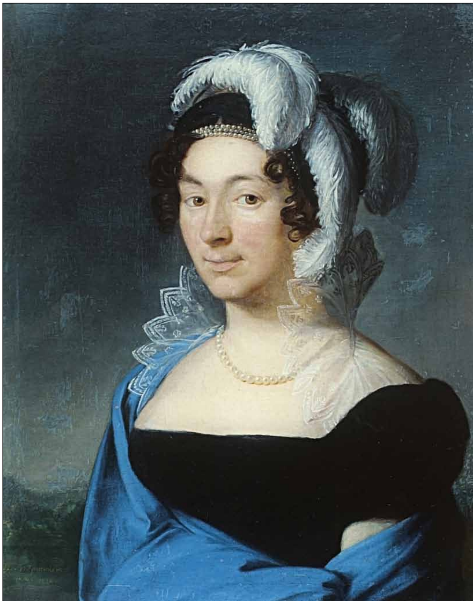
Портрет Боццетти. 1818