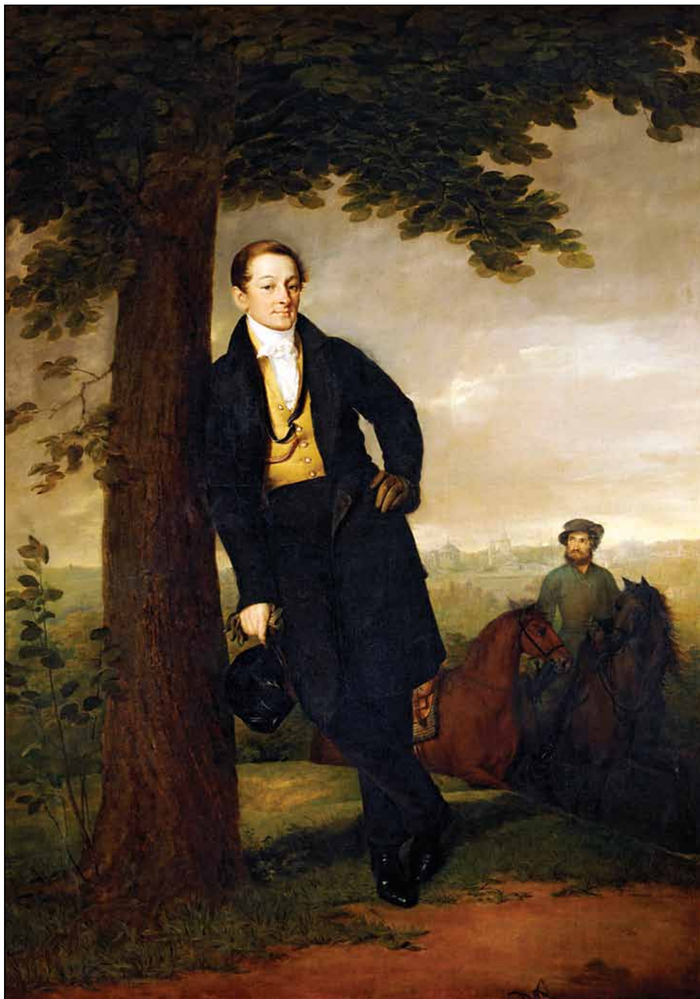
Портрет А. И. Барышникова. 1829