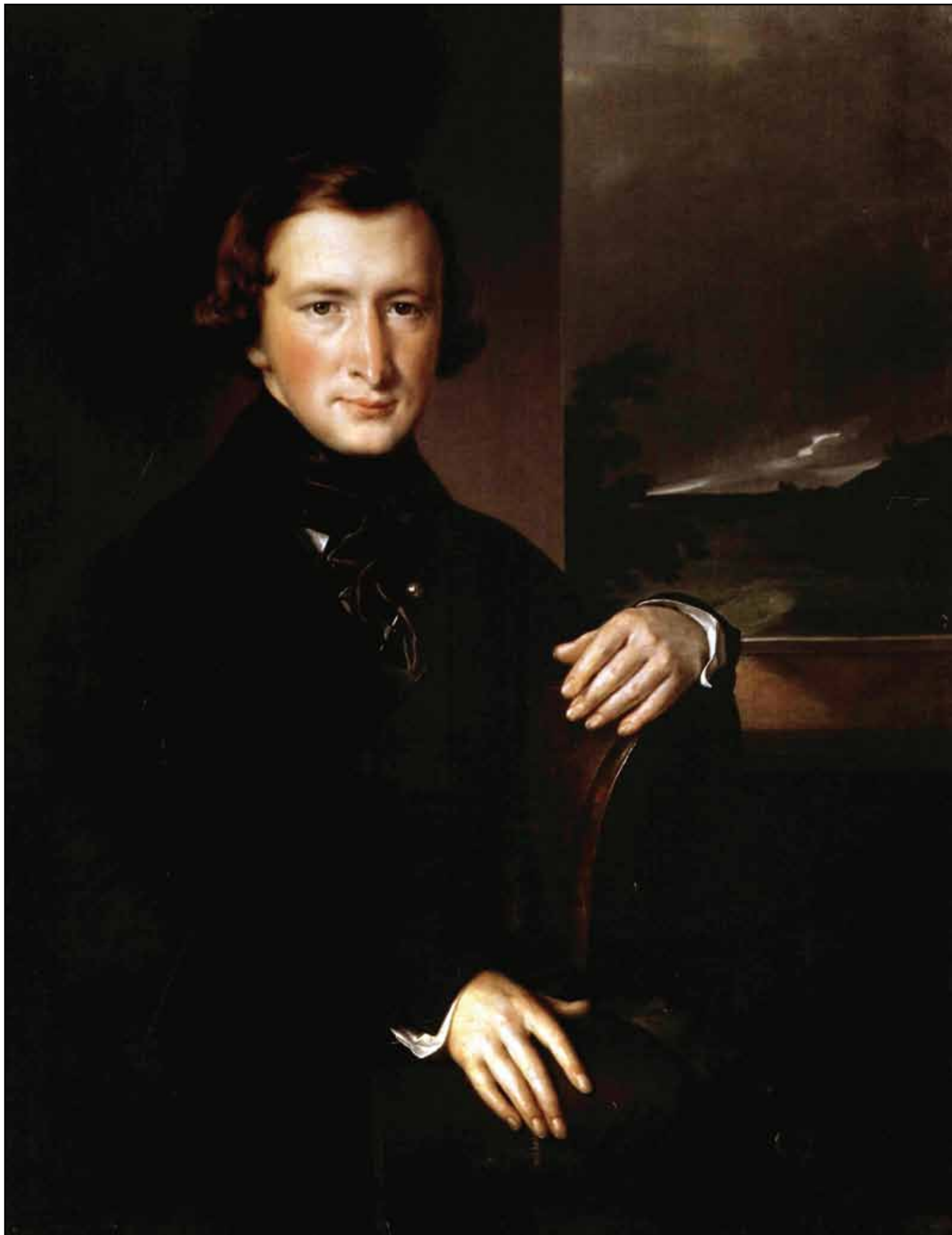
Портрет Ю. Ф. Самарина. 1844