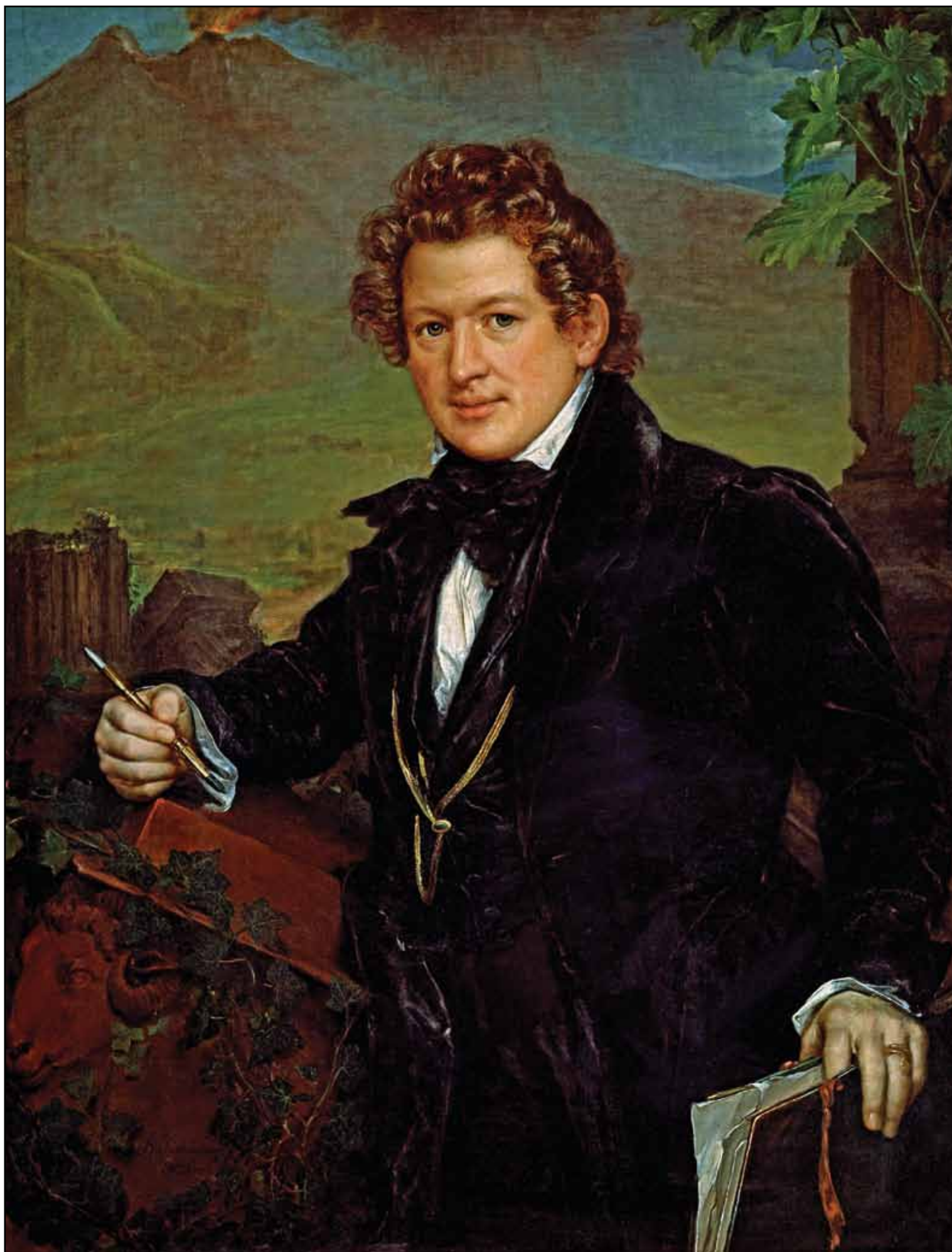
Портрет К. П. Брюллова. 1836