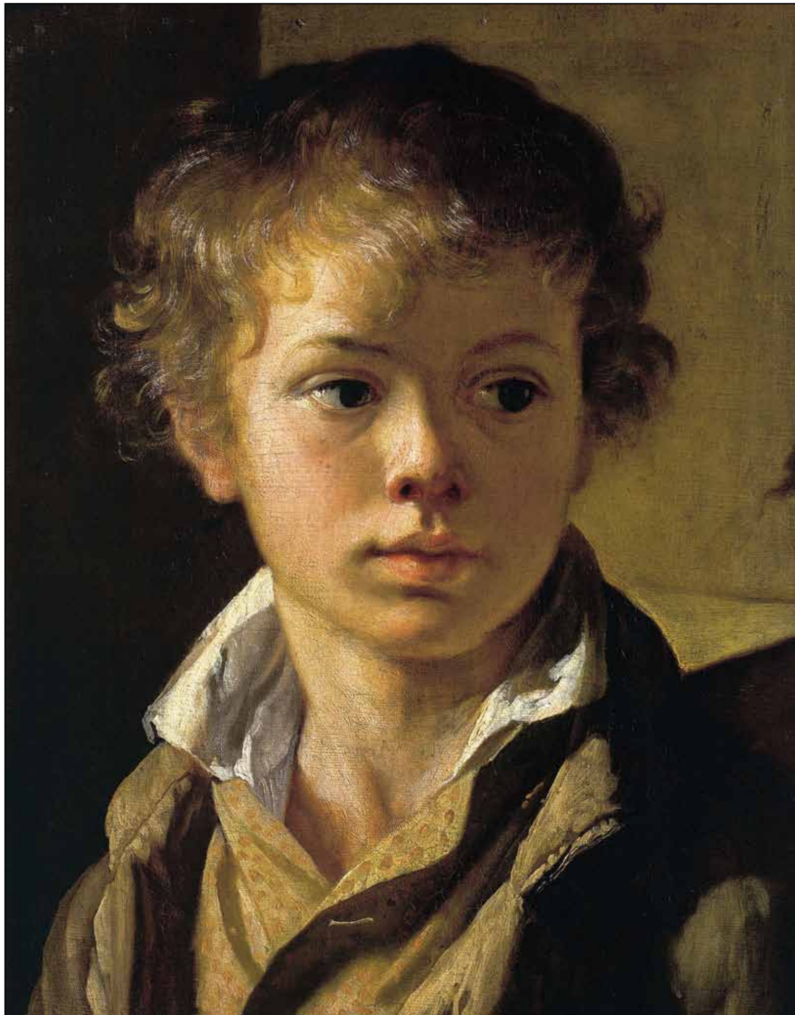
Портрет А. В. Тропинина. Около 1818