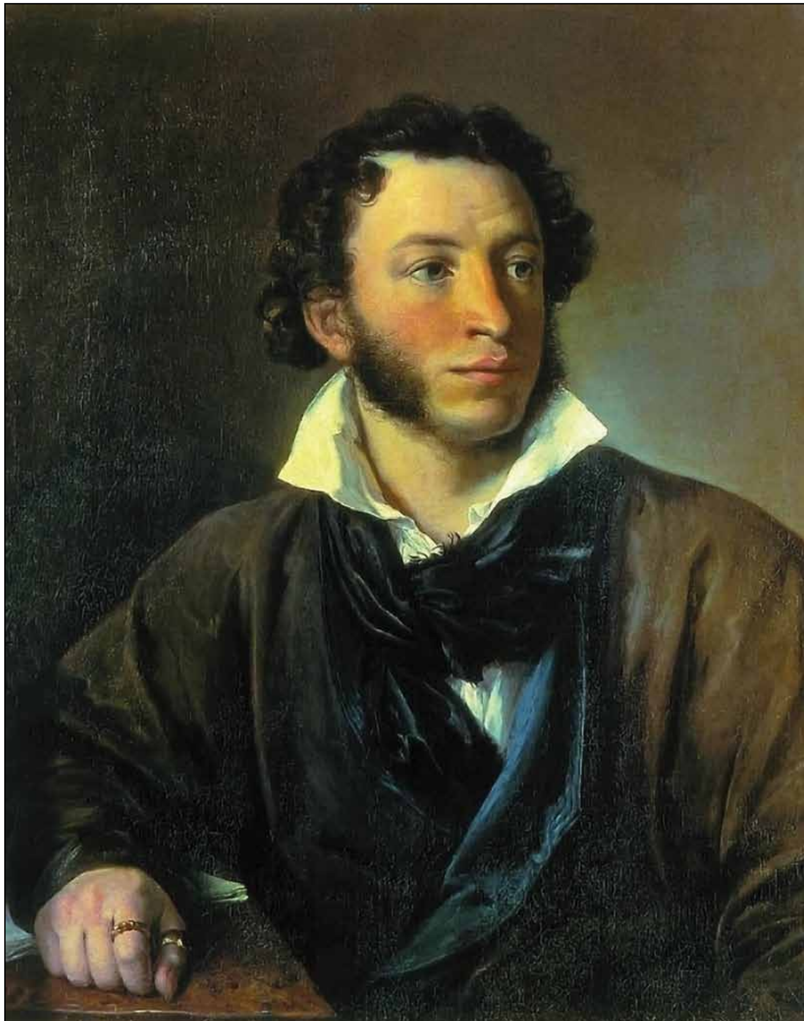
Портрет А. С. Пушкина. 1827