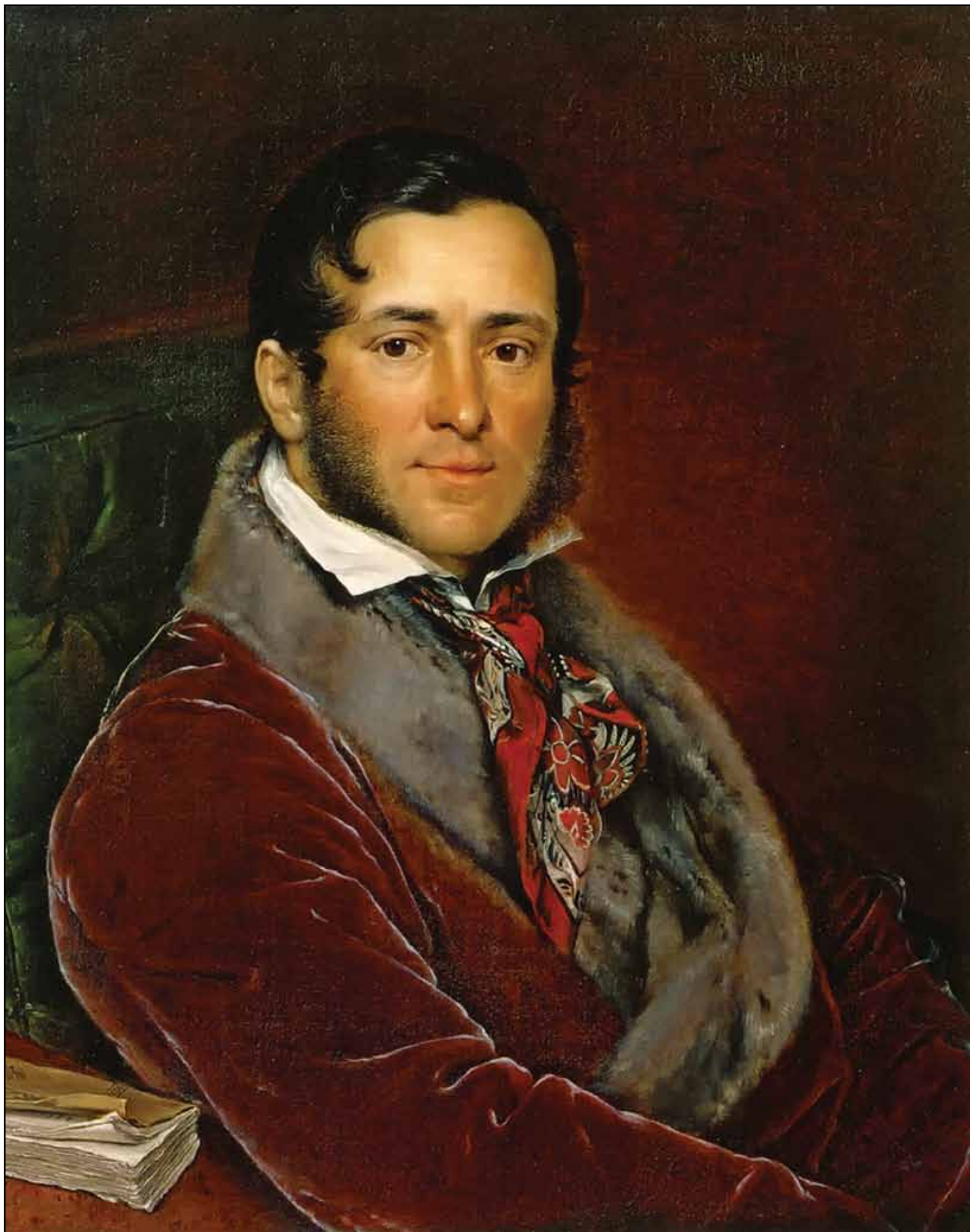
Портрет С. Н. Мосолова. 1836