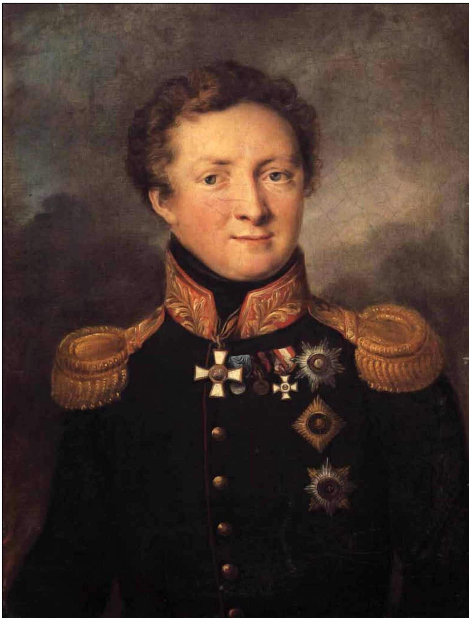
Портрет генерала А. И. Горчакова. 1810-е