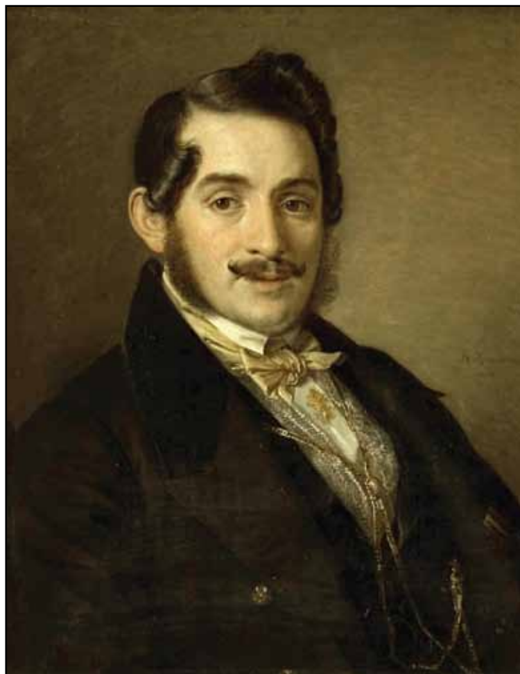
Портрет неизвестного в черном сюртуке. 1838

Александровича Рамазанова, биографа Василия Андреевича: «...Карл Брюллов, пораженный в старце необыкновенной ясностью ума, свежей памятью всего бывшего, теплотою чувств, живительным взглядом на искусство и удивительным о нем разговором, полюбил Тропинина всей душой и редкий день не навещал его. Не один раз случалось, что, приглашенный на роскошный обед аристократа, Брюллов изменял данному слову и приходил разделить за столом Василия Андреевича простые щи и кашу...» Брюллов очень высоко ценил талант и профессионализм Тропинина, а тот в свою очередь оказался под его творческим влиянием. У Василия Андреевича стали появляться полотна большого размера и со всеми атрибутами европейского парадного портрета.