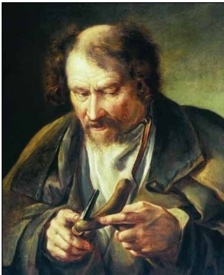
Старик, обстругивающий костыль. 1830-е