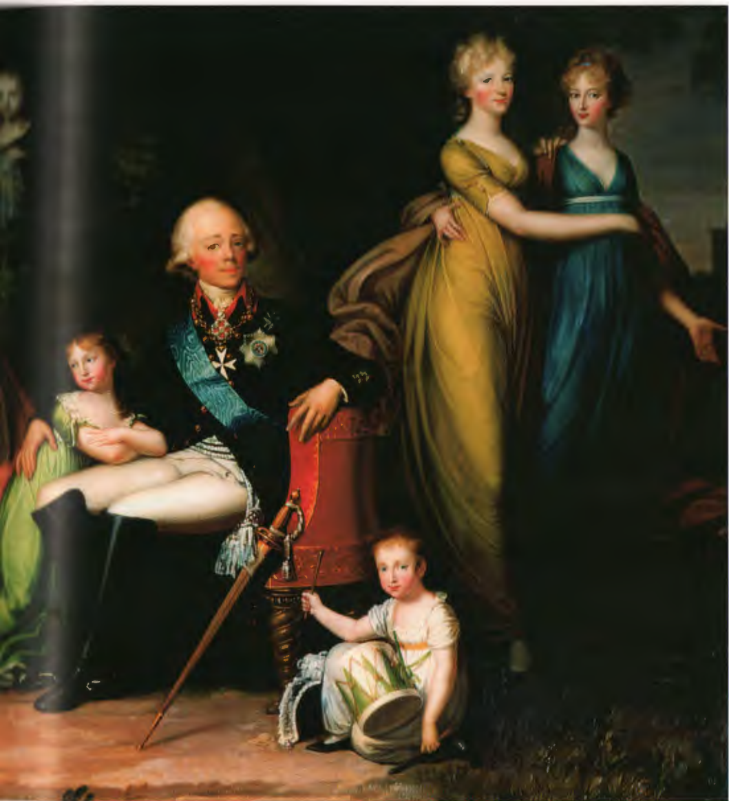
Слева направо: великий князь Александр Павлович, великий князь Константин Павлович, великий князь Николай Павлович, императрица Мария Федоровна, великая княжна Екатерина Павловна, великая княжна Мария Павловна, бюст великой княжны Ольги Павловны, великая княжна Анна Павловна, император Павел I, великий князь Михаил Павлович, великая княжна Александра Павловна и великая княжна Елена Павловна