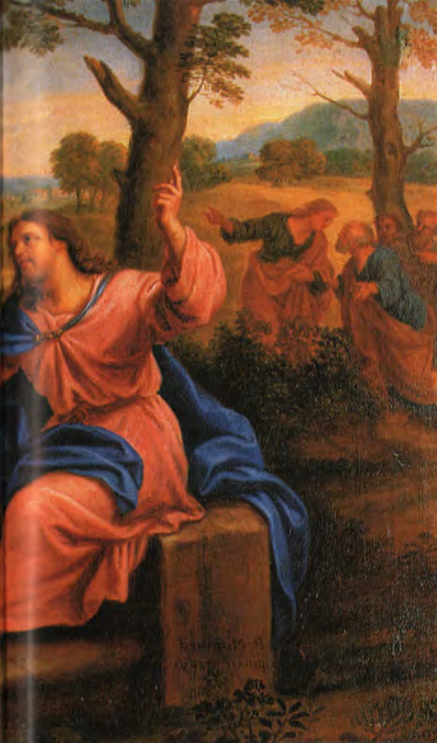
П. Миньяр Христос и самаритянка 1600-е (Франция)