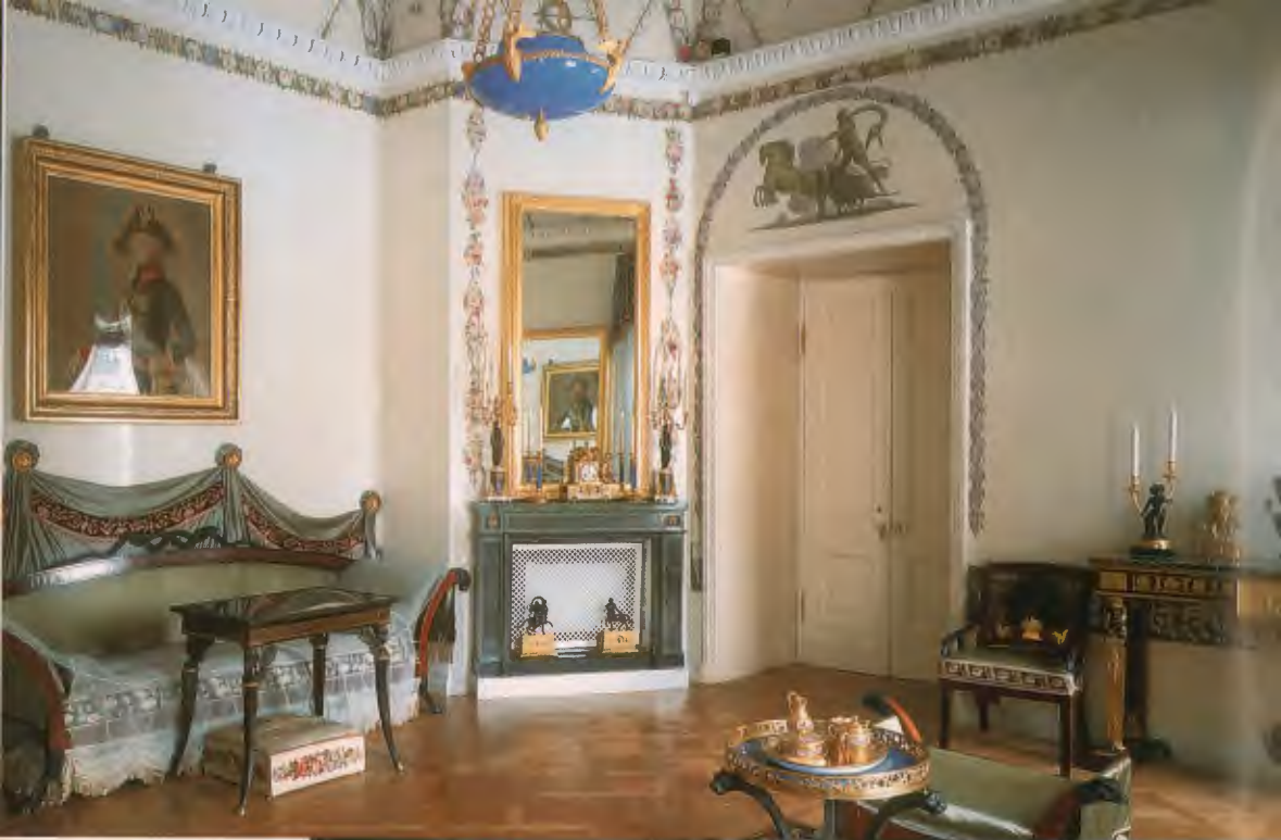
Спальня Мари Федоровны 1805, архитектор А. Воронихин