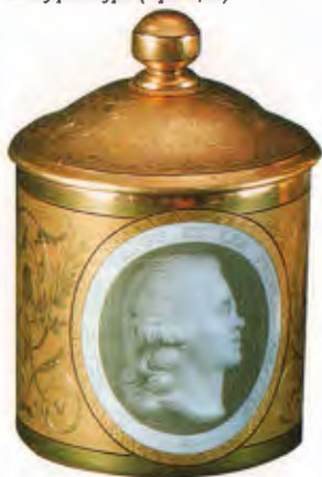
Чашка с портретом Павла Петровича 1782, Севрская фарфоровая мануфактура (Франция)

В Париже Мария Федоровна заказала несколько гарнитуров мебели в мастерской Анри Жакоба. Работы этого мебельщика, имевшего титул королевского мастера, пленили хозяйку Павловска легкими и изящными формами стульев и кресел из резного золоченого дерева. Так был заказан гарнитур для гостиной с обивками из шелка с вышивкой тамбурным швом. Первоначально он был поставлен в Греческий зал, но уже в начале XIX века перенесен в жилые комнаты первого этажа. Но истинным шедевром Жакоба стал гарнитур Парадной спальни. Пышная кровать под балдахин украшена скульптурными фигурками путти, а резная спинка представляет целый язык символов: здесь и знаки зодиака, и жертвенник любви с недреманным оком, и гончие собаки, символизирующие верность. В гарнитур