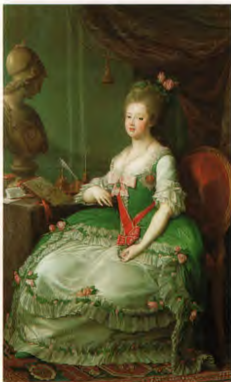
Парадный портрет великой княгини Марии Федоровны Художник И.-Г. Пульман (копия с оригинала П.-Дж. Батони), 1782-1783

В 1795 году Мария Федоровна описала до мельчайших подробностей залы Павловского дворца и их меблировку, расположение произведений искусства. В Библиотеке Павла I, как отмечает она, “под аркой располагается большой письменный стол, похожий на изделие мастерской Рентгена. Он поддерживается двенадцатью колоннами из слоновой кости”. Эти колонны сама Мария Федоровна вытачивала на токарном станке. Она описывает миниатюрный храм из слоновой кости, стоящий на этом столе: “На фронтоне храма камешка с изображением Великого Князя, вправленная в прозрачное стекло, на котором я нарисовала трофеи в манере гризайль... на остальных семи гранях медальоны с портретами семерых моих детей, начиная с Александра, чья монограмма переплетается с монограммой Елизаветы. Я сделала этот подарок в прошлом [1794] году дорогому Великому Князю. Я нарисовала монограммы всех детей в розах и миртовых ветках...”