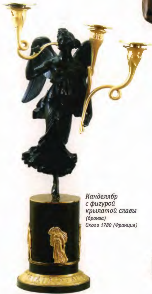
Канделябр с фигурой крылатой славы (бронза) Около 1780 (Франция)