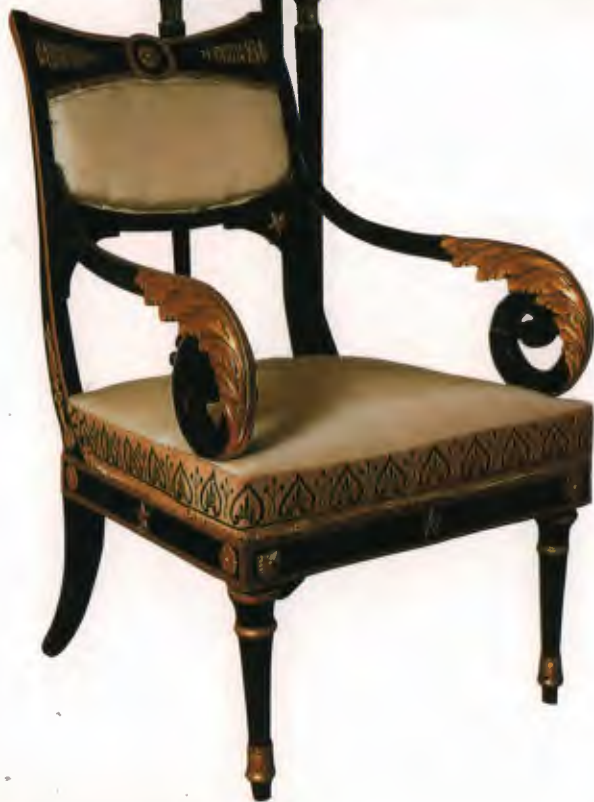
Кресло 1807, по проекту А. Воронихина (Россия)