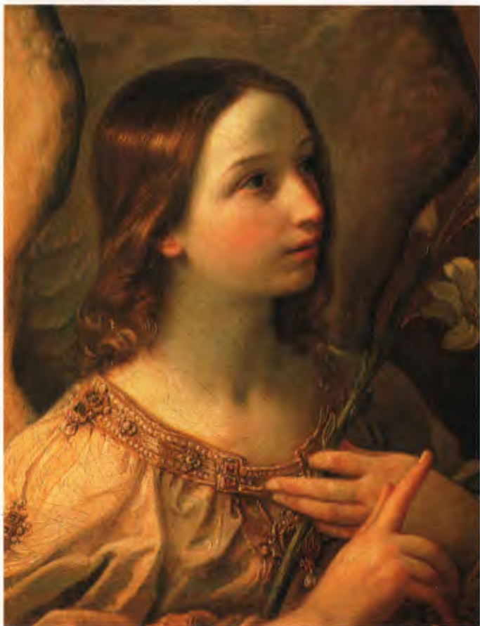
Г. Рени Архангел Гавриил из сцены "Благовещение" 1600-е (Италия)