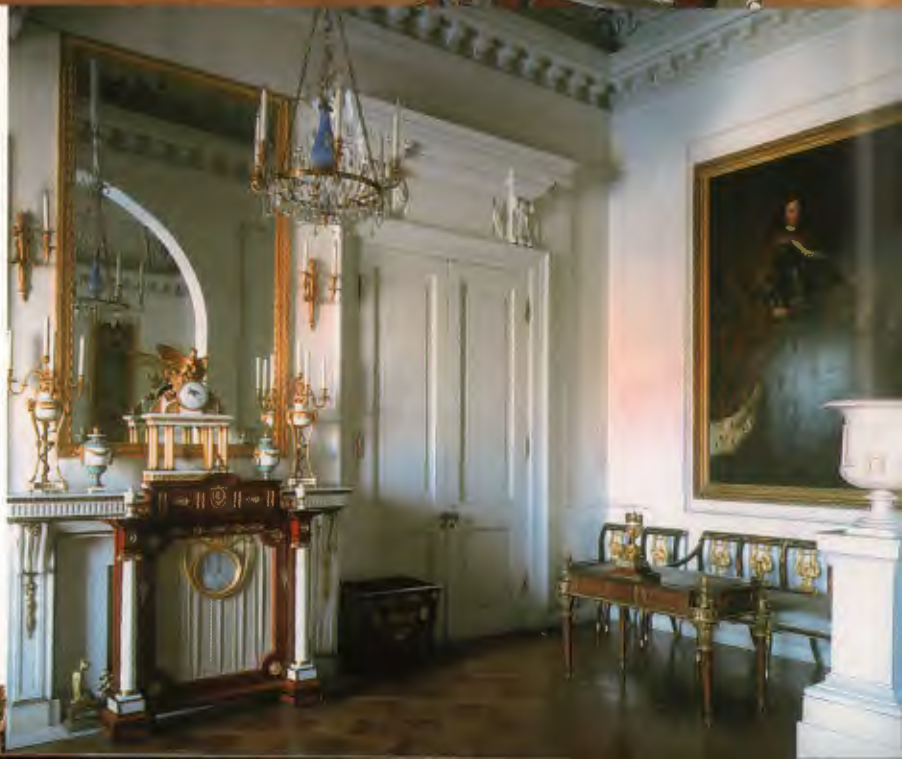
Первый проходной кабинет 1797–1799, архитектор В. Бренна