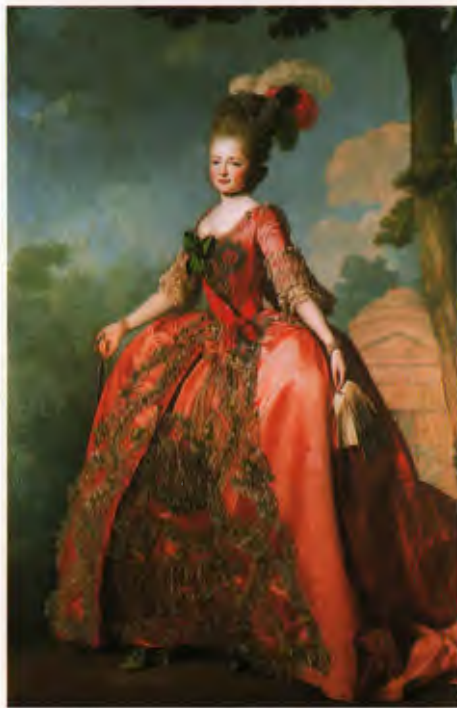
А. Рослин Портрет великой княгини Марии Федоровны

Павловский дворец – настоящее сокровище в “бриллиантовом ожерелье” Петербурга. Сокровище, которое мы бережем во имя сохранения культуры России.