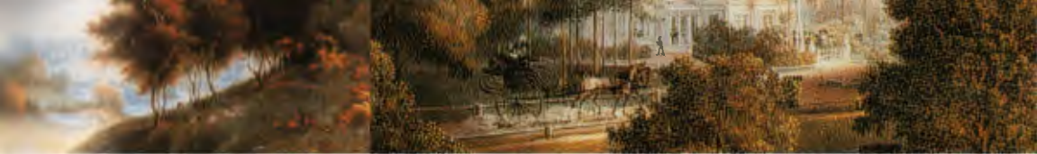
Вид на Павловский дворец со стороны моста Кентавров

В Павловске хранится одна из наиболее значительных коллекций фарфора – русско- и западноевропейского. Здесь представлены изделия Севрской, Мейсенской, Берлинской, Людвигсбургской фарфоровых фабрик, изделия из английского фаянса фабрик Челси, Дерби и мастерских Спода и Веджвуда, фарфор, изготовленный мастерами Императорского фарфорового завода. Это собрание было в основном сформировано при жизни императрицы Марии Федоровны; последующие владельцы дворца смогли бережно сохранить ее наследие.