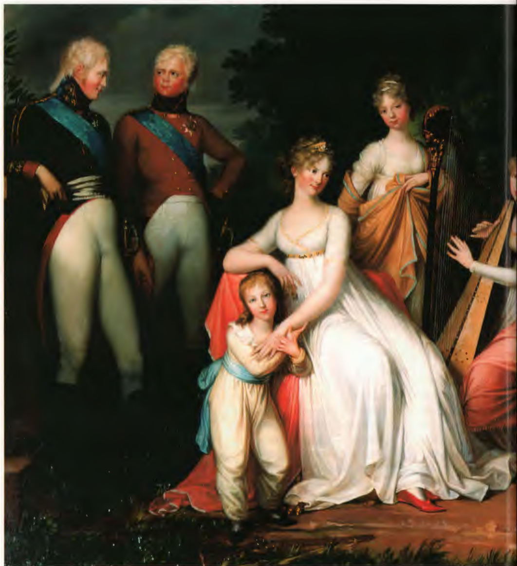
Император Павел I и императрица Мария Федоровна с детьми Художник Герард Кюгельхен, 1800-е