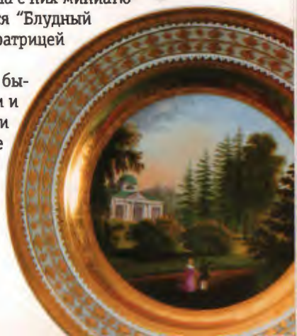
Тарелка с видом Розового павильона в Павловске 1826–1828, Императорский фарфоровый завод (Санкт-Петербурге)

В Риме – истинной Мекке для европейских художников – была весьма многочисленная колония художников из Германии и Швейцарии. Мария Федоровна, посетив мастерскую Анжелики Кауффман сначала в Венеции, а затем в Риме, заказала ей две картины из английской истории – “Отравленная Элеонора” и