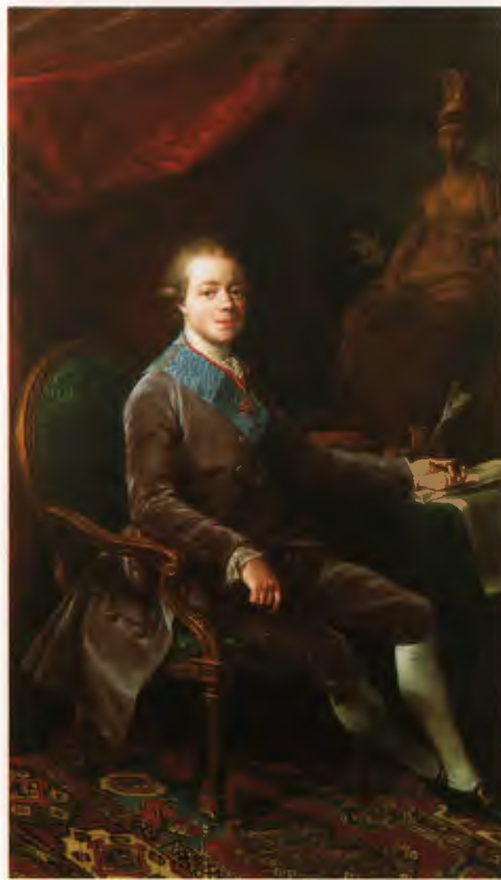
Парадный портрет великого князя Павла Петровича Художник И.-Г. Пульман (копия с оригинала П.-Дж. Батони), 1782–1783

Третий период строительства дворца пришелся уже на XIX век (1800–1824) и связан с именами Дж. Кваренги, А. Воронихина