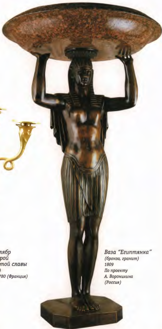
Ваза "Египтянка" (бронза, гранит) 1809 По проекту А. Воронихина (Россия)