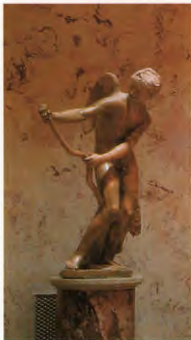
Эрот, с луком Римская копия I века с оригинала Лисиппа IV века до н. э.

Хозяйка Павловска Мария Федоровна не только обладала незаурядным вкусом, но и сама была превосходной художницей. Она рисовала по молочному стеклу, вырезала камеи из твердых камней: оникса, сардоникса, агата, а также из слоновой кости, работала на токарном станке, вытачивая из слоновой кости и янтаря разнообразные детали, которые превращались в чернильницы, лампы, декоративные настольные украшения. Она дарила свои работы Екатерине, своему супругу и друзьям. В убранстве многих интерьеров дворца можно увидеть плоды ее художественного творчества. За выдающиеся достижения в области медальерного искусства она была удостоена звания почетного академика Берлинской академии художеств. Павловск с его удивительной гармонией природы и искусства, декоративного убранства и художественных коллекций хранит тепло и обаяние своей первой хозяйки Марии Федоровны, вкусом которой он и был обустроен.