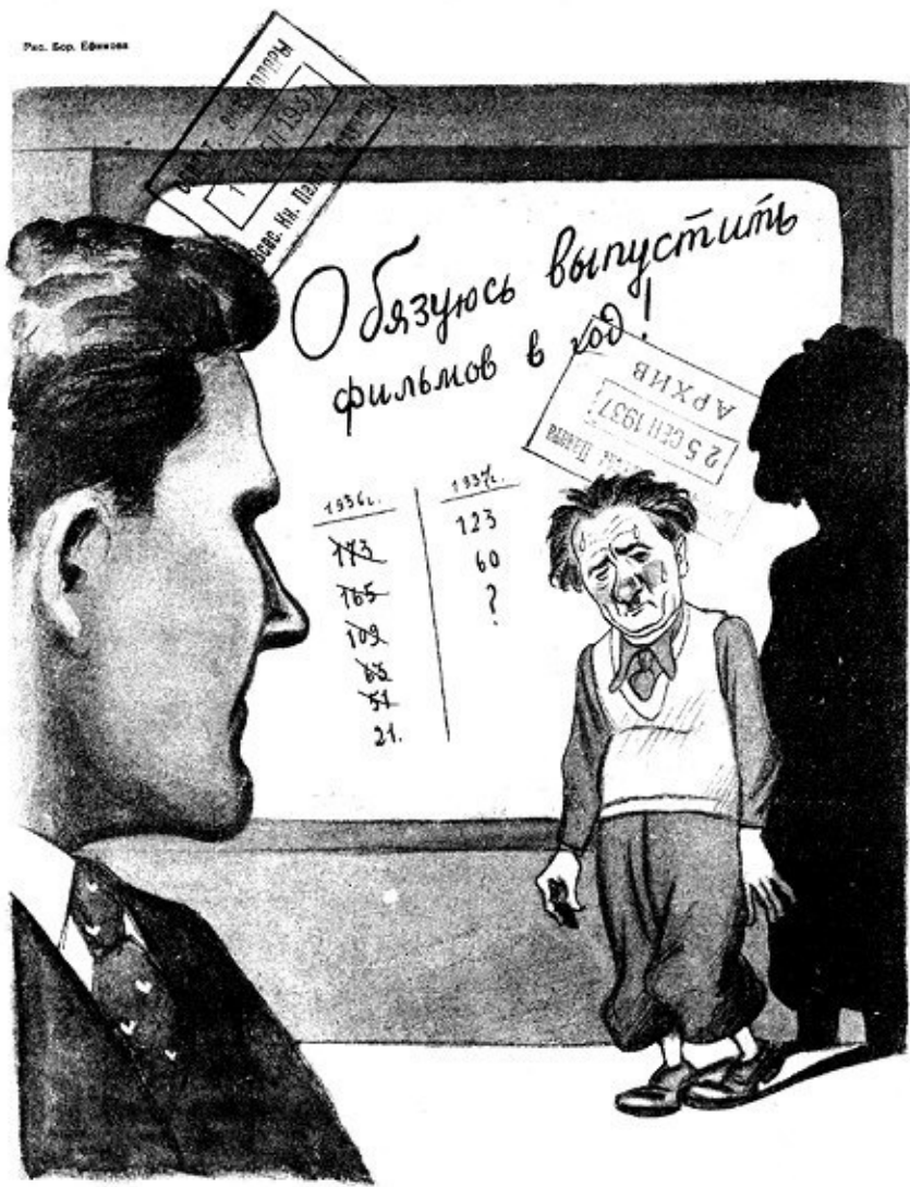
СОВЕТСКИЙ ЗРИТЕЛЬ: — Стыдно, Шумяцкий Борис, вы опять не знаете своего предмета!