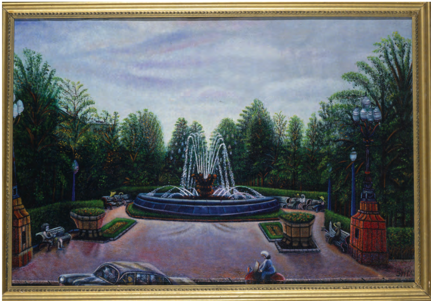
Ш. Эртуганов. Фонтан.