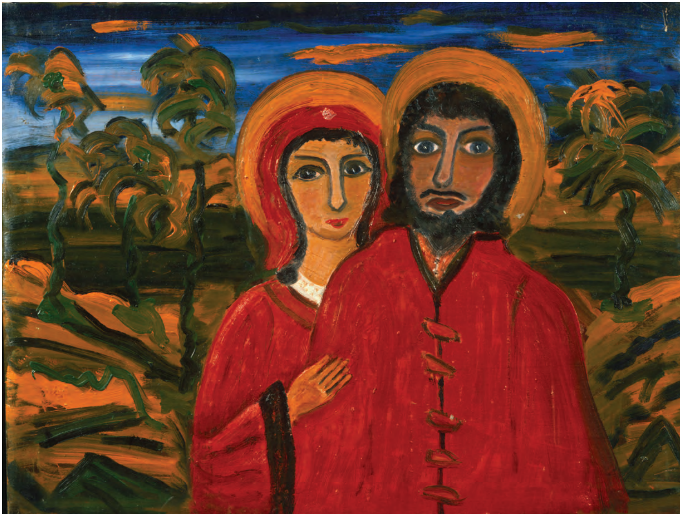
А. Кондратенко. Иисус и Мария в красном. 1990-е.