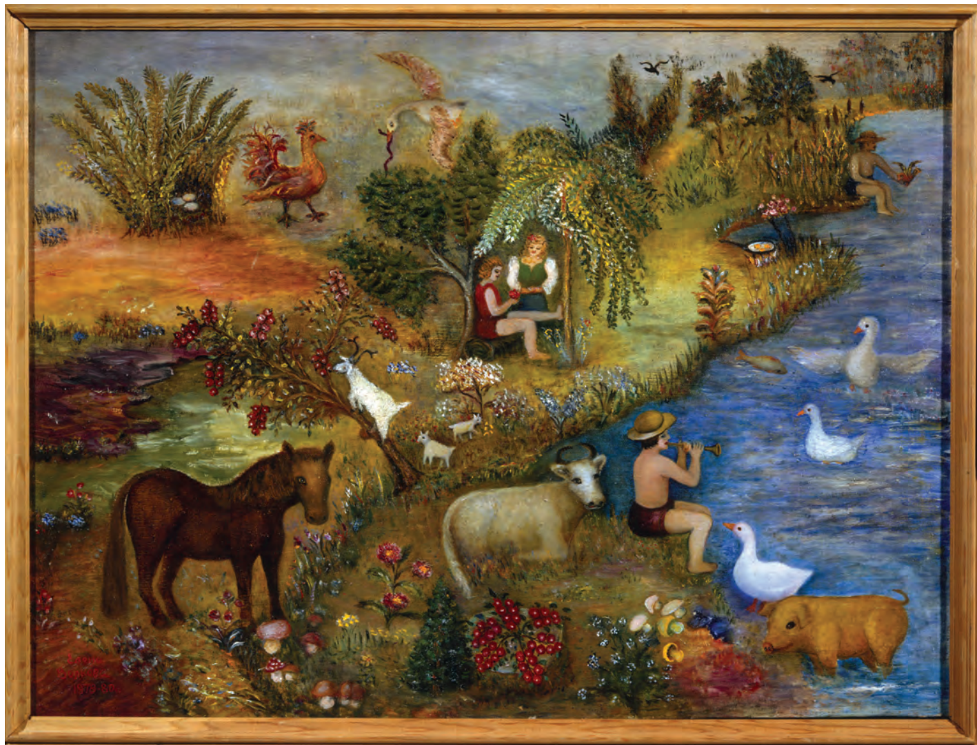
Е. Волкова. Пастушок. 1978.