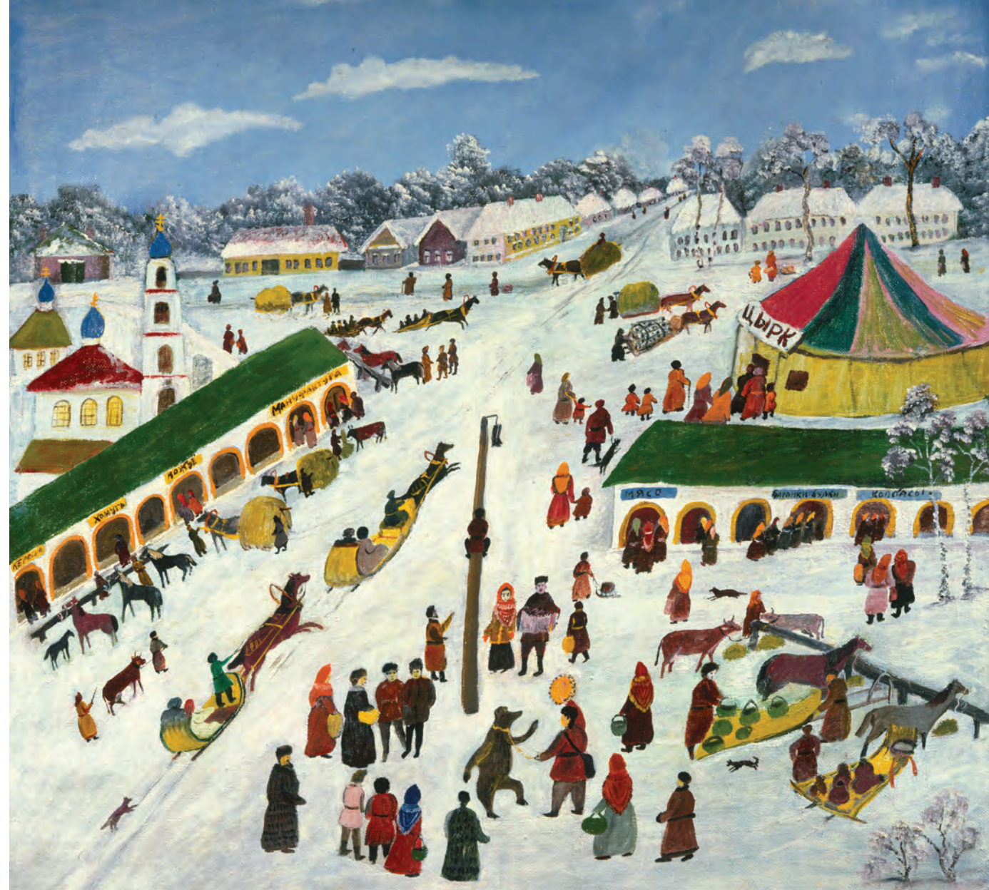
В. Григорьев. Ярмарка в Киржаче. 1990-е гг.