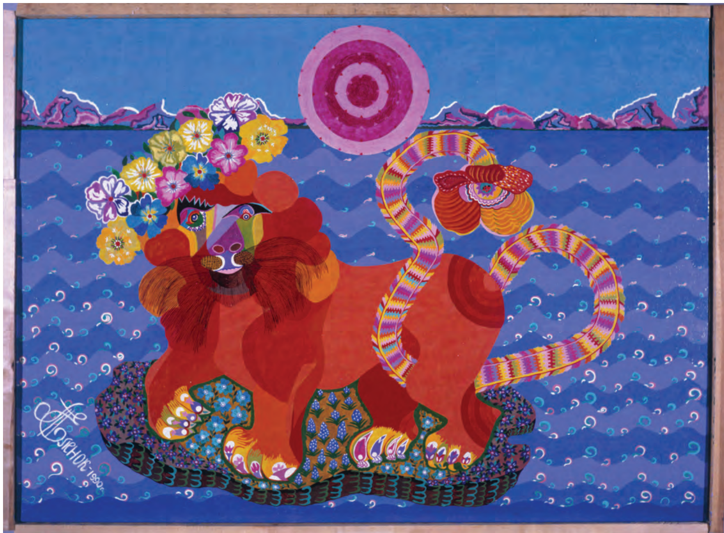
Т. Еленок . Игривый лев. 1990