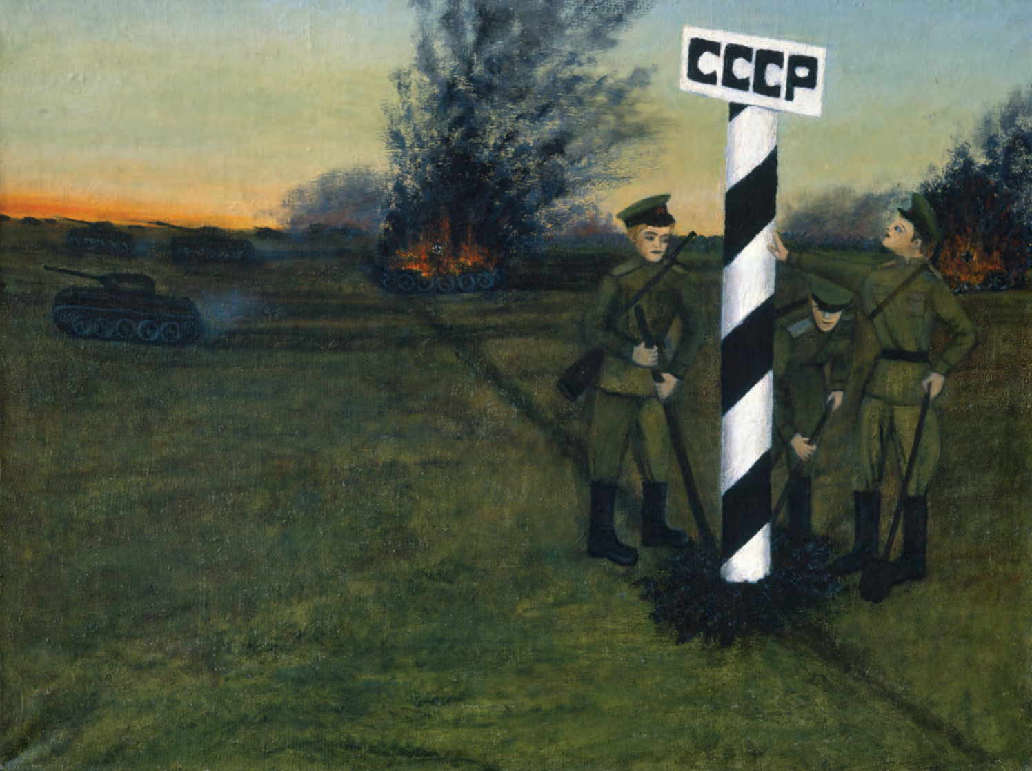
С. Базыленко. Граница СССР восстановлена. 1980-е гг.