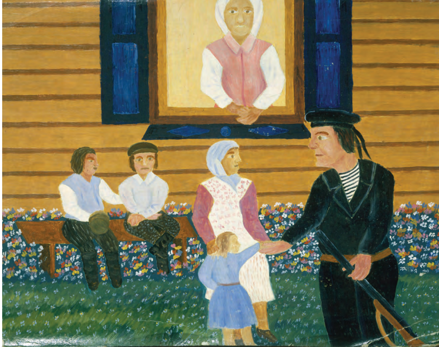
В. Березнев. Проводы. 1970-е гг. (ЗНУИ)