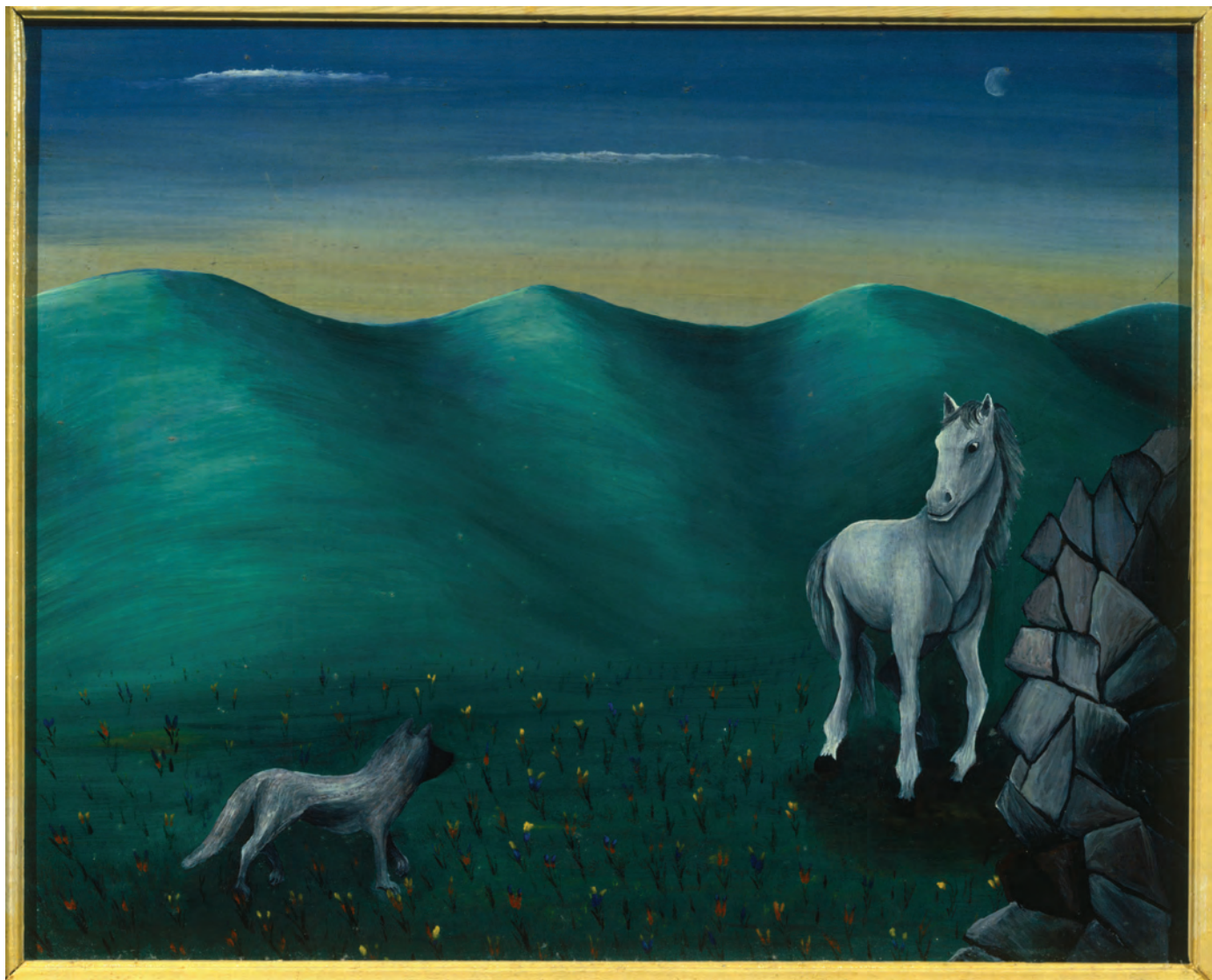
В. Сакиян. Двое в степи. 1992