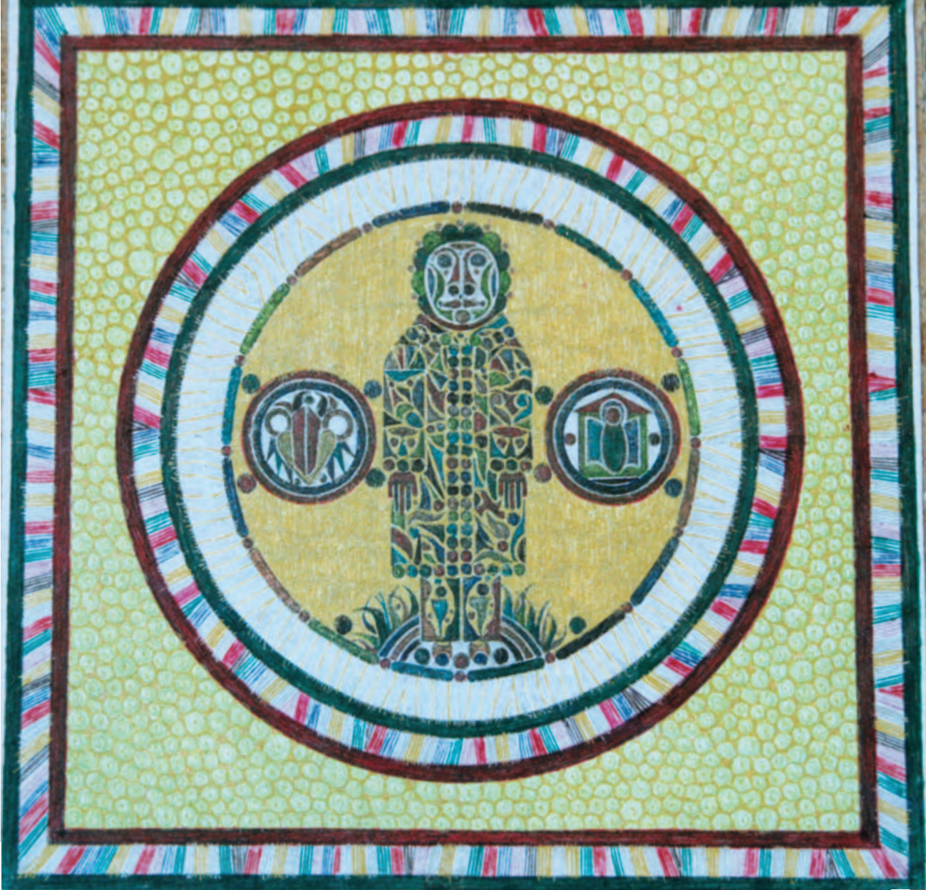
В. Романенков. Фигура с символами дома и любви. 1999.