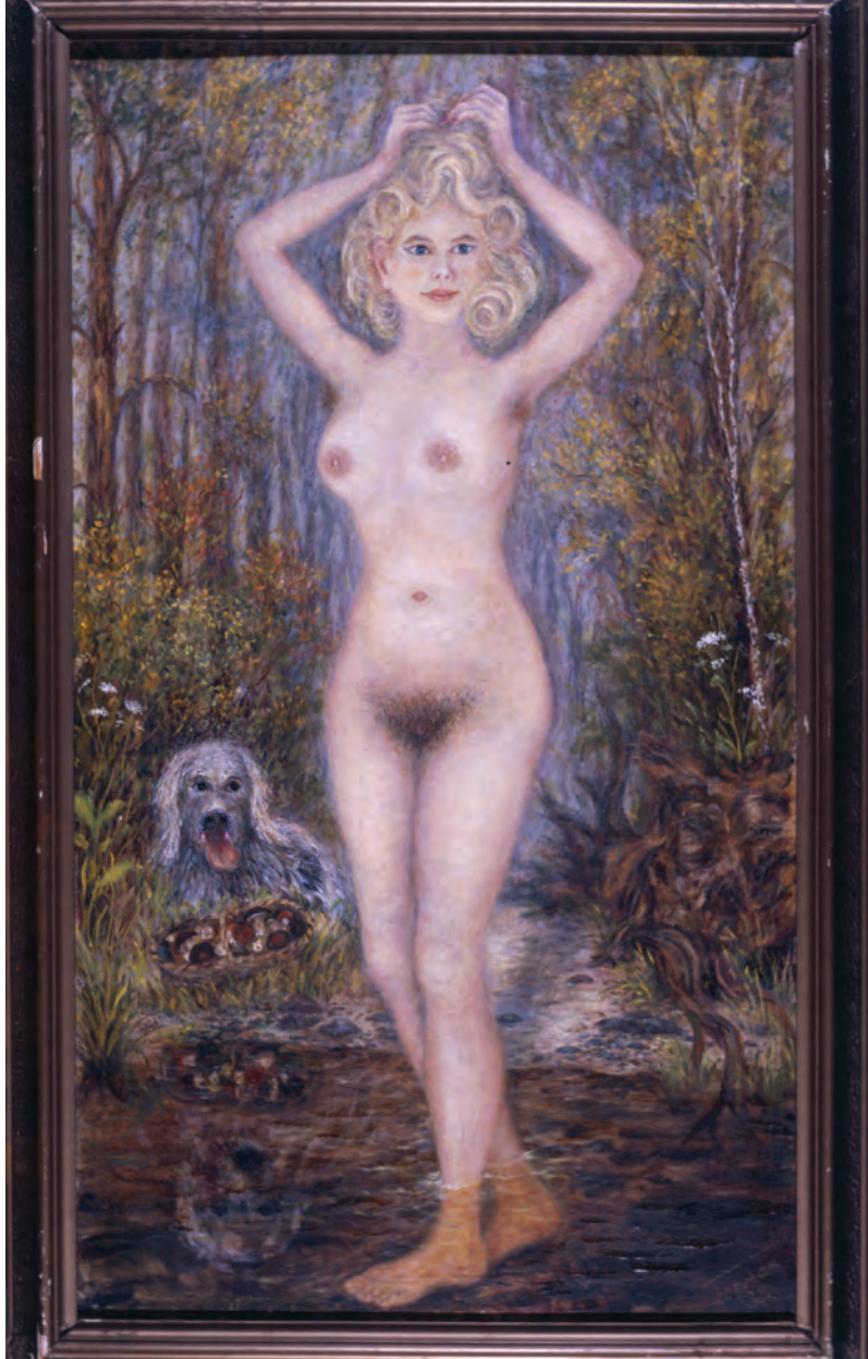
А. Герман. Лесная сказка. 1982.