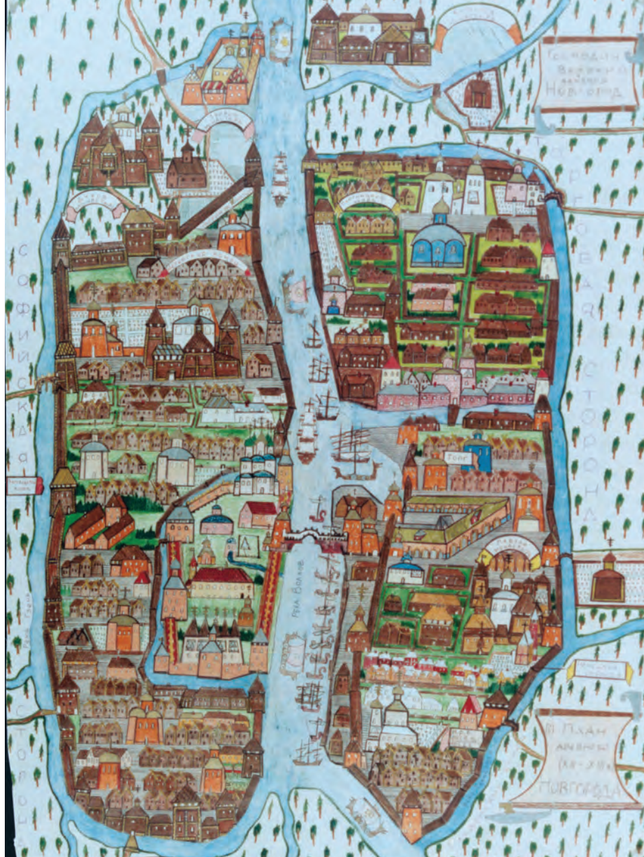
М. Бессмертный. План Новгорода.