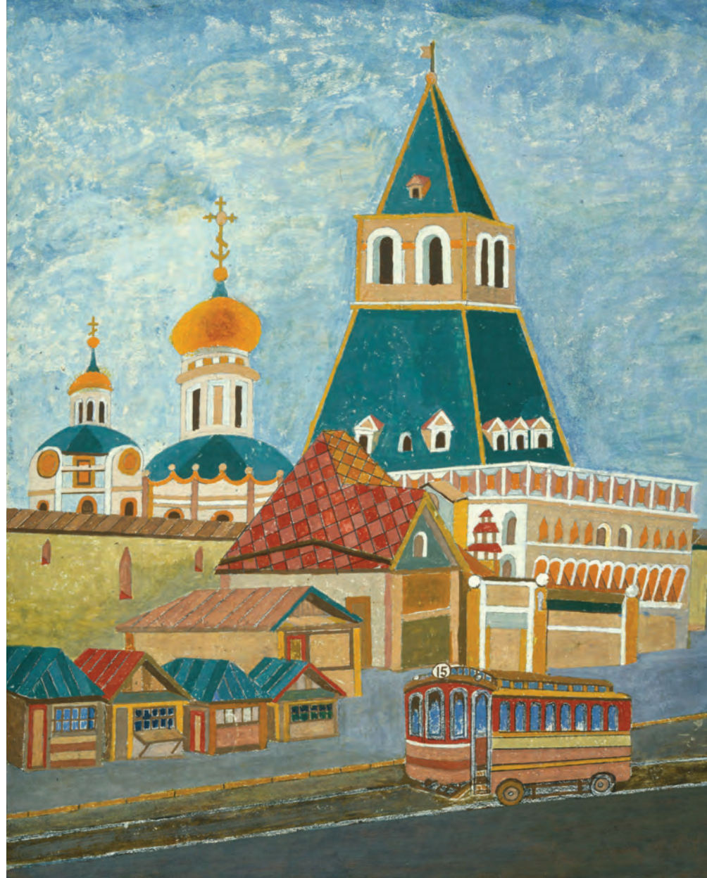
В. Ткаченко. Москва. Владимирские ворота.