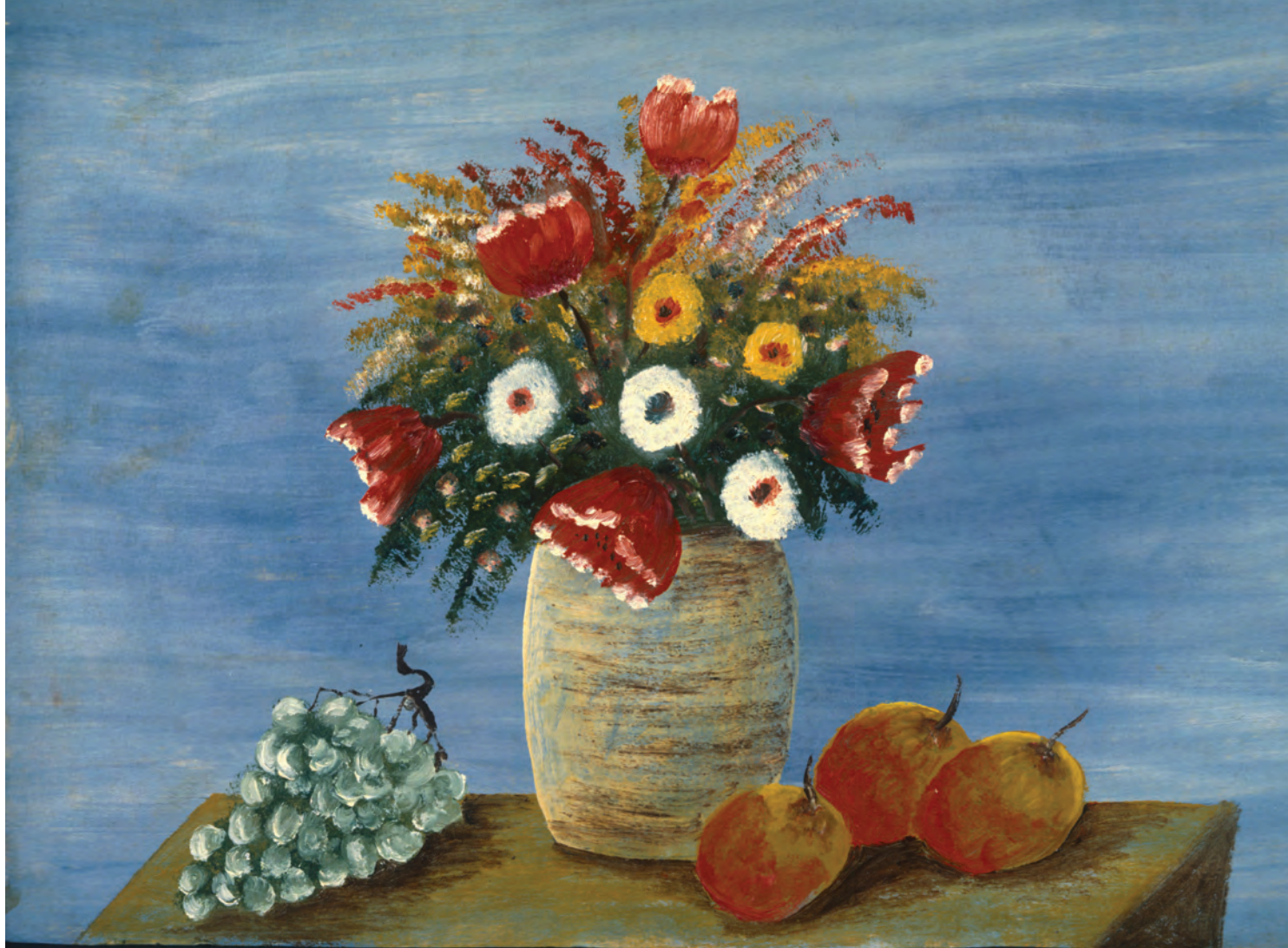
В. Григорьев. Натюрморт. 1990-е гг.