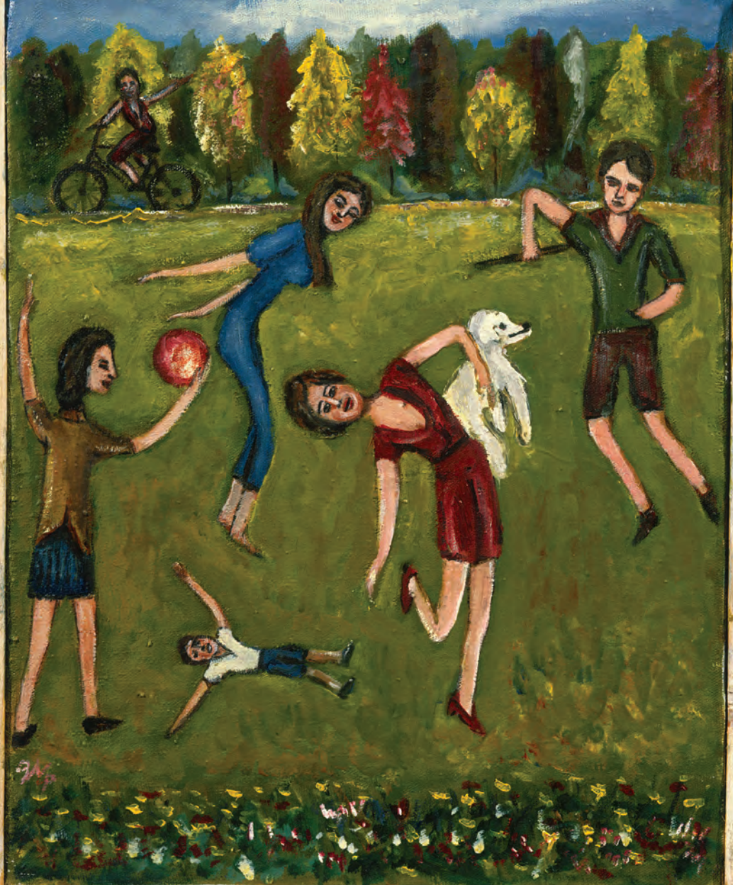
В. Макаров. Детство. 1990-е.