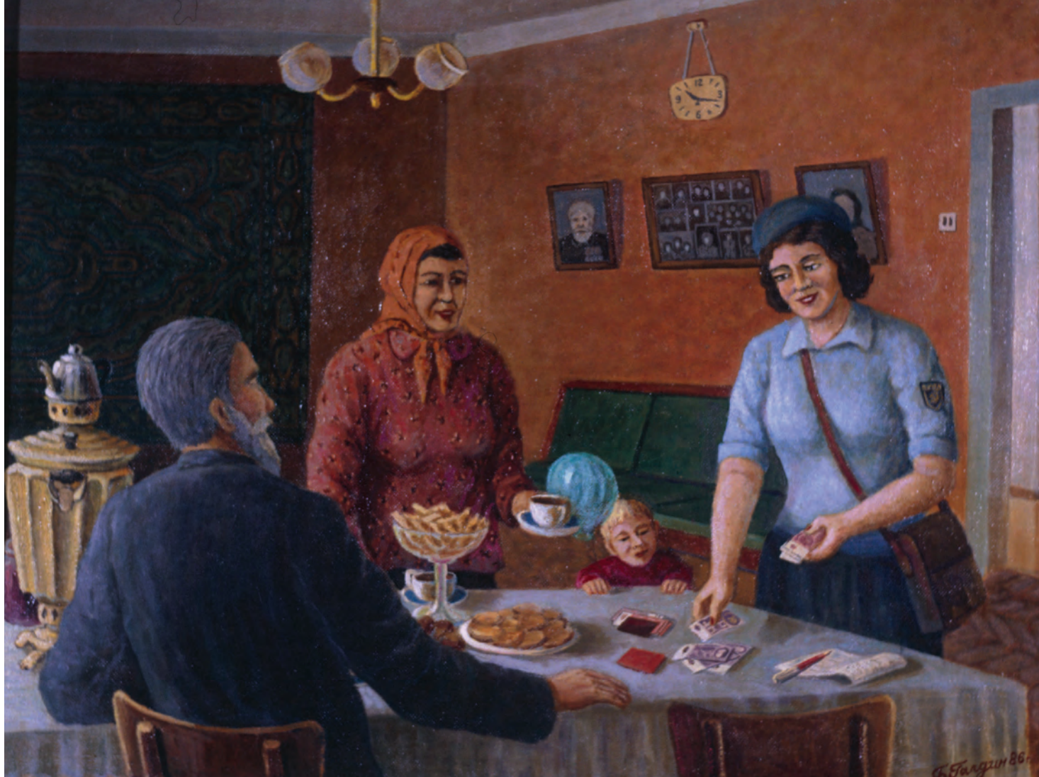
Б. Галдин. Обеспеченная старость. 1980-е гг.