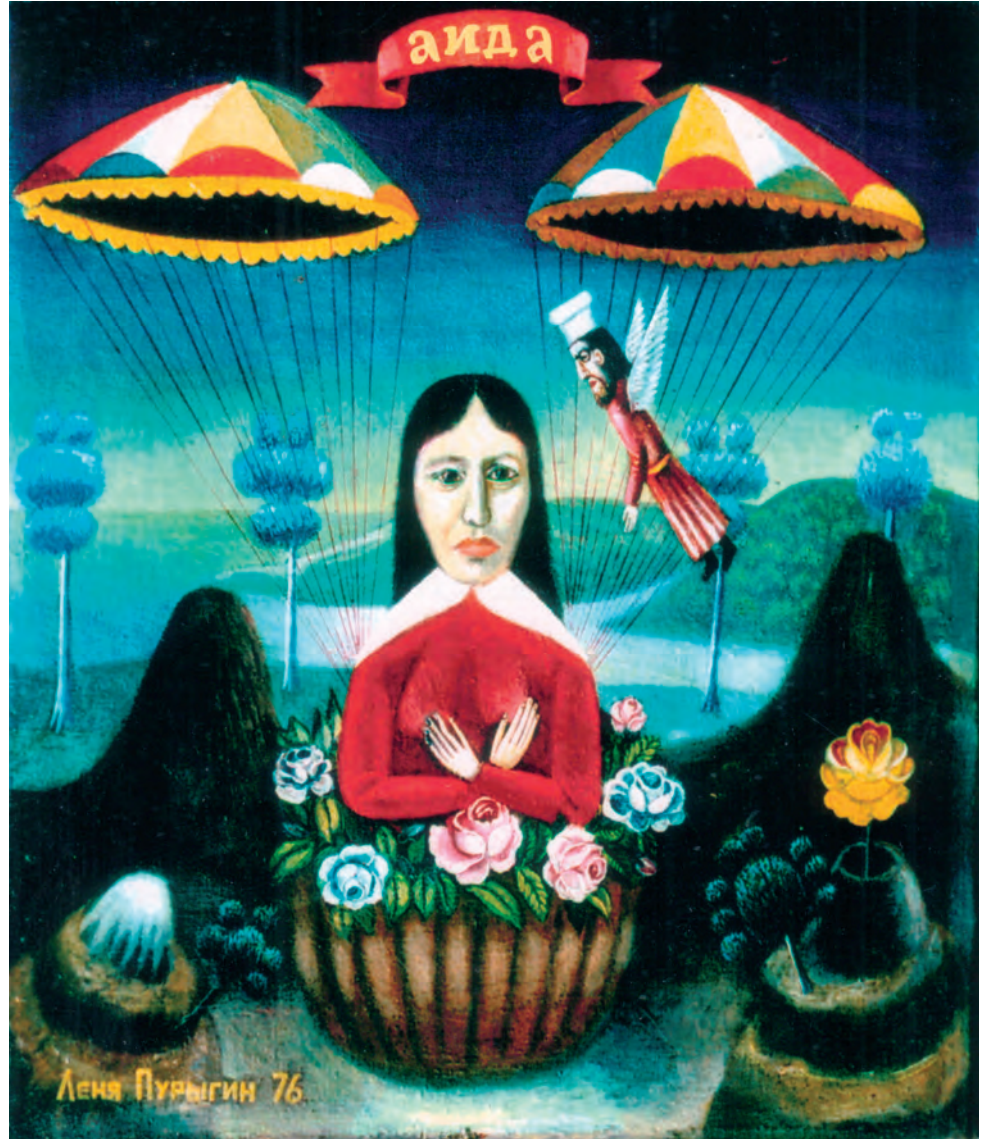
Л. Пурыгин. Аида. 1976.