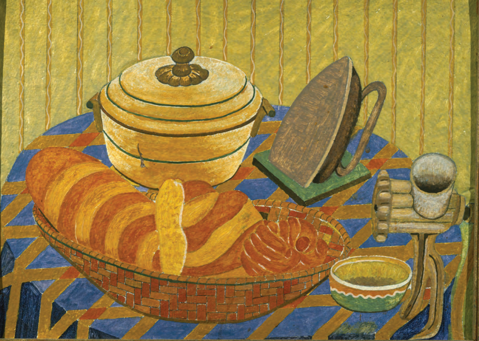
В. Ткаченко. Натюрморт. Суповник с хлебницей.