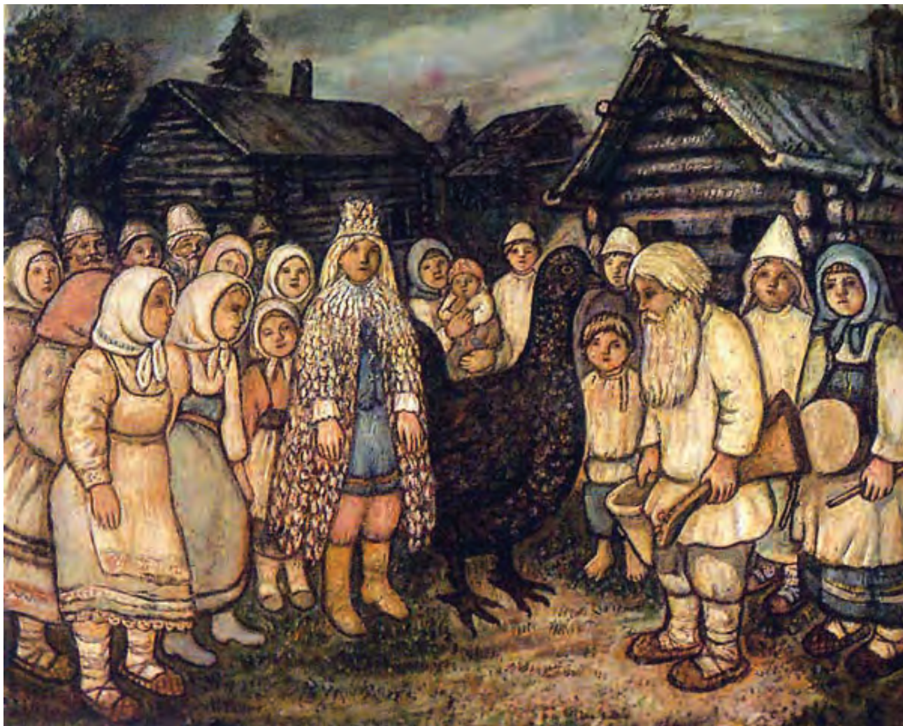
Е. Честняков. Тетревинный король.