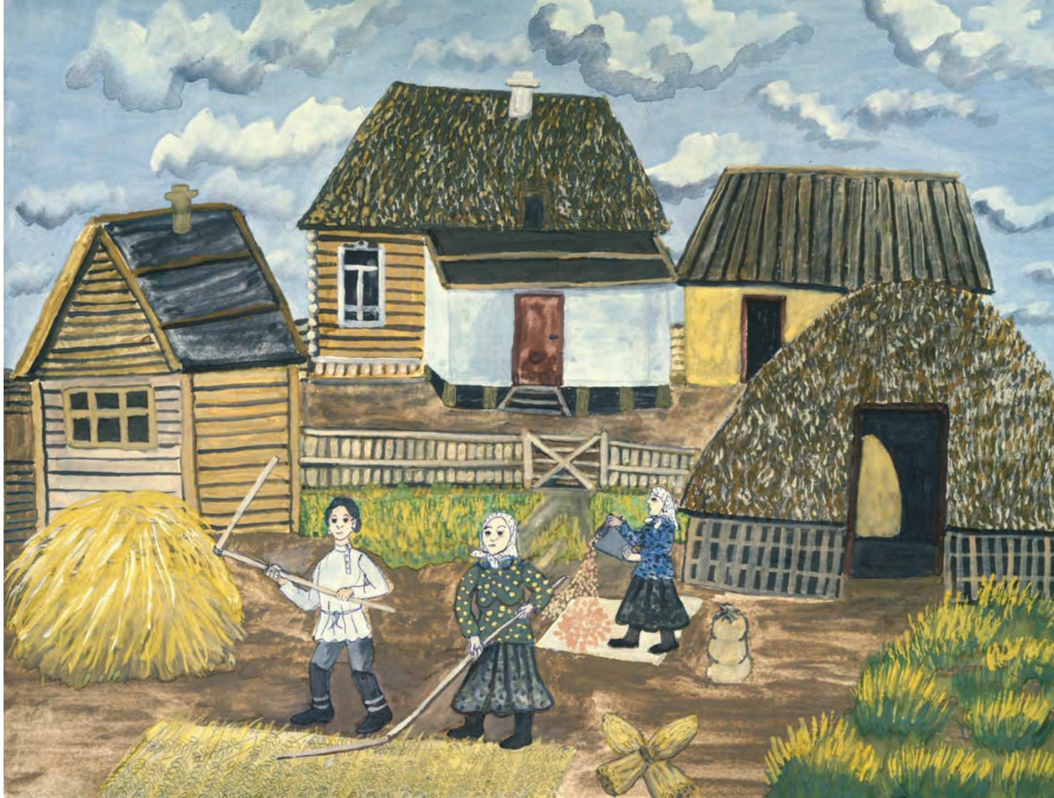
Н. Варфоломеева. Молотьба.