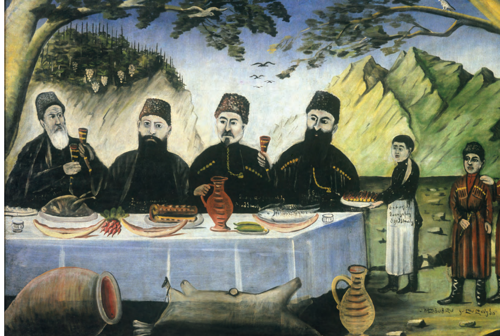
Н. Пирсманашвили. Кутеж у Гвимрадзе. Государственный музей искусств Грузии, Тбилиси.