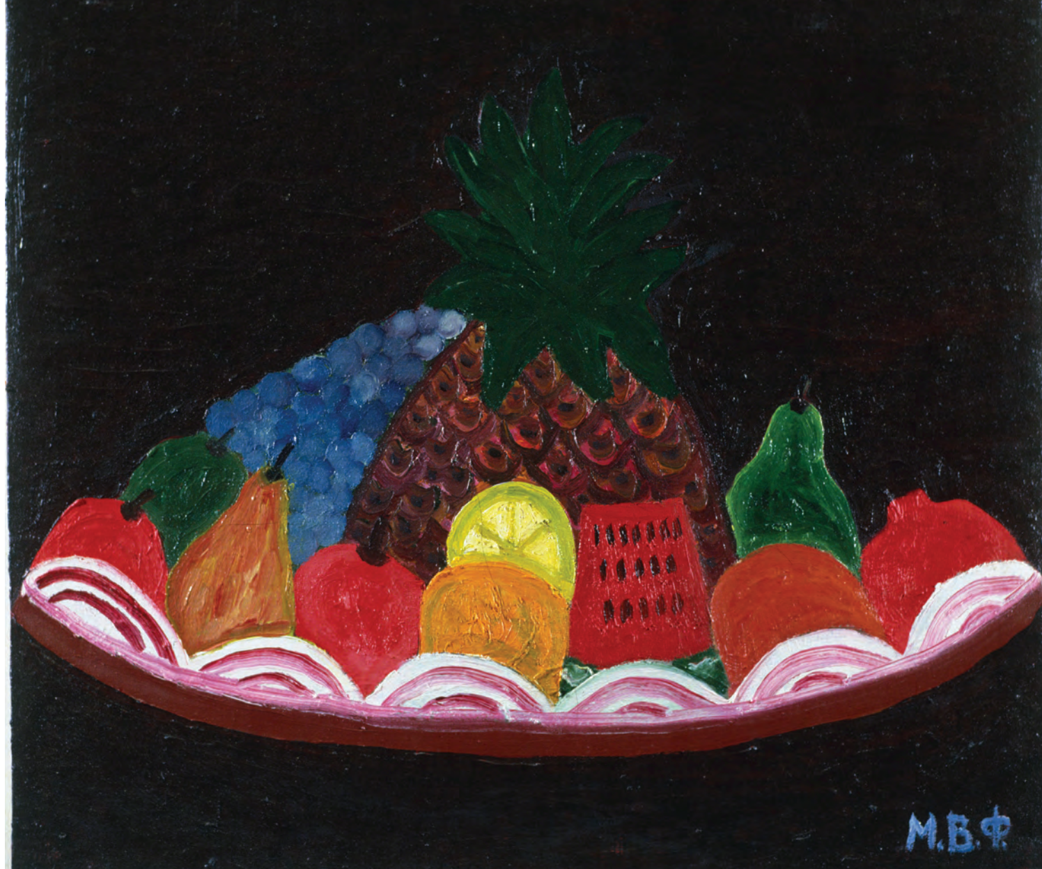
В. Мизинов. Натюрморт.