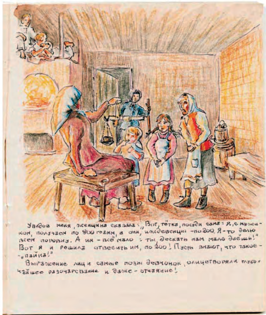
Е. Керновская. Лист из тетради воспоминаний.

Увидев меня, женщина сказала: "Вот, тетка, посади сама: я, с мужичком, получаем по 800 грамм, а они, иждивенцы - по 200. Я - то дело всем поровну. А им - всё мало: ты дескать нам мало даёшь!" Вот я и решила отвесить им, по 200! Пусть знают, что такое - "пайка!"