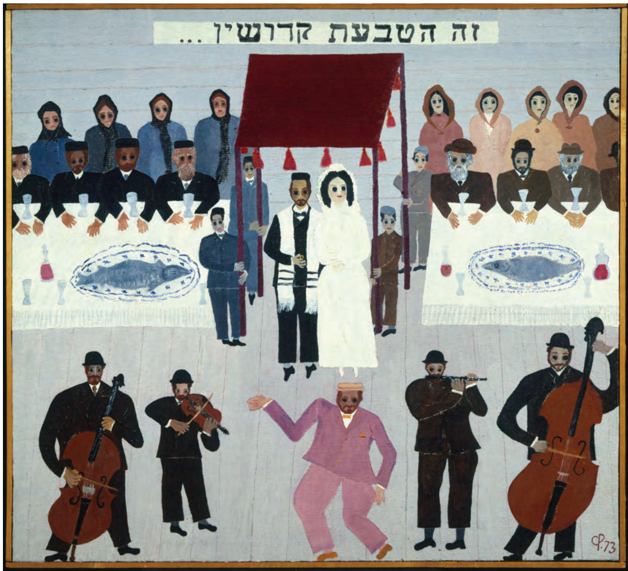
С. Рубашкин. Свадьба. 1973.