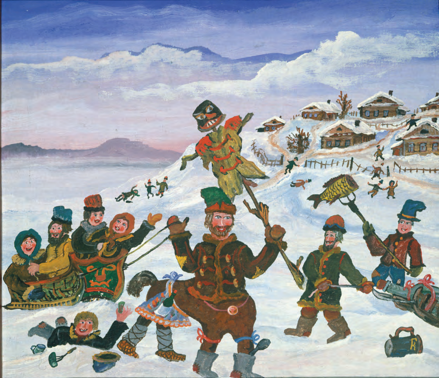
Г. Кусочкин. Масленица.