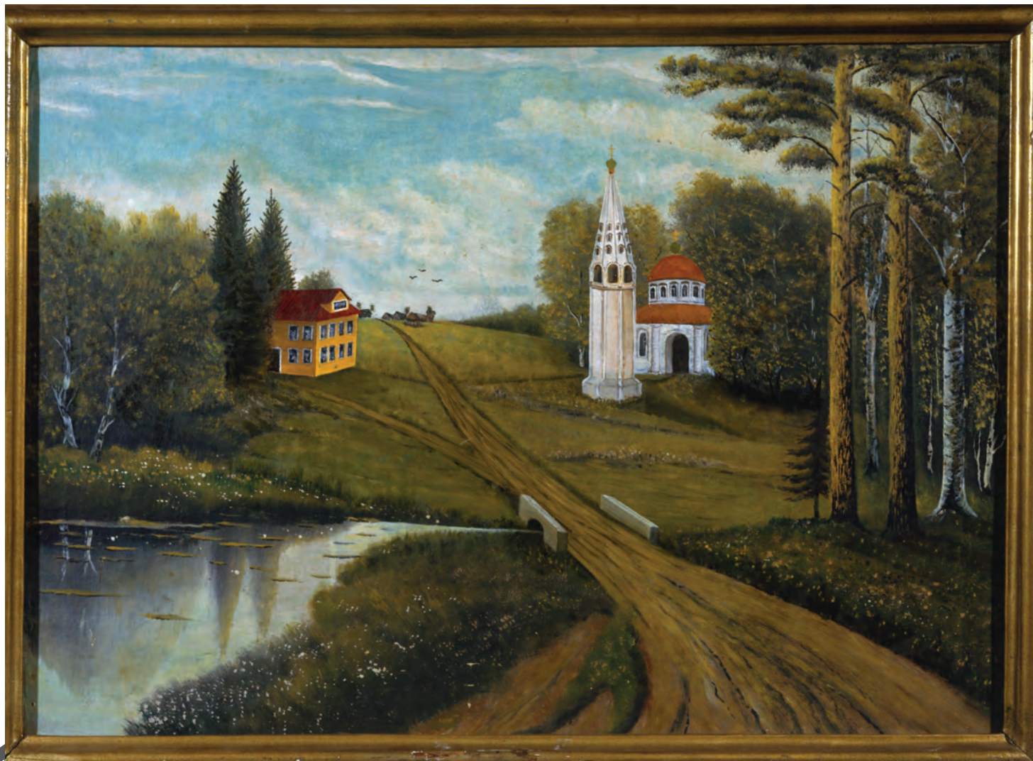
М. Мартюков. Российский дом народного творчества, проселочная дорога, сельский приход. 1986