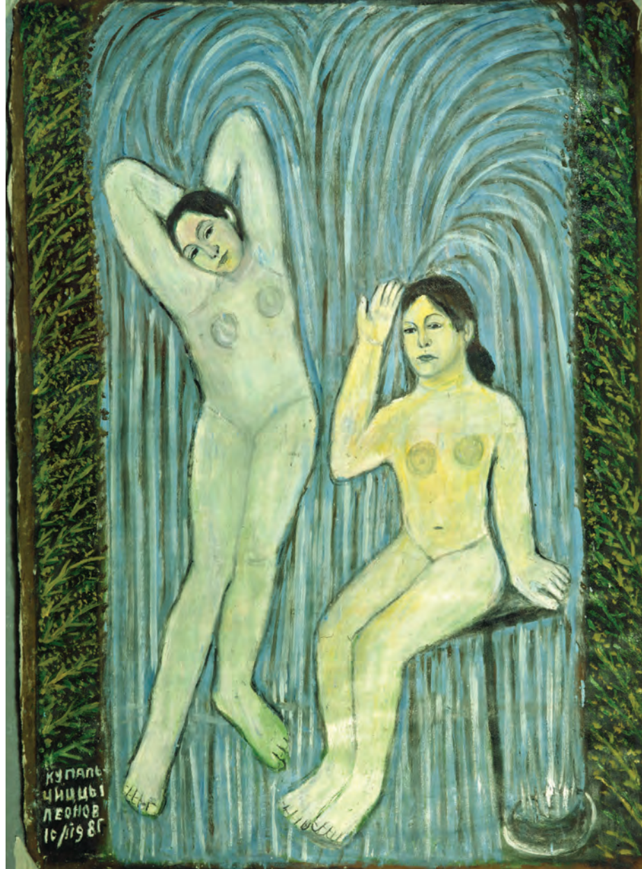
П. Леонов. Купальщицы. 1998. Музей Шарлотты Цандез, Германия.