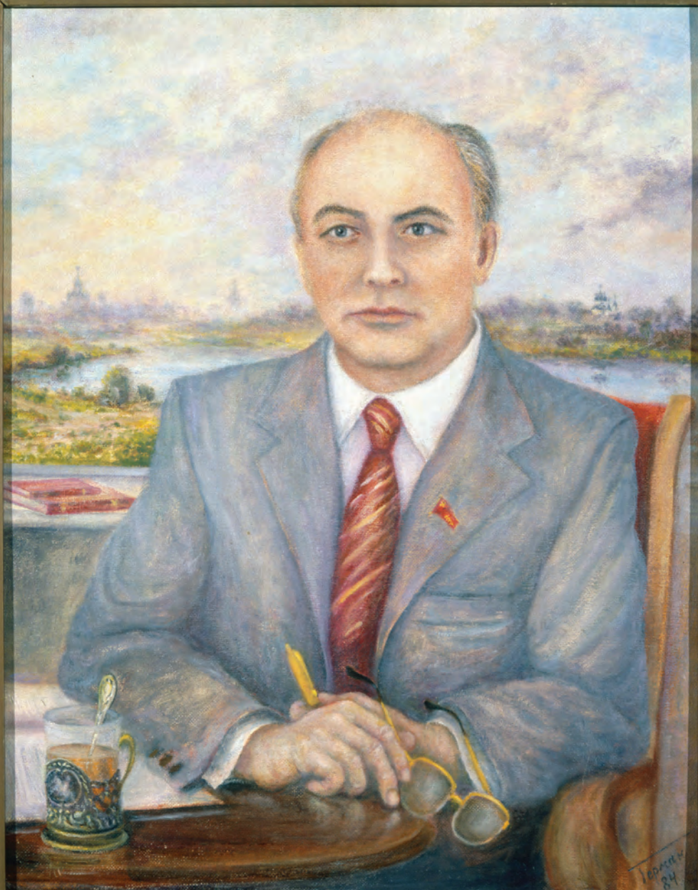
Михаил Горбачев.