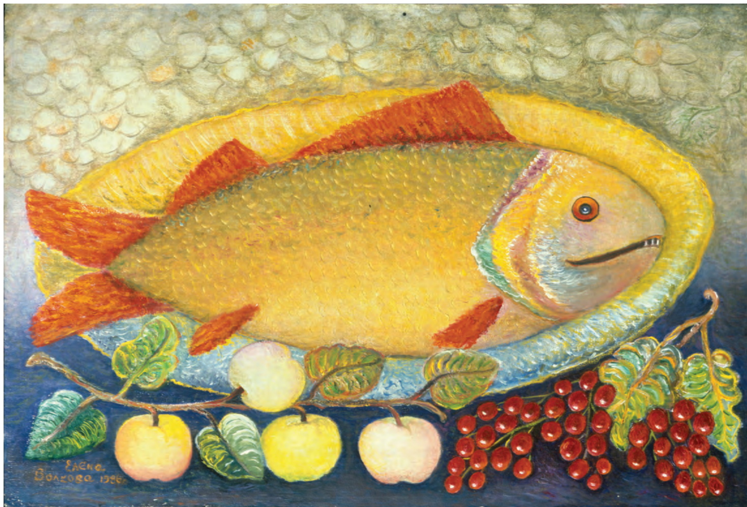
Е. Волкова. Рыба. 1986.