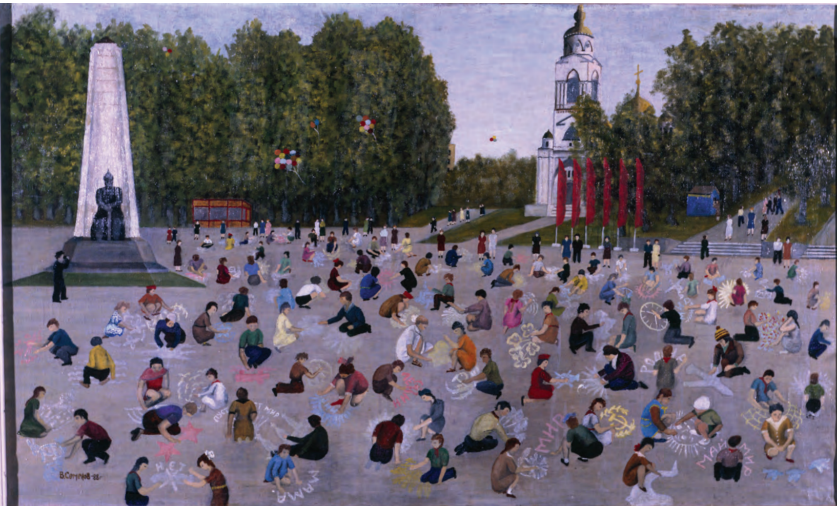
В. Семенов. Дети рисуют на асфальте.