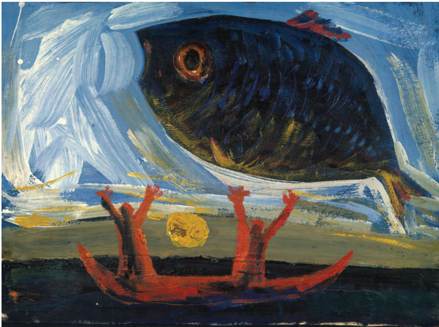
В. Шевченко. Рыба.