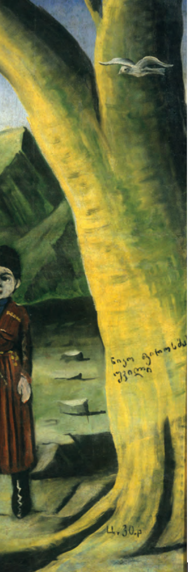
М. Ржаников. С сенокоса и охоты. 1991.