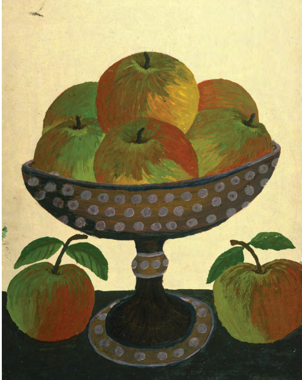
Н. Варфоломеева. Натюрморт. 1980-е гг.