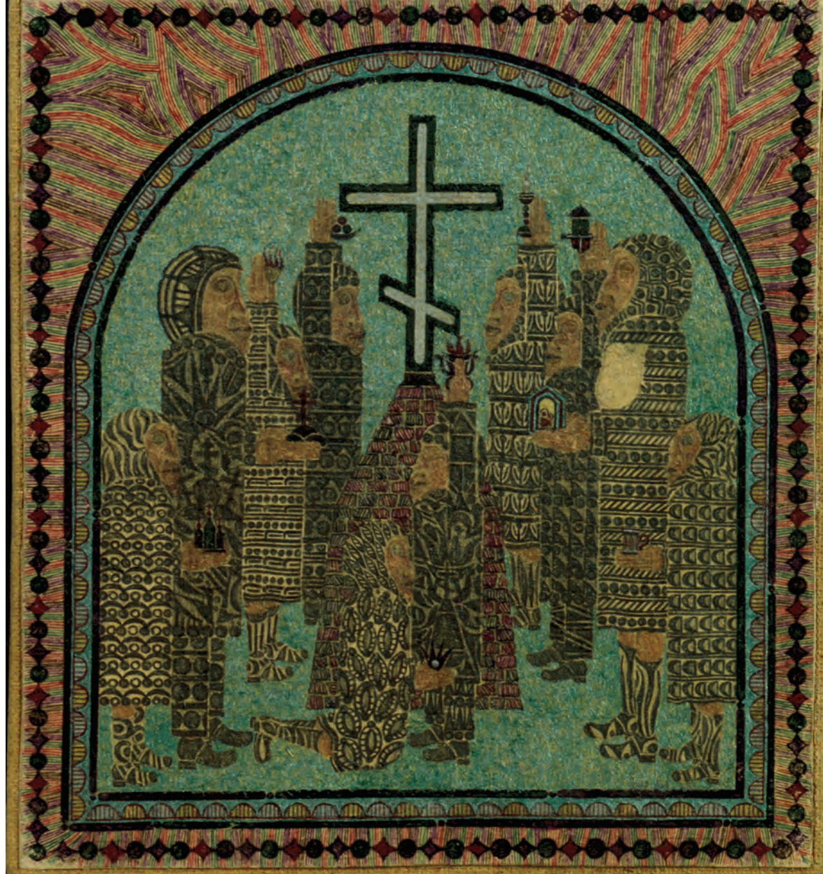
В. Романенков. Моление кресту. 2003.