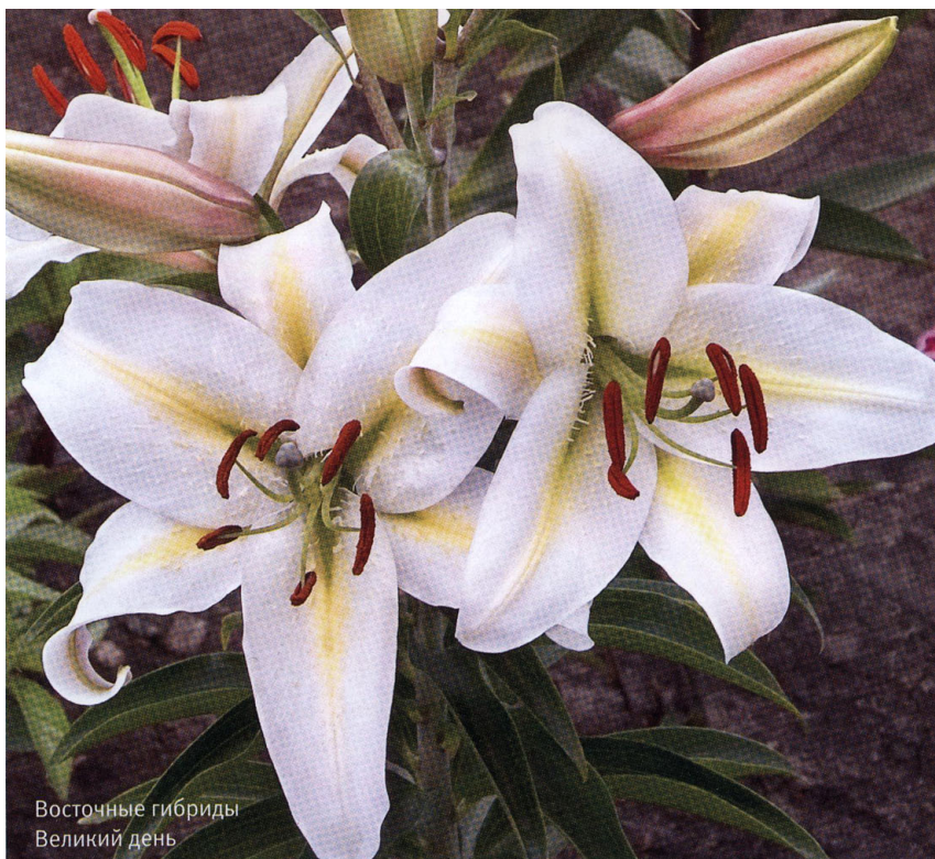
Восточные гибриды Великий день