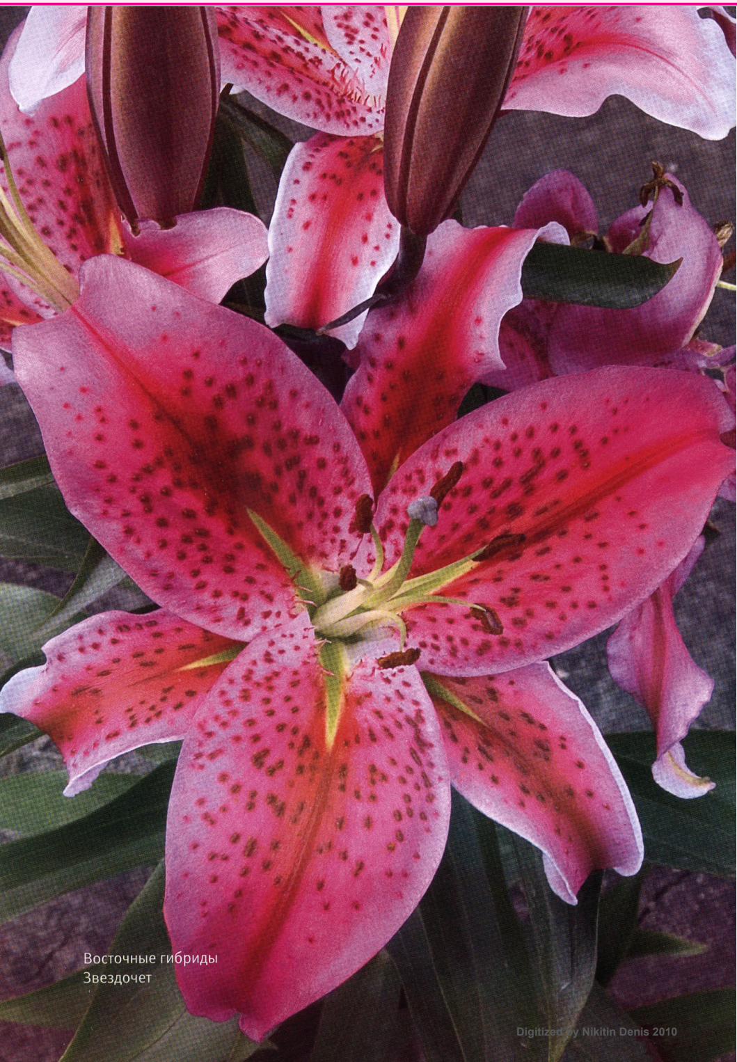
Восточные гибриды Звездочет