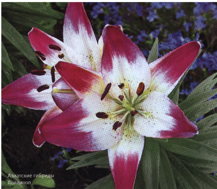
Азиатские гибриды Лоллипоп