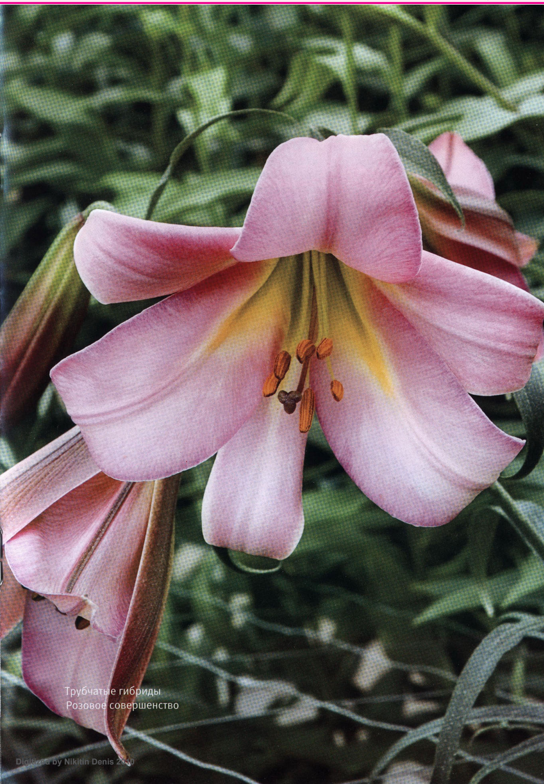
Трубчатые гибриды Розовое совершенство