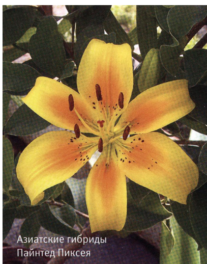
Азиатские гибриды Пайнтед Пиксея