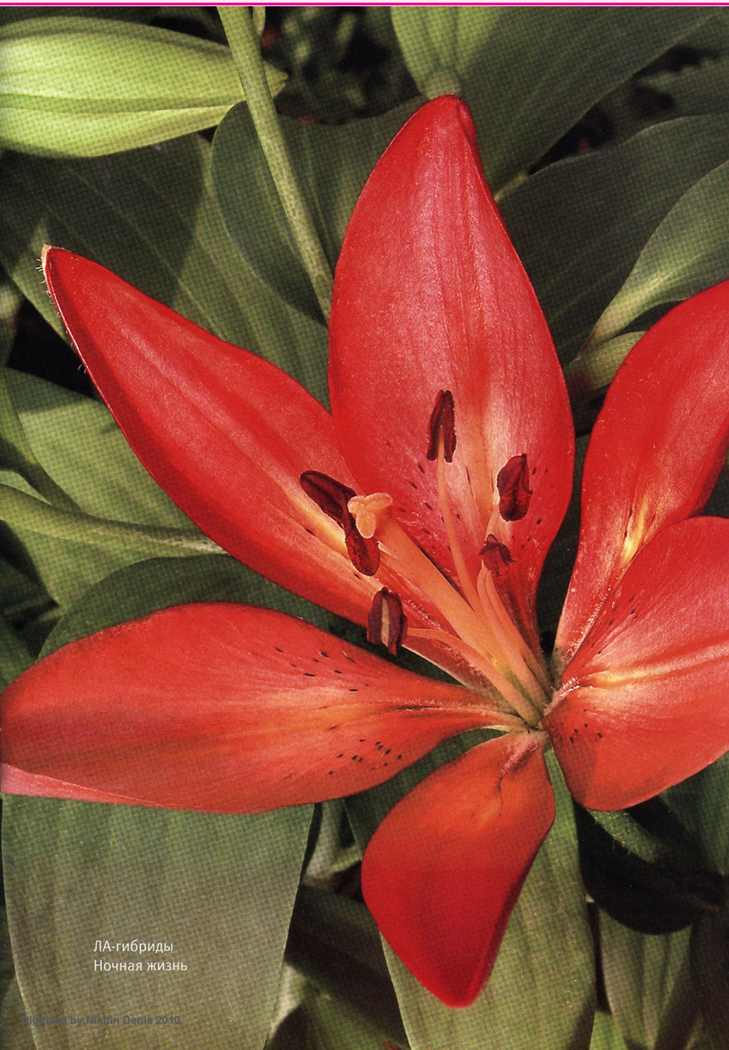
ЛА-гибриды Ночная жизнь