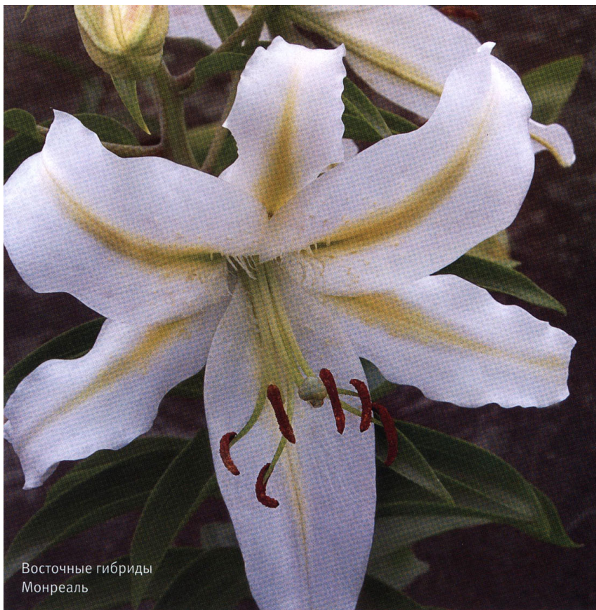
Восточные гибриды Монреаль

тельно с августа по сентябрь. Цветки кубковидные, диаметром до 30 см. Расстояние между растениями при посадке должно составлять 30-45 см. Эффектные Восточные гибриды, выращиваемые в защищенном или открытом грунте, требуют довольно тщательного ухода. Им нужны хорошо дренированная кислая плодородная почва, защищенное от ветра солнечное место, а также укрытие на зиму.