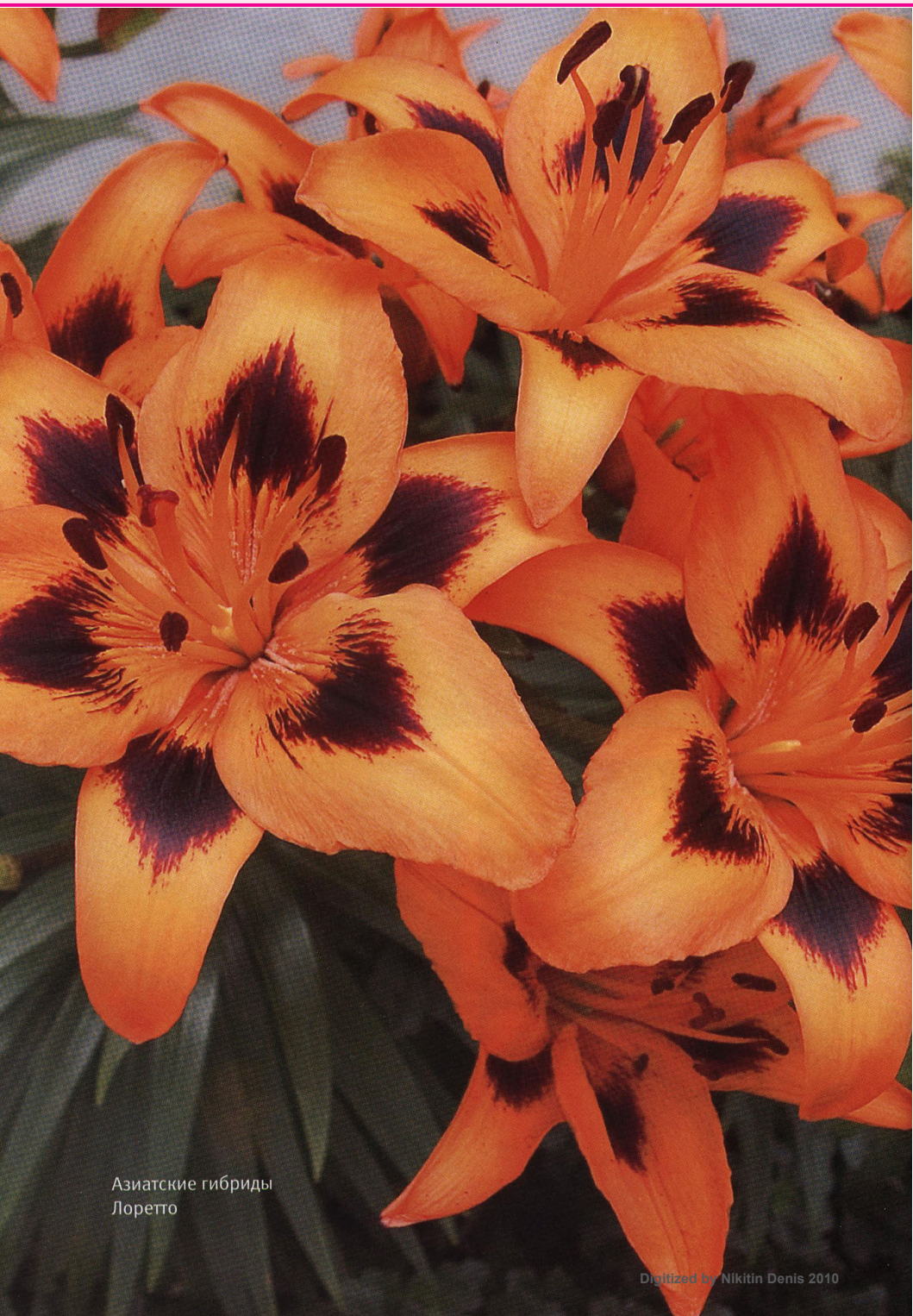
Азиатские гибриды Лоретто