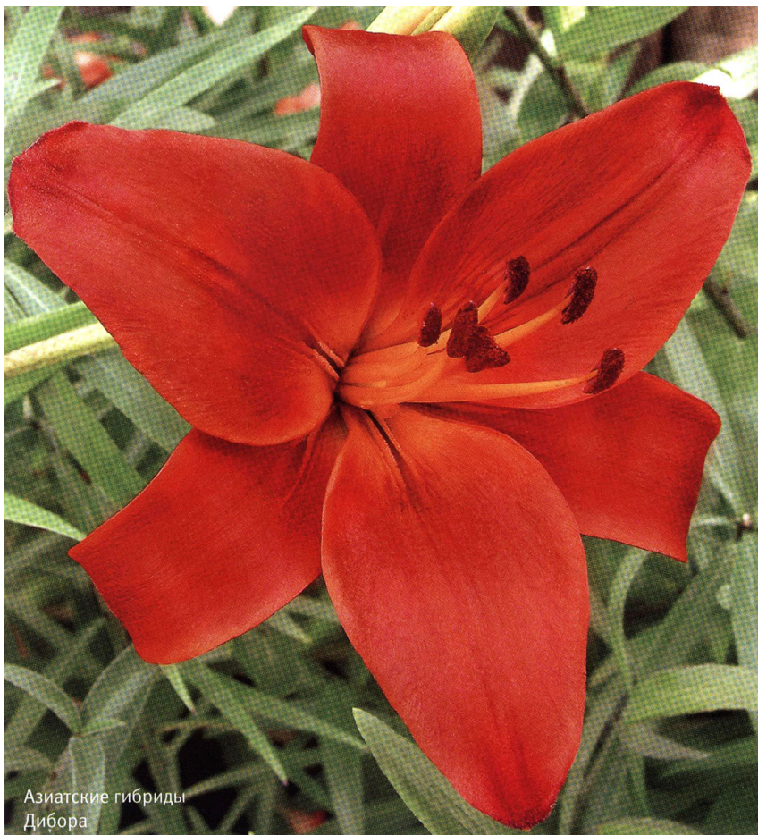
Азиатские гибриды Дибора

шом затенении. К почвам Азиатские гибриды также не слишком требовательны, но все же предпочитают рыхлые питательные водопроницаемые почвы с нейтральной или слабокислой реакцией. Высота растений колеблется в пределах 0,5-1,5 м, цветут они в июне - начале августа. Диаметр цветка достигает 12 см. Расстояние между растениями при посадке должно составлять 0,5 м.