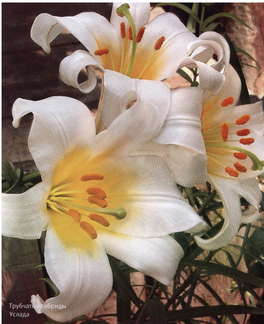
Трубчатые гибриды Услада

оттенков. Объединяет эти лилии сильный аромат. Такие лилии, отличающиеся обильным цветением и яркостью окраски, хорошо использовать в парках и скверах. Обладающий дурманящим запахом Трубчатый гибрид Услада лучше выращивать на некотором расстоянии от зон отдыха.