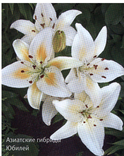
Азиатские гибриды Юбилей