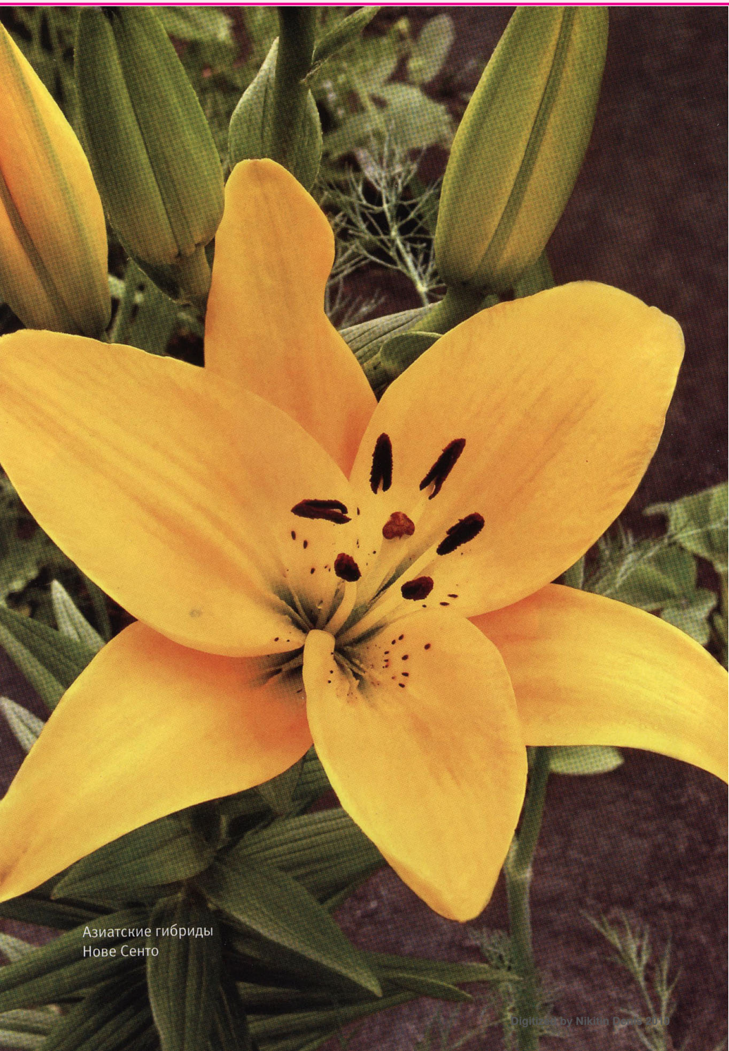
Азиатские гибриды Нове Сенто