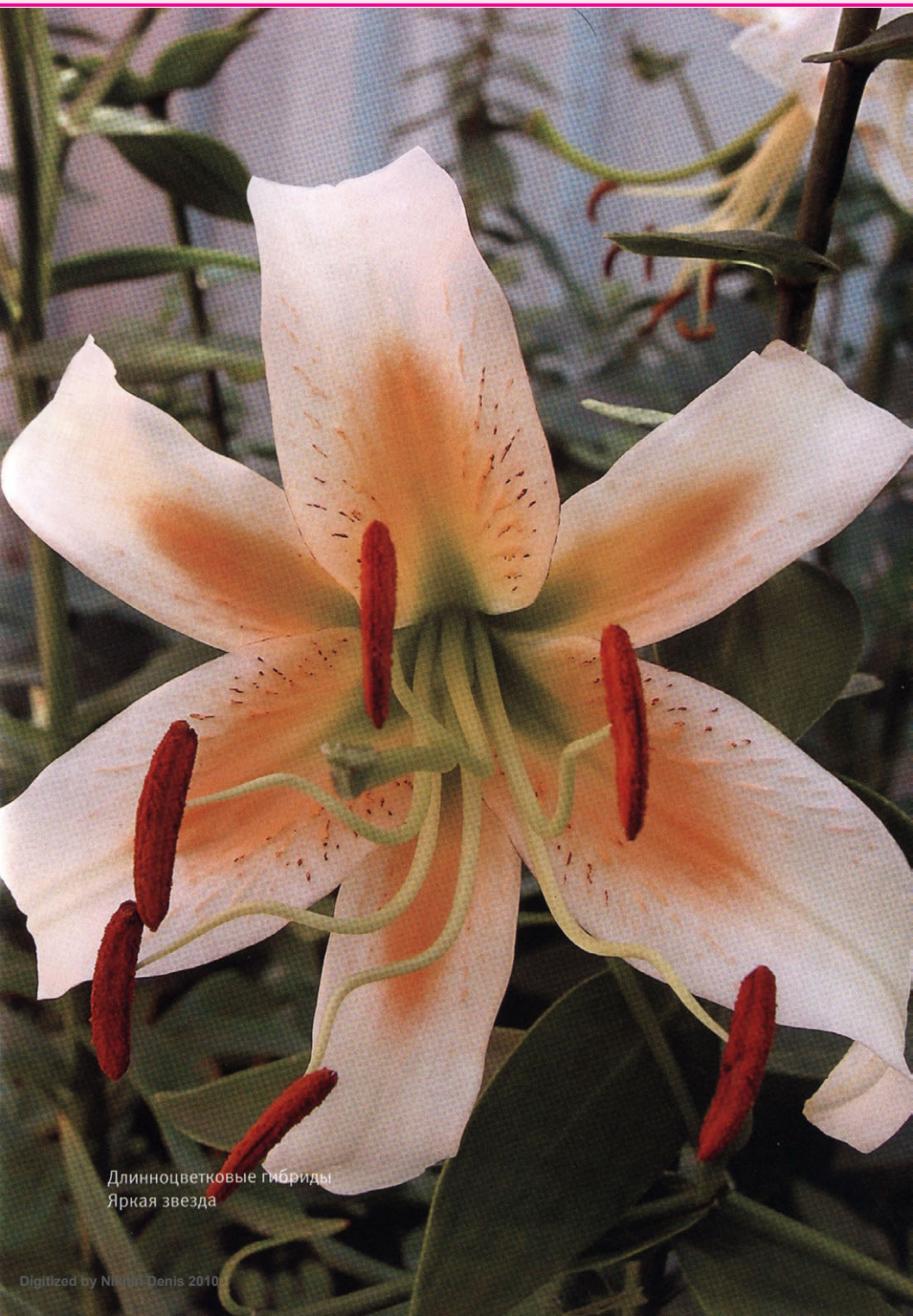
Длинноцветковые гибриды Яркая звезда