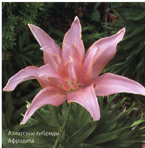
Азиатские гибриды Афродита

Гибриды Афродита и Фата Моргана поразят воображение любителей экзотики. А любителей экспериментов непременно заинтересуют лилии сортов Лоллипоп , Лоретто , Пайнтед Пиксел , Юбилей . Если вам в саду нужны яркие насыщенные пятна, то как нельзя лучше подойдут сорта Монте Негро , Дибора , Нове Сенто .