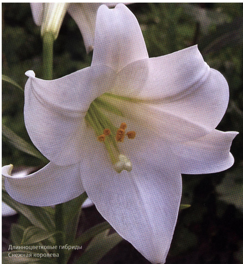
Длинноцветковые гибриды Снежная королева

Такие лилии можно выращивать как в закрытом грунте для выгонки, так и дома в контейнерах. Эти грациозные цветы достигают высоты 0,8-1,0 м. При посадке расстояние между растениями должно быть не менее 45 см. Цветение происходит в июле-августе.