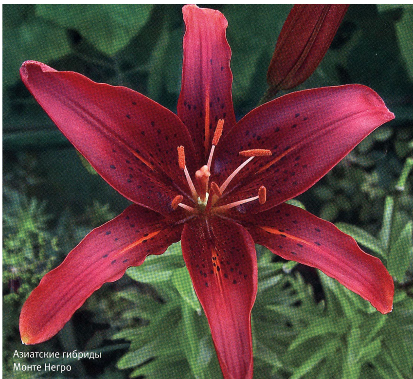
Азиатские гибриды Монте Негро