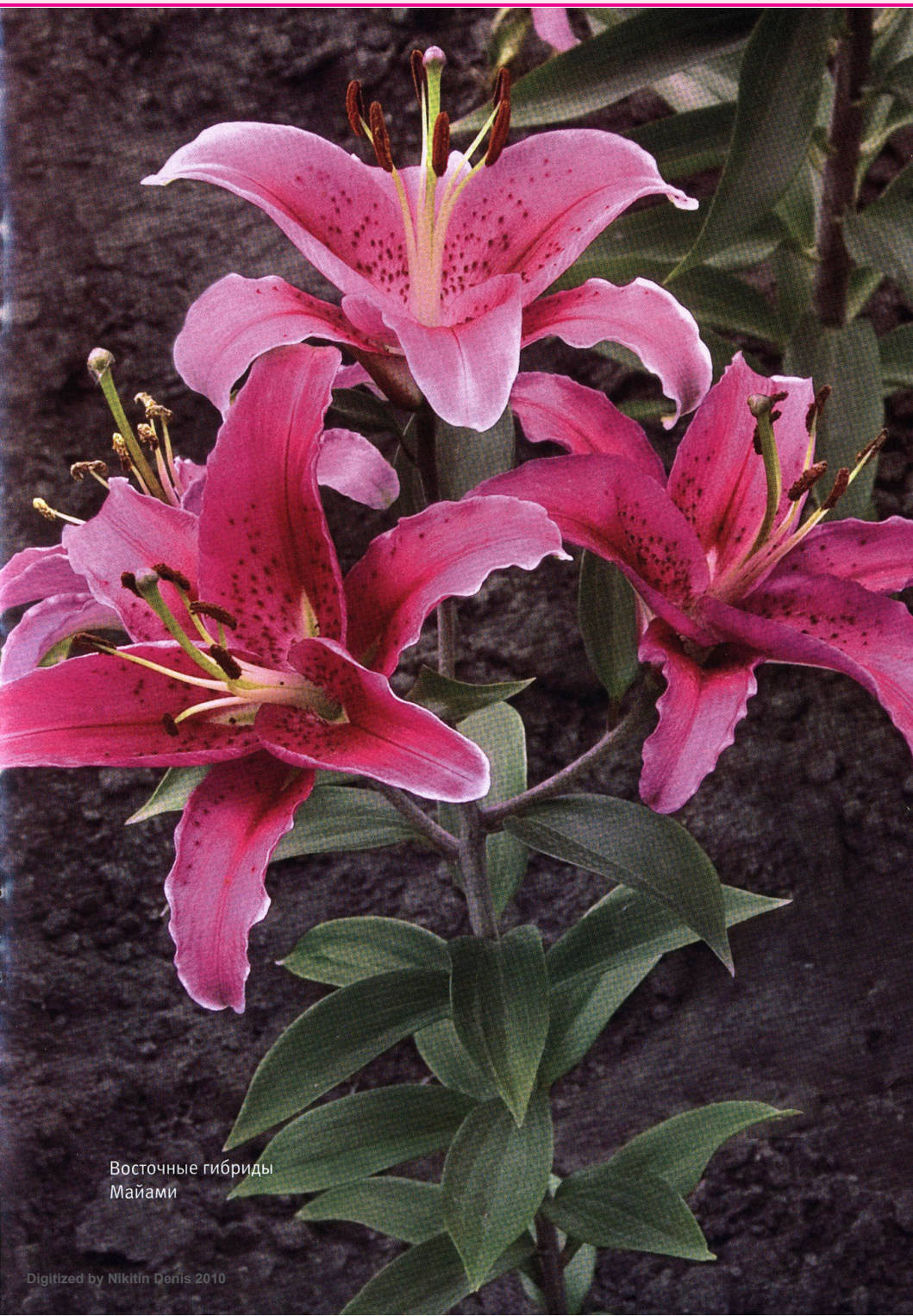
Восточные гибриды Майами