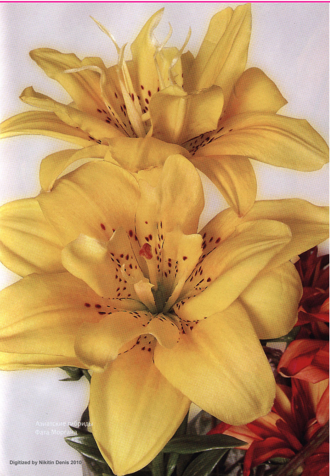
Азиатские гибриды Фата Моргана