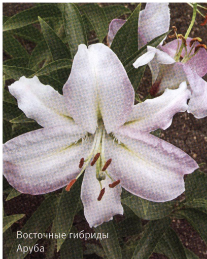
Восточные гибриды Аруба