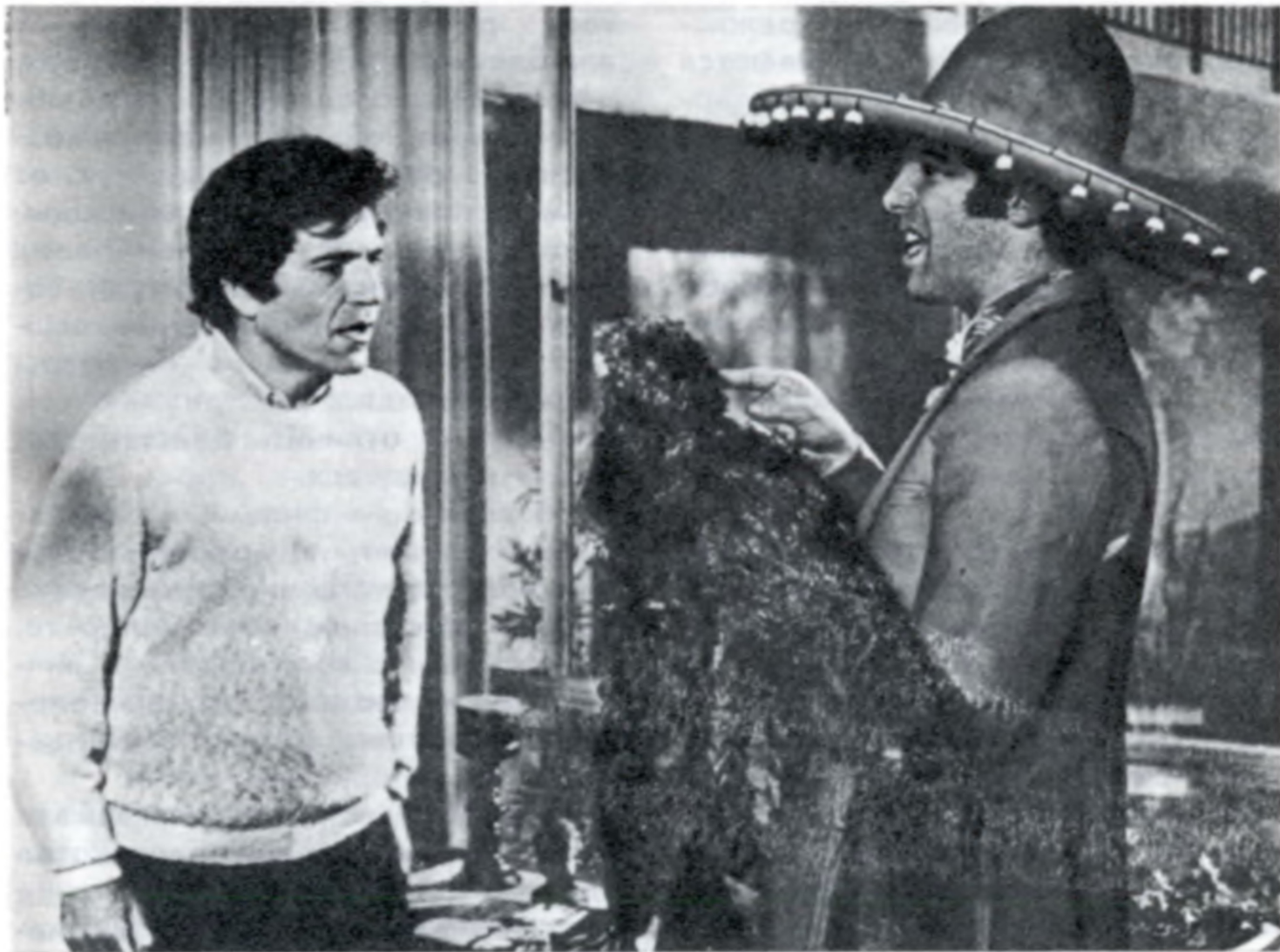
Кадр из фильма «Калифорнийский покер»

кого для своего времени документа, как «Декларация о независимости» США, стал поводом для осмысления или переосмысления пройденного страной исторического пути. Появившиеся в связи с этим юбилеем произведения имели далеко не однородный характер: среди них были и откровенно буржуазно-апологетические и критические, правдиво анализирующие явления американской действительности.