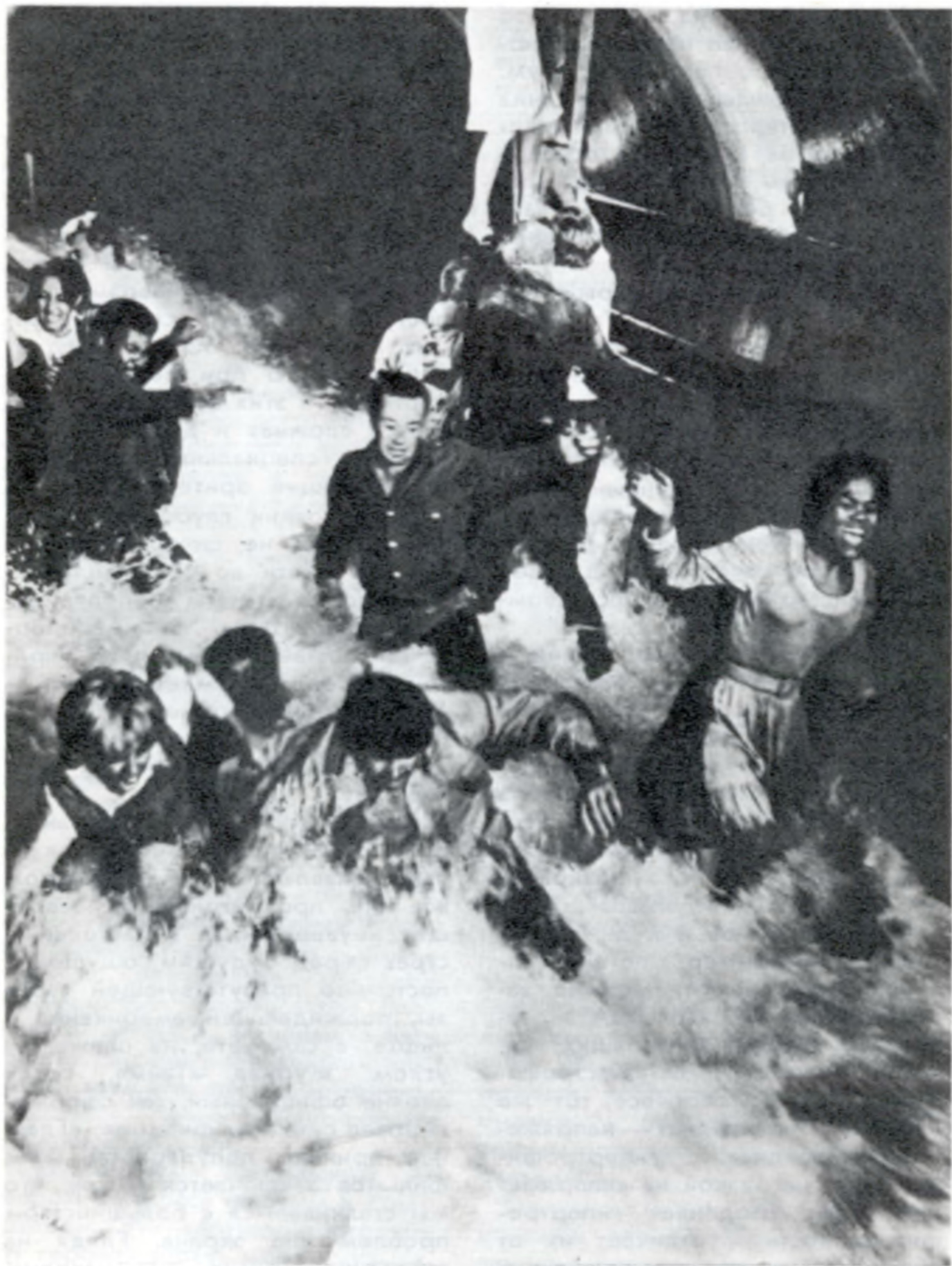
Кадр из фильма «Землетрясение»