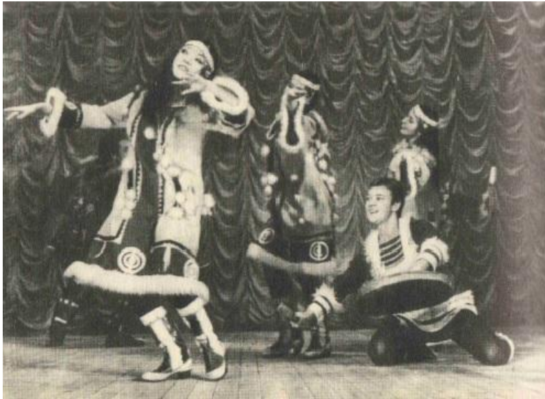
Корякский танец в исполнении студентов Московского института культуры

Более полувека назад М. И. Калинин посвятил народному танцу такие слова: «И песни и пляски создавались народом на протяжении десятилетий и даже столетий, народ оставлял в них только самое ценное, бесконечно совершенствовал и доводил законченной формы. Ни один великий человек не может за свой короткий век проделать такой работы, — это доступно только народу. Народ является и творцом и хранителем всего ценного». Постоянно учиться у того «творца и хранителя всего ценного» — долг деятеля советской хореографии.