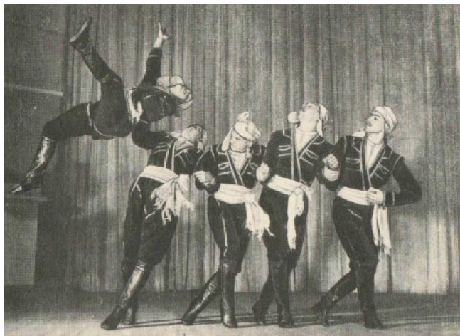
Аджарский танец «Хоруми» в постановке И. Моисеева

Первая часть — появление воинов, вторая — разведка, третья — бой с противником, а четвертая — или торжество победителей, или спасение раненого товарища и уход. Многие балетмейстеры работали над сценической интерпретацией этого танца, и многие варианты были удачными. Главное — это бережное и точное воспроизведение народной манеры исполнения.