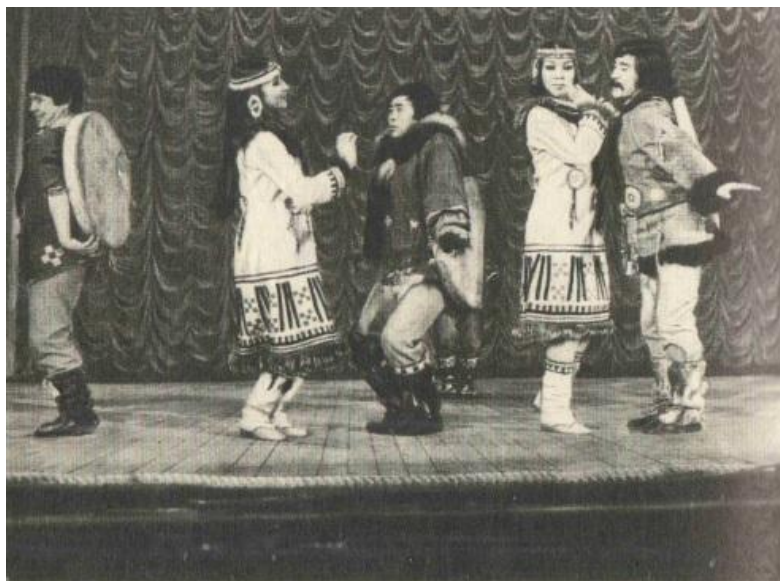
Корякский народный танец в исполнении национального ансамбля танца. Балетмейстер А. Гиль

Заштампованная, схематичная форма танца, где в пантомиме отражается сюжет, а потом идет перепляс, в котором, как правило, определенный набор трюков, устарела и не может выразить всего богатства национальных черт, многообразия фольклора, раскрыть образ нашего современника.