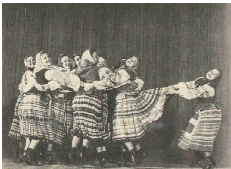
Белорусский танец «Бульба», поставленный И. Моисеевым

стером О. Князевой, с «Субботеей» балетмейстера М. Чернышева, поставленной им в Воронежском народном хоре, работами В. Модзольского, Г. Гальперина и многими другими. Это бывает тогда, когда хореограф смог уловить подлинный характер танца, народную манеру исполнения, найти интересную танцевальную лексику, в результате чего танец со сценической площадки шагнул в народ, вошел в быт народа. Как мы уже говорили, белорусским народным танцем стала «Бульба», созданная в свое время И. Моисеевым для ансамбля. Теперь «Бульбу» танцуют на народных праздниках, в коллективах художественной самодеятельности, на профессиональной сцене — танцуют как подлинно народный танец.