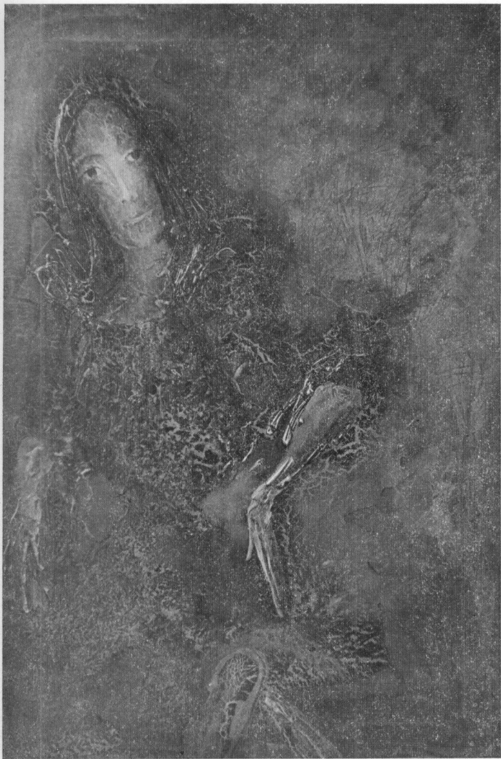
Работа Ю. Жарких « Женский портрет », сожженная 15 сентября 1976 г.