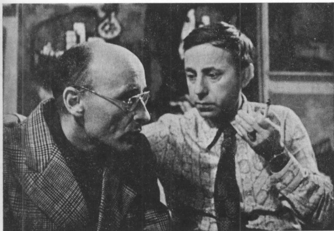
Оскар Рабин и Александр Глезер накануне выставки 29 сентября 1974 г.