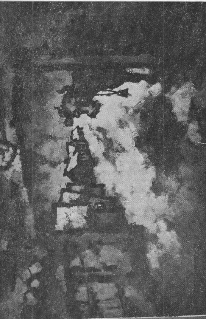
Погибшая под бульдозером картина Рабина « Деревня »