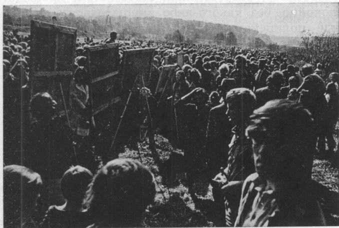
На выставке в Измайловском парке 29 сентября 1974 г.