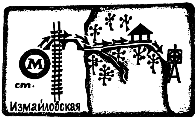
План прохода на выставку от метро «Измайловская»

Проезд на машинах по Первомайской ул., далее поворот на 3-Парковую ул. до конца.