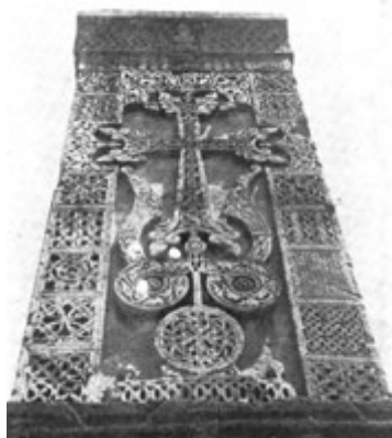
Рис. 31. Хачкар в Ахпате, 1220 г.