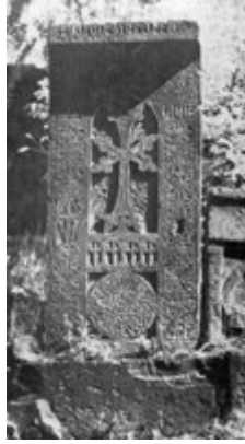
Рис. 80. Хачкар в Бжни (1580 г.).