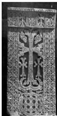
Рис. 51. Хачкар в Гегарде (XIII в.).