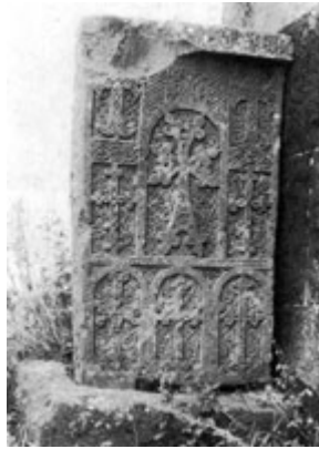
Рис. 81. Хачкар в Айриванке (XVI в.).