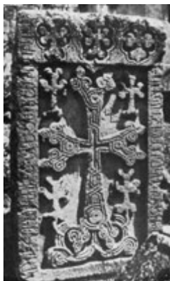
Рис. 73. Хачкар в с. Гергер, 1313 г.