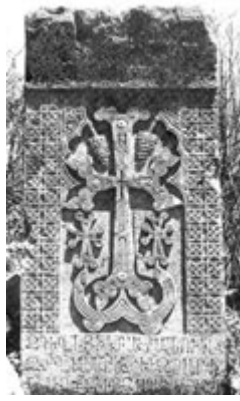
Рис. 50. Хачкары в Цахац-Каре, XII в.