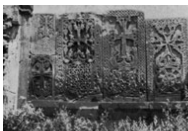
Рис. 15. Группа хачкаров в монастыре в Кечарисе.