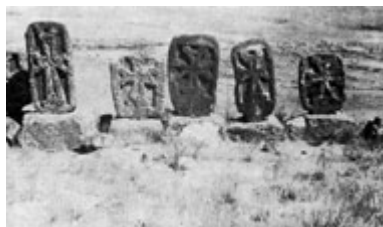
Рис. 10. Хачкары IX в. близ Неркин Талина (ныне с. Даштадем).