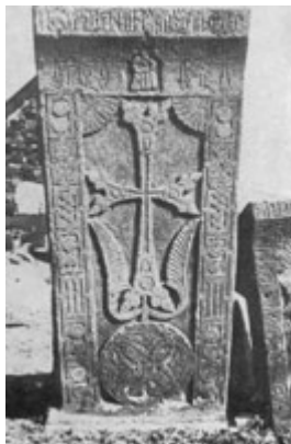
Рис. 77. Хачкар 1529 г., в Дашкенде.