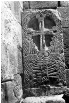
Рис. 22. Хачкар в Бюракане (XI в.).