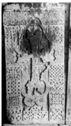
Рис. 18. Хачкар в Ахпате (1023 г.).