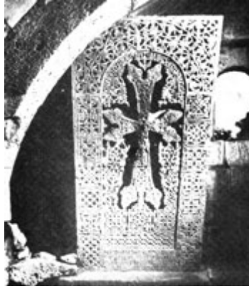
Рис. 39. Хачкар Саркиса Великого в Санаине, 1187 г.