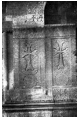
Рис. 48. Хачкар в Ованнаванке (XIII в.).