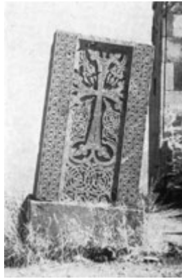
Рис. 40. хачкар в Авуц-таре, XII в.