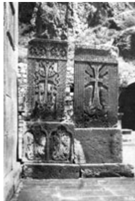
Рис. 44. Хачкар начала XIII в. В Гегарде.