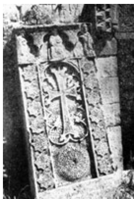
Рис. 56. Хачкар 1308 г. из Нораванка, мастер Момик (ныне в Эчмиадзине).