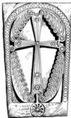
Рис. 8. Хачкар из Норадуза (ныне в ИМА), 996 г