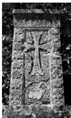
Рис. 55. Хачкар Григора Хахбакяна, 1233 г. из Имирзика (ныне в Эчмиадзине).