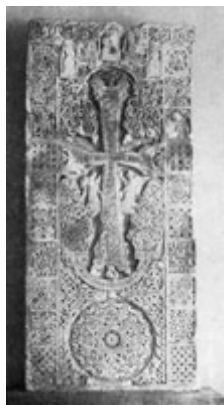
Рис. 66. Хачкар из Нагорного Карабаха (XIV в.).