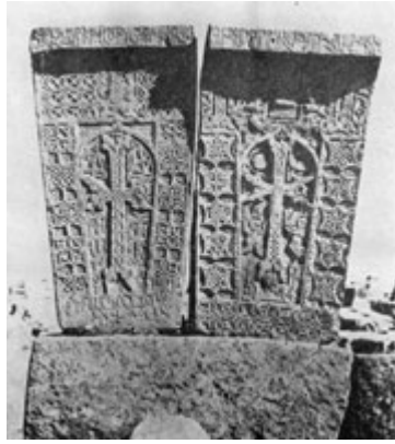
Рис. 84. Хачкар 1582 г. в Нордуге (левый).