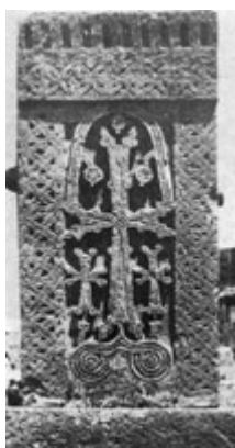
Рис. 74. Хачкар в Норадуже (XIV в.).