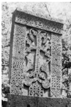
Рис. 30. Хачкар в Санаине, 1227 г.