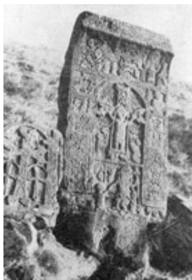
Рис. 87. Хачкар 1653 г. на полуострове Севан.