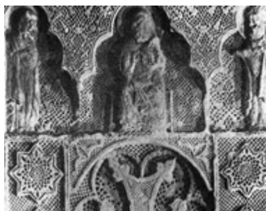
Рис. 57. Хачкар 1308 г. из Нораванка (фрагмент).