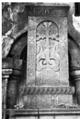
Рис. 33. Хачкар в Санаине (XII-XIII вв.).