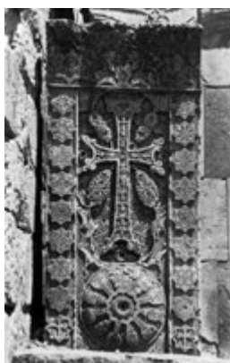
Рис. 64. Хачкар 1291 г. в Нор-Гетике, мастер Погос.