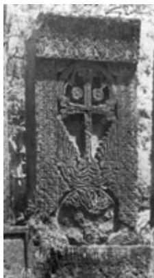
Рис. 26. Хачкар в Бжни (1291 г.).