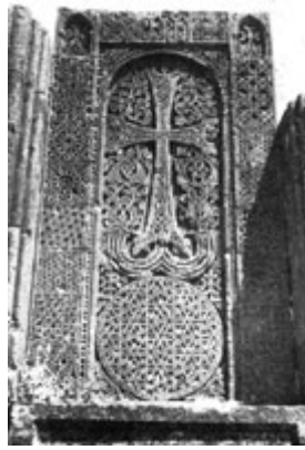
Рис. 46. Хачкар в Сагмосаванке (XIII в.).