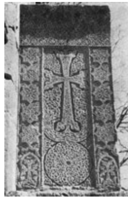
Рис. 45. Хачкар в Агарцине (XIII в.).