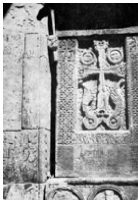
Рис. 35. Хачкар в Мшкванке (XII-XIII вв.).