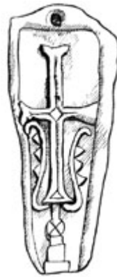
Рис. 6. Хачкар близ Талина.