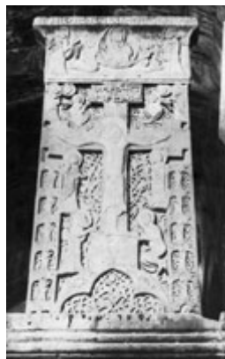
Рис. 61. Хачкар Аменапргич 1273 г. в Ахпате.