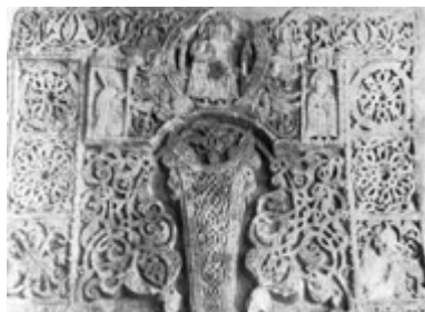
Рис. 62. Хачкар XIV в. из Нагорного Карабаха, фрагмент.