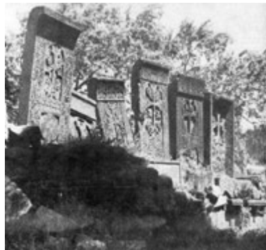
Рис. 52. Хачкар в Бжни (XIII в.).