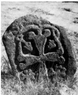
Рис. 12. Хачкар в Норадузе (IX в.).