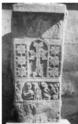
Рис. 88. Хачкар XVII в. в Эчмиадзине.