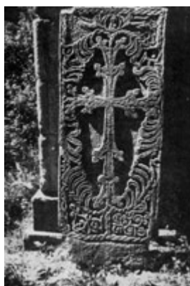
Рис. 9. Хачкар в Агарцине.