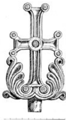
Рис. 3. Объемный (свободный) крест из Двина, V—VI вв.