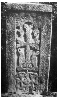
Рис. 67. Хачкар в Агарцине (XIV в.).