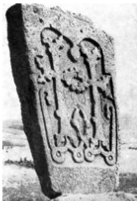
Рис. 54. Хачкар в с. Зод, 1274 г.