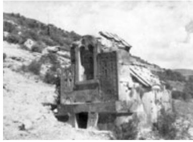
Рис. 20. Хачкары в Цахац-Каре (XI в.).