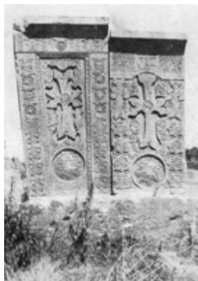
Рис. 79. Хачкар 1577 г. в г. Камо.