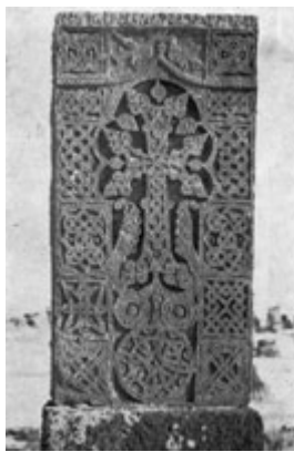
Рис. 75. Хачкар Даниела в Норадуже (XV в.).