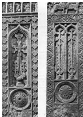
Рис. 91. Хачкар 1599 г. из Старой Джуги (ныне в Эчмиадзине).