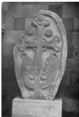
Рис. 16. Овальный хачкар, переведенный в Эчмиадзин.