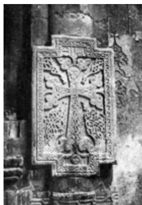
Рис. 38. Хачкар в Ованнавanke (XIII в.).