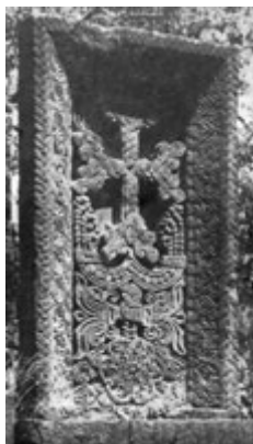
Рис. 27. Хачкар в Бжни (XIII в.).