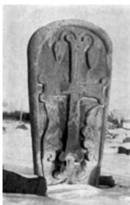
Рис. 13. Хачкар в с. Мец-Мазра (991 г.).