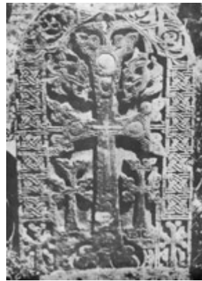
Рис. 72. Хачкар Авуц-Таре (XIV в.).