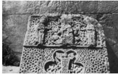
Рис. 59. Хачкар в Нораванке, фрагмент.