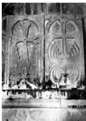
Рис. 17. Хачкар в Ахпате, 1004 г. (левый).