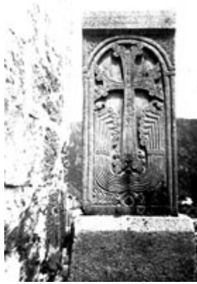
Рис. 21. Хачкар в Одзуне (XI в.).