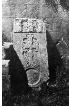
Рис. 58. Хачкар в Нораванке (XIV в.).