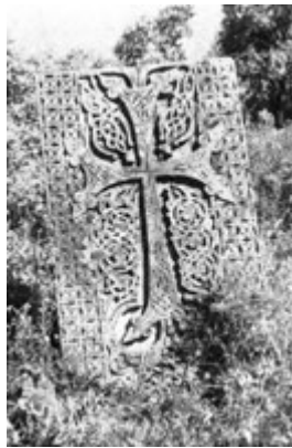
Рис. 41. Хачкар в Арзакане (XII-XIII вв.).