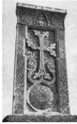
Рис. 70. Хачкар в Дсехе (XIV в.).