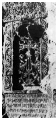
Рис. 68. Хачкар в Ване (1306 г.).