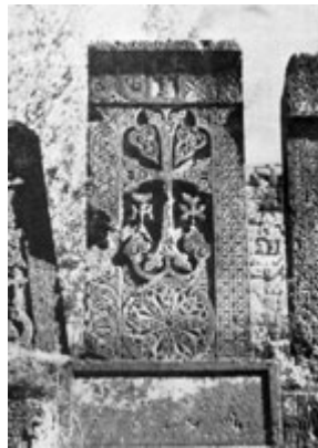
Рис. 71. Хачкар в Бжни (XIV в.).