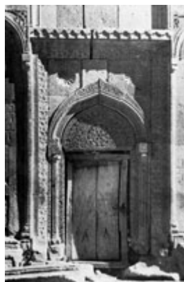
Рис. 65. Портал церкви св. Григора 1237 г. в Нор-Гетике.