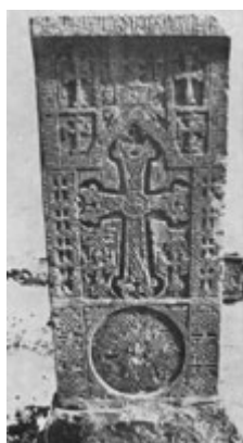
Рис. 78. Хачкар 1610 г., в Дашкенде.