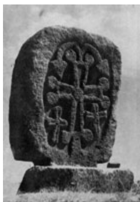
Рис. 11. Хачкар в Норадузе (IX в.).