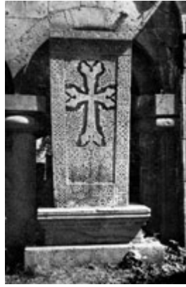
Рис. 43. Хачкар 1215 г. в Санаине.