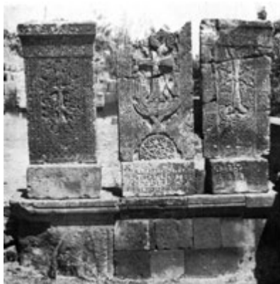
Рис. 25. Хачкар в Аштараке (XII в.).