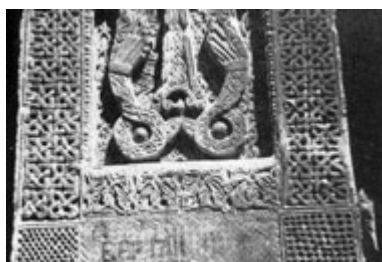
Рис. 36. Хачкар в Мшкванке (фрагмент).