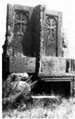
Рис. 47. Хачкар в Сагмосаванке (XIII в.).