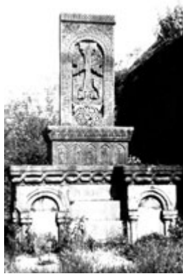
Рис. 24. Хачкар Тугеорды в Санане (1184 г.).