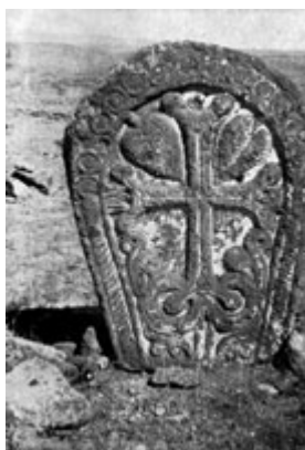
Рис. 14. Хачкар в с. Неркин Талин (IX в.).