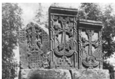
Рис. 28. Хачкар в Кечарисе (XII-XIII вв.).