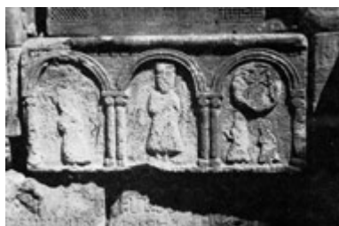
Рис. 37. Хачкар в Мшкванке (фрагмент).