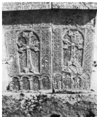
Рис. 85. Хачкар 1558 г. в Камо (правый).