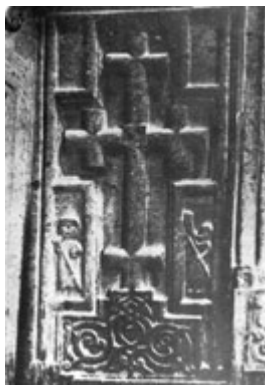
Рис. 63. Хачкар в Гегарде (в притворе церкви) XIII в.