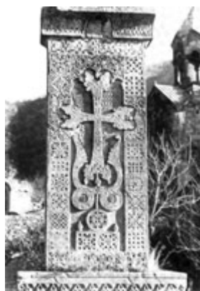
Рис. 32. Хачкар в Ахпате, 1211 г.