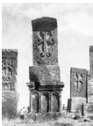
Рис. 29. Хачкар в Норадуже, 1203 г.