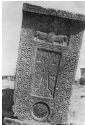
Рис. 86. Хачкар в г. Камо (XV-XVI вв.).