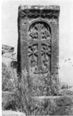
Рис. 82. Хачкар в Камо (XV-XVI вв.).