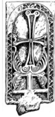
Рис. 4. Хачкар 952 г. в Ани.