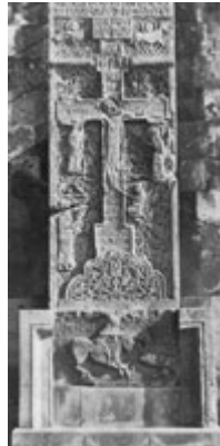
Рис. 60. Хачкар из Джингула, 1279 г. (ныне в Эчмиадзине).