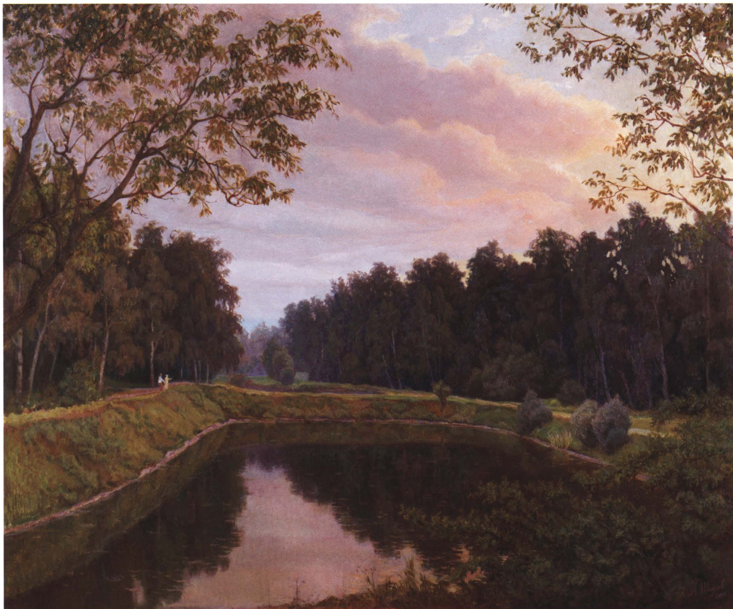
Сокольники. 2004 Холст, масло. 100 x 120

спокоен и негромок. — Драматургия эта связана либо с личным конфликтом и болью, либо с социальным непониманием. Тогда восплаляется НЕРВ острого восприятия жизни. Вот на этом нерве существует творчество ярких личностей. Размеренная и гармоничная жизнь дает постные результаты. Я также выплескивался в каждой картине, оставляя в ней себя. Так было с картиной Осень . Я написал ее за четыре дня. Люди перед ней стояли и плакали. Это тяжело, порой больно, но не писать я не могу. И писать