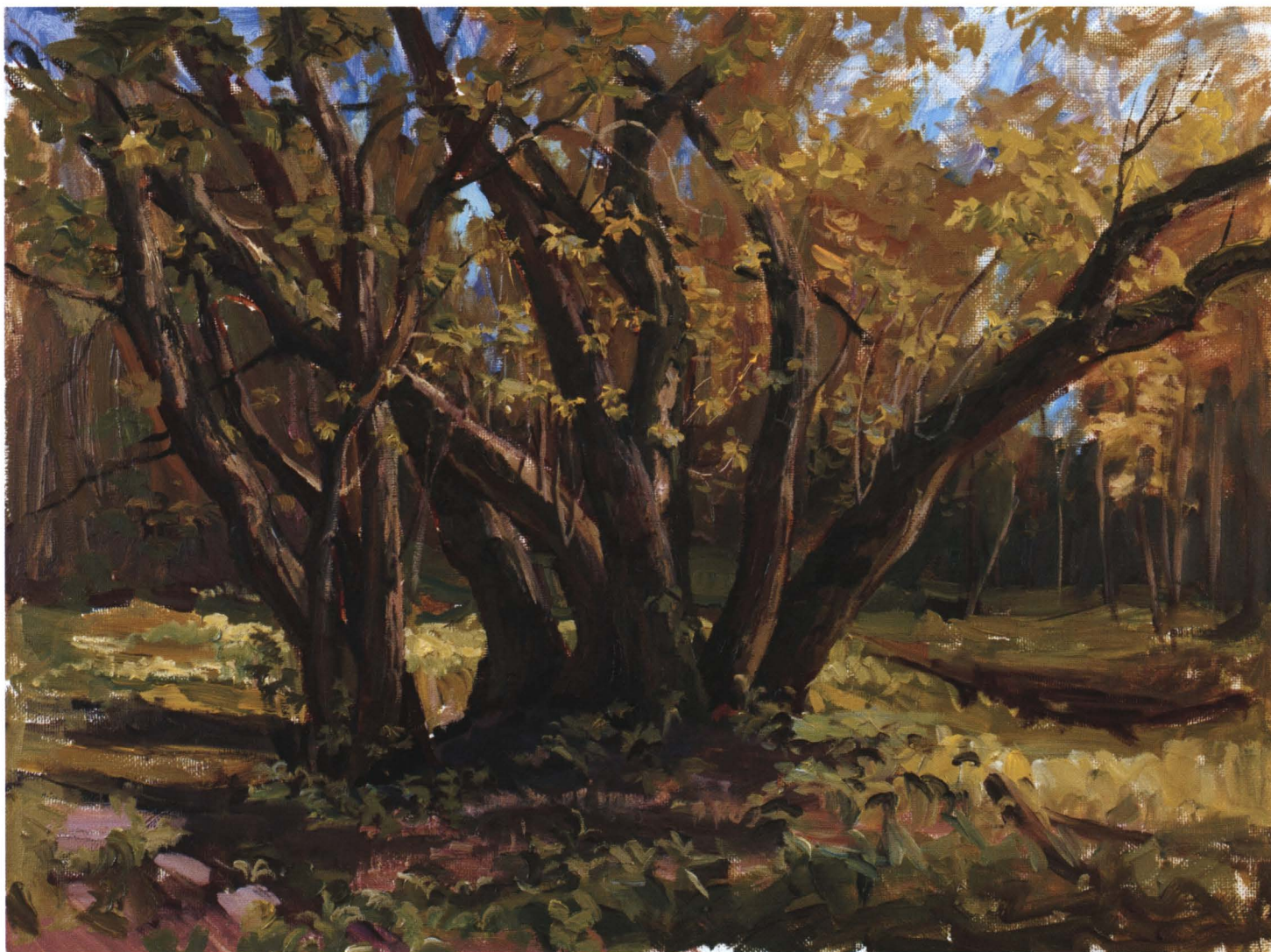
Цветущее дерево. 2008 Холст, масло. 50 x 60