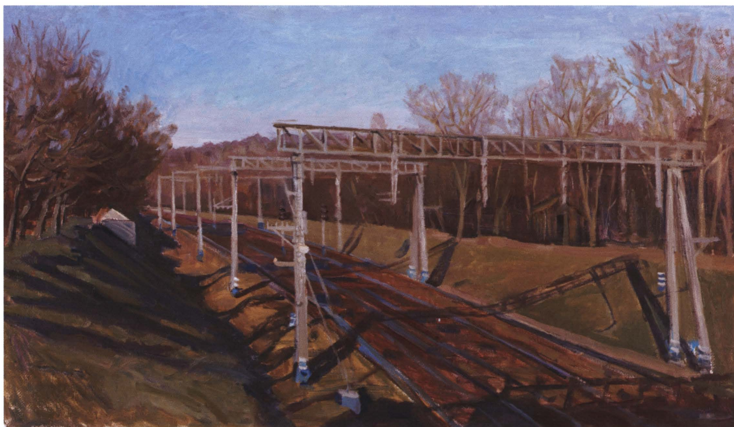
«В добрый путь!» 2008 Холст, масло. 40 x 70

честве вектора движения высочайший уровень российской художественной школы. Символична одна из заключающих альбом картин – На высоте . Свою высоту, свои прозрения и философские обобщения в живописи он каждодневно подтверждает яркостью таланта, безусловной порядочностью, умением разговаривать с людьми на правдивом языке природы. Редкий сплав во все времена.