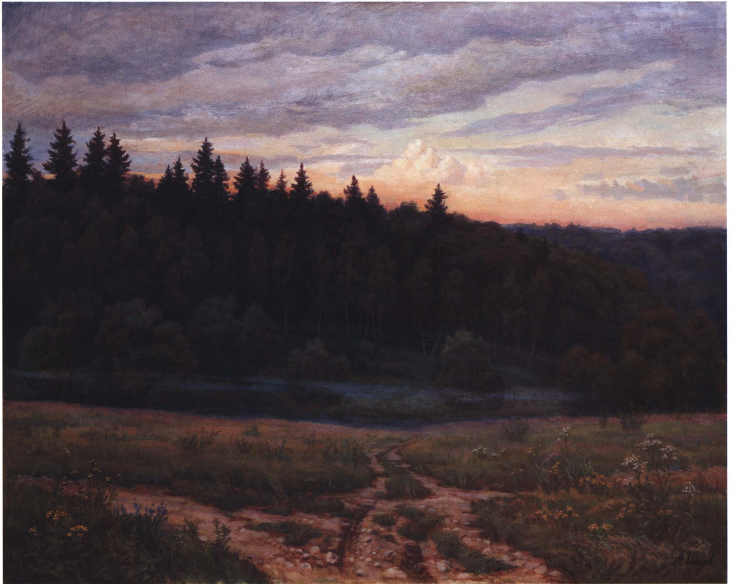
Три дороги. 2003 Холст, масло. 80 x 100