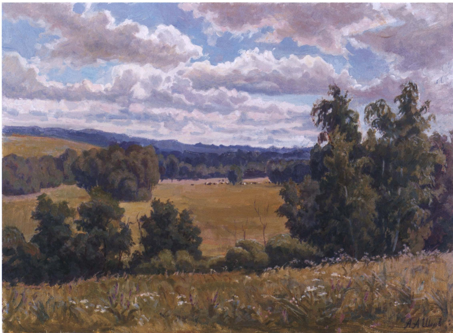
Русские просторы. 2006 Холст, масло. 50 x 70