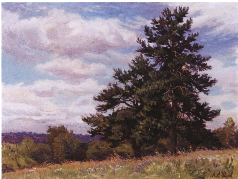
На высоте. Этюд. 2007 Холст, масло. 30 x 40