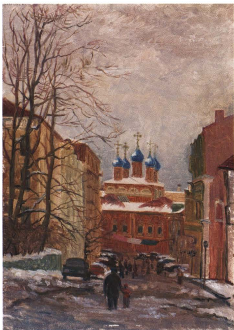
Храм в Петровском переулке. 1997 Картон, масло. 30 x 24

года и являющие многообразие жизни. Таковы вариации Трех ив , сокольнических аллей и прудов, подмосковных рек с их неброскими берегами и мягкими изгибами, очарования сумерек.