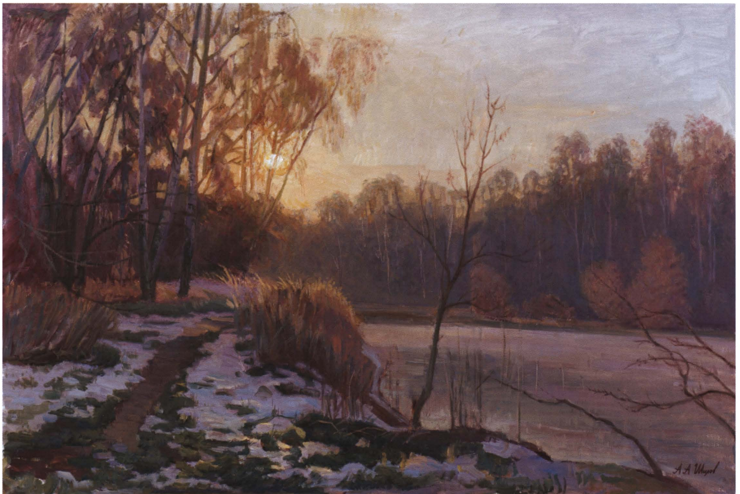
«Здравствуй, зима!» 2005 Холст, масло. 60 x 90

Первый из них – «эстет, балагур, шутник», по определению Шилова, – был учеником Саврасова, сохранившим на долгие годы наставление педагога: «Ступайте писать, пишите этюды, изучайте, главное – чувствуйте...» Саврасов развил у Коровина любовь к пейзажу, помог в передаче на холст легкого неба и мягких световых гамм. Портрет курсистки , написанный раньше серовской Девочки