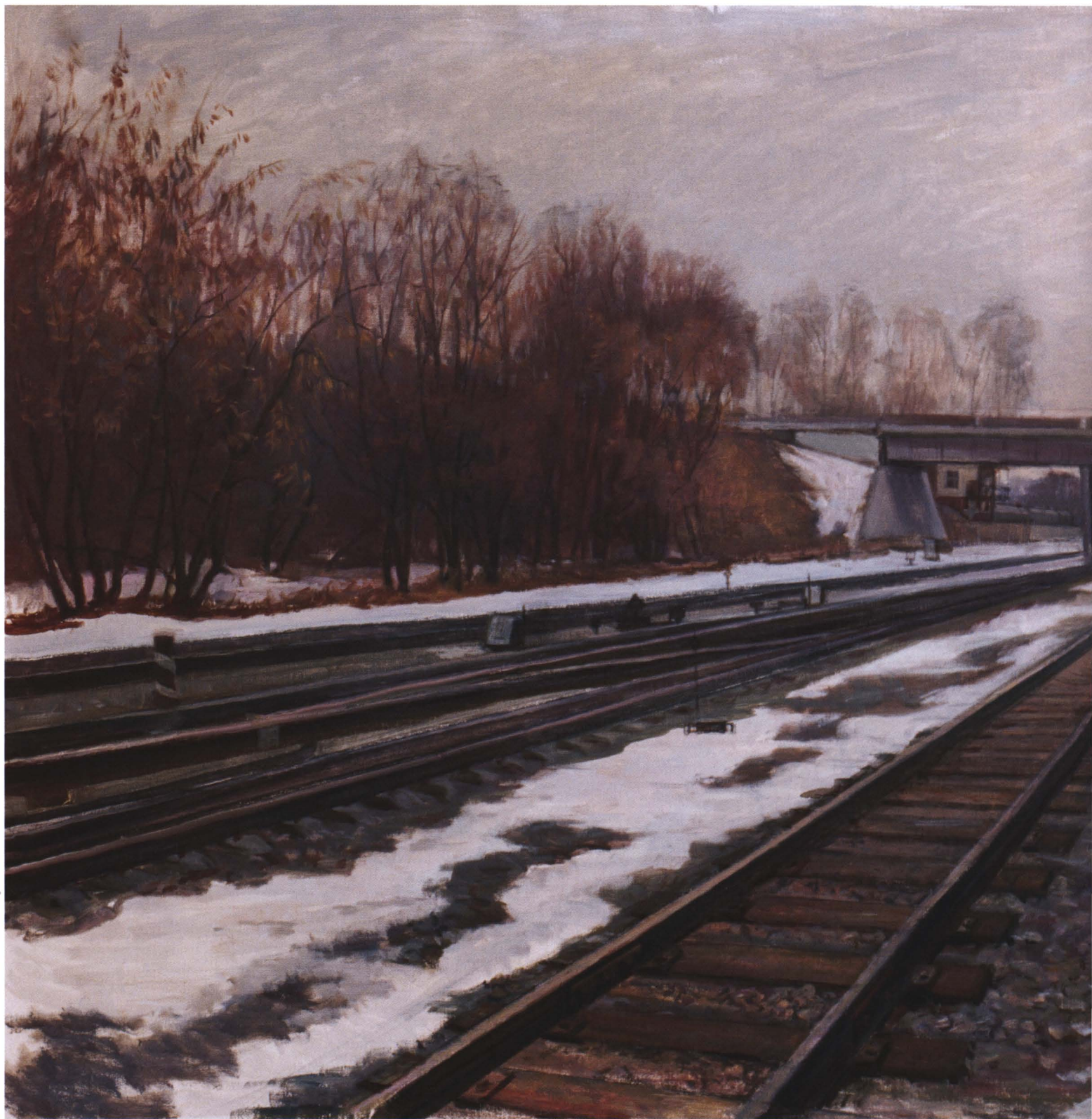
Дороги ностальгии. 2008 Холст, масло. 60 x 120