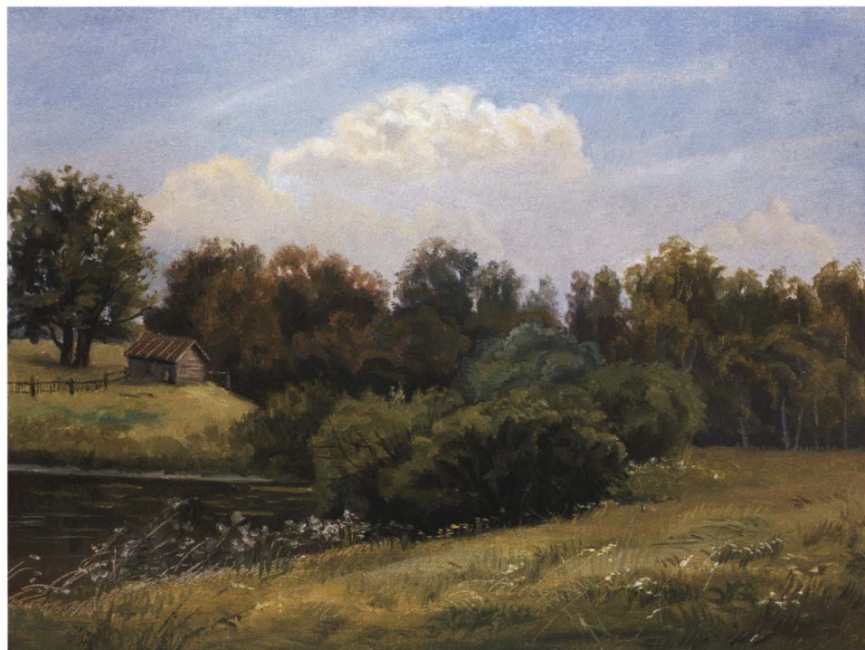
◀ Березы. Этюд. 1998 Картон, масло. 50 x 35

Постепенно подводя читателя к разговору о работах Шилова, остановимся все же еще на двух