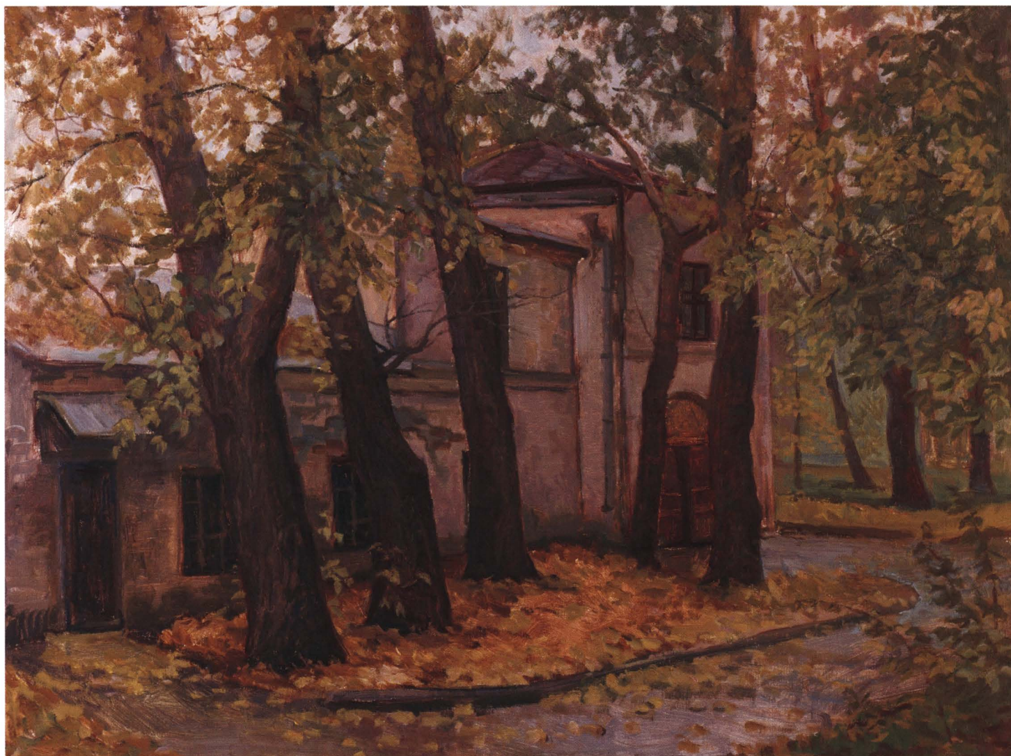
Домик Левитана в Москве. 2005 Холст, масло. 80 x 100