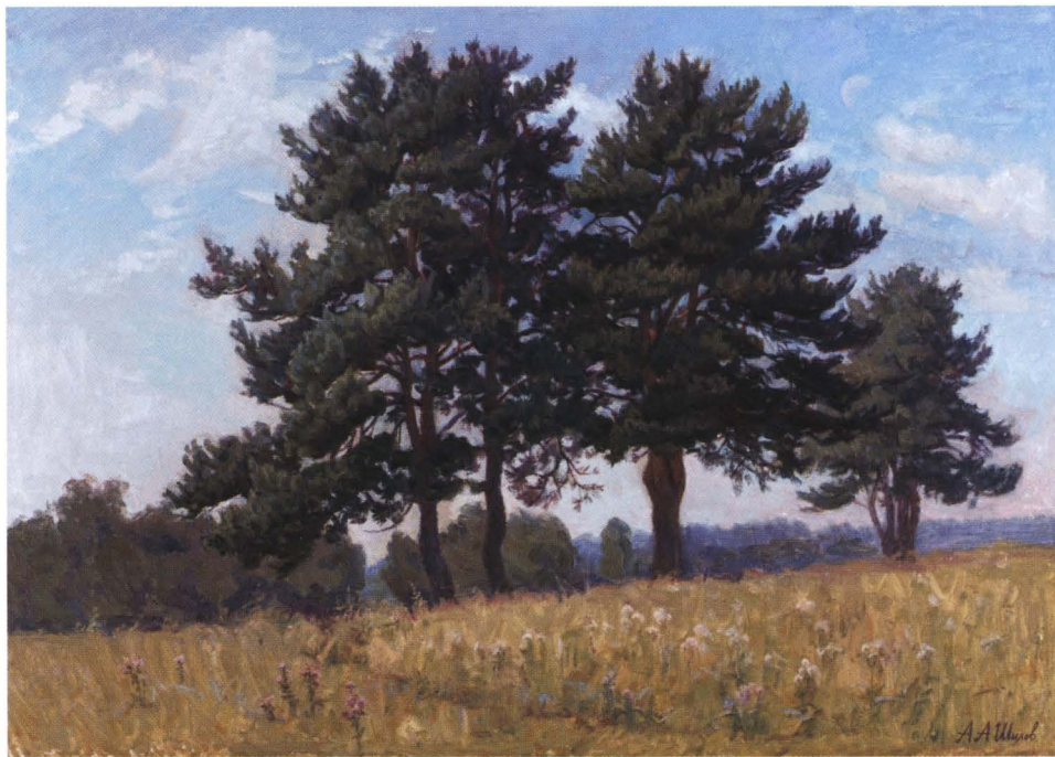
◀ Нескучный сад. 2003 Холст, масло. 105 x 70