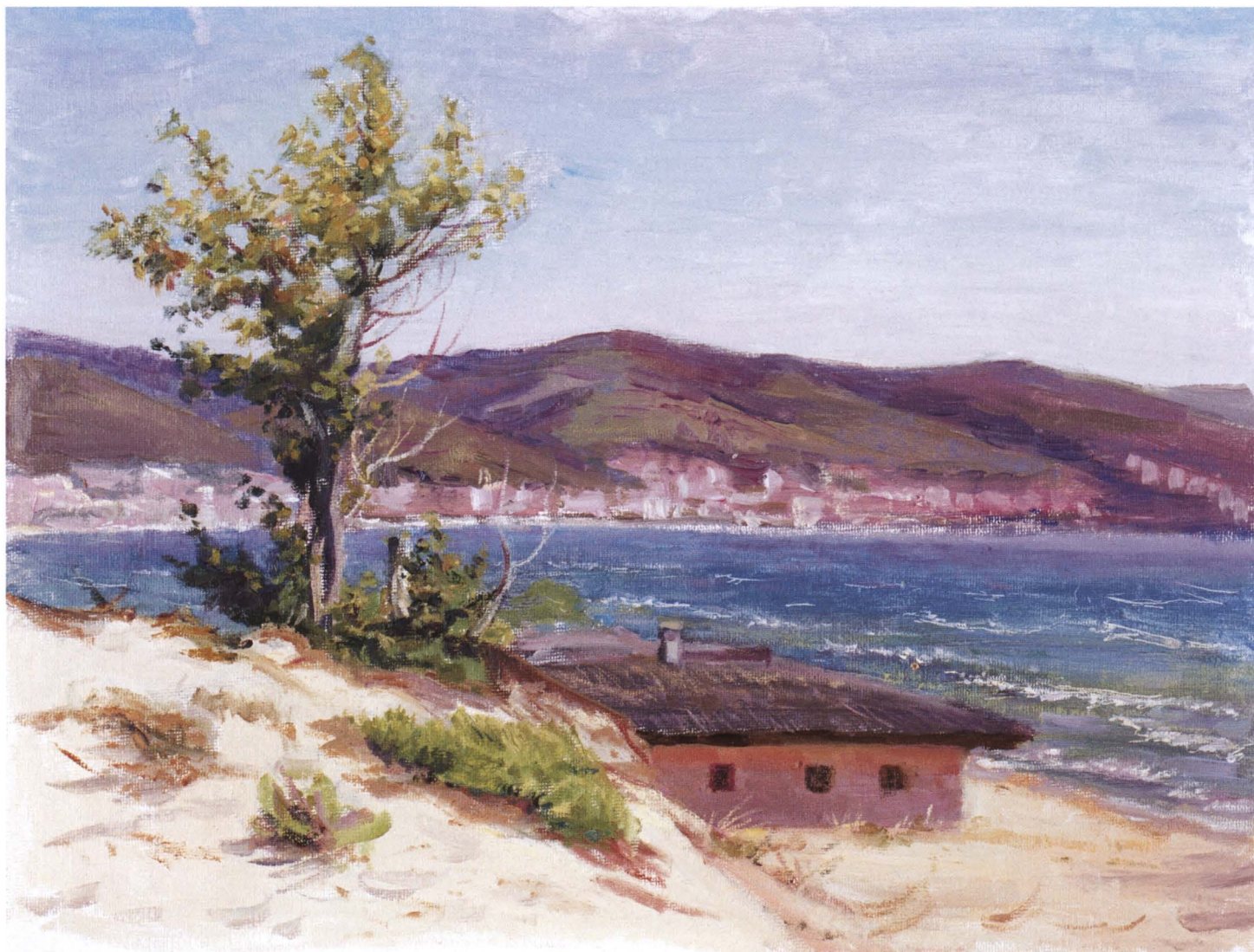
Солнечный берег. Этюд. 2007 Холст, масло. 30 x 40

было скучно. И эта людская глухота больно ранила его.