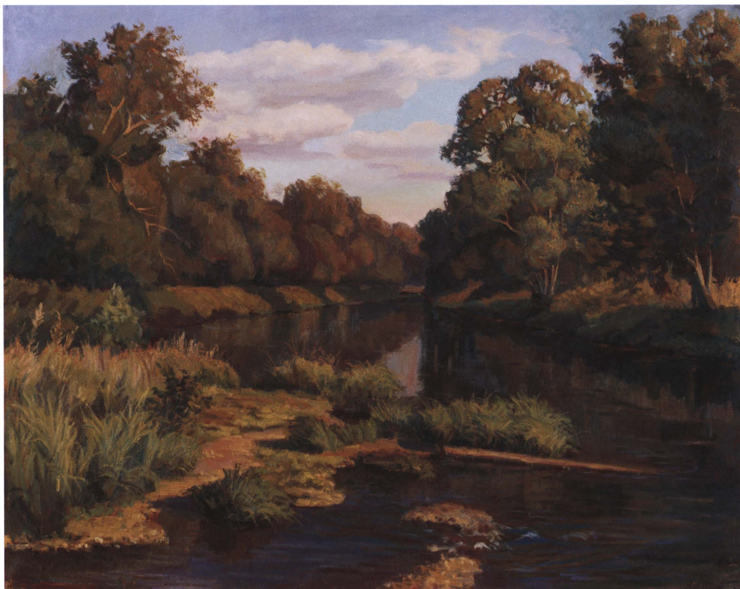
Подмосковная речка. 2005 Холст, масло. 80 x 100