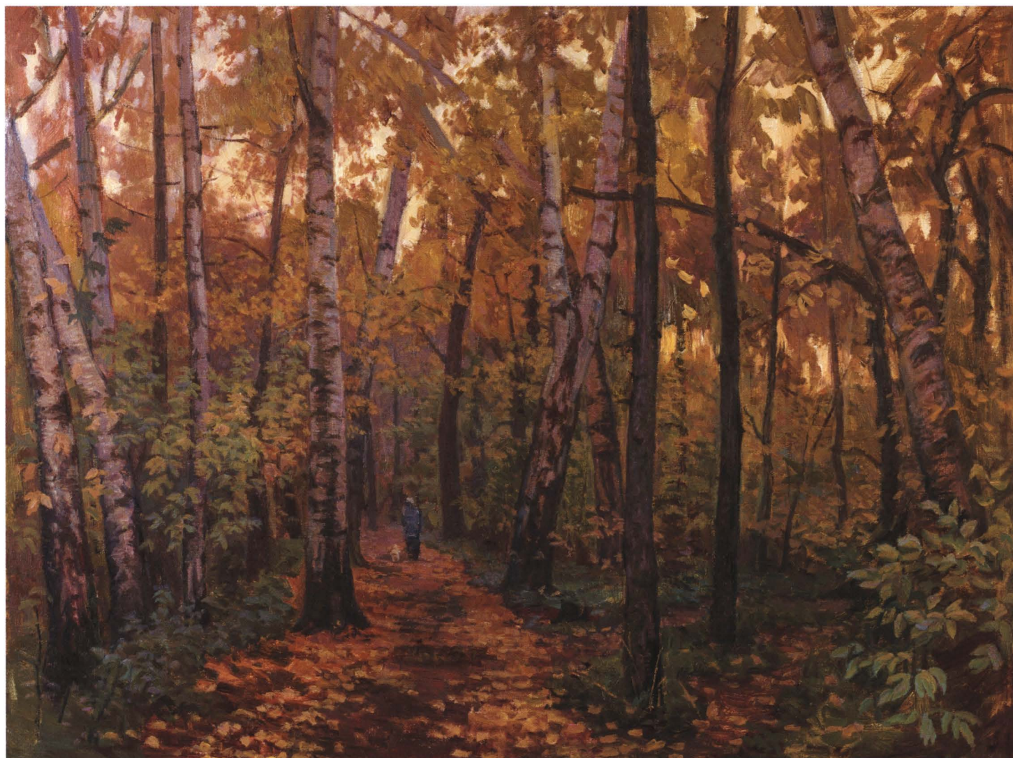
Листопад. 2005 Холст, масло. 60 x 80