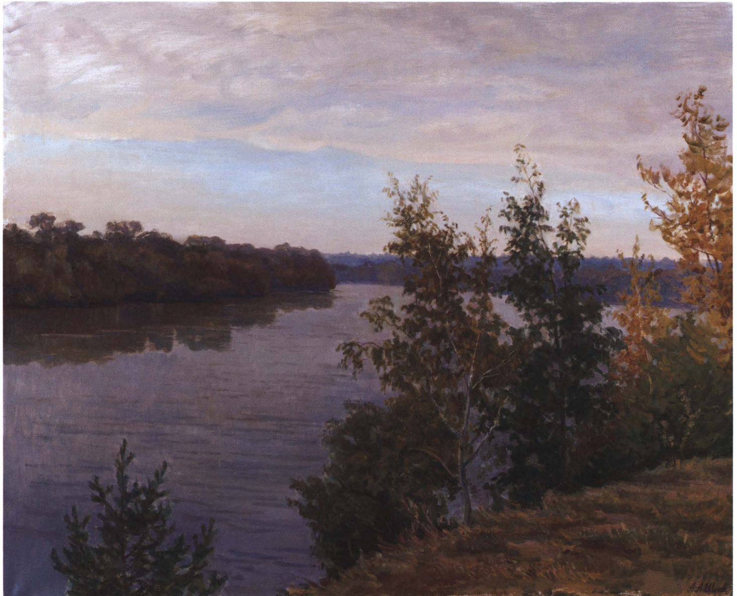
Москва-река. 2005 Холст, масло. 80 x 100