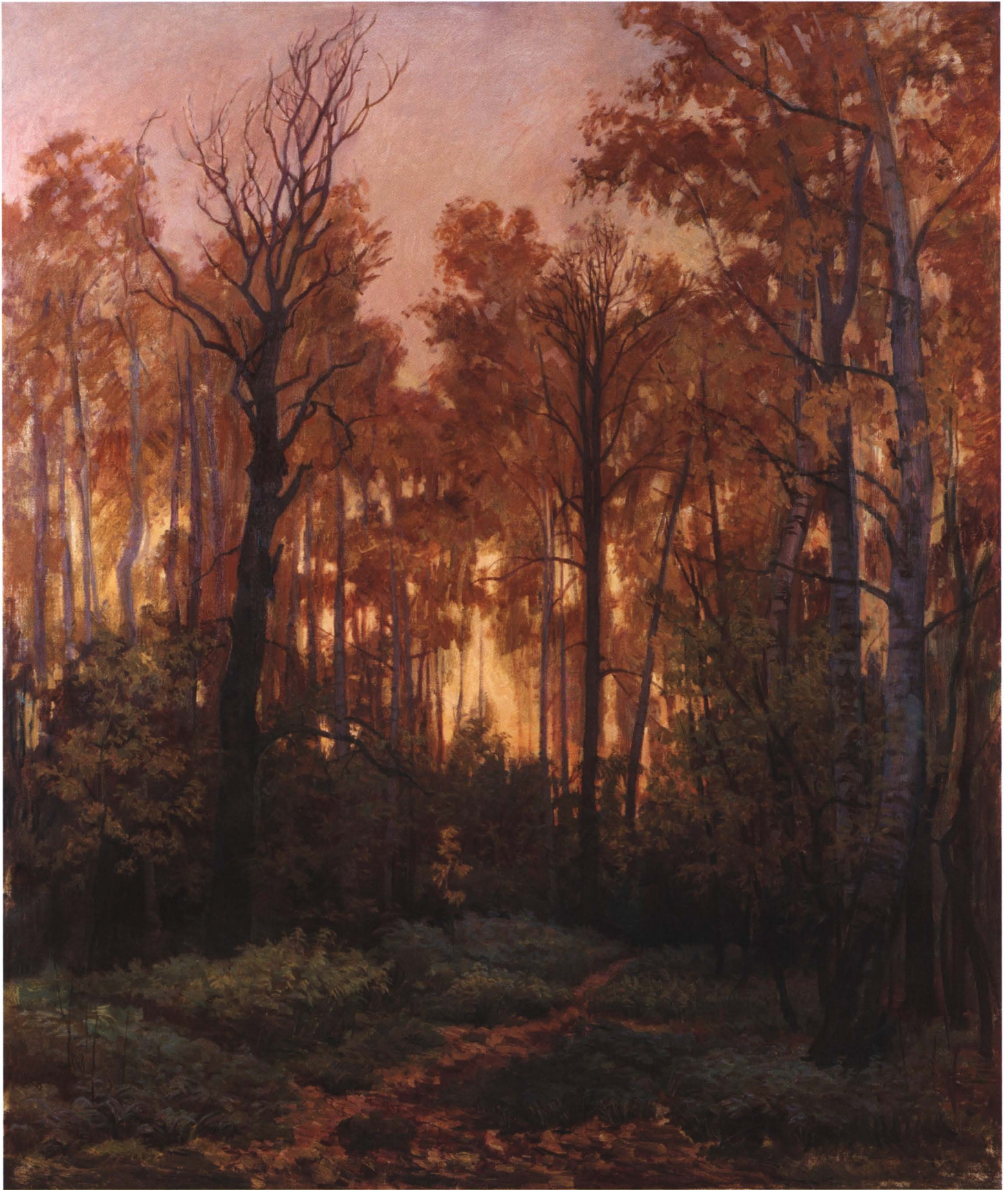
Осень 2005 Холст, масло. 120 x 100