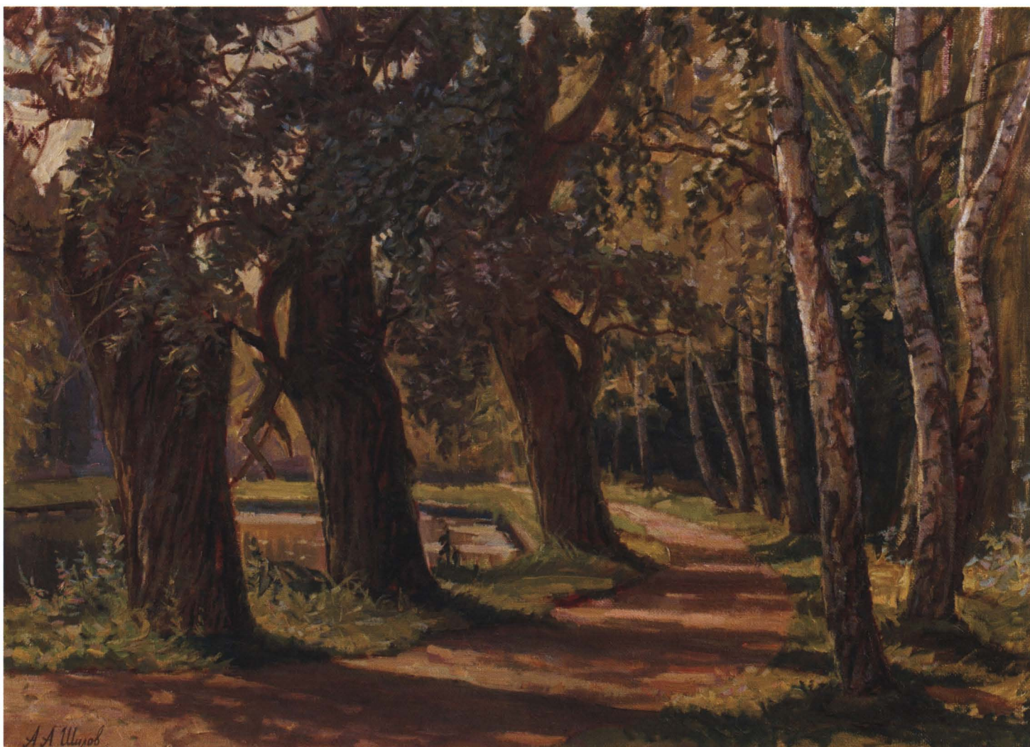
Солнечная аллея. 2006 Холст, масло. 50 x 70