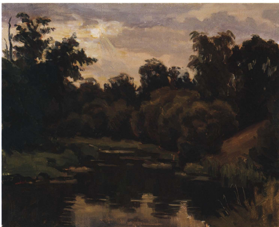
К вечеру. Эпюд. 2007 Холст, масло. 24 x 30

умение отбирать и фиксировать на бумаге главные события дня.