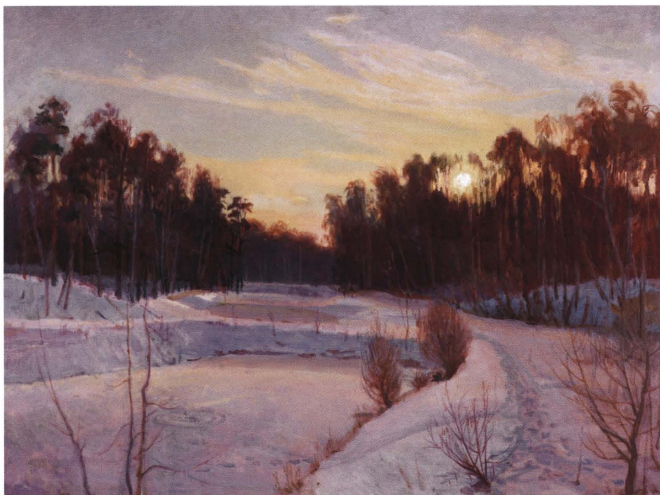
Зимний вечер. 2005 Холст, масло. 60 x 80

Все работы, собранные в этом альбоме, расположены хаотично. Четыре времени года, как четыре стороны света, поделившие между собой объем издания, казалось бы, должны продиктовать художнику строгую композиционную последовательность. Но он произвольно перемешал их. И все же в этой хаотичности есть определенная закольцованность, намеренные повторы одного и того же сюжета, соотношенные с разными временами