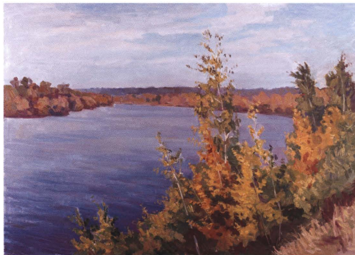
Звучание осени. 2005 Холст, масло. 70 x 100