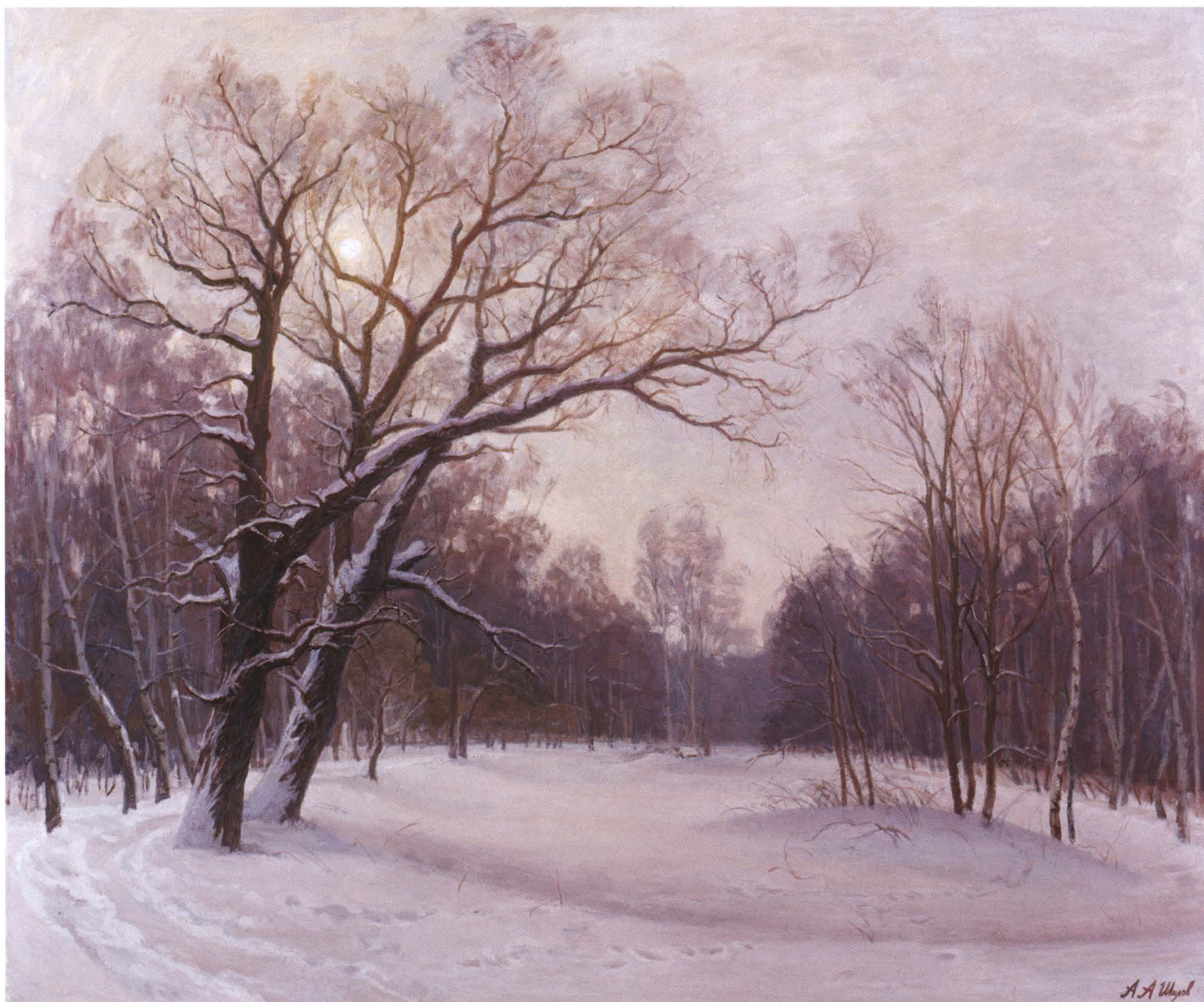
Зимний свет. 2005 Холст, масло. 100 x 120

с персиками, принес Коровину первый серьезный успех. Жизнелюбие художника и радость творца счастливо соединялись в его полотнах. «Его манили все краски мира», – писал о нем Константин Федорович Юон (1875–1958).