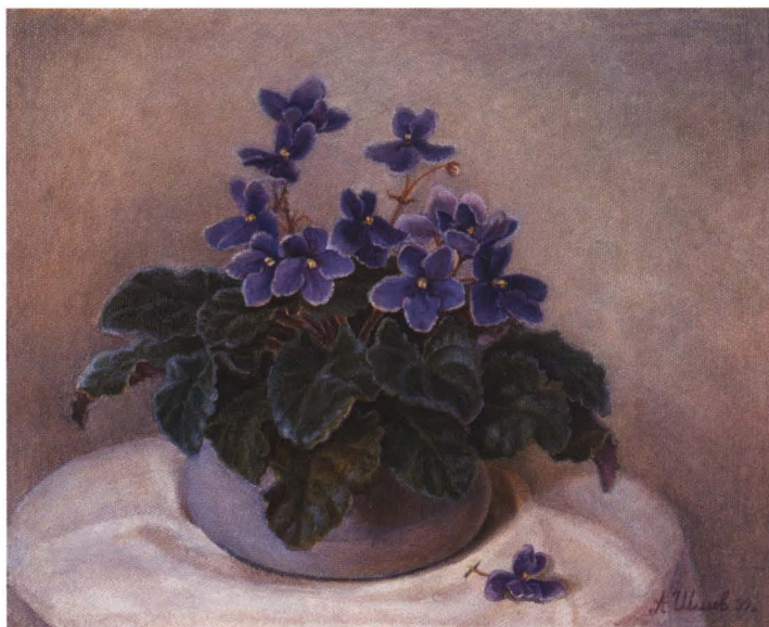
Фиалки. 1999 Холст, масло. 18 x 24

Знаменательно, что именно его пейзажи первыми в русской живописи побывали в космосе – на борту международной космической станции. Не потому ли, что они обладают удивительной силой внушения любви – к людям, к деревьям, к рекам. К каждой малой травинке. А значит, к нашему общему дому – планете Земля.