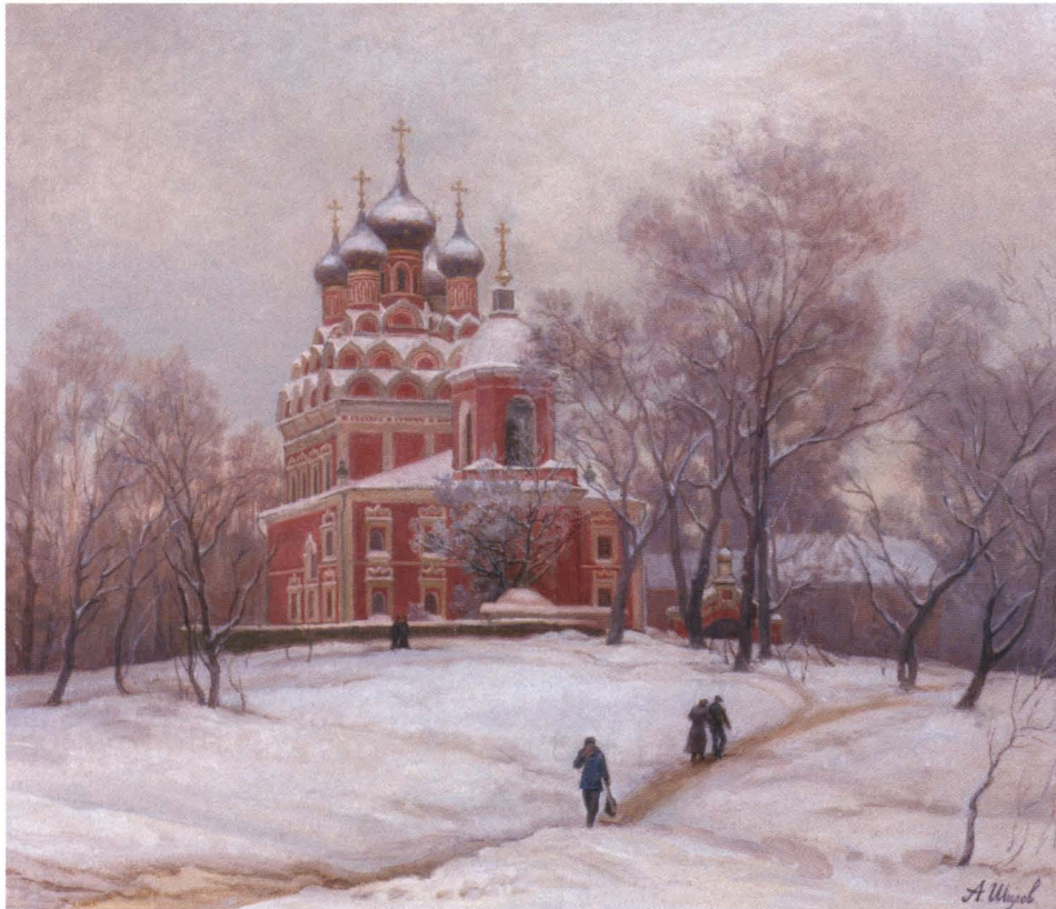
Храм Тихвинской Божьей Матери. 2004 Холст, масло. 50 x 60