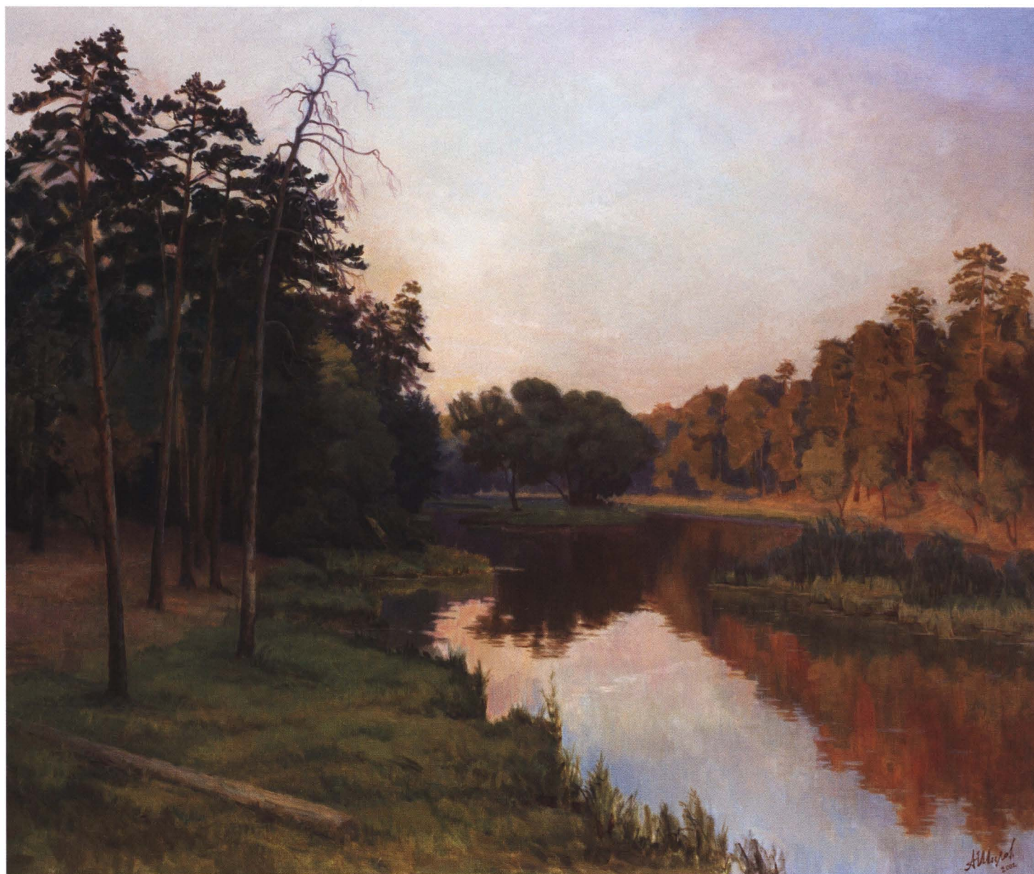
Тихий вечер. Кратово. 2002 Холст, масло. 100 x 120