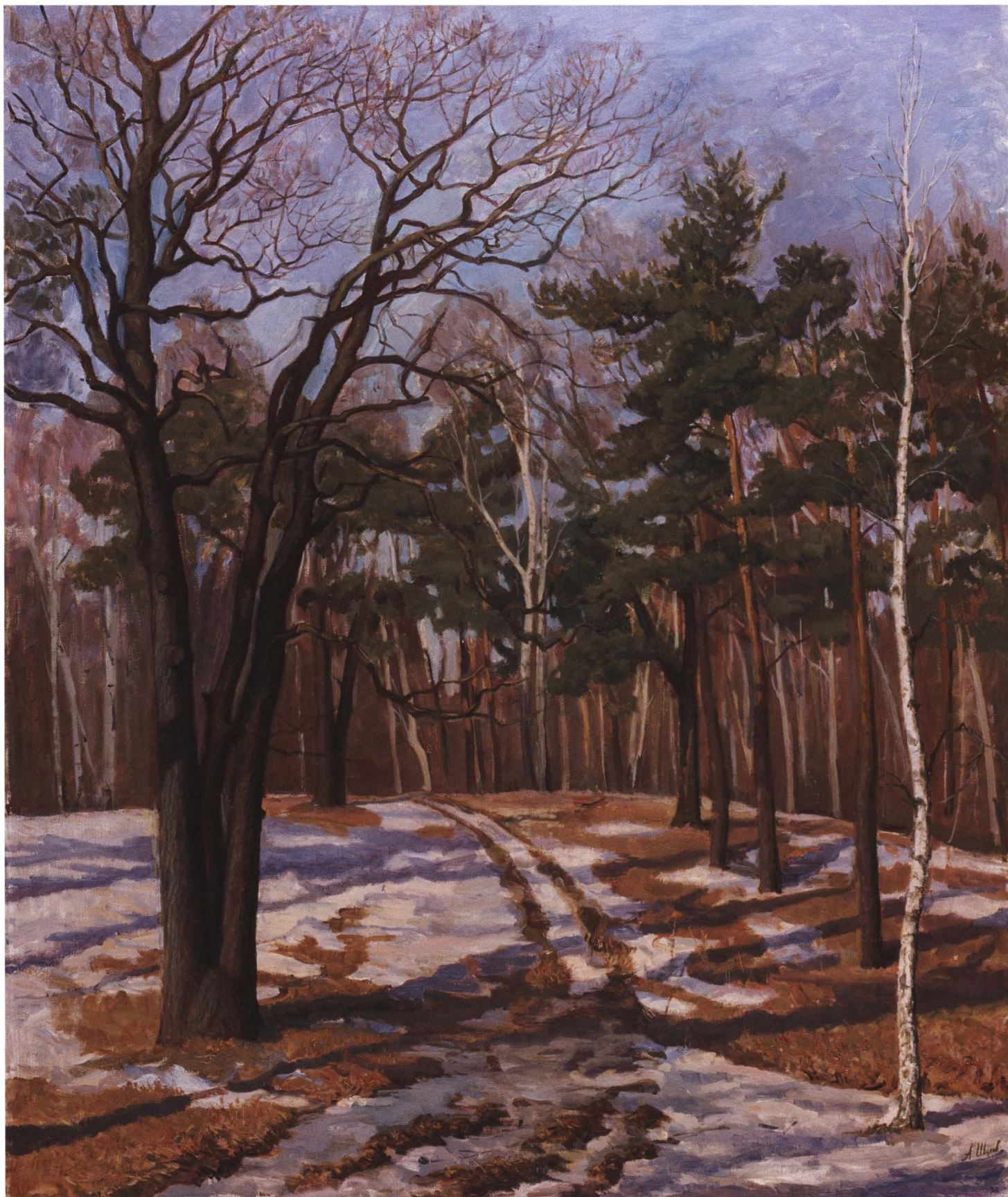
Весенний свет. 2005 Холст, масло. 120 x 100