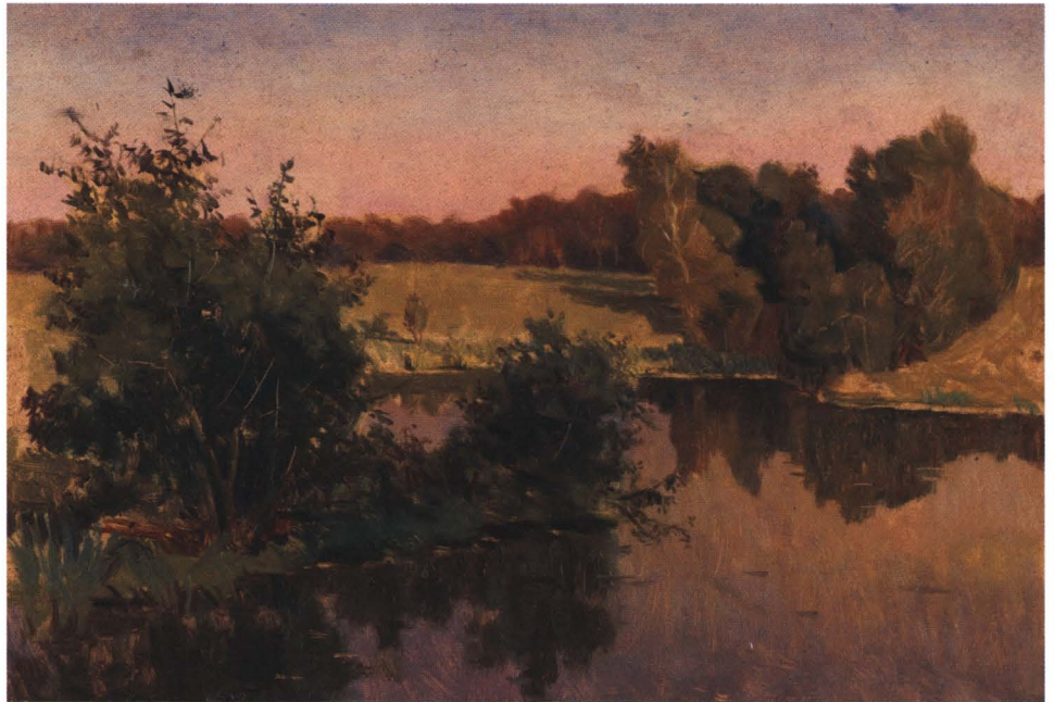
◀ Зимняя мелодия (Оттепель). 2008 Холст, масло. 100 x 80