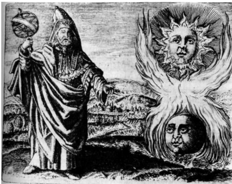
Гермес Трисмегист. Алхимическая сера и ртуть. (Гравюра из Symbola Aureae Mensae . 1617 г.)

канализации) смогло помочь ему, благодаря технической шноровке, извлечь пользу из ужасного положения.