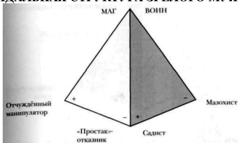
ПИРАМИДАЛЬНАЯ СТРУКТУРА НЕЗРЕЛОГО МУЖСКОГО «Я»