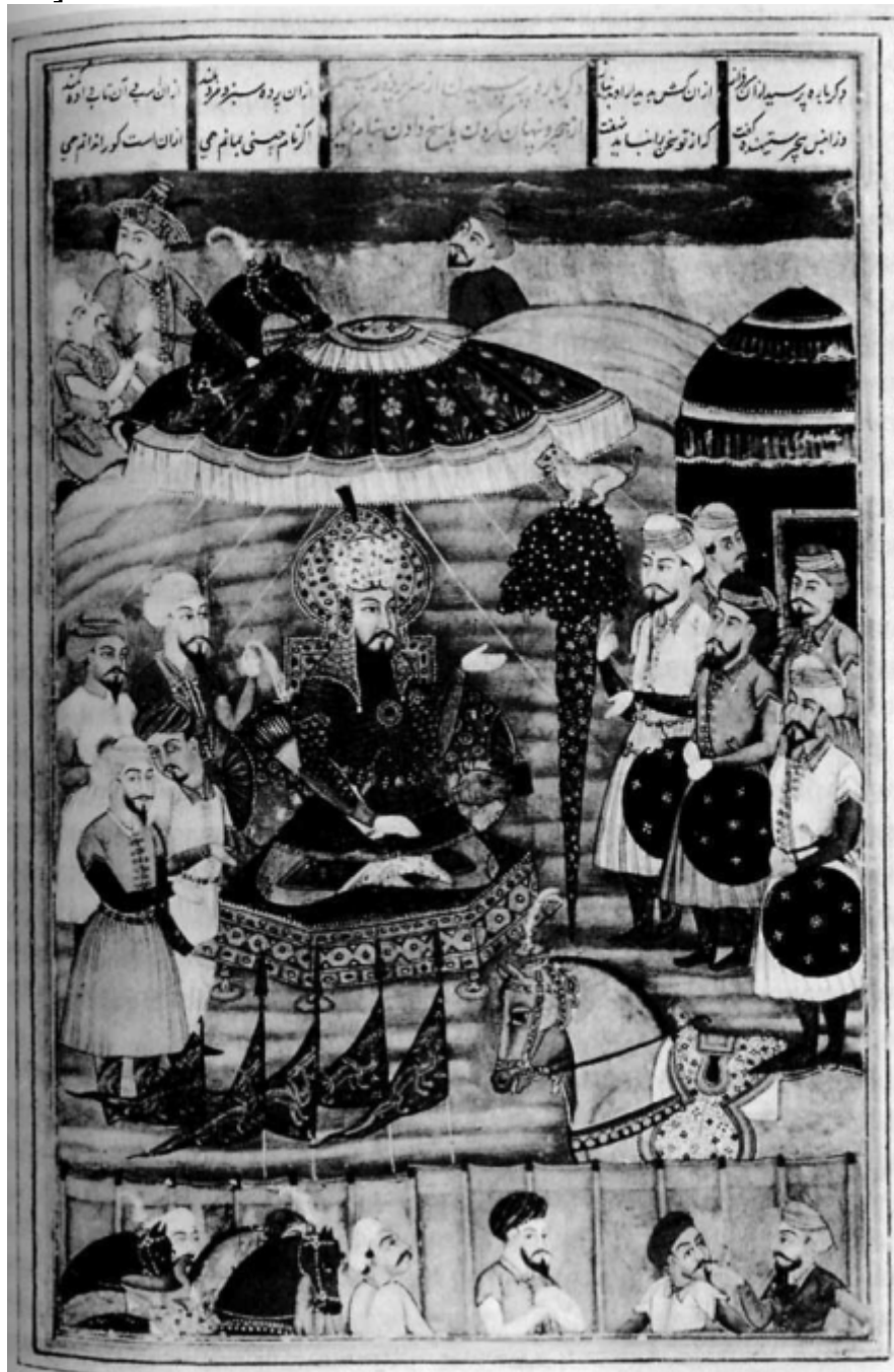
Шахнаме (Из индийской иллюстрированной рукописи семнадцатого века. Музей Конде Шантийи Франция)

станет известно на веки вечные. Склоняющиеся к злу и замысливающие мятеж подчинили свои речи страху, исходящему от него. Азиаты падут от его меча, и ливийцы падут от его пламени... Построена будет Стена Правите-... .. прийти в Египет... И придёт на его место справедливость, а несправедность будет изгнана. Возрадуйтесь те, кто может лицезреть [это] !» 3