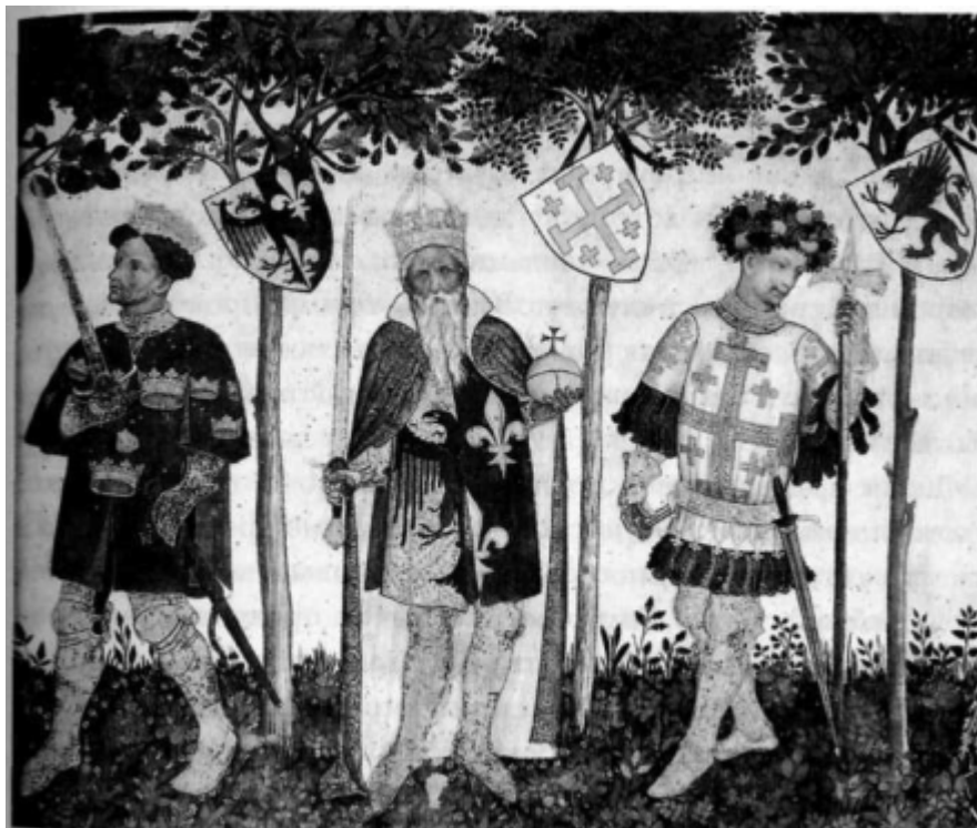
Жак Иверни. Король Артур, Карл Великий, и Годфруа де Буйон, фреска, деталь. 1411-16 гг. Пьемонт, замок Ла Манга.

действительно чувствуют, что они в центре Вселенной (хотя сами в себе не сосредоточены) и что окружающие должны обслуживать их. Вместо того чтобы другие отражались в них, они с жадностью стремятся сами отражаться в других. Они желают быть видимыми, а не видеть сами.