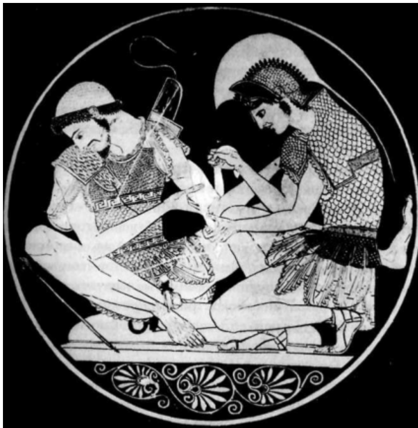
Ахилл и Патрокл (Внутренний медальон на чаше с изображением греческого художника Сосия, ок. 500 г. до н.э.)

самоконтролем хищного зверя, нападает только на врага и обладает совершенным мастерством в своём деле. Это другая сторона Воина - его интерес к приёмам, мастерству в овладении техникой, позволяющей достигнуть цели. Он развил умение с помощью «орудий», используемых для реализации его решений.