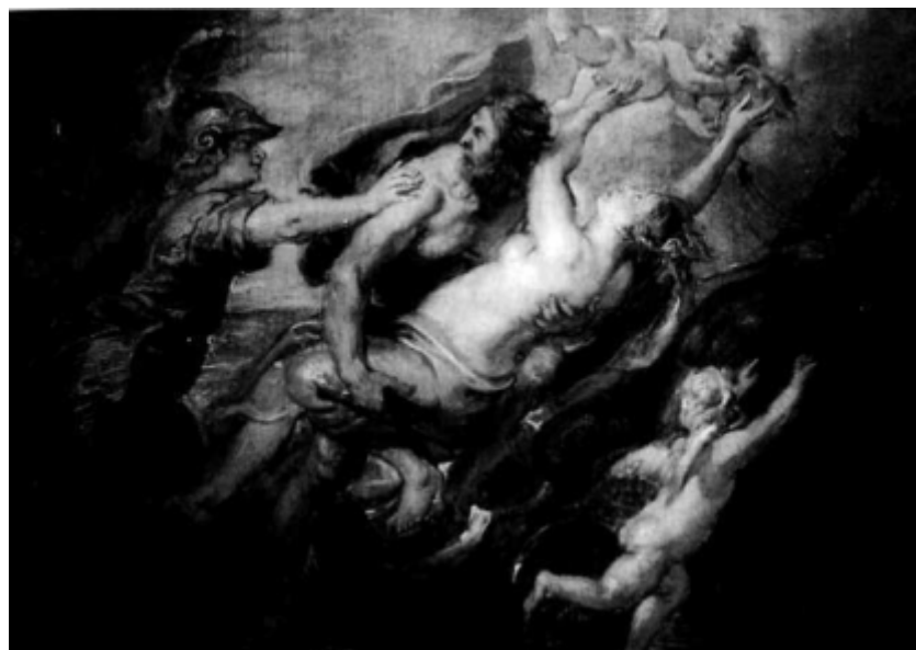
Петер Пауль Рубенс. «Похищение Прозерпины». 1636-1638

Хотя каждый из нас может легко поддаться архетипу Воина-Садиста в тот или иной момент, существует особый тип личности, имеющей эту энергию, как говорится, «в избытке». Это случай компульсивного расстройства личности. Компульсивные личности - трудоголики, вечно не дающие себе ни отдыха, ни сроку. У них колоссальная способность переносить боль, им часто удаётся делать огромное количество работы. Но руководит их неутомимым двигателем чувство глубинной тревоги, отчаяния Героя. Они очень слабо разбираются в чувстве собственной целесообразности. Они не знают, чего хотят на самом деле, чего им не хватает и что им нужно. Они проживают жизнь, «атакуя» всё и вся - свою работу, стоящие перед ними жизненные задачи, самих себя и окружающих. При этом Воин-Садист «съедает» их заживо, и они «выгорают».