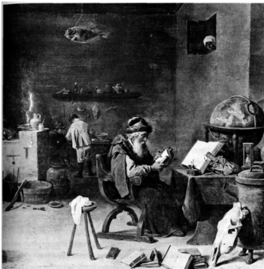
Алхимик. В поисках «философского камня» и «эликсира жизни».

жизни мужчина, одержимый «Простаком», ещё и боится, что люди уличат его в недостатке жизненной энергии и сбросят его с весьма шаткого пьедестала. Его отчуждённость и «впечатляющее поведение», разоблачающие комментарии, враждебность к вопросам, даже накопленный им опыт - всё это направлено на прикрытие его истинного внутреннего одиночества, безжизненности и легкомыслия в глазах окружающего мира.