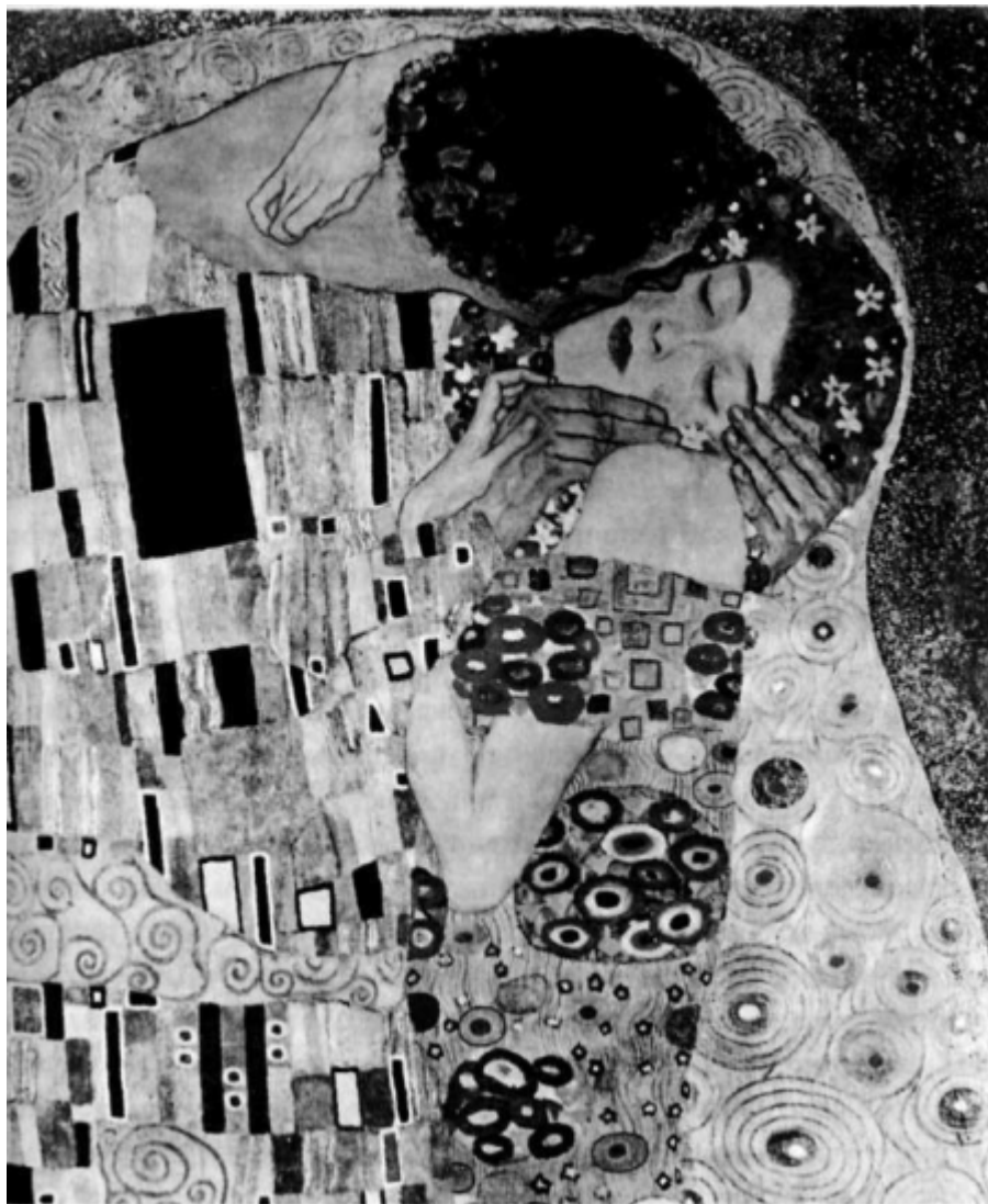
Густав Климт. «Поцелуй». Фрагмент. 1907

жизни, противостоящей условностям, видна реализация старинного конфликта между чувственностью и моралью, между любовью и долгом, или, по поэтичному сравнению Джозефа Кэмпбелла, между «amor» и «Roma» - где «amor» означает пассионарный опыт, а «Roma» - долг и ответственность перед законом и порядком.