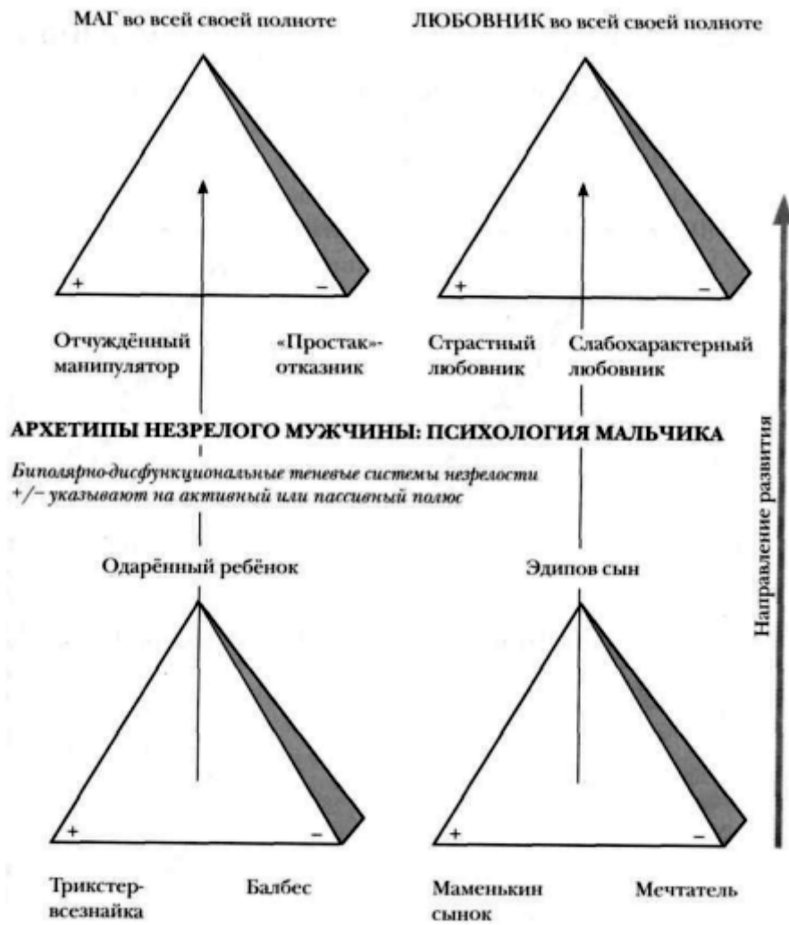
Рисунок 2 ПИРАМИДАЛЬНАЯ СТРУКТУРА ЗРЕЛОГО МУЖСКОГО «Я»