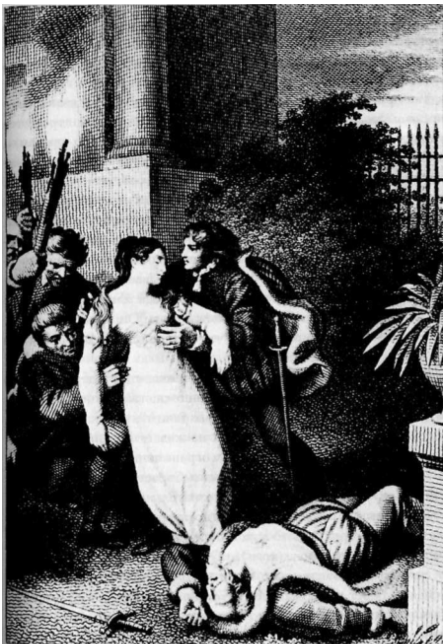
Дон Жуан

Неугомонность мужчины во власти Пристрастившегося - отражение его поисков выхода из паутины. Мужчина, одержимый паутиной майя, трепыхается в лихорадочной борьбе за выход из этого мира. «Остановите Землю! Я хочу выйти!» Но вместо того чтобы найти единственный правильный выход из ситуации, он борется и усугубляет свои неприятности. Он мечется в трясине, и его засасывает всё глубже и глубже.