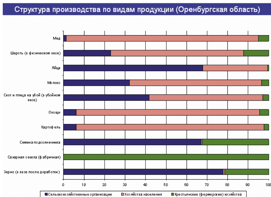
Рис. 2 – Структура производства сельскохозяйственной продукции по формам хозяйств, 2010 г., %

В структуре производства сельскохозяйственной продукции КФХ Оренбургской области занимают 100% доли в производстве сахарной свёклы, 23% – в производстве зерна, более 30% – семян подсолнечника и 12% – в производстве шерсти (рис. 2).